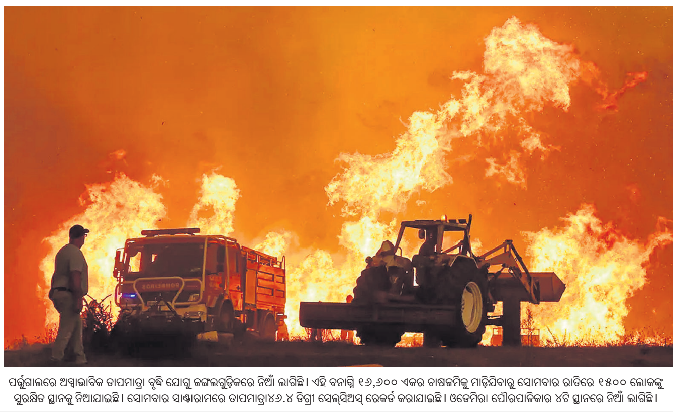
ପର୍ତ୍ତୁଗାଲରେ ଅସାଧାରଣ ତାପମାତ୍ରା ବୃଦ୍ଧି ଯୋଗୁ ଜଙ୍ଗଲଗୁଡ଼ିକରେ ନିଆଁ ଲାଗିଛି। ଏହି ବନାଗ୍ନି ୧୬,୬୦୦ ଏକର ଚାଷକ୍ଷେତ୍ରକୁ ମାଡ଼ିଥିବାରୁ ସୋମବାର ରାତିରେ ୧୫୦୦ ଲୋକଙ୍କୁ ସୁରକ୍ଷିତ ସ୍ଥାନକୁ ନିଆଯାଇଛି। ସୋମବାର ସାନ୍ଧ୍ୟାରେ ତାପମାତ୍ରା ୪୬.୪ ଡିଗ୍ରୀ ସେଲ୍ସିଅସ୍ ରେକର୍ଡ କରାଯାଇଛି। ଓଡ଼ିଶାରେ ଯୌରପାଲିକାର ୪ଟି ସ୍ଥାନରେ ନିଆଁ ଲାଗିଛି।

ଯୁକ୍ତେନ୍ଦ୍ରରେ ରୁଷିଆର କ୍ଷେପଣାସ୍ତ୍ର ମାଡ଼: ୭ ନିହତ କିଲ୍, ୮୮: ଯୁକ୍ତେନ୍ଦ୍ର ପୂର୍ବଭାଗରେ ଥିବା ପୋକ୍ରୋଭସ୍କ ସହରରେ ରୁଷିଆର କ୍ଷେପଣାସ୍ତ୍ର ମାଡ଼ ଯୋଗୁ ୭ ଜଣଙ୍କ ମୃତ୍ୟୁ ଘଟିବା ସହ ୮୧ ଜଣ ଆହତ ହୋଇଛନ୍ତି। ଗୋଟିଏ କ୍ଷେପଣାସ୍ତ୍ର ଏକ ଆପାର୍ଟମେଣ୍ଟରେ ମାଡ଼ ହୋଇଥିବାବେଳେ ଅନ୍ୟଟି ଏକ ବିଲ୍ଡିଂରେ ପଡ଼ିଥିଲା। କ୍ରେମଲିନ୍ ସୈନ୍ୟମାନେ ଉଦ୍ଧାରକାରୀମାନଙ୍କୁ ଚାରେଟ କରୁଥିବା ଯୁକ୍ତେନ୍ଦ୍ର ଅଭିଯୋଗ କରିଛି। ମୃତକଙ୍କ ମଧ୍ୟରେ ୫ ସାଧାରଣ ନାଗରିକ, ଜଣେ ଉଦ୍ଧାରକାରୀ ଏବଂ ଜଣେ ସୈନ୍ୟ ଅଛନ୍ତି। ସେହିପରି ଆହତଙ୍କ ମଧ୍ୟରେ ୨ ପିଲାଙ୍କ ସମେତ ୩୧ ସାଧାରଣ ନାଗରିକ ଥିବାବେଳେ ୩୧ ପୋଲିସ୍ ଅଧିକାରୀ, ୭ କରୁଡ଼ା ସେବା ପ୍ରଦାନକାରୀ କର୍ମଚାରୀ ଓ ୪ ସୈନ୍ୟ ରହିଛନ୍ତି। ୪୦ ମିନିଟ୍ ବ୍ୟବଧାନରେ ଭୁଲ୍ଡି ଇଆଣ୍ଡର ମିସାଇଲ ଛଡ଼ାଯାଇଥିଲା।