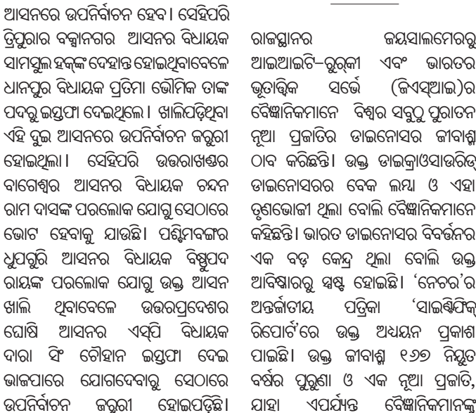
ଜୟସାଲମେରେ ଥିଲେ ତୃଣଭୋଜୀ ତାଇନୋସର

ରାଜସ୍ଥାନର ଜୟସାଲମେରେ ଆଇଆଇଟି-ରୁକ୍ମା ଏବଂ ଭାରତର ଭୂତାତ୍ମିକ ସଭୈ (ଜିଏସ୍‌ଆଇ)ର ବୈଜ୍ଞାନିକମାନେ ବିଷ୍ଣୁର ସବୁଠାରୁ ନୂଆ ପ୍ରକାରି ତାଇନୋସର ଜୀବାଶ୍ମ ଠାଏ କରିଛନ୍ତି। ଉକ୍ତ ତାଇନୋସରର ତାଇନୋସରର ବେକ ଲମ୍ବା ଓ ଏହା ତୃଣଭୋଜୀ ଥିଲା ବୋଲି ବୈଜ୍ଞାନିକମାନେ କହିଛନ୍ତି। ଭାରତ ତାଇନୋସର ବିବର୍ତ୍ତନର ଏକ ବଡ଼ କେନ୍ଦ୍ର ଥିଲା ବୋଲି ଉକ୍ତ ଆବିଷ୍କାରକୁ ସ୍ୱୀକ୍ଷ ହୋଇଛି। 'ନେଚର' ଅବଲୋକନ ପତ୍ରିକା 'ସାଇଣ୍ଟିଫିକ୍ ରିପୋର୍ଟ'ରେ ଉକ୍ତ ଅଧ୍ୟୟନ ପ୍ରକାଶ ପାଇଛି। ଉକ୍ତ ଜୀବାଶ୍ମ ୧୬୬ ନିୟୁତ ବର୍ଷର ପୁରୁଣା। ଓ ଏକ ନୂଆ ପ୍ରକାରି, ଯାହା ଏପର୍ଯ୍ୟନ୍ତ ବୈଜ୍ଞାନିକମାନଙ୍କୁ