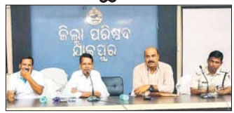
ଯାଜପୁର ଗଞ୍ଜନ, ଗାଁ (ପ୍ରସନ୍ନା ପ୍ରିୟଦର୍ଶିନୀ ମହାନ୍ତି):

ସେପ୍ଟେମ୍ବର ୧୯ତାରିଖ ଗଣେଶ ପୂଜା ନିମନ୍ତେ ମଙ୍ଗଳବାର ଯାଜପୁର ଜିଲ୍ଲା ଗ୍ରାମ୍ୟ ଉନ୍ନୟନ ସଂସ୍ଥା ସମ୍ମିଳନୀ କକ୍ଷରେ ଜିଲ୍ଲା ପ୍ରଶାସନ ଓ ପୋଲିସ୍ ପକ୍ଷରୁ ଏକ ପ୍ରସ୍ତୁତି ବୈଠକ ଅନୁଷ୍ଠିତ ହୋଇଯାଇଛି।