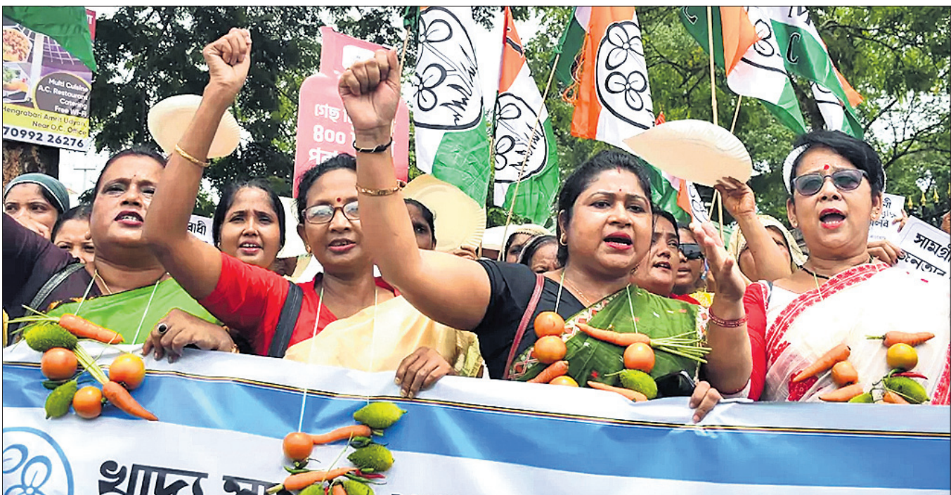
ଅତ୍ୟାଚାରୀୟ ଯାମଗ୍ରାମ ମୁଖ୍ୟମନ୍ତ୍ରୀଙ୍କୁ ବିରୋଧ କରି କେନ୍ଦ୍ର ସରକାରଙ୍କ ବିରୋଧରେ ଦୁର୍ଗାପୂଜା କଂଗ୍ରେସ ପକ୍ଷରୁ ଗୁଆହାଟୀରେ ମଙ୍ଗଳବାର ବିକ୍ଷୋଭ କରାଯାଇଛି।