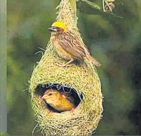
ଭୁଲ୍ କରିବ, ସେତେଥର ସମାଧିବ। ଆଉ ଏପରି ଏକ ବସା ତିଆରି କରିବ, ଯାହା ଭିତରେ ସେ ତା' ପିଲାକୁଆଙ୍କୁ ନେଇ ଝଡ଼ବତାସରେ ବି ସୁରକ୍ଷିତ ରହିପାରିବ। ଛୋଟପକ୍ଷୀଟିଏ ହେଲେ କ'ଣ ହେବ, ତା'ର କାର୍ଯ୍ୟ ପ୍ରତି ଯୈର୍ଯ୍ୟ, ସ୍ଥିରତା, ପ୍ରତିବଦ୍ଧତା ଯୋଗୁ ସେ ନିଜ ପାଇଁ ଏକ ନିର୍ଭୁଲ୍ ବସା ତିଆରି କରିବାର କ୍ଷମତା ଓ ଦକ୍ଷତା ରଖେ। ଏହା କହି, ମୋ ଆଜ ସେଇ ବାଇଚଢ଼େଇ ବସାକୁ ବ୍ୟବହାର ହେଉ ନ ଥିବା ଏକ କଅଁଳୁ ପଞ୍ଜିଦେଲା। ଛୋଟପିଲାମାନେ ବାଇଚଢ଼େଇବସା ଧରିଲେ ତାକୁ ପାଳିବ ନୁହେଁ, ମୋ ଆଜର ଏହି କଥା ସମ୍ପୂର୍ଣ୍ଣ ମିଥ୍ୟା ହୋଇପାରେ, ହେଲେ ବାଇଚଢ଼େଇ ଓ ତା'ର ବସା ନିମାଣ କରିବାର ସାହସ, ଶକ୍ତି, ପ୍ରତିବଦ୍ଧତା ମନେକରି ଆମୁହସ୍ୟା କରିଦେଉଛି। ହେଲେ ଏପରି କାହିଁକି? କାରଣ ମଣିଷ ବାଇଚଢ଼େଇ ଭଳି ନୁହେଁ। ନିଜ ଭୁଲ ସୁଧାରି କାମକରିବା ବା କାର୍ଯ୍ୟ ପ୍ରତି ଯୈର୍ଯ୍ୟ ଓ ପ୍ରତିବଦ୍ଧତା ଲାଗି ଆଜିକାଲି ପିଲାମାନଙ୍କ ପାଖରେ ସମୟ ନାହିଁ। ସେଥିଲାଗି ଆମ ଦେଶରେ ପାଠୁଆ ବେକାରିକ ସଂଖ୍ୟା ଅଧିକ। ଭଲ ପାଠ ପଢ଼ୁଛନ୍ତି, ପରୀକ୍ଷାରେ ଭଲ ନମ୍ବର ରଖୁଛନ୍ତି, ହେଲେ ଜୀବନ ସଂଗ୍ରହରେ ଭରାଣ୍ଟି ହୋଇପାରୁ ନାହାନ୍ତି। ନିଜ ଭୁଲକୁ ସ୍ୱୀକାର କରି ତାକୁ ସୁଧାରିବା ଆମ ପିଲାମାନଙ୍କର ସମ୍ମାନ ବିରୁଦ୍ଧରେ। ହାତକୁ ନେଇଥିବା କାମକୁ ସୁତାହୁଣ୍ଡିରେ ସମ୍ପାଦନ କରିବାର ଯୈର୍ଯ୍ୟ ଓ କୌଶଳ ଆମ ପିଲାମାନଙ୍କ ପାଖରେ କମିକମି ଚାଲିଛି। ଆଜିକାଲି ଭଲ

ଆଜକଥା ମାନିଲି, ଆଉ ପଚାରିଲି, "ଏଇକା କ'ଣ କାଲିରାତି ଝଡ଼ରେ ଗଛରୁ ଖସିପଡ଼ିଛି?" ମୋ ଆଜ କହିଲା, ନା! ଏଇ ବସାଟି ବାଇଚଢ଼େଇ ନିଜେ ଫିଙ୍ଗିଦେଇଛି। ବାଇଚଢ଼େଇ ବସା ବନାଉଥିବା ବେଳେ ଯଦି କିଛି ଭୁଲ ହୋଇଯାଏ, ତେବେ ସିଏ ସେଇ ବସାକୁ ଫିଙ୍ଗି, ନୂଆବସା ତିଆରି କରେ। ଖୁବ୍ ପରିଶ୍ରମ କରି ନିଜ ଛୋଟ ଅଞ୍ଚଳେ ଘାସ, ପତ୍ର ଚିରି ବସା ତିଆରି କରେ। ପରିଶ୍ରମ କରିବାକୁ ତାକୁ ଭୟ ଲାଗେନାହିଁ। ହେଲେ ଭୁଲ ତିଆରି କରିଥିବା ଘରେ ରହିବାକୁ ତାକୁ ଭଲଲାଗେ ନାହିଁ। ଯେତେଥର ଆଇକଥା ମାନିଲି, ଆଉ ପଚାରିଲି, "ଏଇକା କ'ଣ କାଲିରାତି ଝଡ଼ରେ ଗଛରୁ ଖସିପଡ଼ିଛି?" ମୋ ଆଜ କହିଲା, ନା! ଏଇ ବସାଟି ବାଇଚଢ଼େଇ ନିଜେ ଫିଙ୍ଗିଦେଇଛି। ବାଇଚଢ଼େଇ ବସା ବନାଉଥିବା ବେଳେ ଯଦି କିଛି ଭୁଲ ହୋଇଯାଏ, ତେବେ ସିଏ ସେଇ ବସାକୁ ଫିଙ୍ଗି, ନୂଆବସା ତିଆରି କରେ। ଖୁବ୍ ପରିଶ୍ରମ କରି ନିଜ ଛୋଟ ଅଞ୍ଚଳେ ଘାସ, ପତ୍ର ଚିରି ବସା ତିଆରି କରେ। ପରିଶ୍ରମ କରିବାକୁ ତାକୁ ଭୟ ଲାଗେନାହିଁ। ହେଲେ ଭୁଲ ତିଆରି କରିଥିବା ଘରେ ରହିବାକୁ ତାକୁ ଭଲଲାଗେ ନାହିଁ। ଯେତେଥର ଆଇକଥା ମାନିଲି, ଆଉ ପଚାରିଲି, "ଏଇକା କ'ଣ କାଲିରାତି ଝଡ଼ରେ ଗଛରୁ ଖସିପଡ଼ିଛି?" ମୋ ଆଜ କହିଲା, ନା! ଏଇ ବସାଟି ବାଇଚଢ଼େଇ ନିଜେ ଫିଙ୍ଗିଦେଇଛି। ବାଇଚଢ଼େଇ ବସା ବନାଉଥିବା ବେଳେ ଯଦି କିଛି ଭୁଲ ହୋଇଯାଏ, ତେବେ ସିଏ ସେଇ ବସାକୁ ଫିଙ୍ଗି, ନୂଆବସା ତିଆରି କରେ। ଖୁବ୍ ପରିଶ୍ରମ କରି ନିଜ ଛୋଟ ଅଞ୍ଚଳେ ଘାସ, ପତ୍ର ଚିରି ବସା ତିଆରି କରେ। ପରିଶ୍ରମ କରିବାକୁ ତାକୁ ଭୟ ଲାଗେନାହିଁ। ହେଲେ ଭୁଲ ତିଆରି କରିଥିବା ଘରେ ରହିବାକୁ ତାକୁ ଭଲଲାଗେ ନାହିଁ। ଯେତେଥର