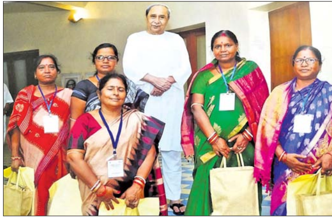
କର୍ମଶାଳାରେ ମିଶନ ଶକ୍ତି ମହିଳାଙ୍କ ଗହଣରେ ପୁଖ୍ୟମନ୍ତ୍ରୀ ନବୀନ ପଟ୍ଟନାୟକ ।