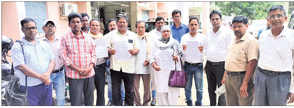
ଜିଲ୍ଲାପାଳଙ୍କୁ ଭେଟିବାକୁ ଆସିଥିବା ଓଡ଼ିଶା କୃଷକ ବିକାଶ ମଞ୍ଚର କର୍ମଚାରୀ ।