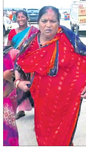
ମହାନଦୀରୁ ଉଦ୍ଧାର ହୋଇଥିବା ମହିଳା।

ପାରାଦୀପର ନେହେରୁ ବଙ୍ଗଳା ମାଛଧରା ବନ୍ଦର ପୋଡ଼ାଗ୍ରନ୍ଥରୁ ମଙ୍ଗଳବାର ସକାଳେ ଜଣେ ମହିଳାଙ୍କୁ