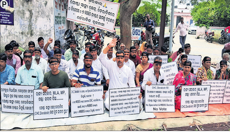
ଡାକ୍ତର ନିମ୍ନତ୍ରି ଦାବିରେ ଲୋକେ ସିତିବନଠୁ କାର୍ଯ୍ୟାଳୟ ଆଗରେ ଧାରଣା ଦେଇଛନ୍ତି।