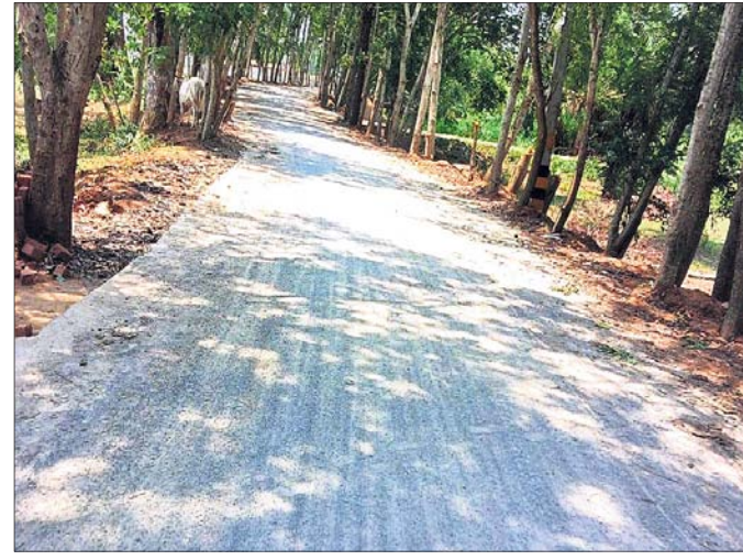
ଦଶରଥପୁର ବ୍ଲକର ବରଜଗାଁ-କମଳପୁର ରାସ୍ତା।

■ ଆନା, ତହସିଲଦାରଙ୍କ ଦ୍ୱାରା ହେଲେ ଗ୍ରାମବାସୀ ■ ଗାଁରେ ବସି ପାରୁନାହିଁ ବିପୁଳ ଗ୍ରାମପର୍ଯ୍ୟଟ କେନ୍ଦ୍ରାପଡ଼ା, ୮୮ (ହର୍ଷବର୍ଦ୍ଧନ ବେହେରା) : ଗତ ଲଘୁତାପ ଜନିତ ବର୍ଷା ଯୋଗୁ ଯାକପୁର ଜିଲାର ୯ ବ୍ଲକର ୩୮ ପଞ୍ଚାୟତ ଅନ୍ତର୍ଗତ ୨୦୩ ଗ୍ରାମ ପ୍ରଭାବିତ ହୋଇଛି। ଏଥିରେ ଯାକପୁର, ଦଶରଥପୁର, କୋରେଇ, ରଘୁଲପୁର, ବରି, ବିଞ୍ଜାରପୁର, ଧର୍ମଶାଳା, ବଡ଼ବରା ଏବଂ ସୁକିଆ ବ୍ଲକର ୧,୦୨,୨୨୮ ଜଣ ଲୋକ ରହିଥିବା ଜଣାପଡ଼ିଛି। ପ୍ରାୟ ୧୧୩୫୩ ହେକ୍ଟର ଚାଷ ଜମି ବନ୍ୟାଜଳରେ ବୁଡ଼ି ଫସଲ ନଷ୍ଟ ହୋଇଯାଇଛି। ଏହି ବନ୍ୟାରେ ୨ ଜଣଙ୍କ ମୃତ୍ୟୁ ହୋଇଥିବା ସରକାରୀ ଭାବେ ସୂଚନା ମିଳିଛି। ୧୫୮ଟି କଟା ଘର ଆଂଶିକ ଏବଂ ୨୧୧ଟି ଗୁହାଣ କ୍ଷତିଗ୍ରସ୍ତ ହୋଇଛି। ଏହାବାଦ ଯାକପୁର ଗ୍ରାମ୍ୟ ନିର୍ମାଣ ଡିଭିଜନ ଅଧୀନ ୪୨.୧୨ କିମି ରାସ୍ତା, ତ୍ରିତ୍ରେୟ ଆଦି ଭାଙ୍ଗିଥିବାବେଳେ ଏଥିପାଇଁ ତୁରନ୍ତ ୨ କୋଟି ୭ ଲକ୍ଷ ଏବଂ ଗ୍ରାମ୍ୟ ମରାମତି ପାଇଁ ୬ କୋଟି ୫୫ ଲକ୍ଷ ଟଙ୍କାର ବ୍ୟୟ ଅଟକଳ କରାଯାଇଛି। ଗତ ବନ୍ୟାରେ କୌଣସି ଘାଟ ସମ୍ପୂର୍ଣ୍ଣ ଭାବେ ଭାଙ୍ଗି ନାହିଁ। ଫଳରେ ବନ୍ୟା ପରିସ୍ଥିତି ସେତେବେଳେ ବ୍ୟାପକ ହୋଇ ପାରିନାହିଁ। ଏହି କ୍ରମରେ ରାସ୍ତା ଉପରେ ପାଣି ଥିବା ବେଳର ଫଟୋ ଉଠାଇ ଅନେକ କୋଟି ଟଙ୍କାର ବ୍ୟୟ ଅଟକଳ ପ୍ରସ୍ତୁତ