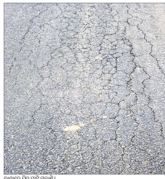
ରାସ୍ତାରେ ପିରୁ ପାଟି ଗଲାଣି।

କେନ୍ଦ୍ରାପଡ଼ା ଜିଲ୍ଲା ଡେରାବିଶ ବ୍ଲକ ବାରିମୁଳ ପଞ୍ଚାୟତ ତିଳୋତମାଦେଇପୁର ନେତୃତ୍ୱା ଜଗନ୍ନାଥପୁର ଭାୟା ସହପୁରା ୬.୦୩୦ କିମି ରାସ୍ତା ବ୍ଲକ ଅଞ୍ଚଳର ଏକ ମୁଖ୍ୟ ରାସ୍ତା। ଏହି ରାସ୍ତାକୁ କେନ୍ଦ୍ରାପଡ଼ା ଗ୍ରାମ୍ୟ ଉନ୍ନୟନ ବିଭାଗ ପକ୍ଷରୁ ମୁଖ୍ୟମନ୍ତ୍ରୀ ସତ୍ତ୍ୱେ ଯୋଜନାରେ ଅନ୍ତର୍ଭୁକ୍ତ କରାଯାଇ ୩ କୋଟି ୬୧ଲକ୍ଷ ୩୪ ହଜାର ଟଙ୍କା ବ୍ୟୟ ଅଟକଳରେ ତିଳୋତମା ପାଇଁ କାର୍ଯ୍ୟାଦେଶ ନେଇଥିବା ଠିକାଦାର ୨୦୨୨ ଏପ୍ରିଲ ୧୨ରୁ କାର୍ଯ୍ୟ ଆରମ୍ଭ କରି ୨୦୨୩ ମାର୍ଚ୍ଚ ୧୧ରେ ଶେଷ କରିବା ପାଇଁ ରୁଜୁ କରିଥିଲେ। ତେବେ ଏହି କାର୍ଯ୍ୟ ବହୁ ବିଳମ୍ବରେ ଆରମ୍ଭ କରାଯାଇଥିବା ନେଇ ଅଞ୍ଚଳବାସୀ ଅଭିଯୋଗ କରିଛନ୍ତି। ରାସ୍ତା କାର୍ଯ୍ୟ ପାଇଁ ବିଭାଗ ପକ୍ଷରୁ ଲଗା ଯାଇଥିବା ସୂଚନାଫଳକରେ ୬.୫୦ ଓସାରରୁ ୫.୫୦ ମିଟର ରାସ୍ତା ରହିଥିବା ବେଳେ ଏହା ମୋଟେଇ ୪୦୦ ମିଲିମିଟର