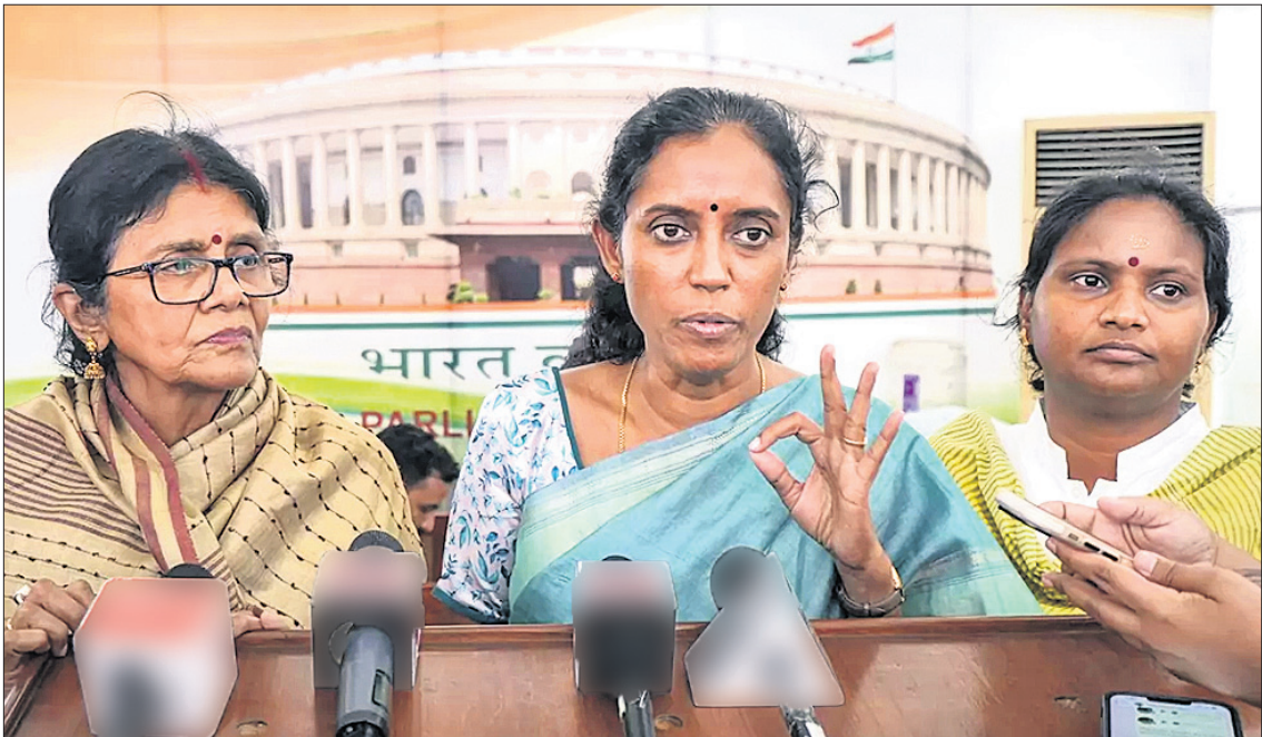
ଲୋକ ସଭାରେ ରାଜ୍ୟ ଶାସନାଳୟ ସମ୍ପର୍କରେ ରୁଧିରୀ କାନ୍ତରାୟ ଏମ୍ପି କୋହ୍ଲୀ(ମଝି) ଗଣଧ୍ୟାନକୁ ସମୋ୍ଧିତ କରୁଛନ୍ତି ।