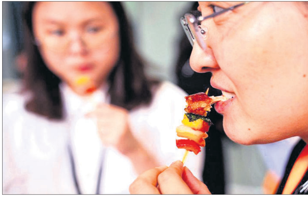
ସେଇଏକ ପକ୍ଷରୁ ଲାଭରେ ପ୍ରସ୍ତୁତ ମାଂସକୁ ସାଂଯାଇଥିବା କମ୍ପାନୀର ଏକ ପାସିଲିଟିରେ ଜଣେ ମହିଳା ଖାଇଛନ୍ତି।

ବିଜ୍ଞାନିକ ପ୍ରମାଣରେ ସର୍ଭେ କରିବାକୁ ନିର୍ଦ୍ଦେଶ ଦେଇଥିଲେ। କୋର୍ଟ ଆଦେଶ ଆଧାରରେ ଚଳିତ ମାସ ୪ ତାରିଖରୁ ପ୍ରତ୍ନତତ୍ତ୍ୱ ବିଭାଗ ସର୍ଭେ ଆରମ୍ଭ କରିଥିଲା। ଅଜ୍ଞାନ ଉଦ୍ଧୈଷୀଣା ମସଜିଦ କମିଟିର ସମ୍ମୁଖୀନ ହେଉଥିବା ସମୟରେ ସର୍ଭେ କରାଯାଇ ନପାରିବ ବୋଲି କୋର୍ଟ ନିର୍ଦ୍ଦେଶ ଅନୁସାରେ ପ୍ରତ୍ନତତ୍ତ୍ୱ ବିଭାଗ ବର୍ତ୍ତମାନ ଞ୍ଜାନବାପି ମସଜିଦ ପରିସରରେ ସର୍ଭେ କରୁଛି। ଏବେଲ ଏଏସ୍‌ଆଇ ପକ୍ଷରୁ ବର୍ତ୍ତମାନ ସୁଦ୍ଧା କୌଣସି ମତବ୍ୟ ଦିଆଯାଇନାହିଁ। କିନ୍ତୁ ବିଭିନ୍ନ ଗଣମାଧ୍ୟମରେ ଏ ସମ୍ପର୍କିତ ଖବର ବାରମ୍ବାର ପ୍ରସାରିତ ହୋଇଆସୁଛି। ଏହା ଲୋକଙ୍କ ମନରେ ଭ୍ରାନ୍ତ ଧାରଣା ସୃଷ୍ଟି କରୁଛି। ତେଣୁ ଏ ସମ୍ପର୍କିତ ଖବର ପ୍ରସାରଣ ଉପରେ ପ୍ରତିବନ୍ଧକ ଲଗାଇବାକୁ ଆମେ ସ୍ୱାଗତ୍ୟ କୋର୍ଟରେ ଆବେଦନ କରିଛୁ।