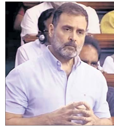
ଲୋକ ସଭାରେ ଉଦ୍‌ବୋଧନ ଦେଉଛନ୍ତି କଂଗ୍ରେସ ଏମ୍‌ପି ରାହୁଲ ଗାନ୍ଧୀ।

ନୂଆଦିଲ୍ଲୀ, ୯।୮ (ପି.ଟି.) ଭାଜପାର ରାଜନୀତି ମଣିପୁରରେ ଭାରତ ମାତାକୁ ହତ୍ୟା କରିଛି ବୋଲି ରୁଧ୍ରବାର କଂଗ୍ରେସ ନେତା ରାହୁଲ ଗାନ୍ଧୀ ଅଭିଯୋଗ ଆଣିଛନ୍ତି। ଏଥିସହ ଶାସକ ଦଳର ସଦସ୍ୟମାନଙ୍କୁ ସେ ବିଶ୍ୱାସଘାତକ ଭାବେ ଅଭିହିତ କରି ଏହି ଉତ୍ତର-ପୂର୍ବ ରାଜ୍ୟରେ ହିଂସା ରୋକିବାରେ ବିଫଳ ହୋଇଥିବା ମୋଦି ସରକାରଙ୍କୁ କଡ଼ା ସମାଲୋଚନା କରିଛନ୍ତି। ୨୬ ବିରୋଧୀ ଦଳକୁ ନେଇ ଗଠିତ ଇଣ୍ଡିଆନ୍ ନ୍ୟାଶନାଲ ଡେଭେଲପମେଣ୍ଟଲ ଇନ୍‌କୁୟିଭ ଆଲୀଏନ୍ସ (ଇଣ୍ଡିଆ) ପକ୍ଷରୁ ଲୋକ ସଭାରେ ଜାତୀୟ ଗଣତାନ୍ତ୍ରିକ ମେଣ୍ଟ (ଏନ୍‌ଡିଏ) ସରକାର ବିରୋଧରେ ଆଗତ ଅନାଗ୍ନୀ ପ୍ରସ୍ତାବ ଉପରେ ବିତର୍କର ଦ୍ୱିତୀୟ ଦିନ ରାହୁଲ ନିଜ ବକ୍ତବ୍ୟ ରଖିଛନ୍ତି। ସଦସ୍ୟତା ଫେରିପାଇବା ପରେ ରାହୁଲ ପ୍ରଥମ ଥର ପାଇଁ ଗୃହରେ କହିଛନ୍ତି, ପ୍ରଧାନମନ୍ତ୍ରୀ ନରେନ୍ଦ୍ର ମୋଦି ମଣିପୁର ଯାଉନାହାନ୍ତି। କାରଣ ସେ ଏହି ରାଜ୍ୟକୁ ଭାରତରୁ ଭିନ୍ନ ଏକ ଅଂଶ ବୋଲି ବିବେଚନା କରୁଛନ୍ତି। ରାବଣ ଯେମିତି କେବଳ ମେଘନାଦ