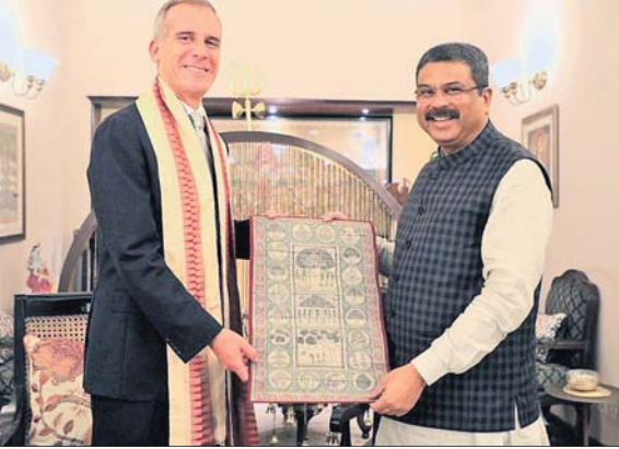
ଆମେରିକାର ରାଷ୍ଟ୍ରପତି ଜରଜମାଳି ଉପରେ କେନ୍ଦ୍ରମନ୍ତ୍ରୀ ଧର୍ମେନ୍ଦ୍ର ପ୍ରଧାନଙ୍କୁ ତାଙ୍କ ନୂଆଦିଲ୍ଲୀ ଛିତ୍ର ବାସଭବନରେ ଭେଟିଛନ୍ତି । ଏହି ଅବସରରେ ସେ ଶିକ୍ଷା, ନବସୃଜନ, ଗବେଷଣା ସମେତ ଆମେରିକା ଓ ଭାରତ ମଧ୍ୟରେ ସମ୍ପର୍କ ସହଯୋଗକୁ ସୁଦୃଢ଼ କରିବା ଉପରେ ଆଲୋଚନା କରିଛନ୍ତି । ଧର୍ମେନ୍ଦ୍ର ଏହି ଅବସରରେ ଆମେରିକା ରାଷ୍ଟ୍ରପତିଙ୍କୁ ଓଡ଼ିଶାର ପାରମ୍ପରିକ ପଦ୍ମଚିତ୍ର ପ୍ରଦାନ କରିଛନ୍ତି ।

ନିର୍ବଚିତ ଜଗଜମାଳି, ପ୍ରବାଦ, ପ୍ରବଚନ ଓ ଅନ୍ୟାନ୍ୟ - ପ୍ରାଣୀ ସାହିତ୍ୟ ପ୍ରତିଷ୍ଠାନ