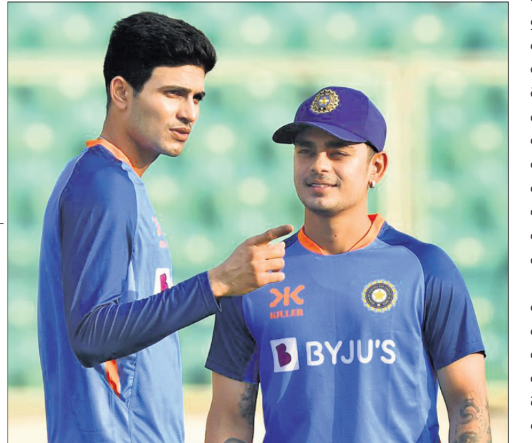
ଶୁଭମନ ଗିଲ୍ ଓ ଇଶାନ କିଶନ

ବୁଧାବିଳା, ୯୩୮ (ପି.ଟି.) ଆଇସିସି ପକ୍ଷରୁ ବିନିକିଆ ର୍ୟାଙ୍କିଙ୍ଗ୍ ତାଲିକା ରୁଧିରା ପ୍ରକାଶ ପାଇଥିବା ବେଳେ