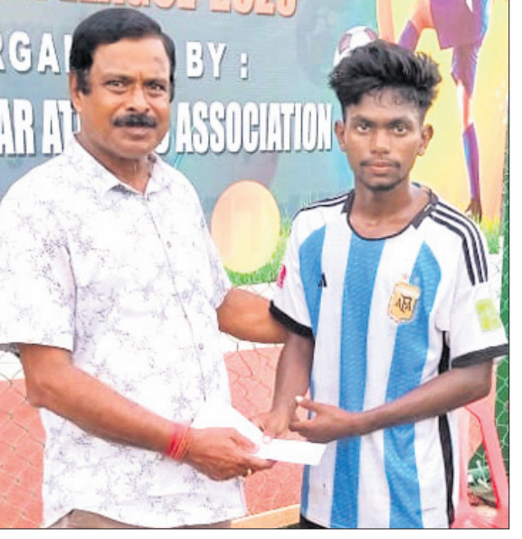
ବାପୁନି ବିଶାଣାଙ୍କୁ ପୂର୍ଣ୍ଣ ଅର୍ପଣ ଦି ମ୍ୟାଚ ପୁରସ୍କାର ପ୍ରଦାନ କରାଯାଇଛି।