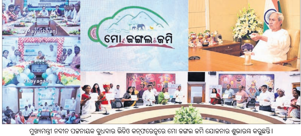
ମୁଖ୍ୟମନ୍ତ୍ରୀ ନବୀନ ପଟ୍ଟନାୟକ ରୁଧିରା ଭିତି ଓ କନ୍ଦଫରେନ୍ସରେ ମୋ ଜଙ୍ଗଲ ଜମି ଯୋଜନାର ଶୁଭାରମ୍ଭ କରୁଛନ୍ତି ।

ଏବଂ ଘାୟା ବିକଳ୍ପ ସୃଷ୍ଟି କରିବାର ଆଶା ସୃଷ୍ଟି କରିଥିଲା । ଭାରତରେ ପେଟ୍ରୋଲିୟମ ଏବଂ ପ୍ରାକୃତିକ ଗ୍ୟାସ ମନୁଷ୍ୟମାନଙ୍କ ଏବଂ ପରିବେଶ, ଜଙ୍ଗଲ ଏବଂ ଜଳବାୟୁ ପରିବର୍ତ୍ତନ ମନୁଷ୍ୟମାନଙ୍କ ୨୦୧୫ଠାରୁ ବିଶ୍ୱ ଜୈବ ଉନ୍ନୟନ ଦିବସ ପାଳନ କରିବା ଆରମ୍ଭ କରିଛି । ଆଶୋଧିତ ତୈଳ ଉପରେ ନିର୍ଭରଶୀଳତା ହ୍ରାସ ପାଇଁ ଜୈବ ଉନ୍ନୟନ ହେଉଛି ଏକ ଚାଲି ଚାଲି ଏବଂ ଏହା ଏକ ପରିଚ୍ଛନ୍ନ ପରିବେଶ ସୁନିଶ୍ଚିତ କରିଥାଏ । ଅପରପକ୍ଷେ ଏହା ଅଧିକ ନିରୁଦ୍ଧି ସୁଯୋଗ ସୃଷ୍ଟି କରିବା ସହ ଅଜ୍ଞାନବାଦୁ ନିର୍ମମନ ହ୍ରାସରେ ମଧ୍ୟ ସାହାଯ୍ୟ କରିଥାଏ । ଜୀବାଣୁ ଉନ୍ନୟନ ଜାଲିବା ଦ୍ୱାରା ଅଜ୍ଞାନବାଦୁ ନିର୍ମମ ହୋଇଥାଏ ; ଯାହା ବାୟୁ ଏବଂ ପରିବେଶ ପାଇଁ ଅତ୍ୟନ୍ତ କ୍ଷତିକାରକ ।