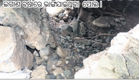
ଲଗାଣ ବର୍ଷାରେ ଭାଙ୍ଗିଯାଇଥିବା ପୋଲ ।

ଉପରେ ଗାଁ ଲୋକେ ନିର୍ଭର କରନ୍ତି । କିନ୍ତୁ ପୋଲ ପୁରୁଣା ହେବାକୁ ଲଗାଣ ବର୍ଷାରେ ପିଲର ଭାଙ୍ଗିଯାଇ ଝୁଲୁ ଅବସ୍ଥାରେ ରହିଛି । ବର୍ତ୍ତମାନ ବିପଦସଙ୍କୁଳ ପରିସ୍ଥିତିରେ ପୋଲକୁ ସଂଯୋଗ ହୋଇଛି । ପ୍ରତିଦିନ ପୋଲ ଦେଇ ଛାତ୍ରାଛାତ୍ରୀ ସ୍କୁଲ, କଲେଜକୁ ଯାଉଥିବା ବେଳେ ଲୋକେ ବିଭିନ୍ନ କାରଣରେ ଯାଇଥାନ୍ତି । ହସ୍ତିଗଳା ଓ ଶିବମନ୍ଦିରକୁ ମଧ୍ୟ ଯାଇଥାନ୍ତି । ଭାଙ୍ଗି ଯାଇଥିବା ପୋଲ ନିକଟରେ ଝାଙ୍କରବନ୍ଧ ପୋଖରୀ ରହିଛି । ଏହି ପୋଖରୀ