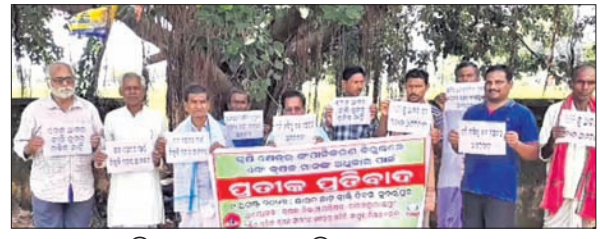
ରାଷ୍ଟ୍ରପତିଙ୍କ ଉଦ୍ଦେଶ୍ୟରେ ଦାବିପତ୍ର ପ୍ରଦାନ

ରାଷ୍ଟ୍ରପତିଙ୍କ ଉଦ୍ଦେଶ୍ୟରେ ଦାବିପତ୍ର ପ୍ରଦାନ ଉପଲକ୍ଷେ ଗୋଟିଏ ସମାବେଶ ଯାକ୍ତିକ ଭାବେ ଗଠନ କରାଯାଇଛି । ଉକ୍ତ ସମାବେଶରେ ଉପସ୍ଥିତ ଥିବା ବ୍ୟକ୍ତିମାନଙ୍କର ଦାବିପତ୍ର ଗ୍ରହଣ କରାଯାଇଛି । ଏହାଛଡ଼ା ଉପସ୍ଥିତ ଥିବା ବ୍ୟକ୍ତିମାନଙ୍କର ଦାବିପତ୍ର ଗ୍ରହଣ କରାଯାଇଛି । ଏହାଛଡ଼ା ଉପସ୍ଥିତ ଥିବା ବ୍ୟକ୍ତିମାନଙ୍କର ଦାବିପତ୍ର ଗ୍ରହଣ କରାଯାଇଛି ।