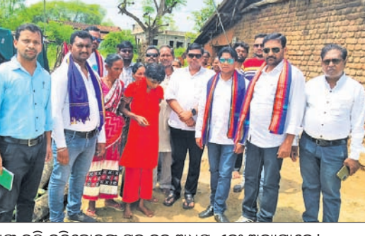
ଦିବ୍ୟାଙ୍ଗ ତଲି ବନ୍ଧିଛୋଡଙ୍କ ସହ କୁଳ ଅଧ୍ୟକ୍ଷ ଏବଂ ଅନ୍ୟମାନେ।

ଜୀବନରେ ପାଠପଢ଼ି ଅନ୍ୟମାନଙ୍କ ଭଳି ସମାଜରେ କିଛି ଦୃଷ୍ଟାନ୍ତମୂଳକ କାର୍ଯ୍ୟ କରିବାର ଇଚ୍ଛାଥିଲା। ନିରୁପାୟ ରହିବ ଘର ଝିଅ ନିଜ ଅଧ୍ୟାପକଙ୍କ ବଳରେ ମାଟ୍ରିକ ପାସ କଲେ। ପରେ ମାନସିକ ରୋଗରେ ପୀଡ଼ିତ ହୋଇ ଭିନ୍ନସ୍ଥାନ ପାଇଁ ଚାଲିଗଲା। ଉଚ୍ଚଶିକ୍ଷା ସପ୍ତ ସପ୍ତରେ ରହିଗଲା। ମା'ବାପା ପାଇଁ ନିଜ ସେ ଅଲୋଡ଼ି ପାଇଁ ଚିନ୍ତିତ। କଳାହାଣ୍ଡି ଜିଲ୍ଲା ଗୋଲାପୁଣ୍ଡା ବ୍ଲକ ଅଧୀନ ମାନସିକ ପ୍ରଶାସନ ଗ୍ରାଣ୍ଟୋଲ ଗାଁର ଦିବ୍ୟାଙ୍ଗ ମାନସିକ