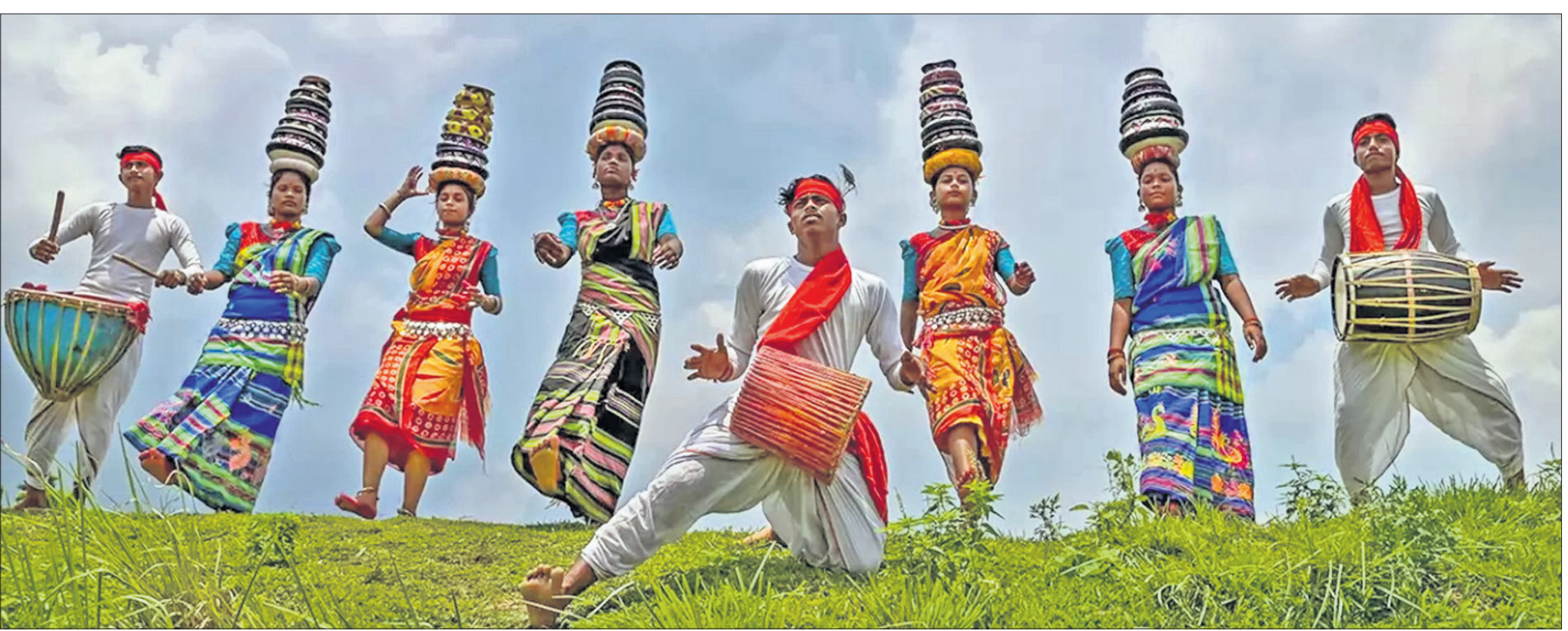
ଶନିବାର ଅନ୍ତର୍ଜାତୀୟ ଆଦିବାସୀ ଦିବସରେ ପଶ୍ଚିମବଙ୍ଗର ନଦିଆ ଜିଲ୍ଲାରେ ଆଦିବାସୀମାନେ ସାଂସ୍କୃତିକ ନୃତ୍ୟ ପରିବେଷଣ କରୁଛନ୍ତି।

ଇସ୍ଲାମାବାଦ, ୯୮ (ପି.ଟି.): ପାକିସ୍ତାନ ପ୍ରଧାନମନ୍ତ୍ରୀ ଶେହବାଜ ସରିଫ କହିଛନ୍ତି, ତାଙ୍କ ସରକାର ୧୬ ମାସର ଶାସନକାଳ ମଧ୍ୟରେ ପୂର୍ଣ୍ଣ ସରକାରଙ୍କ ଦ୍ୱାରା କରାଯାଇଥିବା ଛୁଇଁ ଲାଗି ଅଧିକ ଅସୁବିଧାର ସମ୍ମୁଖୀନ ହୋଇଛି। ସେହିପରି ଇମ୍ରାନ୍ ସରକାର ପାକିସ୍ତାନର ମିତ୍ର ରାଷ୍ଟ୍ରମାନଙ୍କ ସହ ସମ୍ପର୍କକୁ ଅଧିକ ଖରାପ କରିଛନ୍ତି। ୧୩ଟି ଦଳର ସମର୍ଥନକୁ ନେଇ ଗଠିତ ଏହି ସରକାର ଗତ ୧୬ ମାସ ମଧ୍ୟରେ ଅର୍ଥନୀତି, ବୈଦେଶିକନୀତି ଠାରୁ ଆରମ୍ଭ କରି ବିଭିନ୍ନ କ୍ଷେତ୍ରରେ ଅସୁବିଧାର ସମ୍ମୁଖୀନ ହୋଇ ଆସିଛି। ୩୮ ବର୍ଷର ରାଜନୈତିକ ଜୀବନରେ ଏଭଳି ଛୁଟି କେବେ ଦେଖି ନ ଥିଲେ। ଏହି ୧୬ ମାସ ମଧ୍ୟରେ ଦେଶରେ ଖାଦ୍ୟ ସଙ୍କଟ ଠାରୁ ଆରମ୍ଭ କରି ଚେଲ୍ ସଙ୍କଟ ଏବଂ ଅନ୍ୟାନ୍ୟ ସଙ୍କଟ ଦେଖାଦେଇଥିଲା। ହେତୁ ସରକାର ଦୃଢ଼ତାର ସହ ସେସବୁର ମୁକାବିଲା କରିଥିଲା ବୋଲି ସରିଫ ତାଙ୍କ ବିବାଦୀ ଭାଷଣରେ କହିଛନ୍ତି।