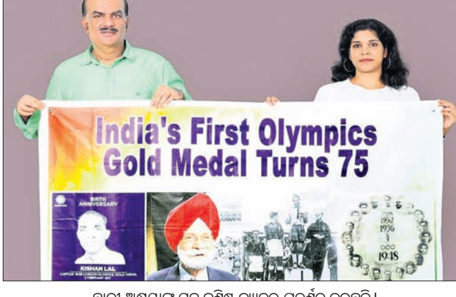
ଛାତ୍ରୀ ଅକ୍ଷୟାକା ସହ ବର୍ତ୍ତମାନ ପ୍ରଦର୍ଶନ କରୁଛନ୍ତି।

କୋଝିକୋଡ୍, ୯୮: ସ୍ୱାଧୀନ ହେବାପରେ ଭାରତୀୟ ପୁରୁଷ ହକି ଦଳ ୧୯୪୮ରେ ପ୍ରଥମଥରପାଇଁ ଅଲିମ୍ପିକ୍ସରେ ସ୍ୱର୍ଣ୍ଣ ପଦକ ବିଜୟ ହୋଇଥିଲା।