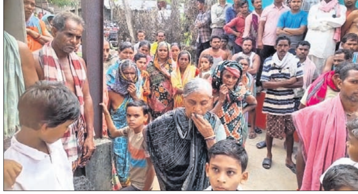
ମୃତଦେହ ପହଞ୍ଚିବା ପରେ ଗ୍ରାମରେ ଲୋକଙ୍କ ଭିଡ଼ ।

ହାଇଦ୍ରାବାଦରୁ ଅଣାଯାଇଥିବା ଏମ୍ବେଲ୍ଡ ମୃତଦେହକୁ ପୁରୁଣା ଗାଁରେ ଉପସ୍ଥାପନ କରାଯାଇଛି । ଏହାଛଡ଼ା ଉପସ୍ଥିତ ଥିବା ବ୍ୟକ୍ତିମାନଙ୍କର ଦାବିପତ୍ର ଗ୍ରହଣ କରାଯାଇଛି । ଏହାଛଡ଼ା ଉପସ୍ଥିତ ଥିବା ବ୍ୟକ୍ତିମାନଙ୍କର ଦାବିପତ୍ର ଗ୍ରହଣ କରାଯାଇଛି ।