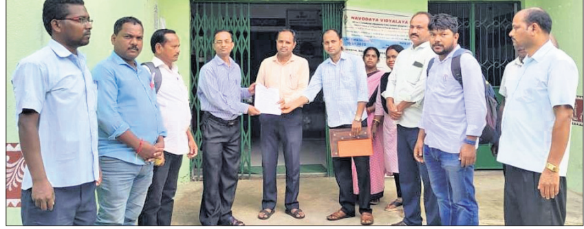
ଅତିରିକ୍ତ ଗୋଷ୍ଠୀ ଶିକ୍ଷା ଅଧିକାରୀଙ୍କୁ ଦାବିପତ୍ର ଦିଆଯାଇଛି ।