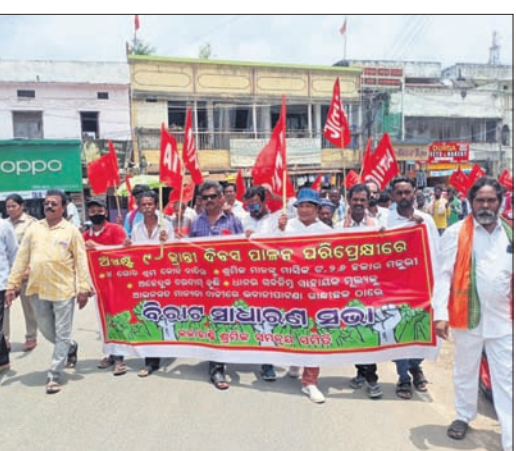
କଳାହାଣ୍ଡି ଶ୍ରମିକ ସମନ୍ୱୟ ସମିତି ପକ୍ଷରୁ ଶୋଭାଯାତ୍ରା କରାଯାଇଛି।