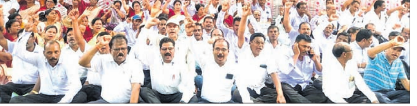
ବିକ୍ଷୋଭରେ ସାମିଲ ହୋଇଥିବା ଶିକ୍ଷକମାନେ।

ଢେଙ୍କାନାଳ, ୯୮ (ରତନ ନାୟକ) ଢେଙ୍କାନାଳ ଜିଲ୍ଲା ମାଧ୍ୟମିକ ସ୍କୁଲ ଶିକ୍ଷକ ସଂଘ (ଓଷ୍ଟା) ଆହ୍ୱାନରେ ନୂତନ ଅନୁଦାନପ୍ରାପ୍ତ ଶିକ୍ଷକଙ୍କ ଦାବି ପୂରଣ ନେଇ ରୁଧିରା ବିକ୍ଷୋଭ ଶୋଭାଯାତ୍ରା ଅନୁଷ୍ଠିତ ହୋଇଯାଇଛି। ଶିକ୍ଷକମାନେ ବାଲିଗୋଳଠାରୁ ଶୋଭାଯାତ୍ରାରେ ବାହାରି ସହର ପରିକ୍ରମା କରିବା ପରେ ଜିଲ୍ଲା ଶିକ୍ଷାଧିକାରୀଙ୍କ କାର୍ଯ୍ୟାଳୟରେ ପହଞ୍ଚିଥିଲେ। ରାଜ୍ୟ ସରକାରଙ୍କ ଉଦ୍ଦେଶ୍ୟରେ ଜିଲ୍ଲା ଶିକ୍ଷାଧିକାରୀଙ୍କୁ ଦାବିପତ୍ର ପ୍ରଦାନ କରିଥିଲେ। ଶୋଭାଯାତ୍ରାରେ ୬୦୦ରୁ ଊର୍ଦ୍ଧ୍ୱ ଶିକ୍ଷକ, ଅବସରପ୍ରାପ୍ତ ଶିକ୍ଷକ ଓ କର୍ମଚାରୀ ସାମିଲ ହୋଇଥିଲେ। ଅନୁଦାନ ଯୋଗ୍ୟ ହାତୀକୁଳକୁ ଅନୁଦାନ ପ୍ରଦାନ, ଅନୁଦାନଭୁକ୍ତ ଶିକ୍ଷକ, କର୍ମଚାରୀଙ୍କ ଚାକିରି ସର୍ବାବଳୀ ପୂରଣ, ପୁରାତନ ପେନ୍ସନ ବ୍ୟବସ୍ଥା ଲାଗୁ, ଯୋଗ୍ୟତା ଆଧାରରେ ହିନ୍ଦୀ, ସଂସ୍କୃତ ଶିକ୍ଷକଙ୍କ ବରମା ନିର୍ଦ୍ଧାରଣ, ୨୨୬ ଓ ୩୯୯ ବର୍ଗ ହାତୀକୁଳକୁ