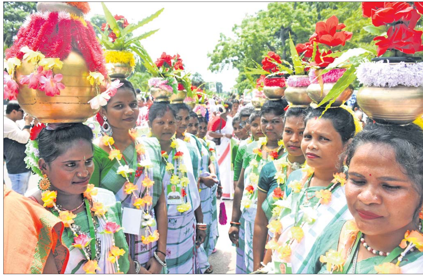
ଅନ୍ତର୍ଜାତୀୟ ଦେଶର ଅଧିବାସୀ ଦିବସ ଅବସରରେ ବିଭିନ୍ନ ପକ୍ଷରୁ ଭୁବନେଶ୍ୱରରେ ଆୟୋଜିତ ଆଦିବାସୀ ନୃତ୍ୟ ।