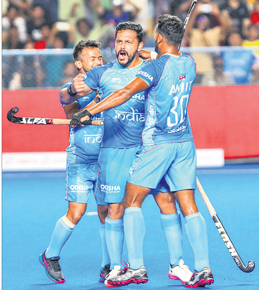
ପାକିସ୍ତାନ ବିପକ୍ଷରେ ଗୋଲ ଖୋର କରିବାପରେ ଭାରତ ଅଧିନାୟକ ହରମନପ୍ରୀତ ସିଂହଙ୍କୁ ସାଥୀ ଖେଳାଳି ବଧେଇ ଜଣାଉଛନ୍ତି।