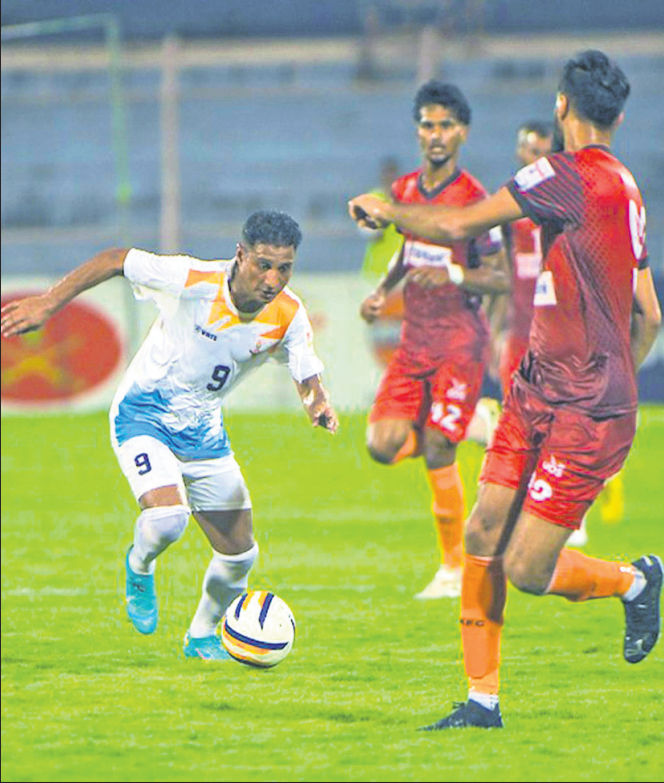
କୋଲକାତା: ଦୁରାଣ୍ଟ କପ୍ ଫୁଟବଲ ଟୁର୍ନାମେଣ୍ଟରେ ରୁଧିର ଗୋକୁଳମ୍ କେରଳ ଓ ଲକ୍ଷ୍ମୀଆନ ଏୟାର ଫୋର୍ସ ମଧ୍ୟରେ ଅନୁଷ୍ଠିତ ମ୍ୟାଚ।

କୋଲକାତା, ୯୮ (ପି.ଟି.): ଫେଡେରେଶନ (ଆଇଏସ୍‌ଏସ୍‌ଏସ୍) ମଧ୍ୟ ମୁରୋପିଆନ୍ ଯୁନିୟନର ଏହି ପ୍ରସ୍ତାବକୁ ଗୁରୁତ୍ୱର ସହ ବିଚାର କରୁଛି।