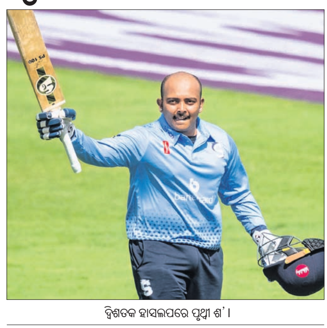
ଦ୍ୱିଶତକ ହାସଲପରେ ପୃଥ୍ୱୀ ଶ'।

ଭାରତୀୟ ଦଳରୁ ଦୂରରେ ଥିବା ଓପନର ପୃଥ୍ୱୀ ଶ କାଉଣ୍ଟିରେ ଦ୍ୱିଶତକ ହାସଲ କରିଛନ୍ତି।