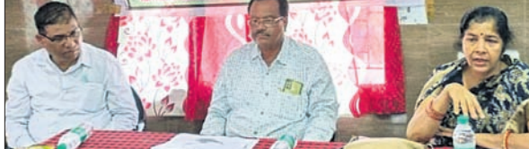
ଖବରବାତୀ ସମ୍ମିଳନୀରେ ଉପସ୍ଥିତ ଅଧିକାରୀମାନେ।

ଅନୁଗୋଳ ଜିଲାରେ ଫାଇଲେରିଆ ନିରାକରଣ ପାଇଁ ରାଜ୍ୟ ସରକାରଙ୍କ ସ୍ୱାସ୍ଥ୍ୟ ଓ ପରିବାର କଲ୍ୟାଣ ବିଭାଗ ପକ୍ଷରୁ ଆସନ୍ତା ୧୦ରୁ ୧୯ ତାରିଖ ପର୍ଯ୍ୟନ୍ତ ସାମୂହିକ ଔଷଧ ସେବନ କାର୍ଯ୍ୟକ୍ରମ (ଏମ୍‌ଡିଏ) ଚାଲିବ। ଏ ସମ୍ପର୍କରେ ଜିଲା ପୁଖ୍ୟ ଚଳିତକଙ୍କ ପକ୍ଷରୁ ମଙ୍ଗଳବାର ଖବରବାତୀ ସମ୍ମିଳନୀରେ ପୂର୍ତ୍ତନା ପ୍ରଦାନ କରାଯାଇଛି। ଜିଲା ପୁଖ୍ୟ ଚଳିତକ ଓ ଜନ ସ୍ୱାସ୍ଥ୍ୟ ଅଧିକାରୀ ତଥା ଜିଲା ମିଶନ ନିର୍ଦ୍ଦେଶକ ତାଙ୍କର ଡ୍ରାଇଭିଂ ପ୍ରଧାନ କହିଥିଲେ ଯେ, ୨୦୨୭ ମସିହା ପୂର୍ବ ଫାଇଲେରିଆର ସମ୍ପୂର୍ଣ୍ଣ ନିରାକରଣ କରିବାକୁ ଓଡ଼ିଶାର ପ୍ରତିବନ୍ଧକରୁ ସମସ୍ତେ ମନରେ ରଖିବା ଦରକାର। ତେଣୁ ଅନୁଗୋଳ ଜିଲାରେ ଫାଇଲେରିଆ ନିରାକରଣ ପାଇଁ ସାମୂହିକ ଔଷଧ ସେବନ ଆରମ୍ଭ। ଏହି କାର୍ଯ୍ୟକ୍ରମ ଅଧୀନରେ ରୋଗୀ