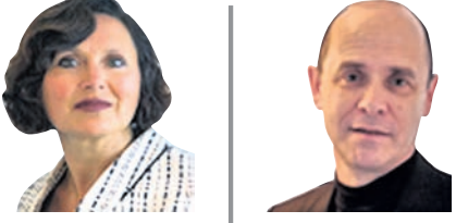
ସାହିତ୍ୟ ଡିପ୍ୟୁଟି ଡିପ୍ୟୁଟି ସହ-ଅଧ୍ୟକ୍ଷ, ଦି କ୍ଲବ ଅଫ୍ ରୋମ

ପ୍ରକୃତି ନିର୍ଦ୍ଦୟ ଓ ଅସହନୀୟ ଭାବେ ଉଦ୍ଭୋଗନ କରାଯାଉଥିବା ପ୍ରାକୃତିକ ସମ୍ପଦ ଉପରେ ବୈଷ୍ଣବ ଅର୍ଥ ବ୍ୟୟ ନିର୍ଭରଶୀଳ। ତେବେ ପ୍ରକୃତି ଉପରେ ଆମର ସମ୍ପୂର୍ଣ୍ଣ ନିର୍ଭରଶୀଳତା ସହେ ଏହାର ଅବଦାନ ସମ୍ପୂର୍ଣ୍ଣ ପରୋକ୍ଷ ଓ ଅନୁକମ୍ପା ହୋଇ ରହିପାରେ। ଏଣୁ ଏକ ପ୍ରକୃତି-ସମାଜାତ୍ମକ ଭବିଷ୍ୟତ ଗଠନ ପାଇଁ ନୀତିଗୁଡ଼ିକ ନୂତନ ପିଢ଼ି ଆବଶ୍ୟକ ଏବଂ ପରିସଂସ୍ଥା ସୃଷ୍ଟି ଏବଂ ସେବା ପାଇଁ ସୁପରିଚାଳିତ ବଜାର ଗଠନ। ପ୍ରକୃତି ଏବଂ ଜଳବାୟୁ ସ୍ଥିରତା ଗୋଟିଏ ମୁଦ୍ରାର ଦୁଇଟି ପାର୍ଶ୍ୱ ଏବଂ ସେମାନଙ୍କ ଭବିଷ୍ୟତ ପରସ୍ପର ସହ ଜଡ଼ିତ। ଏବେ ଅନିୟନ୍ତ୍ରିତ ବିଶ୍ୱ ତାପମାତ୍ରା ପ୍ରଭୃତିର ପ୍ରାକୃତିକ ସମ୍ପଦକୁ ନଷ୍ଟ କରୁଥିବାବେଳେ ଗ୍ରୀନ୍ ହାଉସ୍-ଗ୍ୟାସ୍ (କ୍ଲିଏରନ୍ସ) ବା ସବୁଜ ଗୃହ ବାସ୍ତୁ ନିର୍ମାଣକୁ ସୀମିତ ରଖିବା ପାଇଁ ଜୈବ ବିବିଧତା ସଂରକ୍ଷଣ ଏବଂ ପୁନରୁଦ୍ଧାର ଏକାନ୍ତ ଆବଶ୍ୟକ। କିନ୍ତୁ ବୈଷ୍ଣବ ଅର୍ଥ ବ୍ୟବସ୍ଥାକୁ କାର୍ଯ୍ୟକାରୀ ଅଲଗା କରିବା ପାଇଁ ନିଆଯାଉଥିବା ପଦକ୍ଷେପ ପରିସଂସ୍ଥାର ଅପବ୍ୟବହାରକୁ ରୋକିବା ଲାଗି ଯଥେଷ୍ଟ ନୁହେଁ। ଏଣୁ ଆଜିର ଜଳବାୟୁ ପ୍ରେକ୍ଷ୍ୟ ବା ରଣନୀତିକିକ ପୂର୍ଣ୍ଣକାରୁ ଶିକ୍ଷା ନେଇ ଲାଭ ଉଠାଯାଇପାରେ, କିନ୍ତୁ ତାହାକୁ ସଫଳାପୂର୍ଣ୍ଣ କରିବାକୁ ହେବ ନାହିଁ। ଜୈବ ବିବିଧତା ଅବକ୍ଷୟ ରୋକିବା ଏବଂ କମାଇବା ପାଇଁ ଏକ ନୂତନ ରଣନୀତି ଆବଶ୍ୟକ ଏବଂ ଏହାକୁ ଲେଖିବା ବା ଗଢ଼ିବାରେ ସାହାଯ୍ୟ କରିବା ପାଇଁ ମାର୍ଚ୍ଚ ୨୦୨୨ରେ ନେତୃତ୍ୱ ନେଇ ଏକ ପ୍ରକୃତି ବଜାର ଉପରେ ଗ୍ୟାସ୍‌ପୋର୍ସ ଗଠନ କରାଯାଇଥିଲା। ବ୍ରାଜିଲର ବେଲୋମିରେ ଆୟୋଜିତ ଆମାଜନ ରେନ୍ ଫରଷ୍ଟ ମିଳିତ ମଞ୍ଚରେ ପ୍ରକୃତିର କ୍ଷତି ବଦଳରେ ତାହାର ସଂରକ୍ଷଣ କରିବାକୁ ନୂତନ ପଦ୍ଧତି ଭଲ ବଜାର ବିକଳ ଗଠନ କରିହେବ ଡା' ଉପରେ ଗ୍ୟାସ୍‌ପୋର୍ସ ନିର୍ଦ୍ଦାୟ ଏବଂ ସୁପରିସଂଗଠିତ ପ୍ରକାଶ କରାଯିବ। ପ୍ରକୃତିର ଗୁରୁତ୍ୱ