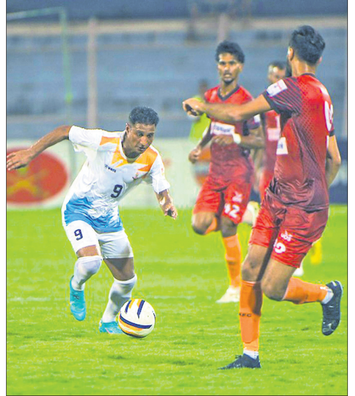
କୋଲକାତା: ଦୁରାଣ୍ଟ କପ୍ ଫୁଟବଲ ଟୁର୍ନାମେଣ୍ଟରେ ରୁଧିବାର ଗୋକୁଳମ୍ କେରଳ ଓ ଇଣ୍ଡିଆନ୍ ଏୟାର ଫୋର୍ସ ମଧ୍ୟରେ ଅନୁଷ୍ଠିତ ମ୍ୟାଚ।

ଏଫଡିଏସ୍ (ଆଇଏସ୍‌ଏସ୍‌ଏସ୍) ମଧ୍ୟ ଯୁରୋପିଆନ୍ ଯୁନିୟନର ଏହି ପ୍ରସ୍ତାବକୁ ଗୁରୁତ୍ୱ ଦେଇ ସହ ବିଚାର କରୁଛି।