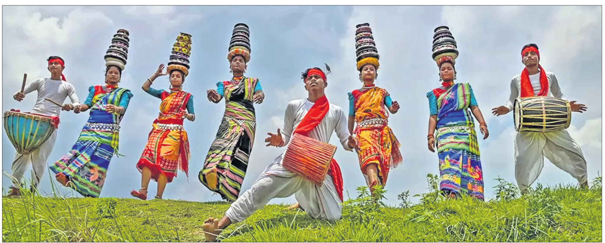
ଶନିବାର ଅନ୍ତର୍ଜାତୀୟ ଆଦିବାସୀ ଦିବସରେ ପଣ୍ଡିଚେରୀର ନୈଆ ଜିଲ୍ଲାରେ ଆଦିବାସୀମାନେ ସାଂସ୍କୃତିକ ନୃତ୍ୟ ପରିବେଷଣ କରୁଛନ୍ତି।

ଇସ୍ଲାମାବାଦ, ୯୮ (ପି.ଟି.): ପାକିସ୍ତାନ ପ୍ରଧାନମନ୍ତ୍ରୀ ଶେହବାଜ ସରିଫ କହିଛନ୍ତି, ଚାକ୍ ସରକାର ୧୬ ମାସର ଶାସନକାଳ ମଧ୍ୟରେ ପୂର୍ବ ସରକାରଙ୍କ ଦ୍ୱାରା କରାଯାଇଥିବା ଲୁଲୁ ଲାଗି ଅଧିକ ଅନୁଦାନ ସମ୍ପୂର୍ଣ୍ଣ ଆଣିଛନ୍ତି। ସେହିପରି ଇମ୍ରାନ୍ ସରକାର ପାକିସ୍ତାନର ମିତ୍ର ରାଷ୍ଟ୍ରମାନଙ୍କ ସହ ସମ୍ପର୍କକୁ ଅଧିକ ଖରାପ କରିଛନ୍ତି। ୧୩ଟି ଦଳର ସମର୍ଥନକୁ ନେଇ ଗଠିତ ଏହି ସରକାର ଗତ ୧୬ ମାସ ମଧ୍ୟରେ ଅର୍ଥନୀତି, ବୈଦେଶିକନୀତି ଠାରୁ ଆରମ୍ଭ କରି ବିଭିନ୍ନ କ୍ଷେତ୍ରରେ ଅନୁଦାନ ସମ୍ପୂର୍ଣ୍ଣ ଆଣିଛନ୍ତି। ୩୮ ବର୍ଷର ରାଜନୈତିକ ଜୀବନରେ ଏଭଳି ଛୁଟି କେବେ ଦେଖି ନ ଥିଲି। ଏହି ୧୬ ମାସ ମଧ୍ୟରେ ଦେଶରେ ଖାଦ୍ୟ ସଙ୍କଟ ଠାରୁ ଆରମ୍ଭ କରି ତେଲ ସଙ୍କଟ ଏବଂ ଅନ୍ୟାନ୍ୟ ସଙ୍କଟ ଦେଖାଦେଇଥିଲା। ହେତୁ ସରକାର ଦୁର୍ଭିକାର ସହ ସେପକ୍ଷରୁ ମୁକାବିଲା କରିଥିଲା ବୋଲି ସରିଫ ଚାକ୍ ବିବାଦୀ ଭାଷଣରେ କହିଛନ୍ତି।