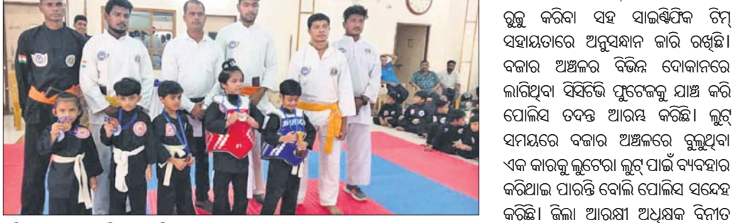
ଅତିଥି ଗଣନାରେ ବିକ୍ରମୀ ପ୍ରତିଯୋଗୀ ।

ଯାଜପୁରର ୨ୟ ପେନଟାକ୍ ସିଲ୍ୟାଟ ପ୍ରତିଯୋଗିତା ସମାପ୍ତ ହୋଇଛି । ଯାଜପୁରର ୨ୟ ପେନଟାକ୍ ସିଲ୍ୟାଟ ପ୍ରତିଯୋଗିତା ସମାପ୍ତ ହୋଇଛି । ଯାଜପୁରର ୨ୟ ପେନଟାକ୍ ସିଲ୍ୟାଟ ପ୍ରତିଯୋଗିତା ସମାପ୍ତ ହୋଇଛି ।