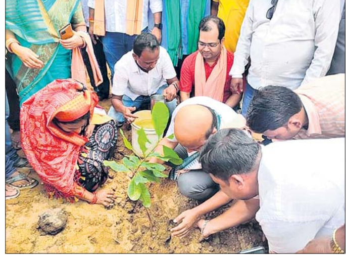
ବିଧାନ ସଭାରେ ଚାରା ପୋଷଣ କରୁଛନ୍ତି ।

କୋରେଜ ପ୍ରକଳ୍ପରୁ ବିକାଶ ପାଇଁ ପ୍ରଶ୍ନ ପାରିଛି । କୋରେଜ ପ୍ରକଳ୍ପରୁ ବିକାଶ ପାଇଁ ପ୍ରଶ୍ନ ପାରିଛି । କୋରେଜ ପ୍ରକଳ୍ପରୁ ବିକାଶ ପାଇଁ ପ୍ରଶ୍ନ ପାରିଛି । କୋରେଜ ପ୍ରକଳ୍ପରୁ ବିକାଶ ପାଇଁ ପ୍ରଶ୍ନ ପାରିଛି । କୋରେଜ ପ୍ରକଳ୍ପରୁ ବିକାଶ ପାଇଁ ପ୍ରଶ୍ନ ପାରିଛି । କୋରେଜ ପ୍ରକଳ୍ପରୁ ବିକାଶ ପାଇଁ ପ୍ରଶ୍ନ ପାରିଛି ।