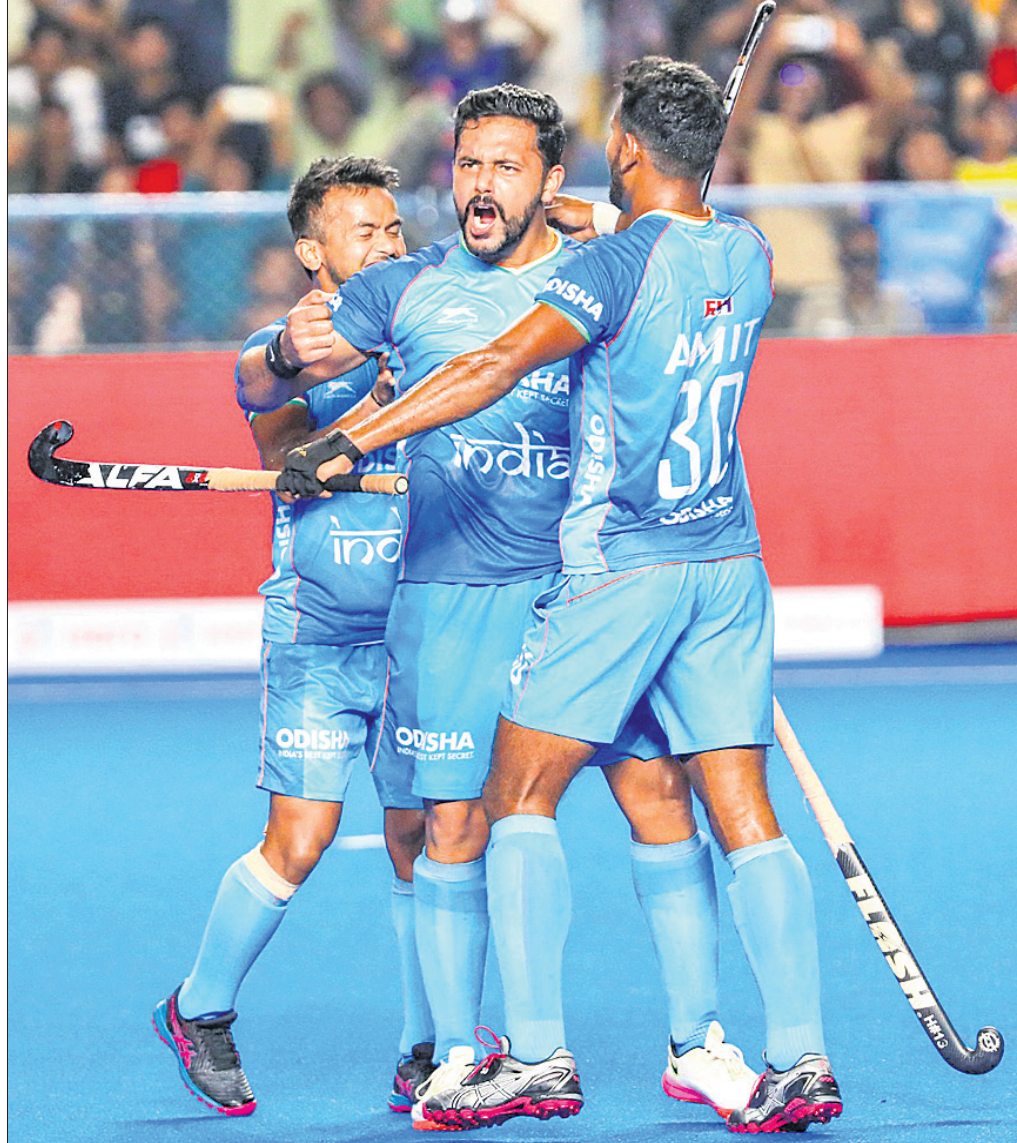
ପାକିସ୍ତାନ ବିପକ୍ଷରେ ଗୋଲ ଖୋର କରିବାପରେ ଭାରତ ଅଧିନାୟକ ହରମନପ୍ରୀତ ସିଂଲ୍ ସାଥୀ ଖେଳାଳି ବଧୈକ ଜଣାଉଛନ୍ତି।