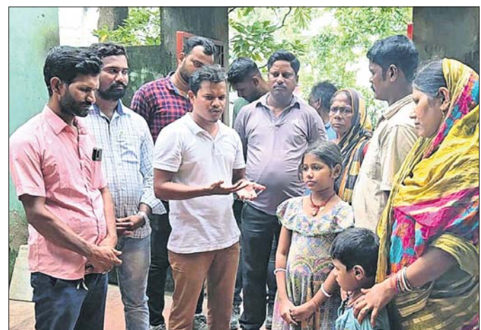
ବିଦ୍ୟୁତ୍ କର୍ମଚାରୀ ମହାସଂଘ ପକ୍ଷରୁ ଲୋକଙ୍କୁ ସଚେତନ କରାଯାଇଛି ।

ବିଦ୍ୟୁତ୍ କର୍ମଚାରୀ ମହାସଂଘ ପକ୍ଷରୁ ଲୋକଙ୍କୁ ସଚେତନ କରାଯାଇଛି । ବିଦ୍ୟୁତ୍ କର୍ମଚାରୀ ମହାସଂଘ ପକ୍ଷରୁ ଲୋକଙ୍କୁ ସଚେତନ କରାଯାଇଛି । ବିଦ୍ୟୁତ୍ କର୍ମଚାରୀ ମହାସଂଘ ପକ୍ଷରୁ ଲୋକଙ୍କୁ ସଚେତନ କରାଯାଇଛି ।