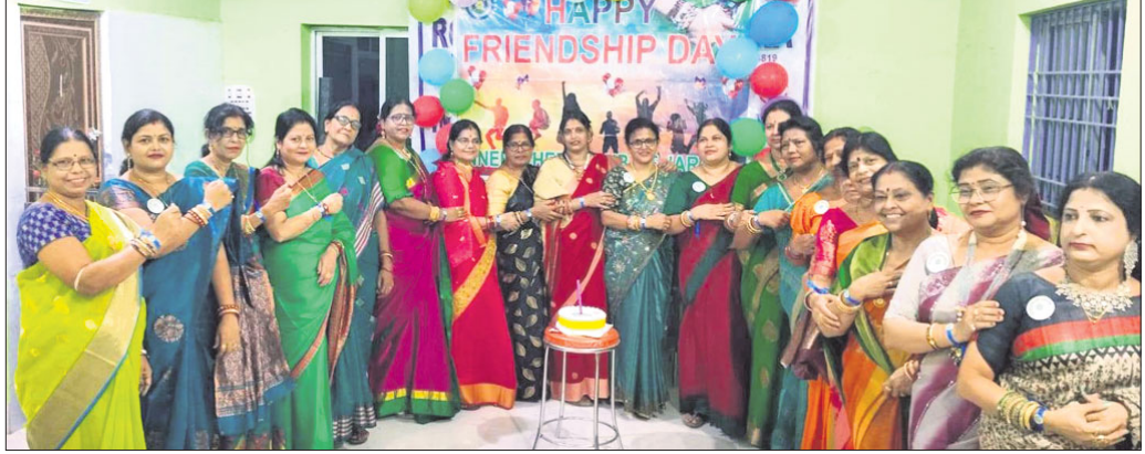
ବନ୍ଧୁତା ଦିବସରେ ସାମିଲ ହୋଇଥିବା ଲନରହୁଇଲ କୁଟ୍ ସଦସ୍ୟମାନେ ।