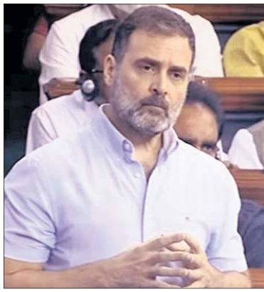
ଲୋକ ସଭାରେ ଉଦ୍‌ବୋଧନ ଦେଉଛନ୍ତି କଂଗ୍ରେସ ଏମ୍‌ପି ରାହୁଲ ଗାନ୍ଧୀ।

ନୂଆଦିଲ୍ଲୀ, ୯।୮ (ପି.ଟି.) ଭାଜପାର ରାଜନୀତି ମଣିପୁରରେ ଭାରତ ମାତାକୁ ହତ୍ୟା କରିଛି ବୋଲି ରୁଧ୍ରବାର କଂଗ୍ରେସ ନେତା ରାହୁଲ ଗାନ୍ଧୀ ଅଭିଯୋଗ ଆଣିଛନ୍ତି। ଏଥିସହ ଶାସକ ଦଳର ସଦସ୍ୟମାନଙ୍କୁ ସେ ବିଶ୍ୱାସଘାତକ ଭାବେ ଅଭିହିତ କରି ଏହି ଉତ୍ତର-ପୂର୍ବ ରାଜ୍ୟରେ ହିଂସା ରୋକିବାରେ ବିଫଳ ହୋଇଥିବା ମୋଦି ସରକାରଙ୍କୁ କଡ଼ା ସମାଲୋଚନା କରିଛନ୍ତି। ୨୬ ବିରୋଧୀ ଦଳକୁ ନେଇ ଗଠିତ ଇଣ୍ଡିଆନ୍ ନ୍ୟାଶନାଲ ଡେଭେଲପମେଣ୍ଟଲ ଇନ୍‌କୁୟିଭ ଆଲୀଏନ୍ସ (ଇଣ୍ଡିଆ) ପକ୍ଷରୁ ଲୋକ ସଭାରେ ଜାତୀୟ ଗଣତାନ୍ତ୍ରିକ ମେଣ୍ଟ (ଏନ୍‌ଡିଏ) ସରକାର ବିରୋଧରେ ଆଗତ ଅନାଗ୍ନୀ ପ୍ରସ୍ତାବ ଉପରେ ବିତର୍କର ଦ୍ୱିତୀୟ ଦିନ ରାହୁଲ ନିଜ ବକ୍ତବ୍ୟ ରଖିଛନ୍ତି। ସଦସ୍ୟତା ଫେରିପାଇବା ପରେ ରାହୁଲ ପ୍ରଥମ ଥର ପାଇଁ ଗୃହରେ କହିଛନ୍ତି, ପ୍ରଧାନମନ୍ତ୍ରୀ ନରେନ୍ଦ୍ର ମୋଦି ମଣିପୁର ଯାଉନାହାନ୍ତି। କାରଣ ସେ ଏହି ରାଜ୍ୟକୁ ଭାରତରୁ ଭିନ୍ନ ଏକ ଅଂଶ ବୋଲି ବିବେଚନା କରୁଛନ୍ତି। ରାବଣ ଯେମିତି କେବଳ ମେଘନାଦ