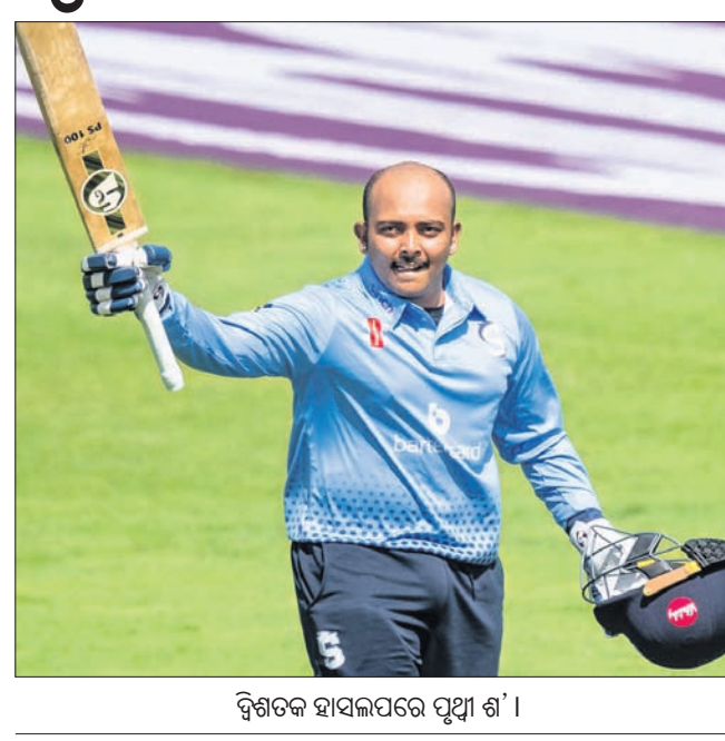
ଦ୍ୱିଶତକ ହାସଲପରେ ପୃଥ୍ୱୀ ଶ'।

ଭାରତୀୟ ଦଳରୁ ଦୂରରେ ଥିବା ଓପନର ପୃଥ୍ୱୀ ଶ କାଉଣ୍ଟିରେ ଦ୍ୱିଶତକ ହାସଲ କରିଛନ୍ତି।