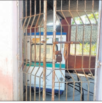
ଅଚଳ ହୋଇ ପଡ଼ିଥିବା ଜେନେରେଟର ।