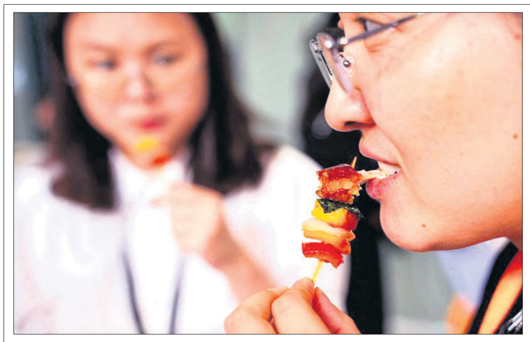
ସେଇଏକ୍ ପକ୍ଷରୁ ଲାଭରେ ପ୍ରସ୍ତୁତ ମାଂସକୁ ସାଂଘାୟିକ କମ୍ପାନୀର ଏକ ପାଣିପିନ୍ଧିରେ ଜଣେ ମହିଳା ଖାଇଛନ୍ତି।