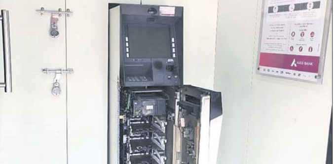
୧୧ ମାସ ୧୮ ଦିନରେ ଲୁଟି ନେଇ ଲୁଟ୍ ହୋଇଛି ।