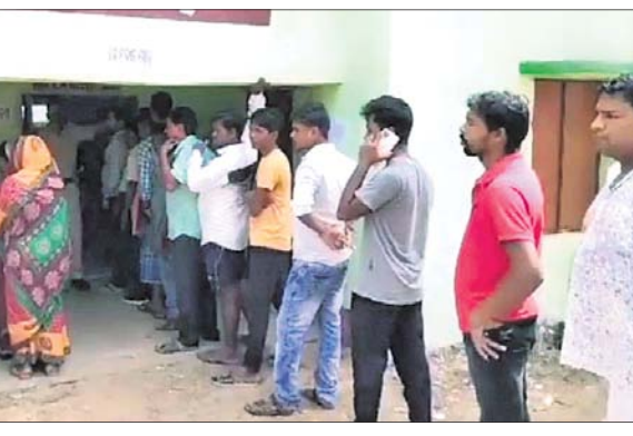
ମତଦାବ୍ୟ ପ୍ର କରିବାକୁ ଭୋଟରମାନେ ଲମ୍ପା ଧାଡ଼ିରେ ଛିଡ଼ା ହୋଇଛନ୍ତି ।