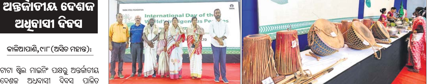
ଆଦିବାସୀଙ୍କୁ ବିଜ୍ଞାନ କଳାକୁ ପ୍ରଦର୍ଶନ କରାଯାଇଛି ।

ଆଦିବାସୀଙ୍କୁ ବିଜ୍ଞାନ କଳାକୁ ପ୍ରଦର୍ଶନ କରାଯାଇଛି । ଆଦିବାସୀଙ୍କୁ ବିଜ୍ଞାନ କଳାକୁ ପ୍ରଦର୍ଶନ କରାଯାଇଛି । ଆଦିବାସୀଙ୍କୁ ବିଜ୍ଞାନ କଳାକୁ ପ୍ରଦର୍ଶନ କରାଯାଇଛି ।