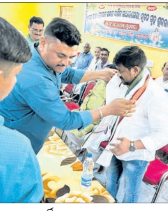
ଗୋପାଳ ସମାଜର ବାର୍ଷିକ ଉତ୍ସବରେ ଯୋଗ ଦେଇଥିବା ଅତିଥି ।