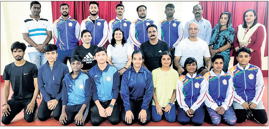
କର୍ମକର୍ତ୍ତାଙ୍କ ସହ ଇଣ୍ଡିପେଣ୍ଡେଣ୍ଟ କପ୍ କ୍ରୀଡା ପ୍ରତିଯୋଗୀ।

ଦିଲ୍ଲୀର ଚାଲିଗୋଟୋ ଇନ୍‌ଡୋର ଷ୍ଟାଡ଼ିୟମରେ ଶୁକ୍ରବାରଠାରୁ ୧୩ ତାରିଖ ପର୍ଯ୍ୟନ୍ତ ସର୍ବଭାରତୀୟ ଇଣ୍ଡିପେଣ୍ଡେଣ୍ଟ କପ୍ କ୍ରୀଡା ପ୍ରତିଯୋଗିତା ଅନୁଷ୍ଠିତ ହେବ। ଏଥିରେ ଓଡ଼ିଶାରୁ ୨୭ ପ୍ରତିଯୋଗୀ ଅଂଶଗ୍ରହଣ କରିବେ। ଏମାନଙ୍କ