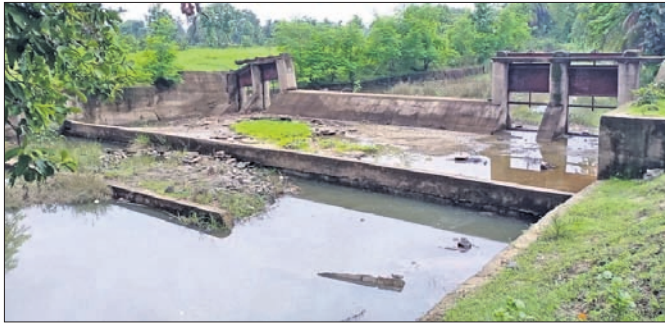
କେସିଙ୍ଗା ବ୍ଲକର କନ୍ଧାରପଦର ଅଟଳ ଚେକ୍‌ଡ୍ୟାମ୍।

କଳାହାଣ୍ଡି ଜିଲ୍ଲା କେସିଙ୍ଗା ବ୍ଲକରେ କ୍ଷୁଦ୍ର କଳସେଚନ ଅଟଳ ବିଭାଜନ ତଥା ଓଡ଼ିଶା ସରକାର ଜଳସମ୍ପଦ ବିଭାଗ ଦ୍ୱାରା ୨୦୧୭-୧୮ରେ ମୁଖ୍ୟମନ୍ତ୍ରୀ ଆଦିବନ୍ଧ ଡିଆରି ଯୋଜନାରେ ଚେକ୍‌ଡ୍ୟାମ୍ ନିର୍ମାଣ କାର୍ଯ୍ୟ ହୋଇଥିଲା। ବ୍ଲକର ସେକ୍ଟର- ୧ରେ ୪୯ଟି ଚେକ୍‌ଡ୍ୟାମ୍ ଏବଂ କଳାପୁଣ୍ଡା ସେକ୍ଟର ଅଧୀନ ବ୍ଲକର ରୁଖୁଲ, ହାତାଖୋଳ, ବେଲଖଣ୍ଡି, ଅମାଠ ଅଞ୍ଚଳରେ ୬ଟି ମୋଟ ୫୫ଟି ଚେକ୍‌ଡ୍ୟାମ୍ ନିର୍ମାଣ ହୋଇଛି। କେସିଙ୍ଗା ସେକ୍ଟରରେ ନିର୍ମାଣ ୪୯ଟି ଚେକ୍‌ଡ୍ୟାମ୍ ମଧ୍ୟରୁ ୧୩ଟି ଚେକ୍‌ଡ୍ୟାମ୍ ନିର୍ମାଣର କାମ ଓ ଲାଗୁତାପକନିତ ବନ୍ୟାରେ ଭାଙ୍ଗି ଯାଇଛି। ୩୬ଟି ଚେକ୍‌ଡ୍ୟାମ୍ ଗାର୍ଡ଼ିଆଲ, ସ୍ଲାପ, ଟ୍ରଙ୍କର ଭାଙ୍ଗି ଯାଇ ନଷ୍ଟ ହୋଇଛି। ଫଳରେ ବର୍ଷା ଜଳ ଗଚ୍ଛିତ ହୋଇ ନ ରହୁଥିବାରୁ ଚାଷୀମାନେ ଚାଷ କରିବାରେ ଅସୁବିଧାର ସମ୍ମୁଖୀନ ହେଉଛନ୍ତି। ବ୍ଲକରେ ୪୯ଟି ଚେକ୍‌ଡ୍ୟାମ୍‌ର ହାରାହାରି ୨୮ଲକ୍ଷ