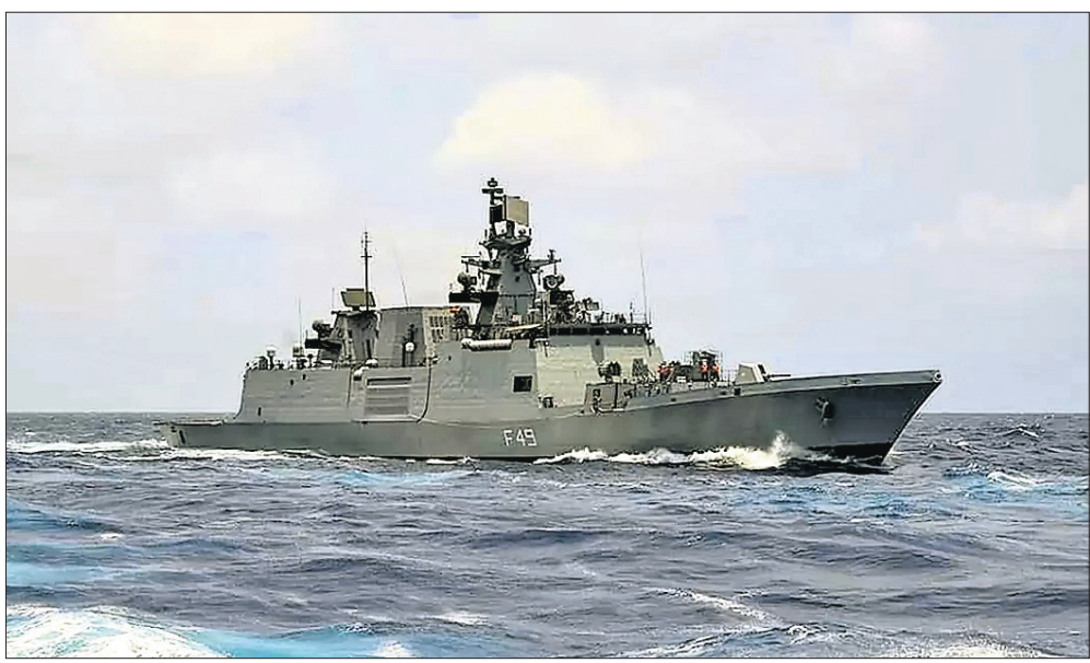
ଅଷ୍ଟ୍ରେଲିଆର ସିନ୍ଦ୍ୱା ଉପକୂଳରେ ହେବାକୁ ଥିବା ନିକଟ ସମବାକ୍ୟସ 'ମାଲାବାର ୨୦୨୩' ପାଇଁ ଭାରତୀୟ ନୌସେନାର ପ୍ରଫୁଲ୍ଲଭାନ ଯୁଦ୍ଧକାହାଣୀ ଆଇଏନ୍ଏସ୍ ସହାୟତା ପ୍ରଦାନ କରୁଛି।