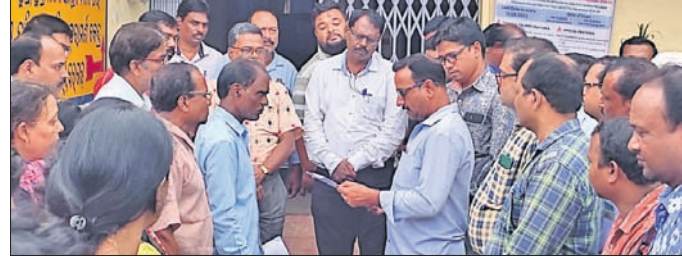
ଅତିରିକ୍ତ ବ୍ଲକ୍ ଶିକ୍ଷା ଅଧିକାରୀଙ୍କୁ ସ୍ୱାଗତକ୍ରମ ପ୍ରଦାନ କରୁଛନ୍ତି ।