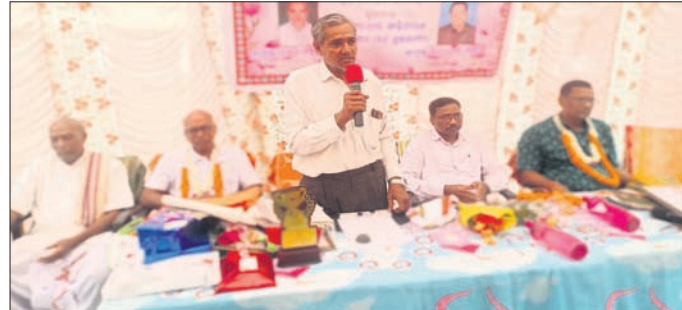
କାର୍ଯ୍ୟକ୍ରମରେ ମଞ୍ଚାଧୀନ ଅତିଥିବୃନ୍ଦ ।