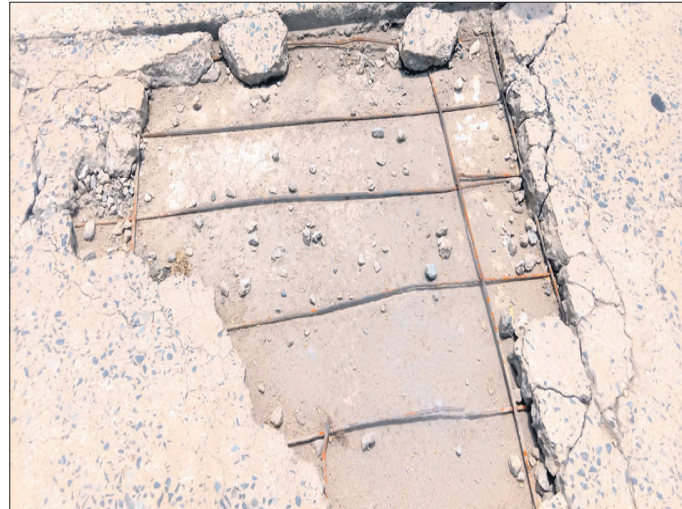
ଗୋଡ଼ଭାଗା- ସୋନପୁର ୪୪ ନମ୍ବର ରାଜ୍ୟ ରାଜପଥର ଗଠରୁମୁମ ଜିରା ନଦୀ ପୋଲ ଉପରେ ଗର୍ଭ ହୋଇ ରତ୍ ବାହାରି ପଡ଼ିଛି ।

ବରଗଡ଼ ଜିଲ୍ଲା ଭେଡ଼େନ ବ୍ଲକ ଅନ୍ତର୍ଗତ ତଥା ଗୋଡ଼ଭାଗା-ସୋନପୁର ୪୪ ନମ୍ବର ରାଜ୍ୟ ରାଜପଥର ଗଠରୁମୁମ ଜିରା ନଦୀ ପୋଲ ଛାତରେ ବଡ଼ ଗର୍ଭ ସୃଷ୍ଟି ହୋଇଛି । ଆବଶ୍ୟକ ମରାମତି ଅଭାବରୁ ସେହି ଗର୍ଭଗୃହିକ ଗଭୀର ହୋଇଛାତର ସେହି ଗର୍ଭଗୃହିକ ଗଭୀର ବାହାରି ପଡ଼ିଛି । ଅପରପକ୍ଷେ ଉଚ୍ଚ ଗର୍ଭରେ ପାଣି ଜମି ରହୁଥିବାରୁ ଗାଡ଼ି ଗୁଡ଼ିକ କାଣି ନପାରି ଲୋକେ ଦୁର୍ଘଟଣାର ସମ୍ମୁଖୀନ ହେଉଛନ୍ତି । ଏପରିକି ବିଗତ ଦୁଇ ବର୍ଷ ମଧ୍ୟରେ ଏଠାରେ ୪ଜଣଙ୍କର ମୃତ୍ୟୁ ହୋଇଥିବା ବେଳେ ଅନେକ ବାଲକ ଆରେହା ଦୁର୍ଘଟଣାର ସମ୍ମୁଖୀନ ହୋଇ ଗୁରୁତର ହୋଇଛନ୍ତି । ଘ୍ନାନୀୟ ଲୋକେ ଏ ନେଇ ପୂର୍ବ ବିଚାରଣ ଦୃଷ୍ଟି ଆକର୍ଷଣ କରିଥିଲେ ବି କୌଣସି ପ୍ରତିକାର ବ୍ୟବସ୍ଥା ଗ୍ରହଣ କରାଯାଇ ନାହିଁ ।