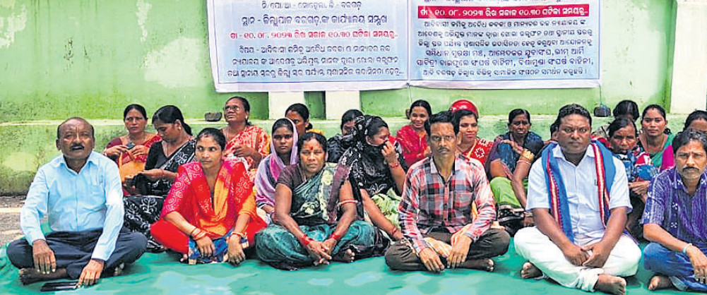
ଜିଲ୍ଲାପାଳଙ୍କ ଅଧିକ ଆଗରେ ଅନଶନ ଚାଲିଛି ।

ଅନୁସୂଚୀତ ଜନଜାତି (ଆଦିବାସୀ) ଲୋକଙ୍କ ସରକାରୀ ସୁଯୋଗ ନେଇ ସେମାନଙ୍କ ଜମିକୁ କିଛି ମୁଷ୍ଟିମେୟ ଲୋକ ଶୋଚନୀୟ ହୋଇ ପଡ଼ିଥିଲା । ପଡ଼ାବାସୀ ବରଗଡ଼ ବିଧାନସଭା ଦୃଷ୍ଟି ଆକର୍ଷଣ ପରେ ମୁଖ୍ୟମନ୍ତ୍ରୀ ସ୍ୱତନ୍ତ୍ର ଅନୁଦାନ ପାଖିରୁ ୯ଲକ୍ଷ ଟଙ୍କା ମଞ୍ଜୁର ହୋଇଥିବା ପଞ୍ଚାୟତ ସମିତି ତରଫରୁ ସୂଚନା ପ୍ରଦାନ କରାଯାଇଛି ।