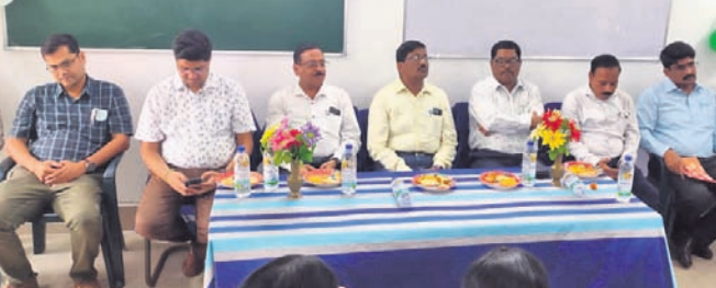
ଜାତୀୟ କୃମିନାଶ ଦିବସରେ ଆୟୋଜିତ କାର୍ଯ୍ୟକ୍ରମରେ ମଞ୍ଚାସୀନ ଅତିଥି।