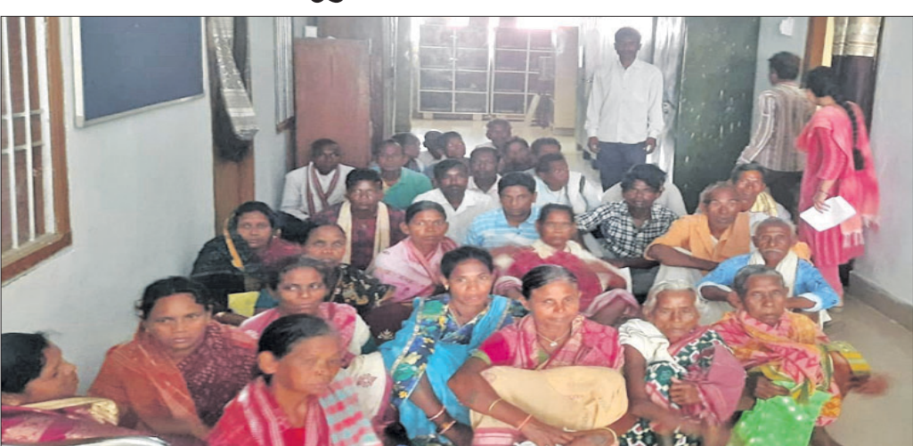
ଲୋକମାନେ ବିତିଓଙ୍କ ଅଧିକ ସମ୍ମୁଖରେ ଧାରଣାରେ ବସିଛନ୍ତି ।