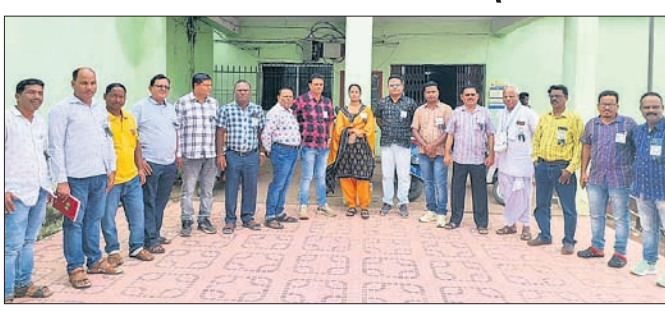
ଭବାନୀପାଟଣା ପିଲୁ ସଂଘ ପକ୍ଷରୁ କଳାବ୍ୟାଜ ପରିଧାନ।

ନିଖୁଳ ଉତ୍କଳ ପଞ୍ଚାୟତ କାର୍ଯ୍ୟ ନିର୍ବାହୀ ଅଧିକାରୀ (ପିଲୁ)ରାଜ୍ୟ ସଂଘ ନିର୍ଦ୍ଦେଶକ୍ରମେ ୨ ଦିନ ଦାବି ନେଇ ୨୭ ତାରିଖଠାରୁ କଳାହାଣ୍ଡି ଜିଲ୍ଲାର ୧୩ଟି ବ୍ଲକରେ କାର୍ଯ୍ୟକ୍ରମ ପିଲୁମାନେ କଳାବ୍ୟାଜ ପିଲୁ କାର୍ଯ୍ୟ କରୁଛନ୍ତି। ଏହି ଦାବି ଗ୍ରହଣକରେ ଶିକ୍ଷାଗତ ଯୋଗ୍ୟତା ଯୁକ୍ତ ୨୭ ଯୁକ୍ତ ମାତ୍ର ବୃଦ୍ଧି କରିବା ଓ ଲେବେଲ- ୫ରୁ ଲେବେଲ-୯କୁ ବଦଳାଇ ବୃଦ୍ଧି କରିବା, ୧୦ବର୍ଷ ଚାକିରୀ ପୂରଣ କରିଥିବା ପିଲୁମାନଙ୍କୁ ଡିପିଡିଓ ଭାବେ ଶତ ପ୍ରତିଶତ ପ୍ରମୋଦନ ଦେବା ଆଦି ରହିଛି। ଆସନ୍ତା ୧୭ ତାରିଖ ସୁଦ୍ଧା ସରକାର ଦାବି ପୂରଣ ନ କଲେ ୧୮ ତାରିଖରୁ ରାଜରାସ୍ଥରେ ଆନ୍ଦୋଳନ କରିବେ ବୋଲି