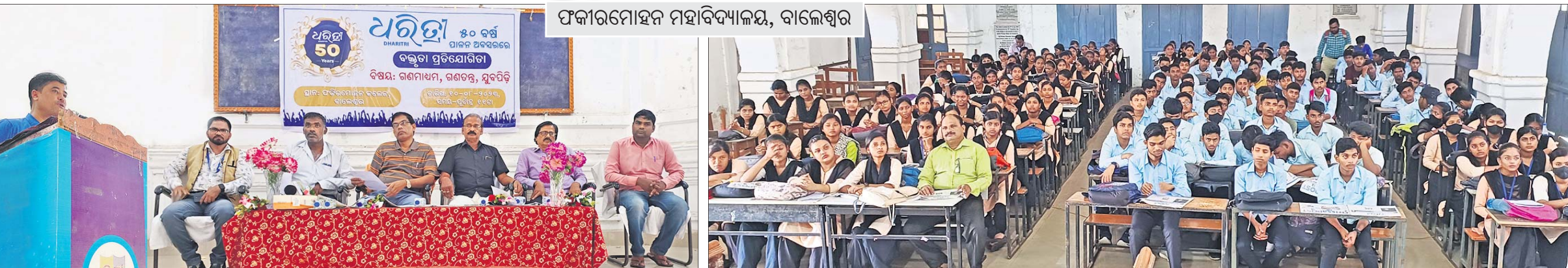
ଫକୀରମୋହନ ମହାବିଦ୍ୟାଳୟ, ବାଲେଶ୍ୱର

ବାଲେଶ୍ୱର, ୧୦।୮(ମାନସ ବିଶ୍ୱାଳ) ସର୍ବଦୁହର ଗଣତାନ୍ତ୍ରିକ ରାଷ୍ଟ୍ର ଭାରତର ସିଂହଭାଗ ହେଉଛି ସୁବର୍ଣ୍ଣ ପ୍ରତିଯୋଗିତା। ଆମ ଦେଶର ପ୍ରତ୍ୟେକ ନାଗରିକ ସୁବାବସ୍ଥାକୁ ଗଣତନ୍ତ୍ର ଅଧିକାର, ଦାୟିତ୍ୱ ଓ କର୍ତ୍ତବ୍ୟ ପ୍ରତି ସଚେତନ ରହିଥାନ୍ତି। ତେଣୁ ସୁବର୍ଣ୍ଣ ପ୍ରତିଯୋଗିତା ଗଣତନ୍ତ୍ର ଅଭିଯୋଗ ଆଖ୍ୟା ଦିଆଯାଇପାରେ। ସୁବର୍ଣ୍ଣ ପ୍ରତିଯୋଗିତା ହେଉଛି ପରିବର୍ତ୍ତନର ଅକ୍ଷୟ ଶକ୍ତି। ଏମାନେ ହିଁ ଗଣତନ୍ତ୍ରକୁ ସୁଦୃଢ଼ କରିବାର ଅଗ୍ରଗାମୀ ହୋଇପାରିବେ ବୋଲି ବାଲେଶ୍ୱର ଜିଲ୍ଲା ଫକୀରମୋହନ ମହାବିଦ୍ୟାଳୟରେ ରୁକୁବାର ‘ଧରିତ୍ରୀ’ର ୫୦ ବର୍ଷ ଉପଲକ୍ଷେ ଆୟୋଜିତ ‘ଗଣମାଧ୍ୟମ, ଗଣତନ୍ତ୍ର, ସୁବର୍ଣ୍ଣ ପ୍ରତିଯୋଗିତା’ ଶୀର୍ଷକ ବକ୍ସତା ପ୍ରତିଯୋଗିତାରେ ଉପସ୍ଥିତ ଅତିଥିମାନେ ମତବ୍ୟକ୍ତ କରିଛନ୍ତି। ଏହି କାର୍ଯ୍ୟକ୍ରମରେ ଅତିଥିବାଚେ