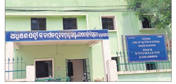
ଭବାନୀପାଟଣାସ୍ଥିତ ପିଡିଓଓଡିଏସ୍ ଜିଲ୍ଲା ଅଧିକାରୀଙ୍କ ବାବାଙ୍କ ପୂର୍ବ ବିଭାଗ।

କଳାହାଣ୍ଡି ଜିଲ୍ଲା ଭବାନୀପାଟଣାସ୍ଥିତ ପୂର୍ବ ବିଭାଗରେ ଅନେକ ପଦବୀ ଖାଲି ପଡିଥିବାରୁ ଏବେ କାର୍ଯ୍ୟରେ ବାଧା ସୃଷ୍ଟି ହେଉଛି। ମିଳିଥିବା କର୍ମଚାରୀ ଅନୁଯାୟୀ, ଜିଲ୍ଲାରେ ୩ଟି ଏଡିପିଏସ୍ ପଦବୀ ଖାଲିପଡିଛି। ସେଗୁଡିକ ହେଲା ଏମ୍. ରାମପୁର ସବଡିଭିଜନ, କେସିଙ୍ଗା ସବଡିଭିଜନ ଓ ବିଲଡିଙ୍ଗ ସର୍ (୨) ଡିଭିଜନର ଏସଡିଓ ପଦବୀ ଖାଲିପଡିଛି। କେସିଙ୍ଗା ଏସଡିଓ ଯାଜପୁରକୁ ଡେପୁଟିଗେସନରେ ଯାଇଥିବା ଓ ଏମ୍. ରାମପୁର ସବଡିଭିଜନ ଏସଡିଓ ଜିଆରଏସ ନେଲସିନାକୁ ପଦବୀ ଖାଲିପଡିଛି। ସେହିପରି କୁନାଗଡ ସବଡିଭିଜନ ଏସଡିଓ ଜିଲ୍ଲା କାର୍ଯ୍ୟାଳୟର ଇଣ୍ଟିଗ୍ରେସନ୍ ଭାବେ ଦାୟିତ୍ୱ ଭୁଲାଇଛନ୍ତି। ଜିଲ୍ଲାରେ ସମୁଦାୟ ୨୫ଟି କନିଷ୍ଠ ଯନ୍ତ୍ରୀ ପଦବୀ ରହିଥିବାବେଳେ ସେଥିମଧ୍ୟରୁ