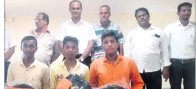
ସମର୍ଥନ କାର୍ଯ୍ୟକ୍ରମରେ ଉପସ୍ଥିତ ଅତିଥି ।