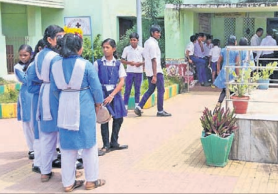
ମଧ୍ୟାହ୍ନଭୋଜନ ପାଇଁ ଆଲିଧରି ଗୁରୁଜି ଛାତ୍ରାଛାତ୍ରୀ ।