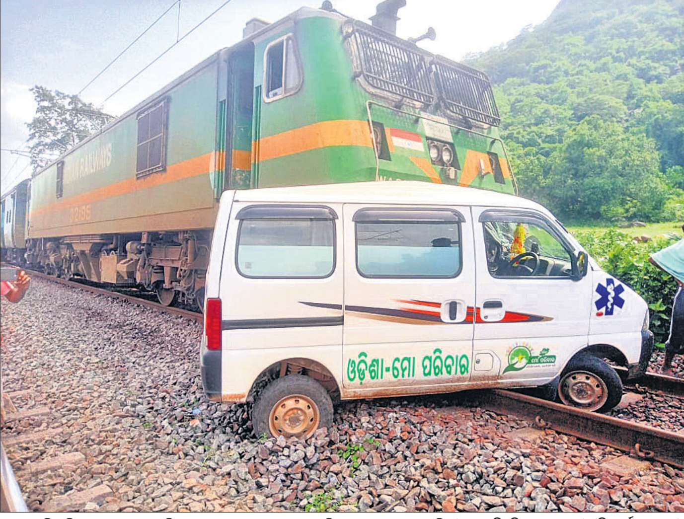
ରାୟଗଡ଼ା ଜିଲ୍ଲା ବିସମକଚକ ବୁକ୍ ବୁଦ୍ଧାବାଡ଼ିଠାରେ ଗୁରୁବାର ଏକ ଆୟୁର୍ବିଦ୍ୟାଳୟ ଉପସ୍ଥାପନା ଏକ ପ୍ରସ୍ତାବ ଧାର୍ଯ୍ୟ ହେଉଛି। (ରିପୋର୍ଟ: ପୃଷ୍ଠା-୪)