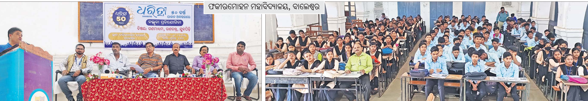
ଫକୀରମୋହନ ମହାବିଦ୍ୟାଳୟ, ବାଲେଶ୍ୱର

ବାଲେଶ୍ୱର, ୧୦।୮ (ମାନସ ବିଶ୍ୱାଳ) ସର୍ବଦୁହର ଗଣତାନ୍ତ୍ରିକ ରାଷ୍ଟ୍ର ଭାରତର ସିଂହଭାଗ ହେଉଛି ସୁବର୍ଣ୍ଣ ପ୍ରତିଯୋଗିତା। ଆମ ଦେଶର ପ୍ରତ୍ୟେକ ନାଗରିକ ସୁବାବସ୍ଥାକୁ ଗଣତନ୍ତ୍ର ଅଧିକାର, ଦାୟିତ୍ୱ ଓ କର୍ତ୍ତବ୍ୟ ପ୍ରତି ସଚେତନ ରହିଥାନ୍ତି। ତେଣୁ ସୁବର୍ଣ୍ଣ ପ୍ରତିଯୋଗିତା ଗଣତନ୍ତ୍ର ଅଭିଯୋଗ ଆଖ୍ୟା ଦିଆଯାଇପାରେ। ସୁବର୍ଣ୍ଣ ପ୍ରତିଯୋଗିତା ହେଉଛି ପରିବର୍ତ୍ତନର ଅକ୍ଷୟ ଶକ୍ତି। ଏମାନେ ହିଁ ଗଣତନ୍ତ୍ରକୁ ସୁଦୃଢ଼ କରିବାର ଅଗ୍ରଗାମୀ ହୋଇପାରିବେ ବୋଲି ବାଲେଶ୍ୱର ଜିଲ୍ଲା ଫକୀରମୋହନ ମହାବିଦ୍ୟାଳୟରେ ରୁକୁବାର ‘ଧରିତ୍ରୀ’ର ୫୦ ବର୍ଷ ଉପଲକ୍ଷେ ଆୟୋଜିତ ‘ଗଣମାଧ୍ୟମ, ଗଣତନ୍ତ୍ର, ସୁବର୍ଣ୍ଣ ପ୍ରତିଯୋଗିତା’ ଶୀର୍ଷକ ବକ୍ସତା ପ୍ରତିଯୋଗିତାରେ ଉପସ୍ଥିତ ଅତିଥିମାନେ ମତବ୍ୟକ୍ତ କରିଛନ୍ତି। ଏହି କାର୍ଯ୍ୟକ୍ରମରେ ଅତିଥିଭାବେ