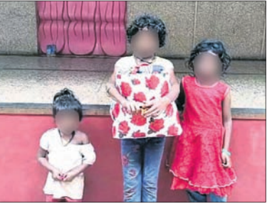
ହରିହର ମନ୍ଦିର ପ୍ରାଙ୍ଗଣରେ ଥିବା ୩ ଶିଶୁ ।

ସହ ଏକ ଲୁଚା ଭର୍ତ୍ତି ବ୍ୟାଗ ମଧ୍ୟ ଛାଡ଼ିଯାଇଥିବା ଜଣାପଡ଼ିଛି । ଶିଶୁମାନଙ୍କୁ ନିଷ୍ଠୁରତାର ସହ ଘରକୁ ନ ଫେରିବାକୁ ତୀବ୍ରତା କରିବା ସହ ଫେରିଲେ ହତ୍ୟା ଧମକ ଦେଇଥିବା ଶିଶୁମାନେ କହିଥିଲେ । ତେବେ ମନ୍ଦିର କର୍ମଚାରୀ ୩ ଶିଶୁଙ୍କୁ ମନ୍ଦିର ଭିତରକୁ ନେଇ ଖାଇବାକୁ ଦେଇ ସକାଳ ହେବା ପର୍ଯ୍ୟନ୍ତ ମା' ବାପାଙ୍କ ଆସିବା ନିମନ୍ତେ ଅପେକ୍ଷା କରିଥିଲେ । ଗୁରୁବାର ସକାଳେ କେହି ନେବାକୁ ନ ଆସିବାରୁ ମନ୍ଦିର କର୍ତ୍ତୃପକ୍ଷ ବଡ଼ବିଲ ପୋଲିସକୁ ଅବଗତ କରିଥିଲେ । ପୋଲିସ ପହଞ୍ଚି ୩ ଶିଶୁଙ୍କୁ ଉଦ୍ଧାର କରି ଥାନାକୁ