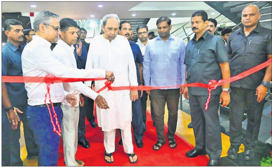
ମୁଖ୍ୟମନ୍ତ୍ରୀ ନବୀନ ପଟ୍ଟନାୟକ ଗୁରୁବାର ଇନ୍‌ଫୋସିସ୍‌ଫାରେ ବିପିଏମ୍ ଶାଖା ଉଦଘାଟନ କରୁଛନ୍ତି ।