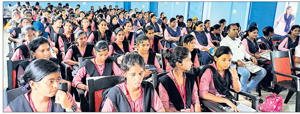
କେନ୍ଦ୍ରାପଡ଼ା ଜିଲାର ଆଳି ମହାବିଦ୍ୟାଳୟରେ ଶୁକ୍ରବାର 'ଧରିତ୍ରୀ' ପକ୍ଷରୁ ଆୟୋଜିତ 'ଗଣମାଧ୍ୟମ, ଗଣତନ୍ତ୍ର, ଯୁବପିଢ଼ି' ଶୀର୍ଷକ ବକ୍ତୃତା ପ୍ରତିଯୋଗିତାରେ ମଞ୍ଚାସୀନ ଅତିଥି ଏବଂ ଉପସ୍ଥିତ ଛାତ୍ରାଛାତ୍ରୀ ଓ ଅନ୍ୟମାନେ।