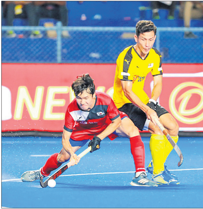
ମାଲେସିଆ ଓ ଦକ୍ଷିଣ କୋରିଆ ମଧ୍ୟରେ ଅନୁଷ୍ଠିତ ମ୍ୟାଚ ।