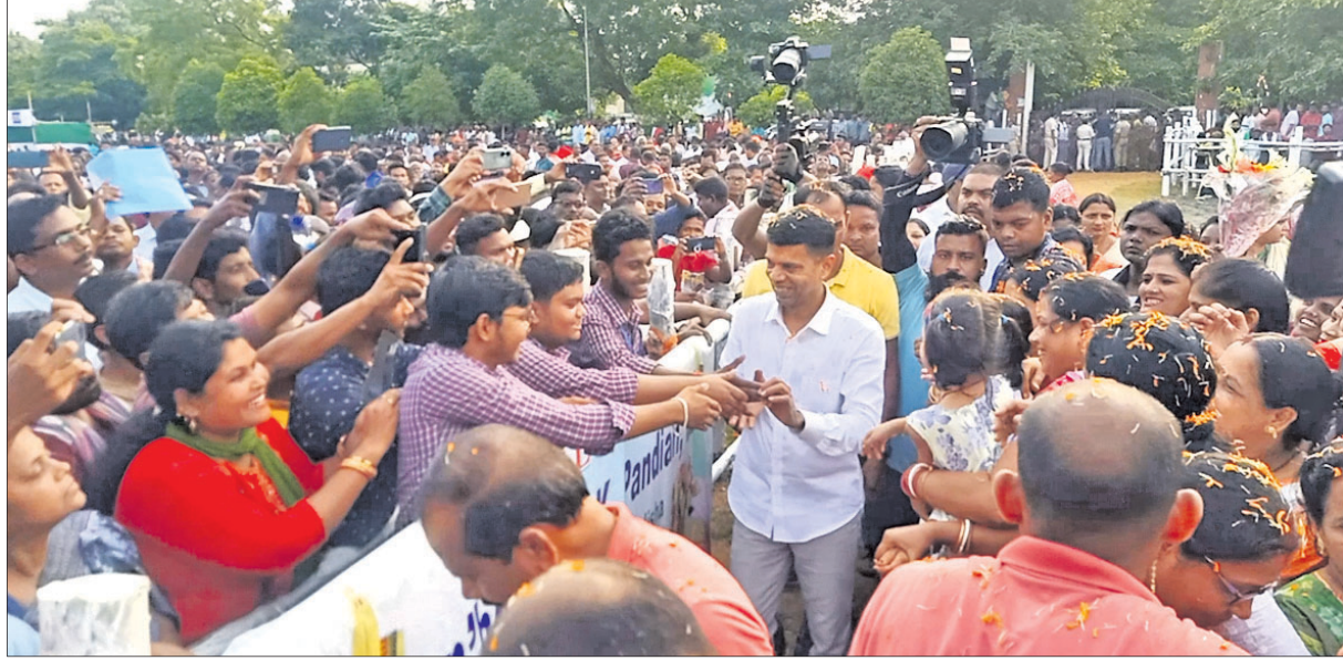
ବରିପଦାରେ ଉପସ୍ଥିତ ଛାତ୍ରଙ୍କ ସହ ହାତ ମିଳାଉଛନ୍ତି ୫-ଟି ସଚିବ ଭି.କେ. ପାଞ୍ଚିଆନ।