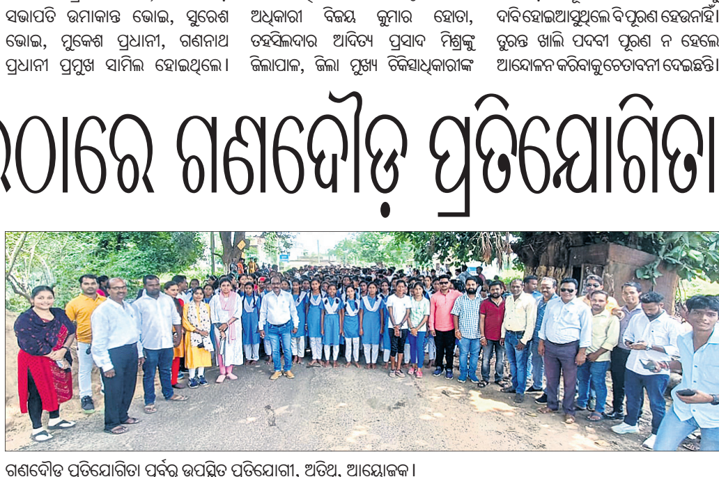
ଗଣଦୌଡ଼ ପ୍ରତିଯୋଗିତା ପୂର୍ବରୁ ଉପସ୍ଥିତ ପ୍ରତିଯୋଗୀ, ଅତିଥି, ଆୟୋଜକ।