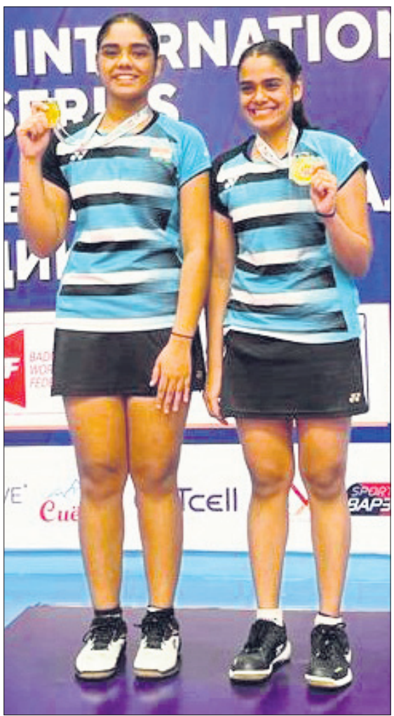
ବିତମ୍ବସ୍ୟାଏ ଚାକିକସ୍ତାନ ଅନ୍ତର୍ଜାତୀୟ ବ୍ୟାଡମିଣ୍ଟନ ସିରିଜର ମହିଳା ଚକ୍ରକୁରେ ସର୍ବ ପଦକ ଅର୍ଜନ କରିଥିବା ଓଡ଼ିଶାର ଶ୍ରେଷ୍ଠପର୍ଯ୍ୟାୟ ଉପପର୍ଯ୍ୟାୟ ପଞ୍ଚା।