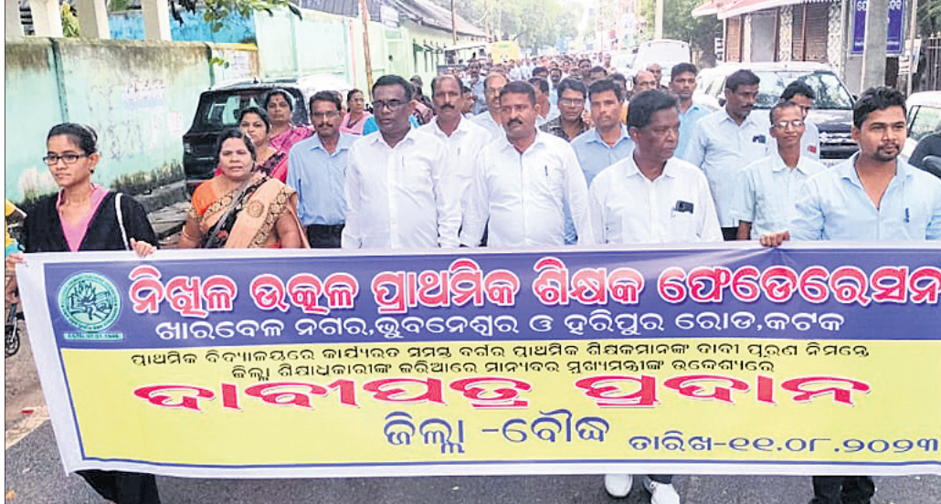
ଦାବିପତ୍ର ଦେବା ପାଇଁ ଶିକ୍ଷକ ସଂଘ କର୍ମକର୍ମୀମାନେ ଶୋଭାଯାତ୍ରାରେ ଯାଉଛନ୍ତି।