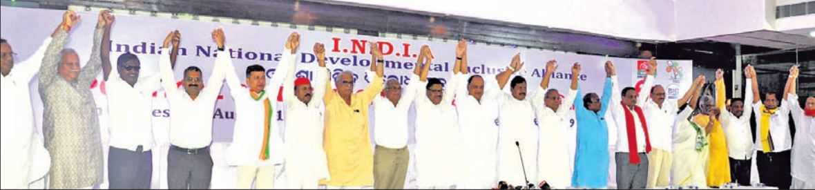
ଭୁବନେଶ୍ୱରରେ ଅନୁଷ୍ଠିତ ୧୨ ମିଳିତ ବିରୋଧୀ ଦଳ ବୈଠକରେ ଉପସ୍ଥିତ ନେତୃବୃନ୍ଦ।