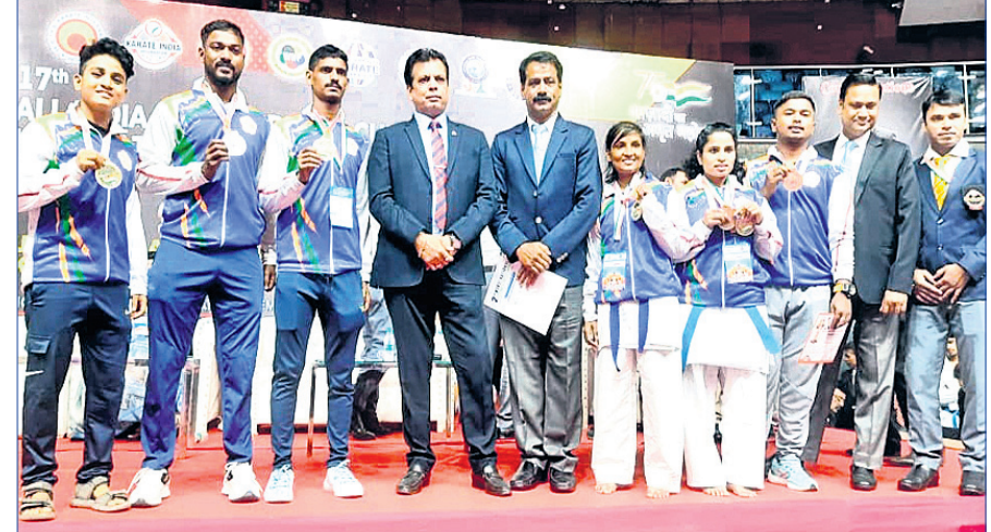
ଅର୍ଜୁନାଳୟ ପଦକ ବିଜେତା କ୍ରୀଡ଼ାତମାଙ୍କୁ ପୁରସ୍କାର ପ୍ରଦାନ କରୁଥିବା କର୍ମଚାରୀ।

ଭୁବନେଶ୍ୱର, ୧୧।୮ (ତପନ ସାହୁ) - ଦିଲ୍ଲୀର ଚାଲକୋଟ୍ସାରେ ଚାଲିଥିବା ଲକ୍ଷ୍ମପେଟେଟ୍ସ କ୍ୟୁ କ୍ରୀଡ଼ାରେ ଓଡ଼ିଶା ପ୍ରତିଯୋଗୀ ୭ ପଦକ ହାସଲ କରିଛନ୍ତି।