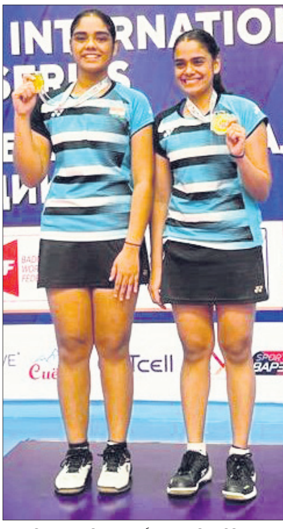
ବିତମ୍ବସ୍ୟୁଟ୍ ଚାକିକସ୍ତ୍ରୀନ ଅନ୍ତର୍ଜାତୀୟ ବ୍ୟାଡମିଣ୍ଟନ ସିରିଜର ମହିଳା ଚକ୍ରକୁରେ ସର୍ବ ପଦକ ଅର୍ଜନ କରିଥିବା ଓଡ଼ିଶାର ଶ୍ରେଷ୍ଠପର୍ଯ୍ୟା ଓ ଉଚ୍ଚପର୍ଯ୍ୟା ପଞ୍ଚା।