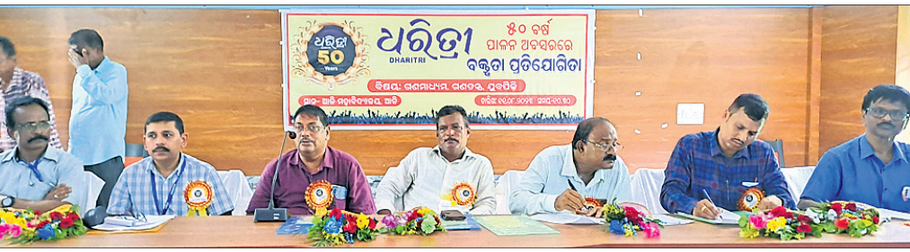
କେନ୍ଦ୍ରାପଡ଼ା ଜିଲାର ଆଳି ମହାବିଦ୍ୟାଳୟରେ ଶୁକ୍ରବାର 'ଧରିତ୍ରୀ' ପକ୍ଷରୁ ଆୟୋଜିତ 'ଗଣମାଧ୍ୟମ, ଗଣତନ୍ତ୍ର, ମୁକ୍ତିପଦ୍ମ' ଶୀର୍ଷକ ବକ୍ସିତା ପ୍ରତିଯୋଗିତାରେ ମଞ୍ଚାଧ୍ୟକ୍ଷ ଅଟେ।