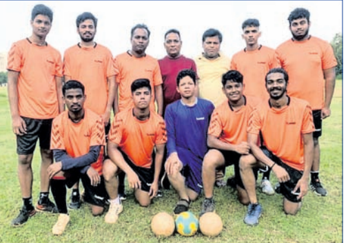
ଭୁବନେଶ୍ୱର ହ୍ୟାଣ୍ଡବଲ ଦଳ।