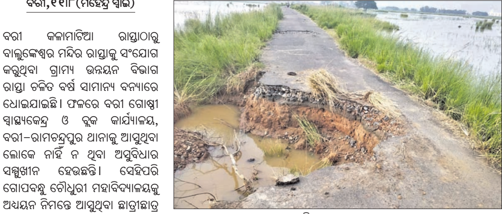
ବନ୍ୟାରେ ରାସ୍ତା ଧୋଇ ହୋଇଯାଇଛି ।

ଧର୍ମଶାଳା ବ୍ଲକର ୩,୬୮୬ ବୃଦ୍ଧାବୃଦ୍ଧ, ବିଧବା ଓ ଦିବ୍ୟାଙ୍ଗ ମଧ୍ୟମାନଙ୍କୁ ଯୋଜନାରେ ସାମିଲ ହୋଇଛନ୍ତି । ସେମାନଙ୍କୁ ଅଗଷ୍ଟ ୧୫ରେ ବ୍ଲକ ପତ୍ତଣୁ ଭଣ୍ଡା ପ୍ରଦାନ କରାଯିବ ।