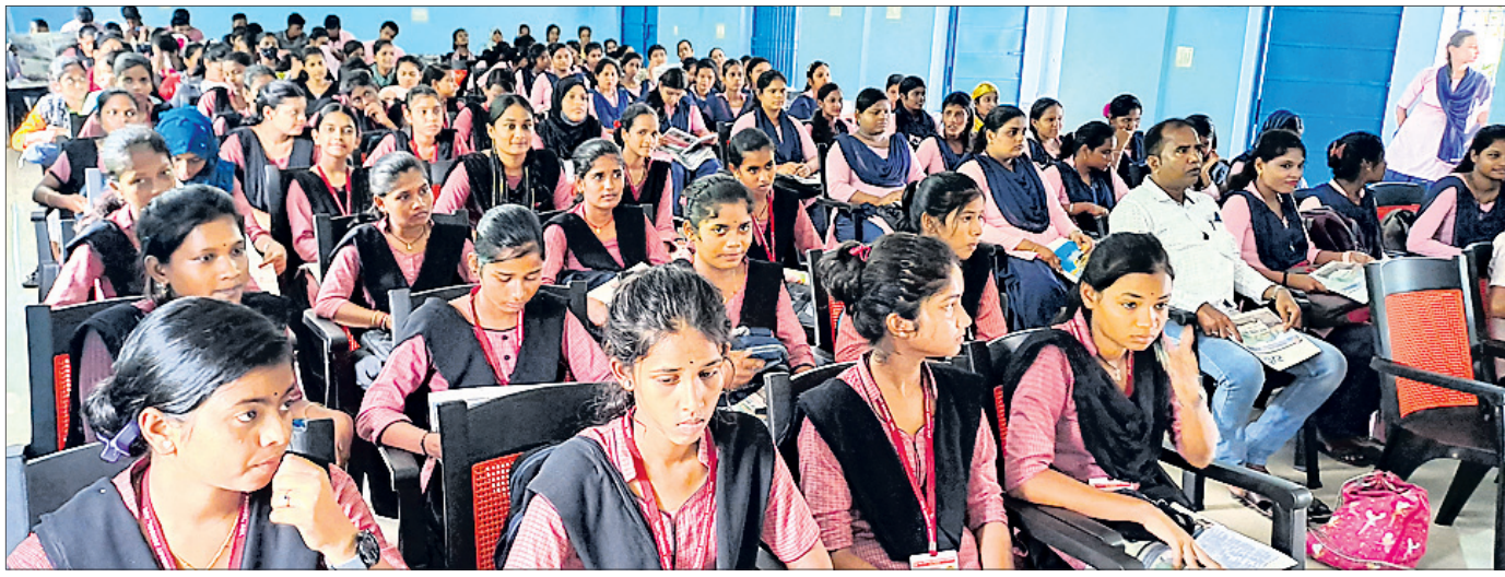
ବକ୍ସତା ପ୍ରତିଯୋଗିତାରେ ଉପସ୍ଥିତ ଛାତ୍ରାଛାତ୍ରୀ ଓ ଅନ୍ୟମାନେ।