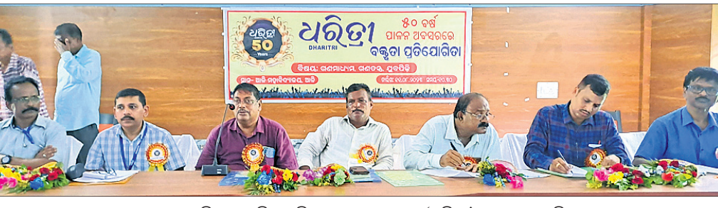
କେନ୍ଦ୍ରାପଡ଼ା ଜିଲାର ଆଳି ମହାବିଦ୍ୟାଳୟରେ ଶୁକ୍ରବାର 'ଧରିତ୍ରୀ' ପକ୍ଷରୁ ଆୟୋଜିତ 'ଗଣମାଧ୍ୟମ, ଗଣତନ୍ତ୍ର, ମୁକ୍ତିପଦ୍ମ' ଶୀର୍ଷକ ବକ୍ସତା ପ୍ରତିଯୋଗିତାରେ ମଞ୍ଚାଧ୍ୟକ୍ଷ ଅଟେ।