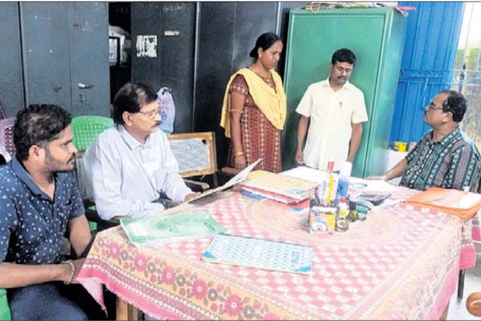
କର୍ମଚାରୀଙ୍କୁ ତାରିବ କରୁଛନ୍ତି ଅଧିକାରୀଗଣ

ଖବର ପ୍ରକାଶ ପରେ ପ୍ରଶାସନର ତତ୍ପରତା ଅଧିକାରୀମାନେ ସିଧାସଳଖ ଛାତ୍ରାଛାତ୍ରୀଙ୍କ ମୁହଁରୁ ଶୁଣିଲେ ଅଭିଯୋଗ ଶିକ୍ଷକ, ଏସ୍ଏଚଡି, ରୋଷେୟାଙ୍କୁ ତାରିବ କଲେ ଅଧିକାରୀ ଗୁହକୁ ଯାଇ ପିଲାମାନଙ୍କୁ ପଢ଼ାଇ ଥିଲେ । ଏହି ବିଦ୍ୟାଳୟରେ ଚଳିତବର୍ଷ ୧୨ରୁ ଅଧିକ ଶ୍ରେଣୀ ପର୍ଯ୍ୟନ୍ତ ୧୧୧ଜଣ ଛାତ୍ରାଛାତ୍ର ଅଧ୍ୟୟନ କରୁଛନ୍ତି । ତାକି ଅଭିଯୋଗ ବାବଦରେ ତାରିବ କରୁଛନ୍ତି । ଅଭେଦଧର୍ମାମାନଙ୍କ ରହିବାରୁ ଅଧ୍ୟାପକ ହସ୍ତେଇ ଗୁହ ନ ଥିବାରୁ ଶ୍ରେଣୀ ଗୁହରେ ରହୁଛନ୍ତି । ବାକି ୩ ଟି ଶ୍ରେଣୀ ଗୁହରେ ୮ ଟି ଶ୍ରେଣୀର ଛାତ୍ରାଛାତ୍ରୀଙ୍କୁ ପାଠ ପଢ଼ାଯାଉଛି । ୮ ଟି ଶ୍ରେଣୀର ୧୧୧ ଜଣ ଛାତ୍ରାଛାତ୍ରୀଙ୍କୁ ପାଠ ପଢ଼ାଇବା ପାଇଁ ମାତ୍ର ୩ ଜଣ ଶିକ୍ଷକ ଅଛନ୍ତି । ମଧ୍ୟାହ୍ନ ଭୋଜନରେ