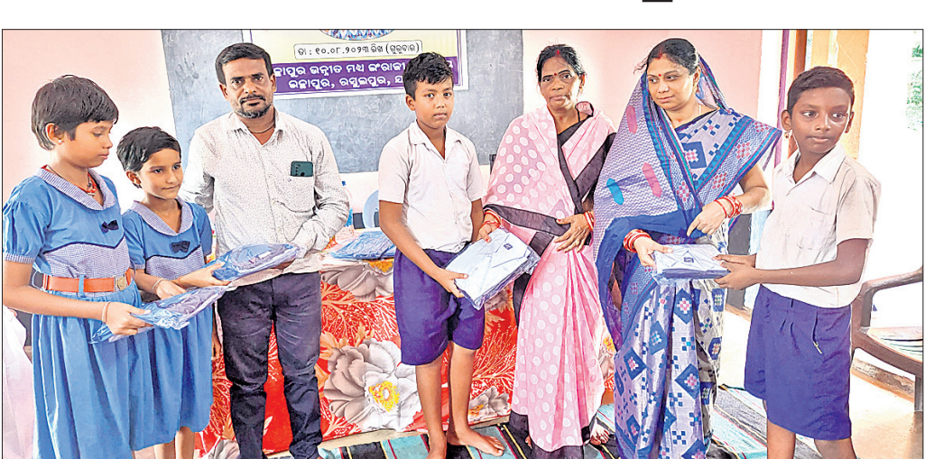
ବିଦ୍ୟାଳୟର ପ୍ରତିଷ୍ଠା ଉତ୍ସବ ଅବସରରେ ଛାତ୍ରାଛାତ୍ରୀମାନଙ୍କୁ ପୋଷାକ ବ୍ୟବସ୍ଥା କରାଯାଇଛି ।

ରଞ୍ଜନପୁର ବ୍ଲକ ଅନ୍ତର୍ଗତ ଭୋରକା ପଞ୍ଚାୟତଗ୍ଠିତ ଇଚ୍ଛାପୁର ଉନ୍ନୀତ ମଧ୍ୟ ଇଂରାଜୀ ବିଦ୍ୟାଳୟର ପ୍ରତିଷ୍ଠା ଉତ୍ସବ ପ୍ରଧାନଶିକ୍ଷୟିତ୍ରୀ ସ୍ୱେଚ୍ଛାଳତା ସେଠୀଙ୍କ ଯୋଗଦେଶରେ ଅନୁଷ୍ଠିତ ହୋଇଯାଇଛି ।