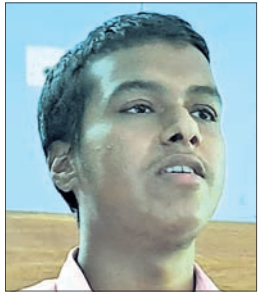
- ବିଶ୍ୱଜିତ ପାତ୍ର, ପ୍ରଥମ ବିଜେତା

ମୁକ୍ତିପଦ୍ମ ହିଁ ପୃଥ୍ୱୀର ଶ୍ରେଷ୍ଠ ଶକ୍ତି ଗଣତନ୍ତ୍ରର ସଫଳତା ପାଇଁ ଗଣମାଧ୍ୟମର ଅବଶ୍ୟକତା ରହିଛି। ଗଣମାଧ୍ୟମ ନିରପେକ୍ଷ ରହି ଖବର ପ୍ରସାରଣ କଲେ ତାହା ଗଣତନ୍ତ୍ର ପାଇଁ ମଙ୍ଗଳଦାୟକ। ମୁକ୍ତିପଦ୍ମ ଗଣତନ୍ତ୍ର ଓ ଗଣମାଧ୍ୟମ ମଧ୍ୟରେ ସଂଯୋଗ ରକ୍ଷା କରି ଦେଶକୁ ଆଗେଇ ନେଇ ପାରିବେ। ମୁକ୍ତିପଦ୍ମ ହିଁ ପୃଥ୍ୱୀର ଶ୍ରେଷ୍ଠ ଶକ୍ତି। ଦେଶ ଗଠନରେ ମୁକ୍ତିପଦ୍ମ ଉପରେ ଉତ୍ତର ଦାୟିତ୍ୱ ରହିଛି। ଧରିତ୍ରୀର ୫୦ ବର୍ଷ ଉପଲକ୍ଷେ ଆୟୋଜିତ ବକ୍ସତା ପ୍ରତିଯୋଗିତାରେ ଭାଗନେଇ ପ୍ରଥମ ସ୍ଥାନ ଅଧିକାର କରିଥିବାକୁ ନିଜକୁ ଗର୍ବିତ ଅନୁଭବ କରୁଛି।