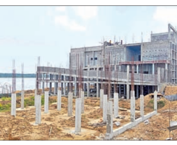
ତାମ୍ରାରେ ନିର୍ମାଣାଧୀନ କାର୍ଯ୍ୟ।

କ୍ରମ୍ଭୂମର, ୧୧।୮ (ସୁଭାଷ ପାଠୀ) ଗଞ୍ଜାମ ଜିଲାର ଛତ୍ରପୁର ଉପକଣ୍ଠରେ ଥିବା କ୍ରମ୍ଭୂମର ତାମ୍ରା ହ୍ରଦକୁ ସଙ୍କୁଚିତ କରି ରେଷ୍ଟୋରାସ, ହୋଟେଲ, ତାମ୍ରା ରିସର୍ଟ ନିର୍ମାଣ ହୋଇଛି। ବର୍ତ୍ତମାନ ମଧ୍ୟ ଅନାମ୍ୟ ନିର୍ମାଣ କାର୍ଯ୍ୟ ଚାଲିଛି। ଏହା ଉପରେ କଟକ ଖଣିଜ ଲାଲୟ ସୋସାଇଟି ପକ୍ଷରୁ ଏନ୍‌ଜିଟିରେ ପିଟିଂଗନ ଦାଖଲ କରାଯାଇଥିଲା। ଶୁକ୍ରବାର କୋଲକାତାସ୍ଥିତ ଏନ୍‌ଜିଟି ଇଣ୍ଡିଆ ଗୋଡ୍‌ ସେକ୍ସ ଏହାର ଶୁଣାଣି କରିଛନ୍ତି। ପିଟିଂଗନରେ ଉଲ୍ଲେଖ ଅଭିଯୋଗାତ୍ମକ ଉପରେ କ୍ରମ୍ଭୂମର