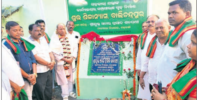
ବିଧାୟକ ନୂତନ ଗୃହର ଶିଳାନ୍ୟାସ କରୁଛନ୍ତି ।

ବଡ଼ବଟା ବ୍ଲକ ଅନ୍ତର୍ଗତ ବାଲିଚନ୍ଦ୍ରପୁରଠାରେ ପୂର୍ବ ବିଭାଗ ସହକାରୀ ଯନ୍ତ୍ରୀଙ୍କ କାର୍ଯ୍ୟାଳୟ ନୂତନ ସମ୍ପ୍ରସାରିତ ଗୃହର ଶିଳାନ୍ୟାସ ଉତ୍ସବ ଅନୁଷ୍ଠିତ ହୋଇଯାଇଛି ।