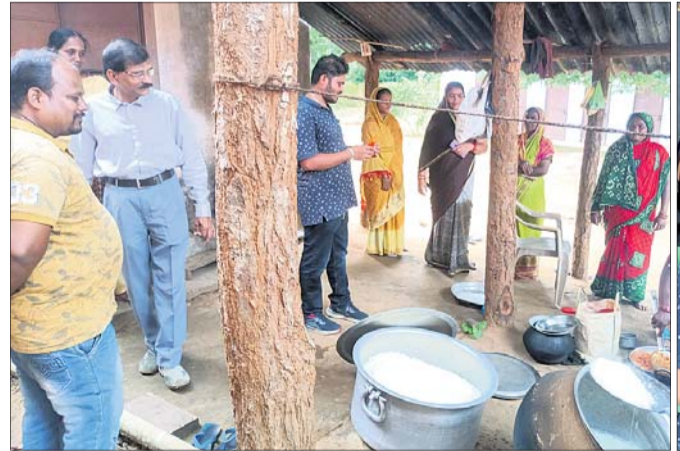
ମଧ୍ୟାହ୍ନଭୋଜନ ପ୍ରସ୍ତୁତିର ତନୁ କରୁଛନ୍ତି ଅଧିକାରୀ ।

ନୟାଗଡ଼ ଜିଲା ନୂଆଗାଁ ବ୍ଲକ ଗୋହିରିବାଦୁ ଆଶ୍ରମ ବିଦ୍ୟାଳୟରେ ନାନା ଅବ୍ୟବସ୍ଥାକୁ ନେଇ ଖବର ପ୍ରକାଶ ପାଇବା ପରେ ପ୍ରଶାସନର ଦୃଷ୍ଟି ଆକର୍ଷଣ କରାଯାଇଥିଲେ ମଧ୍ୟ କୌଣସି ସୁଧାକ ପ୍ରକାଶ ପାଇଛି । ଶୁକ୍ରବାର ଜିଣ୍ଡାପ୍ରସାଦ ପଞ୍ଚାୟତ ପୂର୍ବତନ ସରପଞ୍ଚ ପ୍ରଫୁଲ୍ଲ ବେହେରା ଓ ସମିତିସଭାଙ୍କ ପ୍ରତିନିଧି ଅନୁର ବେହେରାଙ୍କ ନେତୃତ୍ୱରେ ଚାଷୀମାନେ ବିଦ୍ୟୁତ୍ କାର୍ଯ୍ୟାଳୟ ସମ୍ମୁଖରେ ଧାରଣା ଦେଇଥିଲେ । ତେବେ ବିଦ୍ୟୁତ୍ ବିଭାଗ ପକ୍ଷରୁ ସୋମବାର ମଧ୍ୟରେ କାର୍ଯ୍ୟ ଆରମ୍ଭ କରାଯିବ ବୋଲି ପ୍ରତିଶ୍ରୁତି ମିଳିବା ପରେ ଧାରଣା ପ୍ରତ୍ୟାହତ ହୋଇଥିଲା ।