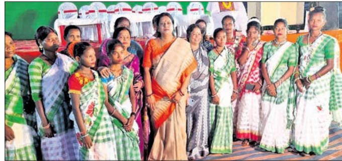
ଆଦିବାସୀ ମହିଳାଙ୍କ ରହଣରେ ରାଜ୍ୟ ମହିଳା କଂଗ୍ରେସ ସଭାକେନ୍ଦ୍ରୀ ।

ଯାଜପୁରରୋଡ଼, ୧୧୮୮ (ସବିତ୍ର ରଞ୍ଜନ ମହାନ୍ତି) କଂଗ୍ରେସର କର୍ମକର୍ତ୍ତା ଯୋଗ ଦେଉଥିଲେ । ବିକଳତା ରାତି ପର୍ଯ୍ୟନ୍ତ ଆଦିବାସୀ ନୃତ୍ୟ ପରିବେଷଣ କରାଯାଇଥିଲା । ଏହି ଅବସରରେ ଅନୁଷ୍ଠିତ ସଭାରେ ରାଜ୍ୟ ଏବଂ କେନ୍ଦ୍ର ସରକାରଙ୍କ ଦ୍ୱାରା ଆଦିବାସୀଙ୍କ ଉପରେ ହେଉଥିବା ଅତ୍ୟାଚାର ସମ୍ବନ୍ଧରେ ବକ୍ତାମାନେ କହିଥିଲେ ।