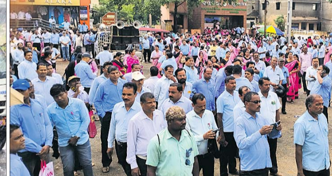
ଜିଲାପାଳଙ୍କ କାର୍ଯ୍ୟାଳୟ ସମ୍ମୁଖରେ ବିକ୍ଷୋଭ ପ୍ରଦର୍ଶନ ।