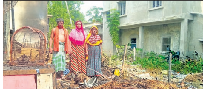
ଘର ଜଳିଯାଇଛି ।