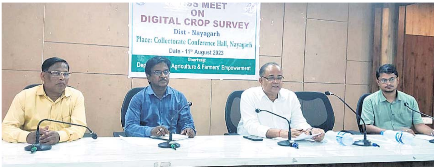
ଖବରଦାତା ସମ୍ମିଳନୀ ଜିଲାପାଳ ଓ ଅନ୍ୟମାନେ ।