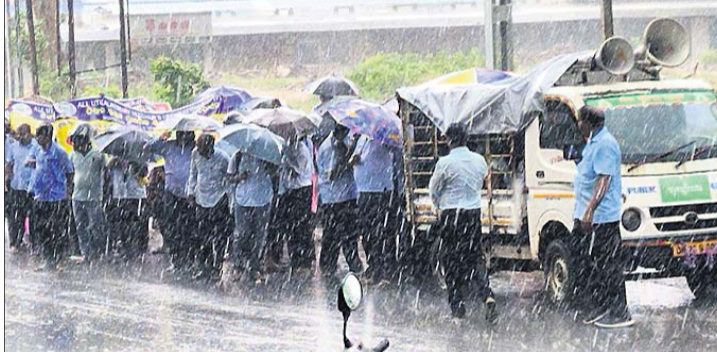
ଶିକ୍ଷୟିତ୍ରୀଶିକ୍ଷକ ବର୍ଷାରେ ଭିଜି ଠିଆ ହୋଇଛନ୍ତି ।