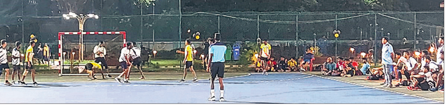
ପ୍ରଥମ ଦିବସରେ ଅନୁଷ୍ଠିତ ମ୍ୟାଚ।

କେନ୍ଦୁଝର, ୧୨୮ (ନରେଶ ଚନ୍ଦ୍ର ପଟ୍ଟନାୟକ/ ଦୀପକ ମିଶ୍ର) କେନ୍ଦୁଝର ହ୍ୟାଣ୍ଡବଲ ସ୍ପୋର୍ଟସ୍ ହାଲରେ ୩୬ ତମ ରାଜ୍ୟସ୍ତରୀୟ ସିନିୟର ପୁରୁଷ ଚାମ୍ପିୟନ୍‌ସିପ୍ ଶନିବାରଠାରୁ ଆରମ୍ଭ ହୋଇଛି। ୨ ଦିନିଆ ଟୁର୍ନାମେଣ୍ଟରେ ରାଜ୍ୟର ୧୯ଟି ଜିଲ୍ଲା ଭାଗ ନେଉଛନ୍ତି।