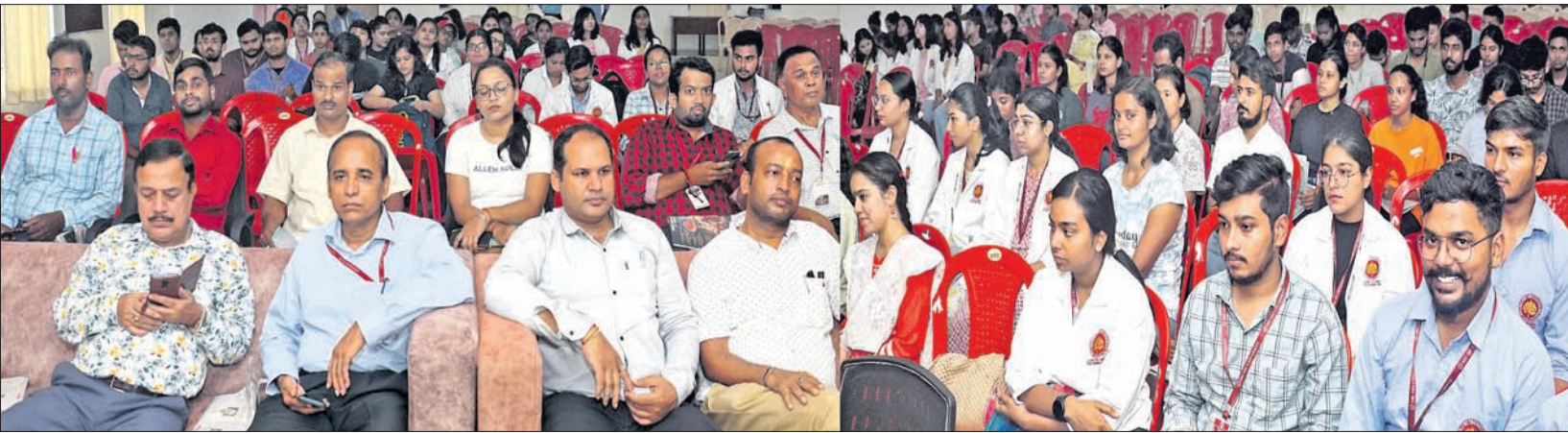
କଟକସ୍ଥିତ ଶ୍ରୀ ଶ୍ରୀ ବିଶ୍ୱବିଦ୍ୟାଳୟ ପରିସରରେ ଶନିବାର ଆୟୋଜିତ ‘ଗଣତନ୍ତ୍ର, ଗଣମାଧ୍ୟମ ଓ ମୁବପିଡ଼ି’ ଶୀର୍ଷକ ବଜ୍ରତା ପ୍ରତିଯୋଗିତାରେ ମହାଧ୍ୟାନ ଅତିଥି (ବାମ) । ପ୍ରତିଯୋଗିତାରେ ଉପସ୍ଥିତ ବିଚାରକ, ଅଧ୍ୟାପକାଧ୍ୟାପକ ଓ ଛାତ୍ରାଛାତ୍ରୀ ।