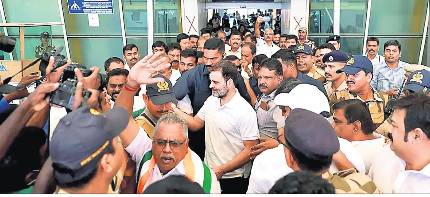
କୋଏମ୍ବଟୁର ବିମାନ ବନ୍ଦରାରେ କଂଗ୍ରେସ ନେତା ରାଜୁଲ୍ ଗାନ୍ଧୀଙ୍କୁ ଚାମିଲନାଭୁର ଦଳୀୟ ନେତାମାନେ ସାଗତ କରାଉଛନ୍ତି ।