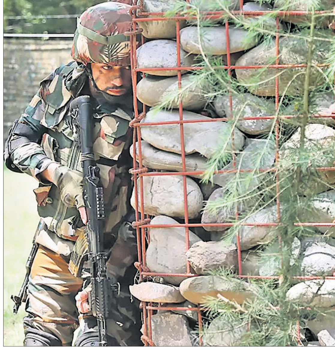
ସ୍ୱାଧୀନତା ଦିବସ ପୂର୍ବରୁ ଶନିବାର ଜମ୍ମୁ-କଶ୍ମୀରର ପୁଞ୍ଚ ସଂଲଗ୍ନ ନିୟନ୍ତ୍ରଣରେଖା(ଏଲ୍‌ଓ‌ସି)ରେ ପାଟ୍ରୋଲିଂ କରୁଛନ୍ତି ଜଣେ ଭାରତୀୟ ସୂଚକ ।

ଦୀର୍ଘ ୮ ବର୍ଷର ବିବାଦ ଲାଗିରହିଥିଲା । ଦିଲ୍ଲୀ ସେବା ପ୍ରଶାସନର ନିଯୁକ୍ତି ଓ ବଦଳି ଦାୟିତ୍ୱ ସୁପ୍ରିମକୋର୍ଟ ଏବଂ ସରକାରଙ୍କୁ ଦେବା ପରେ ଏହାକୁ ଅକାମୀ କରିବା ପାଇଁ କେନ୍ଦ୍ର ସରକାର ଗତ ମେ ୧୯ରେ ଅଧ୍ୟାଦେଶ ଆଣିଥିଲେ । ଏହାକୁ ଆଇନରେ ପରିଣତ କରିବା ପାଇଁ ଦିଲ୍ଲୀ ଜାତୀୟ ରାଜଧାନୀ ଅଞ୍ଚଳ ସରକାର (ସଂଶୋଧନ) ଟିଏସ୍-୨