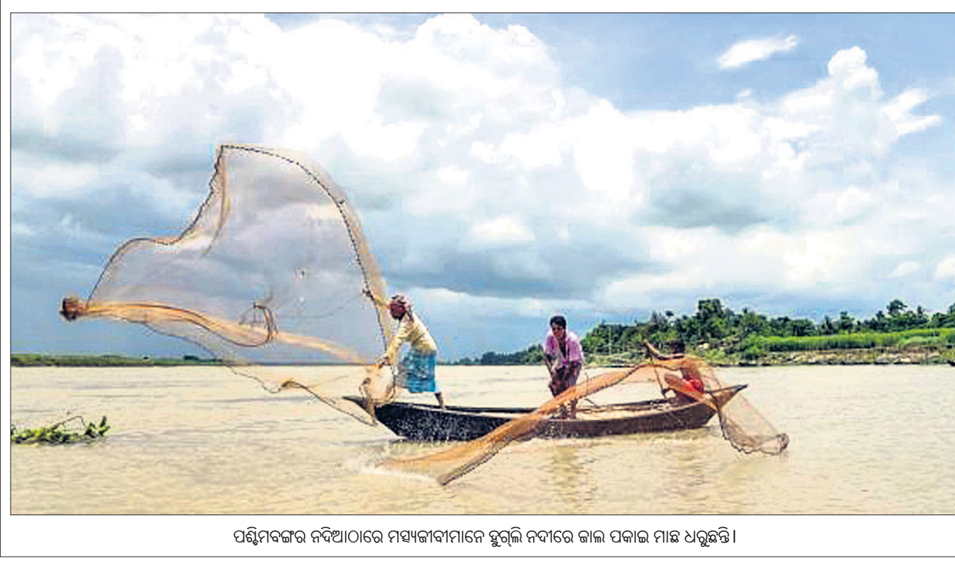
ପଶ୍ଚିମବଙ୍ଗର ନଦୀଆଠାରେ ମହାକାବୀମାନେ ଭୁବଲି ନଦୀରେ ଜାଲ ପକାଇ ମାଛ ଧରୁଛନ୍ତି।