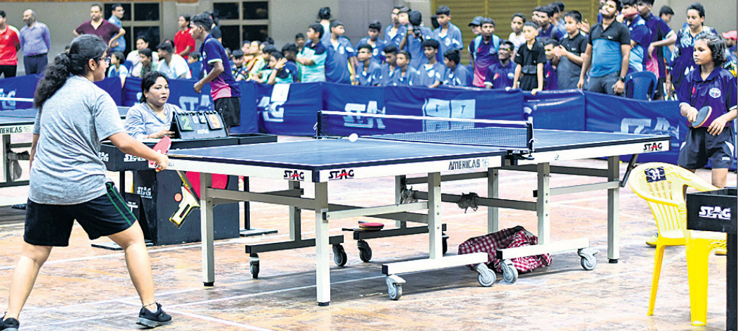
ବାଳିକା ବିଭାଗ ମ୍ୟାଚରେ ଭୁବ ପ୍ରତିଯୋଗୀଙ୍କ ମଧ୍ୟରେ ମୁକାବିଲା।

ଭୁବନେଶ୍ୱର, ୧୨୮ (ସରୋଜ ଜେନା) ଆନ୍ଧ୍ରପ୍ରଦେଶ ଆନ୍ଧ୍ରପ୍ରଦେଶ ଓ ୨୮ ତମ ଓଡ଼ିଶା ରାଜ୍ୟ ର୍ୟାଙ୍କିଙ୍ଗ୍ ଟେବୁଲ ଟେନିସ୍ ଚାମ୍ପିୟନ୍‌ସିପ୍ ୨୦୨୩ କଟକ ସ୍ଥିତ ଜବାହରଲାଲ ନେହେରୁ ଇନ୍‌ଡୋର ସ୍ପୋର୍ଟସ୍ ହାଲରେ ଶନିବାର ଉଦ୍‌ଘାଟିତ ହୋଇଯାଇଛି। ଓଡ଼ିଶା ରାଜ୍ୟ ଟେବୁଲ ଟେନିସ୍ ସଂଘର ସଭାପତି ସଞ୍ଜୟ ସିଂ କାର୍ଯ୍ୟକ୍ରମକୁ ଉଦ୍‌ଘାଟନ କରିଥିଲେ। ୬୯ ଟେବୁଲର ୨୨୬ ଛାତ୍ରା ଛାତ୍ରୀ ଏହି ପ୍ରତିଯୋଗିତାରେ ଅଂଶଗ୍ରହଣ କରୁଛନ୍ତି। ଆନ୍ଧ୍ରପ୍ରଦେଶ ଟୁର୍ନାମେଣ୍ଟ ୧୨ ଓ ୧୩ ତାରିଖ ହେବାକୁ ଥିବା ବେଳେ ଓଡ଼ିଶା ରାଜ୍ୟ ଟେବୁଲ ଟେନିସ୍ ଚାମ୍ପିୟନ୍‌ସିପ୍ ଅନ୍ତିମ ଦୁଇ ଦିନରେ ଅନୁଷ୍ଠିତ ହେବ। ପ୍ରଥମ ଦିନରେ ଭୁବନେଶ୍ୱର ଓ ସିନିୟର ବର୍ଗରେ ଉଭୟ ବାଳକ ଓ ବାଳିକା ଦଳଙ୍କ ପ୍ରତିଯୋଗିତା ଅନୁଷ୍ଠିତ ହୋଇଥିଲା। ଭୁବନେଶ୍ୱର ବାଳିକା ଟିମ୍ ଇଭେଣ୍ଟର କ୍ୱାର୍ଟର ଫାଇନାଲରେ କଟକର ସେଣ୍ଟ ଯୋଶେଫ୍ ହାଇସ୍କୁଲ ୩-୦ରେ ସନତ ନିନି