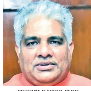
କେନ୍ଦ୍ରମନ୍ତ୍ରୀ ଭୂପେନ୍ଦର ଯାଦବ