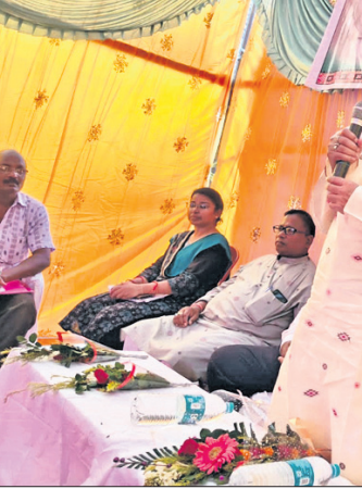
କାର୍ଯ୍ୟକ୍ରମରେ ଯୋଗ ଦେଇଥିବା ମନ୍ତ୍ରୀ ଓ ଅନ୍ୟମାନେ ।

ବୌଦ୍ଧ ବ୍ଲକ ଲକ୍ଷ୍ମୀପ୍ରସାଦ ପଞ୍ଚାୟତ ଅନ୍ତର୍ଗତ ଲୋକକଳା ଗ୍ରାମ ନାରୀୟ ଶିକ୍ଷକ ଚଳାଚଳନା ଗ୍ରାମ ନାରୀୟ ଶିକ୍ଷକ ଚଳାଚଳନା ଗ୍ରାମ ନାରୀୟ ଶିକ୍ଷକ ଚଳାଚଳନା