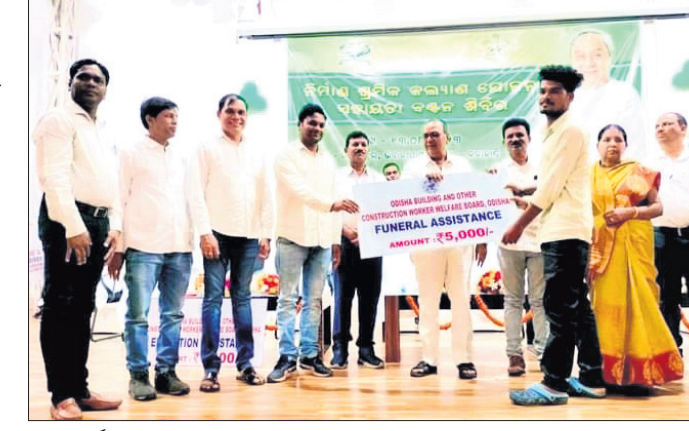
ମନ୍ତ୍ରୀ ନିର୍ମାଣ ଶ୍ରମିକଙ୍କୁ ସହାୟତା ପ୍ରଦାନ କରୁଛନ୍ତି।