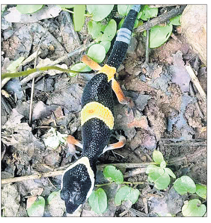
ଓଡ଼ିଶାରେ ଏକ ଅଳ୍ପତ ଗୋଡ଼ବିହୀନ ଲିଜାର୍ଡ ଦେଖାଯାଉଛି। ୧୯୧୭ରେ ଏହି ନୂତନ ପ୍ରଜାତି 'ବରକୁଦିଆ ଜଗୁଲାର୍ଡ'ର ଆବିଷ୍କାର ହୋଇଥିଲା।

ତିଳିକା ହୃଦରେ ଥିବା ବରକୁଦିଆ ପ୍ରାଣୀ ଏହି ଗୋଡ଼ବିହୀନ ଲିଜାର୍ଡ ଠାଏ ହୋଇଥିବାରୁ ଆବିଷ୍କାରକ ନେଲ୍ସନ ଆନନ୍ଦଲେ ଏହାର ନାଁ ରଖିଥିଲେ 'ବରକୁଦିଆ'। ଏହି ବରକୁଦିଆ ଜଗୁଲାର୍ଡ ଦେଖିଲେ ଯେ କେହି ବି ସାପ ବୋଲି ଭ୍ରମରେ ପଡ଼ିବା ସ୍ୱାଭାବିକ। ତେବେ ଏହା ବିରଳ ଲୋଭ ଲୋଭ ଲିଜାର୍ଡ। ଏହାର ଆଖିପତା ରହିଛି। ସାପ ପାଟିରେ ଦୁଇପାଳିଆ ଜିଭ ଥିବାବେଳେ ବରକୁଦିଆର ଗୋଟାଳିଆ ଜିଭ ଥାଏ। ସେହିପରି ସାପଙ୍କ ଦେହରେ ବାହ୍ୟ କାନ ନ ଥିବାବେଳେ ବରକୁଦିଆ ଦେହରେ ବାହ୍ୟ କାନ ରହିଥାଏ।