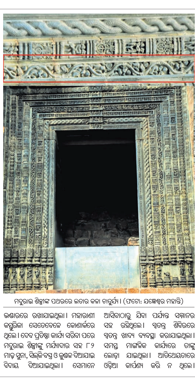
ମଦୁରାଇ ଶିଳ୍ପୀଙ୍କ ପଥରରେ ଲତାର କଳା ଚାରୁର୍ଯ୍ୟ।