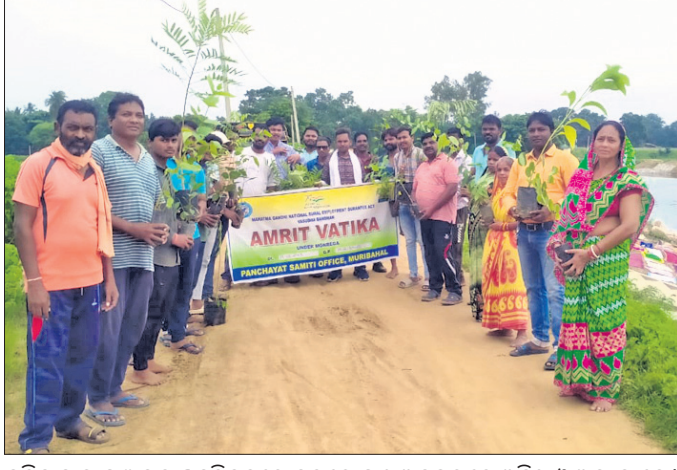
ପୁରିବାହାଲ ପଞ୍ଚାୟତ ଖଜୁରିବନ୍ଧରେ ବୃକ୍ଷରୋପଣ ଅବସରରେ ଅତିଥି ଓ ଅନ୍ୟମାନେ।

ସରକାରୀ ଯୋଜନାର ସଫଳ ରୂପାୟନ ପାଇଁ ଦୃଶ୍ୟମୂଳକ ଲୋକଙ୍କ ସହ ସରପଞ୍ଚମାନେ ହିଁ ପ୍ରତ୍ୟକ୍ଷ ଭାବେ ଯୋଗାଯୋଗ ରଖି ଯୋଜନାର ସୁଫଳ ଲୋକେ ଯେପରି ପାଇବେ ତାର ବ୍ୟବସ୍ଥା କରିଥାନ୍ତି। କିନ୍ତୁ ବର୍ତ୍ତମାନ ଦେଖାଯାଉଛି ପଞ୍ଚାୟତ ପାଇଁ ଆସୁଥିବା ଯୋଜନାରେ ସରପଞ୍ଚ ଭଳି ଲୋକ ପ୍ରତିନିଧିଙ୍କୁ କୌଣସି ଗୁରୁତ୍ୱ ଦିଆଯାଉନାହିଁ। ଏପରିକି ଯୋଜନା ପ୍ରଣୟନ ଓ କାର୍ଯ୍ୟାବହାନ ବେଳେ ମଧ୍ୟ ସରକାର ସରପଞ୍ଚଙ୍କ