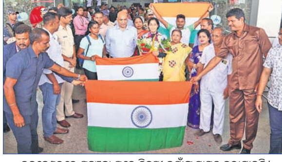
ଭୁବନେଶ୍ୱରରେ ପହଞ୍ଚିବା ପରେ ଚିନ୍ତାକୁ ଭୃତ୍ୟ ସାଗତ କରାଯାଇଛି।