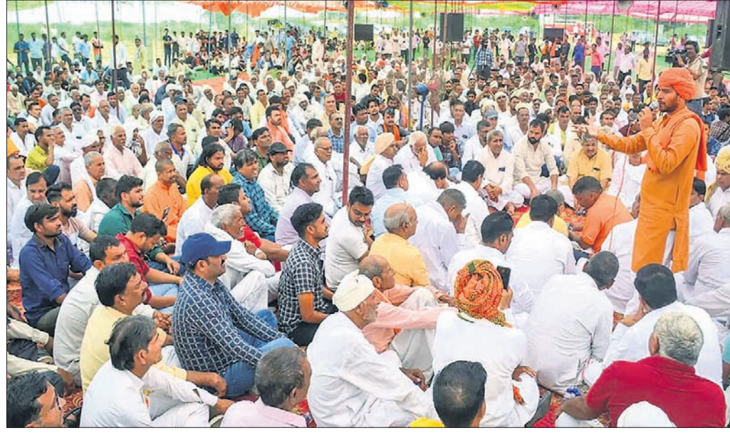
ସର୍ବହିନ୍ଦୁ ସମାଜ ପକ୍ଷରୁ ପାଲଝାଲଝାରେ ଅନୁଷ୍ଠିତ ମହାପଞ୍ଚାୟତରେ ଜଣେ ବକ୍ତା ଉଦ୍‌ବୋଧନ ଦେଉଛନ୍ତି।

ହରିୟାଣାର ନୂଆ ଜିଲ୍ଲାରେ ଗତ ମାସ ୩୧ରେ ଘଟିଥିବା ହିଂସାମୂଳକ ସଂଘର୍ଷ ଘଟଣା ଉପରେ ଆଲୋଚନା ପାଇଁ ରବିବାର ପାଲଝାଲଝାରେ ସର୍ବ ହିନ୍ଦୁ ସମାଜ ପକ୍ଷରୁ ଏକ ମହାପଞ୍ଚାୟତର ଆୟୋଜନ କରାଯାଇଥିଲା। ବିଶ୍ୱ ହିନ୍ଦୁ ପରିଷଦର ଏହି ଧର୍ମୀୟ ଶୋଭାଯାତ୍ରା ୨୮ରୁ ପୁନର୍ବାର ଆରମ୍ଭ କରିବା ଲାଗି ମହାପଞ୍ଚାୟତ ନିଷ୍ପତ୍ତି ନେଇଛି। ଏଥିସହିତ ହିଂସା ଘଟଣାର ଏନ୍‌ଆଇଏ ତଦନ୍ତ କରାଯିବାକୁ ଦାବି ହୋଇଛି। ନୂଆ ହିନ୍ଦୁ ଗୋବଧ ମୁକ୍ତ କରିବା ସହ ଜିଲ୍ଲାବାସୀଙ୍କ ସୁରକ୍ଷା ପାଇଁ ନୂହରେ ଅର୍ଦ୍ଧସାମରିକ ବାହିନୀର ମୁଖ୍ୟାଳୟ ଖୋଲିବାକୁ ସେମାନେ ସରକାରଙ୍କୁ ଆହ୍ୱାନ ଦେଇଛନ୍ତି। ସୂଚନାଯୋଗ୍ୟ, ଯୁକ୍ତିତ ଲାଷଣ ଦିଆଯିବ ନାହିଁ ସର୍ତ୍ତରେ ମହାପଞ୍ଚାୟତ ପାଇଁ ଅନୁମତି ଦିଆଯାଇଥିଲା ବୋଲି ପାଲଝାଲଝା ସର୍ବଦା ଲୋକେନ୍ଦ୍ର ହିଂସାହତ୍ୟା ପ୍ରଶ୍ନାବଳୀରେ ସର୍ବତ୍ର ଅବଜ୍ଞା କରି ବକ୍ତାମାନେ ମହାପଞ୍ଚାୟତରେ ଖୋଲା