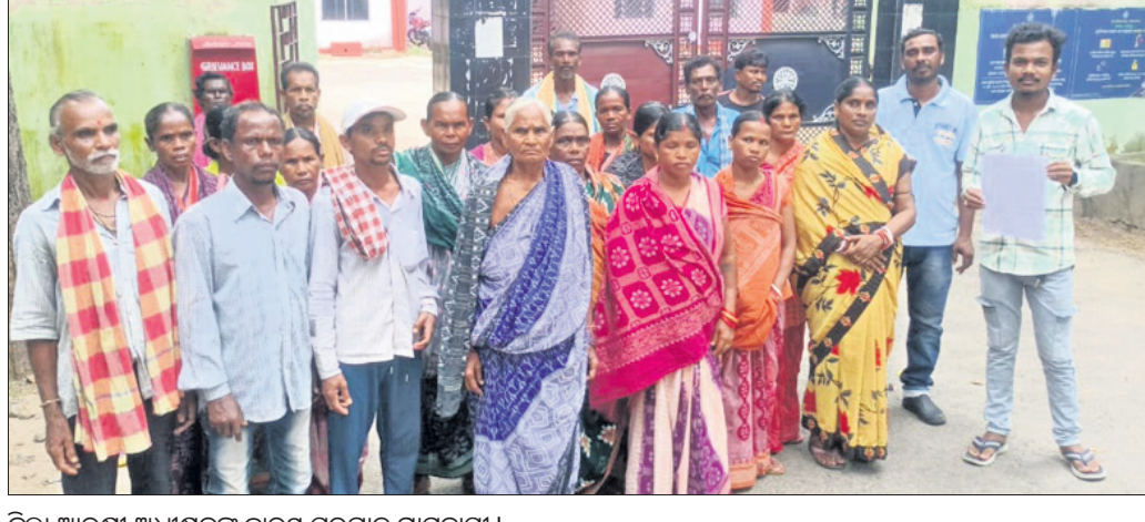
ଜିଲ୍ଲା ଆରକ୍ଷୀ ଅଧ୍ୟକ୍ଷକ ଦ୍ୱାରା ସରଗାଡ଼ ଗ୍ରାମବାସୀ।