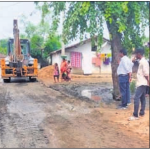
ବୁକ ଉପାଧ୍ୟକ୍ଷ କାହୁଅ ରାସ୍ତା ସଫା କରାଯାଇଛି।