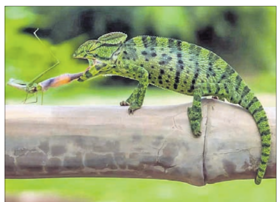
ଦେଖିବାକୁ ମିଳନ୍ତି। ଶତ୍ରୁ କବଳରୁ ରକ୍ଷା ପାଇବା ଓ ନିଜେ ଶିକାର କରିବା ସମୟରେ ପରିବେଶ ସହିତ ରଙ୍ଗ ବଦଳାଇଥାନ୍ତି।

ଗାମେଲିଅନ ବା ବହୁରୂପୀ ଏଣ୍ଡ୍ରୋ। ଦେଖିବାକୁ ଯେତିକି ସୁନ୍ଦର, ତାର ଶରୀରର ରଙ୍ଗ ପରିବର୍ତ୍ତନ ଯେତିକି ଗୋପାଳକର। ପୂର୍ବରୁ ଏହା ବନ୍ୟପ୍ରାଣୀ(ସଂରକ୍ଷଣ) ଆଇନ ୧୯୭୨ରେ ସିନ୍ଦୂଳ-୪ ରହିଥିବାବେଳେ ୨୦୨୨ରେ ସଂଶୋଧିତ ଆଇନରେ ଏହା ସିନ୍ଦୂଳ-୧ରେ ସ୍ଥାନ ପାଇଛି। ତେଣୁ ଏହାକୁ ଧରିବା ବା ଶିକାର କରିବା ଦଣ୍ଡନୀୟ ଅପରାଧ। ଏମାନେ ଓଡ଼ିଶାର ପ୍ରାୟ ସବୁ ଜଙ୍ଗଲରେ