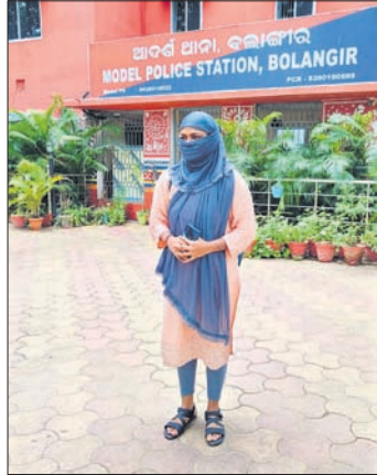
ଉଦ୍ଧାର ହୋଇଥିବା ମୁଦତୀ।