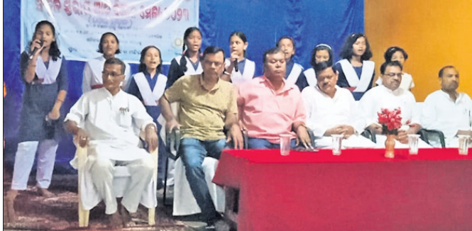
ବିଜ୍ଞାନ ମେଳାରେ ଯୋଗ ଦେଇଥିବା ଅତିଥି । ବୌଦ୍ଧ, ୧୩।୮