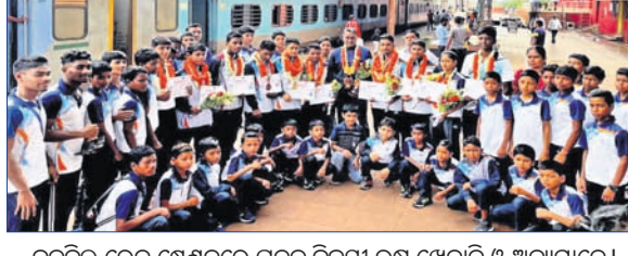
ବଡ଼ବିଲ ରେଳ ଷ୍ଟେସନରେ ପଦକ ବିଜୟୀ ଉଷୁ ଖେଳାଳି ଓ ଅନ୍ୟମାନେ।