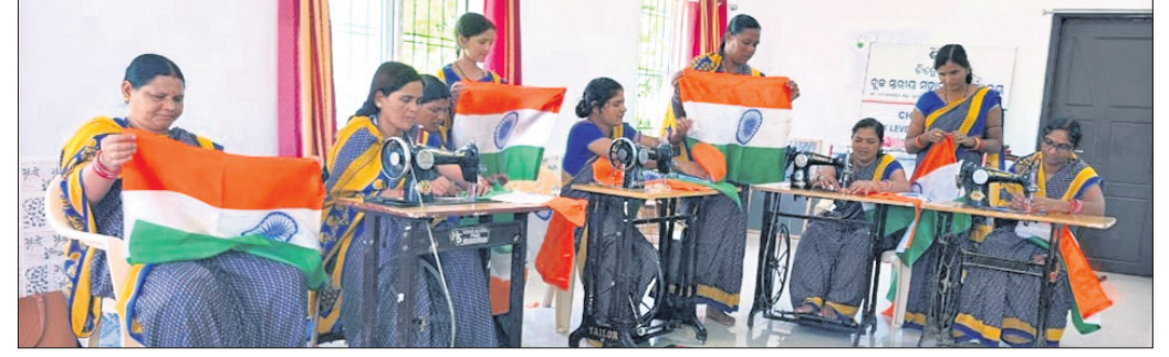
ଜାତୀୟ ପତାକା ତିଆରି କରି ଆମେ ଗର୍ବିତ: ଚିତ୍ରୋତ୍ପଳା ମହିଳା ମହାସଂଘ

ଆସନ୍ତା ୧୫ ତାରିଖରେ ଦେଶରେ ପାଳନ ହେବ ୭୬ତମ ସ୍ୱାଧୀନତା ଦିବସ । ପ୍ରତି ଘରେ ଫଟୁଫର ହୋଇ ଉଡ଼ିବ ତ୍ରିରଙ୍ଗା । ଏଥିପାଇଁ ଜାତୀୟ ପତାକା ପ୍ରସ୍ତୁତି ଜୋରସେରେ ଚାଲିଛି । ସୁବର୍ଣ୍ଣପୁର ଜିଲ୍ଲା ବୀରମହାରାଜପୁର ବ୍ଲକର ଚିତ୍ରୋତ୍ପଳା ମହିଳା ମହାସଂଘର ସଦସ୍ୟମାନେ ୭ ଦିନରେ ତିଆରି କରିଛନ୍ତି ପ୍ରାୟ ୧୦ ହଜାର ଜାତୀୟ ପତାକା । ଜାତୀୟ ପତାକା ତିଆରି କରି ନିଜ ରୋଜଗାର କରିବା ସହିତ ଏହା ଘରେ ଘରେ ଉଡ଼ିବାକୁ ନେଇ ସେମାନେ ଗର୍ବିତ ବୋଲି ପ୍ରକାଶ କରିଛନ୍ତି । ଏହି ମହାସଂଘର ୧୧୯ଜଣ ସଦସ୍ୟା ଜାତୀୟ ପତାକା ତିଆରିରେ ଲାଗି ପଡ଼ିଛନ୍ତି । ଜିଲ୍ଲା ପ୍ରଶାସନ ତରଫରୁ ଉଚ୍ଚ ମହାସଂଘକୁ ଦାୟିତ୍ୱ ଦିଆଯାଇଥିଲା । ପ୍ରତି ପତାକା ପିଛା ୨୪ଟୁ ୨୫ ଟଙ୍କା ଲେଖାଏ