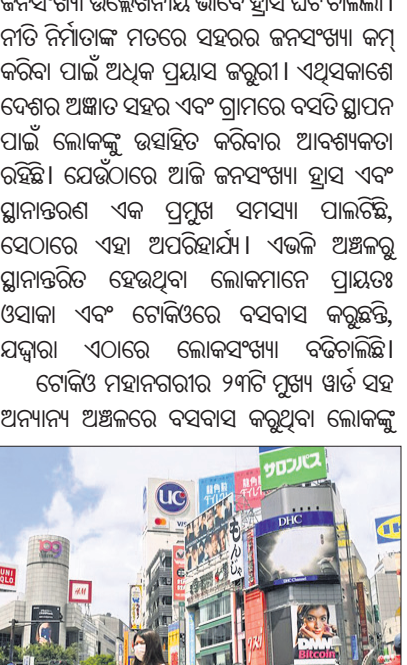
ଏହି ପ୍ରୋତ୍ସାହନ ରାଶି ପ୍ରଦାନ କରାଯିବାର ବ୍ୟବସ୍ଥା ରହିଛି।

ନିଶ୍ଚୟ ଆପଣଙ୍କୁ ଜାପାନର ସମସ୍ତ ସୁଖ ସୁବିଧା ସମ୍ପର୍କରେ ଜଣାଇ ଦିଆଯାଇଛି। ଗୋଟିଏ ପଟେ ବିଶ୍ୱର କିଛି ଦେଶ ଆଜି ଅତ୍ୟଧିକ ଜନସଂଖ୍ୟା ଆହୁାନ ସହ ସଂଘର୍ଷ କରୁଛନ୍ତି। ଅନ୍ୟପଟେ କ୍ରମାଗତ ଜନସଂଖ୍ୟା ହ୍ରାସ ହେତୁ (ଏକ ଦେଶର ଏକ ନିର୍ଦ୍ଦିଷ୍ଟ ଅଞ୍ଚଳରେ ଜନସଂଖ୍ୟା ଘନତ୍ୱ ହ୍ରାସ ହେତୁ) କିଛି ଦେଶ ନୂତନ ସମସ୍ୟାର ସମ୍ମୁଖୀନ ହେଉଛନ୍ତି। ସାଧାରଣତଃ ମହାନାଗରୀ, ଦୁର୍ଭିକ୍ଷ, ମୂଳ ଭଳି ଆକର୍ଷକ ଘଟଣା ଯୋଗୁଁ ହେଉ ଅବା ନିମ୍ନ ପ୍ରଜନନ ବା ଜନ୍ମ ହାର, ଉଚ୍ଚ ମୃତ୍ୟୁ ହାର, ନିରନ୍ତର ସ୍ଥାନାନ୍ତରଣ ଭଳି ଅନାମ୍ୟ କାରଣଗୁଡ଼ିକ ପାଇଁ ନିର୍ଦ୍ଦିଷ୍ଟ ଅଞ୍ଚଳରେ ଜନସଂଖ୍ୟାର ସଂକ୍ରମଣ ବ୍ୟାପ୍ତ ହେବାକୁ ଲାଗିଛି। କିଛି ବର୍ଷ ଧରି ଜାପାନ ଏଭଳି ପରିସ୍ଥିତିର ସମ୍ମୁଖୀନ ହୋଇଚାଲିଛି। ଏହାର ମୂଳକାରଣ ପାଇଁ ଜାପାନ ସରକାର ଏକ ଅଭିନବ ପଦକ୍ଷେପ ନେଇଛନ୍ତି। ଏଥିରେ ସରକାର ସ୍ଥାନୀୟ ନାଗରିକଙ୍କୁ ରାଜଧାନୀ ଗୋକିଂ ନଗରୀ ଛାଡ଼ି ସୁଦୂର ଅଞ୍ଚଳରେ ବସବାସ କରିବାକୁ ପ୍ରୋତ୍ସାହନ ଦେଇଛନ୍ତି। ନିୟମ ଅନୁଯାୟୀ ଗୋଟିଏ ପରିବାର ରାଜଧାନୀ ଗୋକିଂ ନଗରୀ ଛାଡ଼ି ଅନ୍ୟ ସହର କିମ୍ବା ଗ୍ରାମରେ ବସବାସ କଲେ ପ୍ରୋତ୍ସାହନ ସ୍ୱରୂପ ସରକାର ସେହି ପରିବାରର ପ୍ରତି ପିଲାକୁ ୬୫୦୦ ଡଲାର ଅର୍ଥାତ୍ ୧୦ ଲକ୍ଷ ଲେଖାଏ ଯେଉଁ ପ୍ରଦାନ କରିବେ।