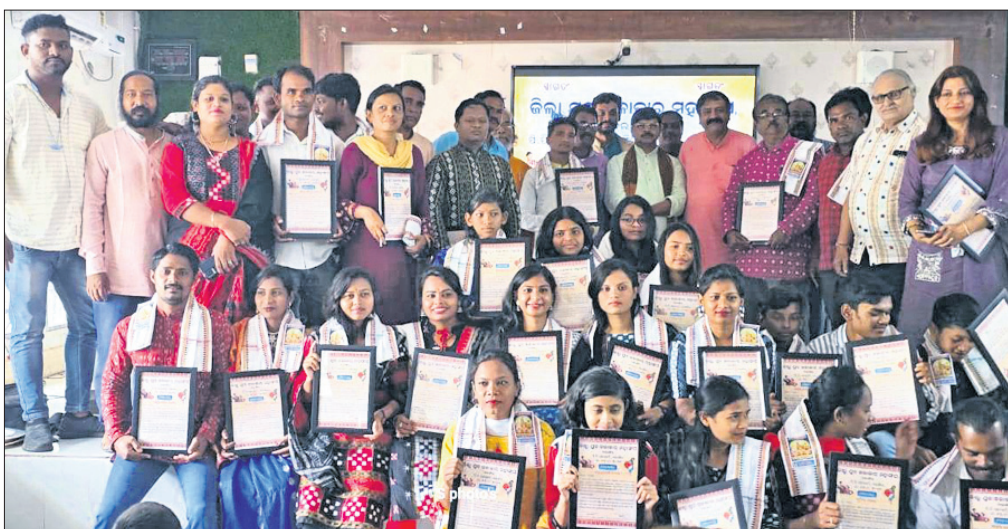
ପଶ୍ଚିମ ଓଡ଼ିଶାର ୧୦ଟି ଜିଲ୍ଲାରୁ ଆସିଥିବା କୁଟା କଳାକାରଙ୍କୁ କଳାକାର ଜିଲ୍ଲା ମୁଖ୍ୟ କଳାକାର ମହାସଂଘ ପକ୍ଷରୁ ସମ୍ବର୍ଦ୍ଧିତ କରାଯାଇଛି।