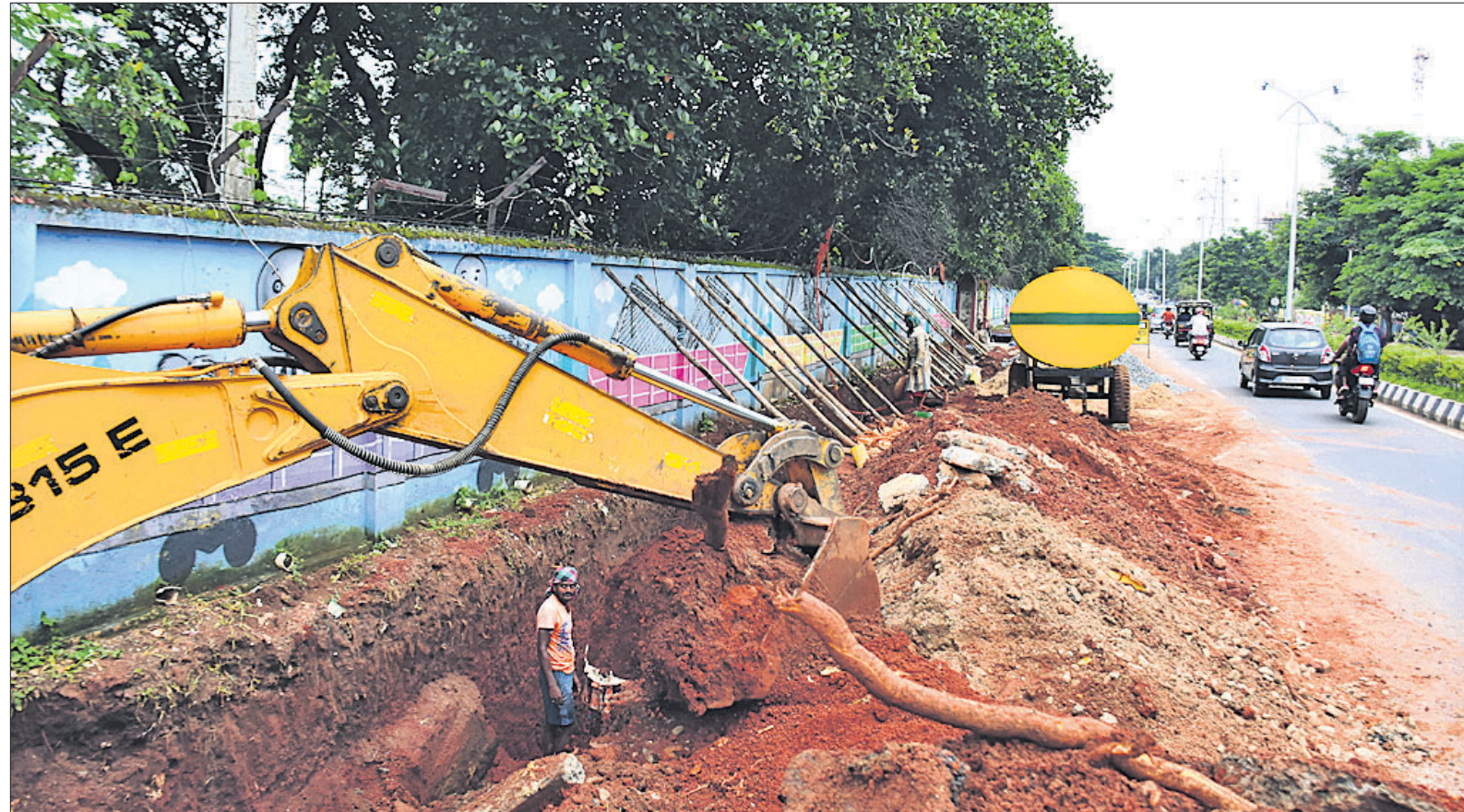
ଭଗବାନ ଭରସା : ଭୁବନେଶ୍ୱର ୧୨୦ ବାଟାଲିୟନ ପାଟେରିଲି ଲାଗି ରବିବାର ଲେସିବି ବ୍ଲାର ଗଭୀର ଖନନ ଚାଲିଥିବାବେଳେ ପାଟେରିଲି ପୁରୁଣା ପାଇଁ ଖାମୁଆଳ ଭାବେ କେତେଖଣ୍ଡ କାଠ ବନ୍ଧା ଆଉଜା ଯାଇଛି। ଏପଟେ ଗାଡ଼ ଭିତରେ ଶ୍ରମିକମାନେ ବିନା ସୁରକ୍ଷା ଉପକରଣରେ ବିପଦସଙ୍କୁଳ ଅବସ୍ଥାରେ କାମ କରୁଛନ୍ତି।

ଖାଇଲା ବୋଲି ପଚାରିଥିଲେ। ଏହାକୁ ନେଇ ଝଗଡ଼ା ହୋଇଥିଲା। ଏଥିରେ ଉତ୍ତରରେ ହୋଇ ବାପାଙ୍କୁ ପ୍ରକାଶ ମାଡ଼ ମାରିଥିବା ଶାଶୁ ସୁଲୋଚନା କେନା କରିଛନ୍ତି। ରବିବାର ପୂର୍ବାହ୍ନରେ ବାପା ଓ ସାନଝିଅ ସହ ପ୍ରକାଶ ନିକଟସ୍ଥ ମନ୍ଦିରକୁ ଆସିଥିଲେ। ପରେ ସେମାନେ ନିକଟସ୍ଥ ସିଦ୍ଧିଆ ନଦୀକୁ ଯାଇଥିଲେ। ହେଲେ ହଠାତ୍ ବାପାଙ୍କୁ ଡେଇଁପଡ଼ିଲା-୪