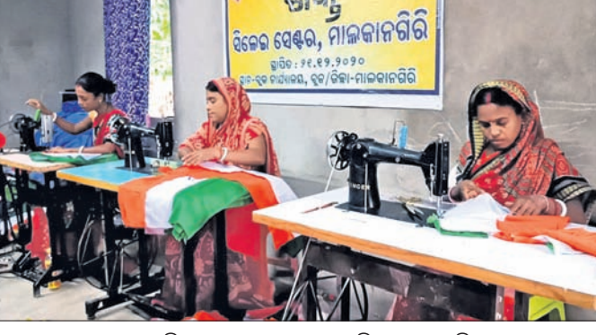
ସ୍ୱୟଂ ସହାୟକ ଗୋଷ୍ଠୀ ମହିଳାମାନେ ଜାତୀୟ ପତାକା ସିଲେଇ କରୁଛନ୍ତି ।