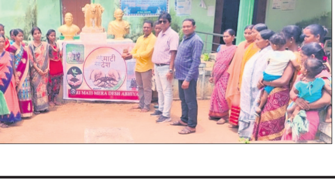
କାର୍ଯ୍ୟକ୍ରମରେ ଯୋଗଦେଇଥିବା ଲୋକେ ।