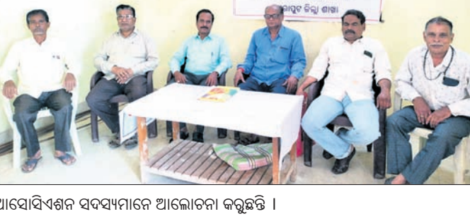
ଆସୋସିଏଶନ ସଦସ୍ୟମାନେ ଆଲୋଚନା କରୁଛନ୍ତି ।