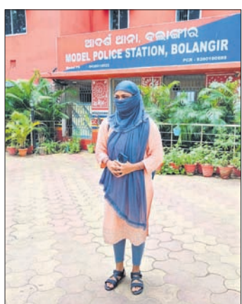
ଉଦ୍ଧାର ହୋଇଥିବା ମୁଦତୀ।