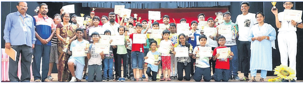
ଅତିଥି ଗହଣରେ କୃତା ପ୍ରତିଯୋଗୀ।