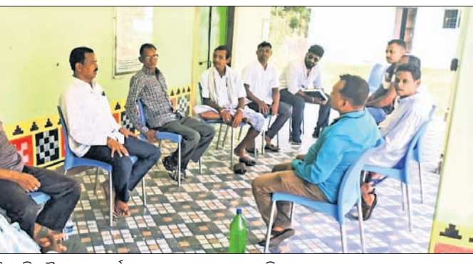
ବିଜେଡି ବୈଠକରେ କର୍ମୀମାନେ ଆଲୋଚନା କରୁଛନ୍ତି ।