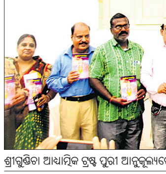
ଶ୍ରୀଗୁଣ୍ଡିଚା ଆଧ୍ୟାତ୍ମିକ ଟ୍ରଷ୍ଟ ପୁରୀ ଆନୁଷ୍ଠାନରେ ଅନୁଷ୍ଠିତ ଆଲୋଚନାଚକ୍ରରେ ଅତିଥିମାନେ ବିଶେଷାକ ଭଣ୍ଡୋତନ କରୁଛନ୍ତି ।