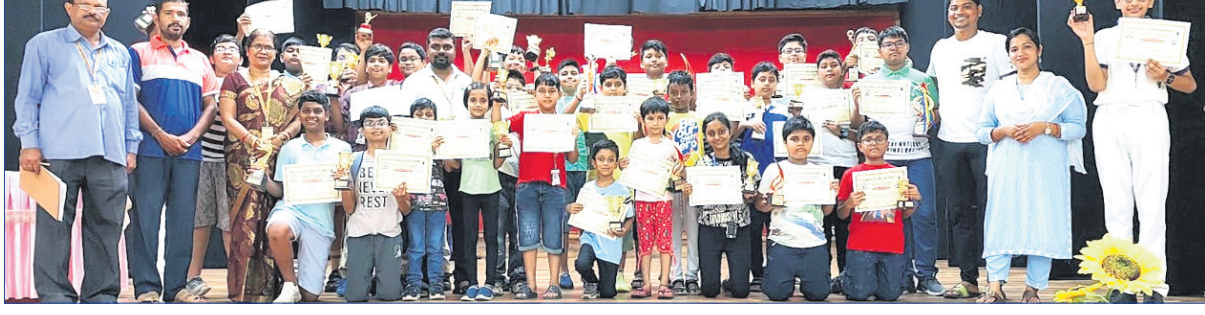
ଅତିଥି ଗହଣରେ କୃତା ପ୍ରତିଯୋଗୀ ।