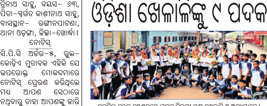
ବଡ଼ବଳ ରେଳ ଷ୍ଟେସନରେ ପଦକ ବିଜୟୀ ଉଷ୍ମ ଖେଳାଳି ଓ ଅନ୍ୟମାନେ ।