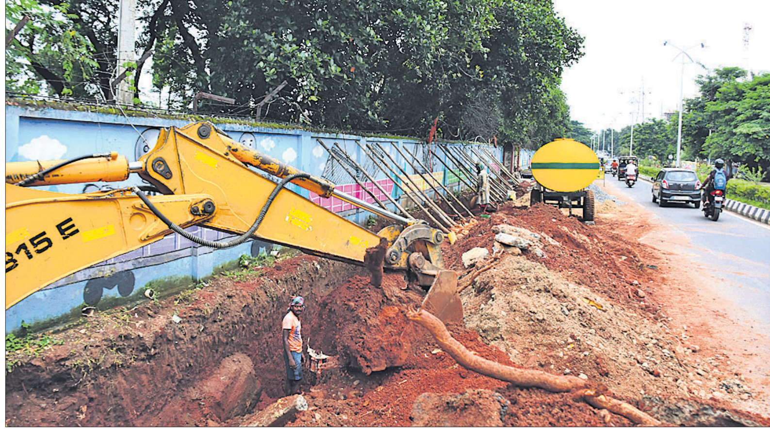
ଭଗବାନ ଭରସା : ଭୁବନେଶ୍ୱର ୧୨୦ ବାଟାଲିୟନ ପାଟେରିଲ୍ ଲାଗି ରବିବାର ଲେସିବି ବ୍ଲାର ଗଭୀର ଖନନ ଚାଲିଥିବାବେଳେ ପାଟେରିଲ୍ ସୁରକ୍ଷା ପାଇଁ ଖାମୁଆଳ ଭାବେ କେତେକ କାଠ ବନ୍ଧା ଆଉଁସ ଯାଇଛି। ଏପଟେ ଗାଡ଼ ଭିଡରେ ଶ୍ରମିକମାନେ ବିନା ସୁରକ୍ଷା ଉପକରଣରେ ବିପଦସଙ୍କୁଳ ଅବସ୍ଥାରେ କାମ କରୁଛନ୍ତି।

ଖାଇଲା ବୋଲି ପଚାରିଥିଲେ। ଏହାକୁ ନେଇ ଝଗଡ଼ା ହୋଇଥିଲା। ଏଥିରେ ଉତ୍ତରରେ ହୋଇ ବାପାଙ୍କୁ ପ୍ରକାଶ ମାଡ଼ ମାରିଥିବା ଶାଶୁ ସୁଲୋଚନା କେନା କରିଛନ୍ତି। ରବିବାର ପୂର୍ବାହ୍ନରେ ବାପା ଓ ସାନଝିଅ ସହ ପ୍ରକାଶ ନିକଟସ୍ଥ ମନ୍ଦିରକୁ ଆସିଥିଲେ। ପରେ ସେମାନେ ନିକଟସ୍ଥ ସିଦ୍ଧିଆ ନଦୀକୁ ଯାଇଥିଲେ। ହେଲେ ହଠାତ୍ ବାପାଙ୍କୁ ଡେଇଁପଡ଼ିଲା ଓ ପୁଅ-୪