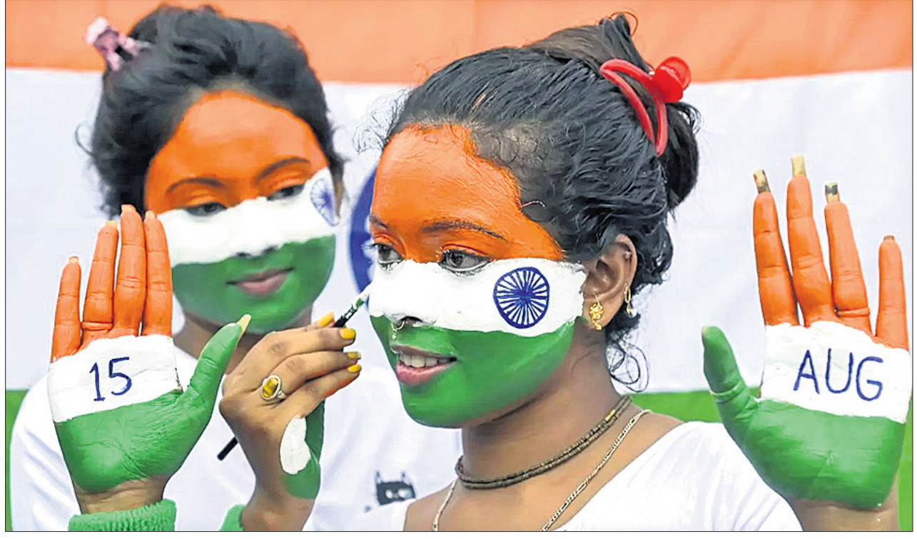
ପଶ୍ଚିମବଙ୍ଗର ନଦିଆରେ ସାଧାରଣ ଦିବସ ପାଳନ ପାଇଁ ଦୁଇ ଯୁବତୀ ମୁହଁ ଓ ହାତ ପାଦୁଲିକୁ ତ୍ରିରଙ୍ଗାରେ ସଜାଇଛନ୍ତି।