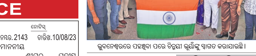
ଭୁବନେଶ୍ୱରରେ ପଞ୍ଚସୁଦା ପରେ ତିନିୟା ଭୂୟଙ୍କୁ ସାଗତ କରାଯାଇଛି ।