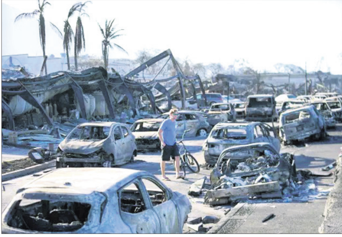
ଆମେରିକାର ମାଉଜ ବ୍ରାପରେ ଜଙ୍ଗଲ ନିଆଁ ବ୍ୟାପି ଗାଡ଼ିଗୁଡ଼ିକ ଜଳିଯାଇଛି।