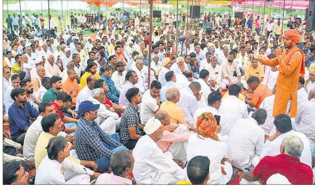
ସର୍ବ୍ୱି ହିନ୍ଦୁ ସମାଜ ପକ୍ଷରୁ ପାଲଝାଲଝାରେ ଅନୁଷ୍ଠିତ ମହାପଞ୍ଚାୟତରେ ଜଣେ ବକ୍ତା ଉଦ୍‌ବୋଧନ ଦେଇଛନ୍ତି।