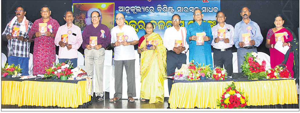
ଆଲୋଚନାଚକ୍ରରେ ଉପସ୍ଥିତ ଅତିଥି ଏବଂ ଅନ୍ୟମାନେ ।

ଗୁରୁଙ୍କ ପଥ ପ୍ରଦର୍ଶନରେ ମଣିଷ ଆଲୋଚନା ଦେଖେ । ଗୁରୁଙ୍କ ନମ୍ରତା ଓ ଆତ୍ମୀୟତାରେ ଶିକ୍ଷା ଶୁଦ୍ଧିକୃତ ହୁଏ ।