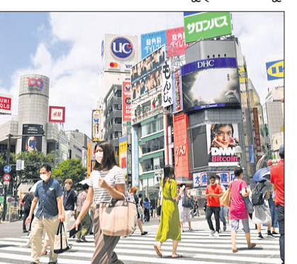
ଜାପାନର ଗ୍ରାମାଭିମୁଖୀ ଯୋଜନା

ନିର୍ବାଚନ ସମ୍ପର୍କରେ ପ୍ରସ୍ତାବ ପ୍ରସ୍ତୁତ କରିଛନ୍ତି। ନେତୃତ୍ୱ ସରକାର ପୂର୍ବରୁ ଯୋଜନା କରିଛନ୍ତି।