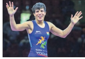
ସେ ସମ୍ପର୍କରେ ସୂଚନା ଦେଇ ନ ଥିବା କାରଣରୁ ବାସନ୍ତ କରାଯାଇଛି।

ନୂଆଦିଲ୍ଲୀ, ୧୪୮୮ (ପି.ଟି.): ଏସିଆନ୍ ଚାମ୍ପିୟନସ୍ ଟ୍ରୋଫି ବିଜୟିନୀ ରେଭଲର ସୀମା ବିସ୍ତାରା ଏକ ବର୍ଷ ପାଇଁ ବାସନ୍ତ କରାଯାଇଛି।