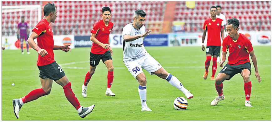
ଚେନ୍ନାଇନ୍ ଏଫସି ଓ ଟ୍ରିଭୁକନ ଆର୍ମି ଏଫସି ମଧ୍ୟରେ ଅନୁଷ୍ଠିତ ମ୍ୟାଚ୍ ।