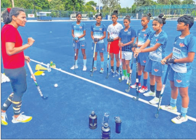
କ୍ୟାମ୍ପ ଅବସରରେ ହକି ଖେଳାଳିଙ୍କ ସହ ରାଣୀ ରାମପାଲ ।

ରାଜ୍ୟ ସରକାରଙ୍କ କ୍ରୀଡ଼ା ବିଭାଗ, ଓଡ଼ିଶା ହକି ଓ ନାଭାଲ ଟାଟା ଏଡ଼ଭିସର ମିଳିତ ଆହୁକ୍ରମ୍ୟରେ କଳିଙ୍ଗ ଷ୍ଟାଇକର୍ସରେ ଯୋଗଦାନ ମହିଳା ହକି ଷ୍ଟାଇକର୍ସ କ୍ୟାମ୍ପ ଆରମ୍ଭ ହୋଇଛି । ଭାରତୀୟ ମହିଳା ହକି ଦଳର ପୂର୍ବତନ ଅଧିନାୟିକା ରାଣୀ ରାମପାଲ ମେଣ୍ଡର ଓ କୋଚ୍‌ଭାବେ ଏହି କ୍ୟାମ୍ପ ଦାୟିତ୍ୱରେ ରହିଛନ୍ତି । ଏଥିରେ ଫରାଦୀ ଖେଳାଳିମାନଙ୍କୁ ବିଶେଷ ତାଲିମ ଦେବା ଆରମ୍ଭ କରିଛନ୍ତି ପ୍ରଭୁଶ୍ରୀ ରାଣୀ ରାମପାଲ । ଏହି କ୍ୟାମ୍ପ ୧୯ ତାରିଖ ପର୍ଯ୍ୟନ୍ତ ଚାଲିବ । ଷ୍ଟାଇକର୍ସ କ୍ୟାମ୍ପରେ ୨୫ ଖେଳାଳି ଭାଗ ନେଇଛନ୍ତି । ଓଡ଼ିଶା ନାଭାଲ ଟାଟା ହକି ହାଇପରଫର୍ମାଟ୍ ସେଣ୍ଟର, ପାନପୋଷ, ଷୋର୍ଟ୍ ହସ୍ତୁକ, ସାଲ୍ ଏକ୍ସପ୍ରେସ୍ ପୁନ୍ଦରଗଡ଼ ଏବଂ ସାଲ୍ ଏକ୍ସପ୍ରେସ୍ ଭୋପାଳ ପିଲାମାନେ ଏହି କ୍ୟାମ୍ପକୁ ବିଶେଷ ଉପକୃତ ହେବେ । “ଏପରି କ୍ୟାମ୍ପ ଆୟୋଜନ ଉତ୍ତମ ପଦକ୍ଷେପ । କ୍ୟାମ୍ପ ମାଧ୍ୟମରେ ଓଡ଼ିଶାର ଖେଳାଳିଙ୍କୁ ଯୁଁ ମୋର ଅଭିଳାଷ,