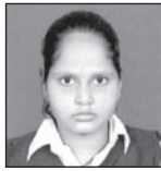
ସାର ସୁରଶିକା ପରିବାରବର୍ଗ