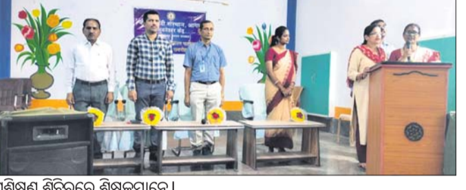
ପ୍ରଶିକ୍ଷଣ ଶିବିରରେ ଶିକ୍ଷକମାନେ।

ପାରଳାଖେମୁଣ୍ଡି (ବିଧିଧାରୀ ପରିଷଦ) ୧୪୮୮: ପାରଳାଖେମୁଣ୍ଡି ସ୍ଥିତ ପରାଧିକାରୀଙ୍କୁ ଦିଆଯାଇଛି ଯେଉଁଠି ମୂଳ ନିୟୁତ୍ ବିଦ୍ୟୁତ୍ ଶିକ୍ଷାଧିକାରୀଙ୍କୁ ଦିଆଯାଇଛି। ଶିକ୍ଷାଧିକାରୀଙ୍କୁ ଦିଆଯାଇଛି ଯେଉଁଠି ମୂଳ ନିୟୁତ୍ ବିଦ୍ୟୁତ୍ ଶିକ୍ଷାଧିକାରୀଙ୍କୁ ଦିଆଯାଇଛି।