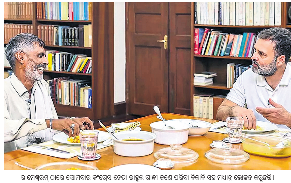
ରାମେଶ୍ୱରୀ ଠାରେ ସୋମବାର କଂଗ୍ରେସ ନେତା ରାହୁଲ ଗାନ୍ଧୀ ଜଣେ ପରିବା ବିକାଳି ସହ ମଧ୍ୟାହ୍ନ ଭୋଜନ କରୁଛନ୍ତି।

କେନ୍ଦ୍ର, ୧୪୮୮: କଂଗ୍ରେସ ନେତା ତଥା ରାଜ୍ୟ ସଭା ସଭ୍ୟ ରଣଦୀପ ସୁଜେଠିଆଳା ଭାଜପା ଏବଂ ଏହାର ସମର୍ଥକମାନଙ୍କୁ 'ରାକ୍ଷସ' କହିଛନ୍ତି। ହରିୟାଣାର କେନ୍ଦ୍ରରେ ରବିବାର କଂଗ୍ରେସର 'ଜନ ଆନ୍ଦୋଳନ' ଗାଳିକୁ ସମୟୋଚିତ କରି ସୁଜେଠିଆଳା ଭାଜପା ବିରୋଧରେ ଏଭଳି ଅପମାନକରଣ ଶବ୍ଦ ବ୍ୟବହାର କରିଛନ୍ତି। ନିମ୍ନୋକ୍ତ ନ ଦିଅ ପଛକେ ନିମ୍ନୋକ୍ତ ପାଇଁ ପରାଧୀନ ଅବସ୍ଥା ବ୍ୟବହାର କରୁଛନ୍ତି। ସୁଯୋଗ ଦିଅ ବୋଲି ସେ କହିଛନ୍ତି। ଭାଜପା ଏବଂ ଜେଡିପିର ଲୋକମାନେ ରାକ୍ଷସ। ଏହି ଦଳକୁ ଯେଉଁମାନେ ଭୋଗ ଦେଇଛନ୍ତି ଓ ସମର୍ଥନ କରୁଛନ୍ତି, ସେମାନେ ମଧ୍ୟ ରାକ୍ଷସ ବୋଲି କଂଗ୍ରେସ ନେତା କହିଥିଲେ। ତାଙ୍କର ଏହି ଭାଷଣକୁ ନେଇ ଭାଜପାର ଜାତୀୟ ମୁଖପାତ୍ର ସମ୍ବିତ ପାତ୍ର କଠା ସମାଲୋଚନା କରିଛନ୍ତି। ଯେଉଁ ଦଳ ଯୁବରାଜକୁ ଉପସ୍ଥାପନ କରିବାରେ ବାରମ୍ବାର ବିଫଳ ହୋଇଛି, ତାହା ଜନତା ଜନାର୍ଦ୍ଧନଙ୍କୁ ଗାଳି କରିବା ଆରମ୍ଭ କରିଛନ୍ତି ବୋଲି ସମ୍ବିତ କହିଛନ୍ତି। ଦେଶବାସୀ ତିଳୁ ହୁଁପାରୁଛନ୍ତି। ସେମାନେ କଂଗ୍ରେସର ଘୃଣା ନେତା ଶିପି ମଲ୍ଲକୁ ବନ୍ଦ କରିଦେବା ଲାଗି କାମ କରିବେ ବୋଲି ଭାଜପା ମୁଖପାତ୍ର କହିଛନ୍ତି।