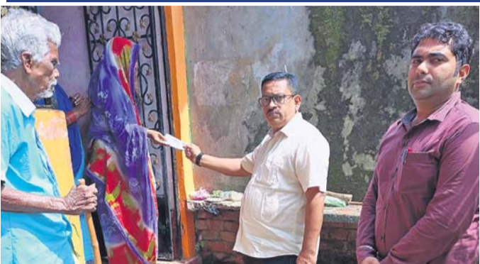
ମୃତ ରାଜ୍ୟ ଲିମିଟେଡ୍ ପ୍ରାଥମିକ ମୂଳ ନିୟୁତ୍ ବିଦ୍ୟୁତ୍ ସଂଘର ପରିବାରକୁ ସହାୟତା ପ୍ରଦାନ କରୁଛନ୍ତି।

ଶିକ୍ଷାଧିକାରୀଙ୍କୁ ଦିଆଯାଇଛି ଯେଉଁଠି ମୂଳ ନିୟୁତ୍ ବିଦ୍ୟୁତ୍ ଶିକ୍ଷାଧିକାରୀଙ୍କୁ ଦିଆଯାଇଛି। ଶିକ୍ଷାଧିକାରୀଙ୍କୁ ଦିଆଯାଇଛି ଯେଉଁଠି ମୂଳ ନିୟୁତ୍ ବିଦ୍ୟୁତ୍ ଶିକ୍ଷାଧିକାରୀଙ୍କୁ ଦିଆଯାଇଛି। ଶିକ୍ଷାଧିକାରୀଙ୍କୁ ଦିଆଯାଇଛି ଯେଉଁଠି ମୂଳ ନିୟୁତ୍ ବିଦ୍ୟୁତ୍ ଶିକ୍ଷାଧିକାରୀଙ୍କୁ ଦିଆଯାଇଛି।