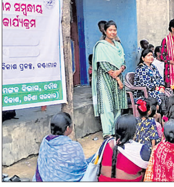
ପାଳା ମାଧ୍ୟମରେ ପୋଷଣଗତ ସମ୍ପର୍କରେ ସଚେତନ କରାଯାଇଛି।

କର୍ମୀ, ନାରାୟଣପ୍ରସାଦ ଗ୍ରାମର ଜନସାଧାରଣ ଯୋଗ ଦେଇଥିଲେ। ଶିଶୁର ଖାଦ୍ୟ, ଯତ୍ନ ଯଥା ଜନ୍ମ ପରେ କ୍ଷମ ସ୍ତରରେ ଆରମ୍ଭ କରି ଶିଶୁ ଜନ୍ମର ୨ବର୍ଷ ପର୍ଯ୍ୟନ୍ତ ଯାହା କିଛି ବରକାର ପାଳା ମାଧ୍ୟମରେ ଲୋକଙ୍କୁ ସଚେତନ କରାଯାଇଥିଲା। ପୋଷଣ ଅଭାବକୁ କଣ ହୁଏ ବର୍ଷ ଭାରତ ଉପରେ ମଧ୍ୟ ଲୋକମାନଙ୍କୁ ସଚେତନ କରାଯାଇଥିଲା।