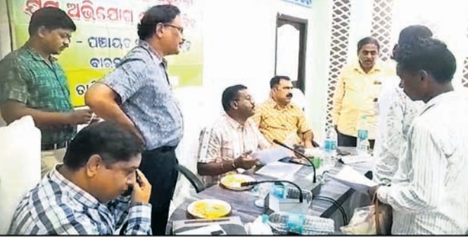
ମୁଗ୍ଧ ଅଭିଯୋଗ ଶୁଣାଣି ଶିବିରରେ ଉପସ୍ଥିତ ଅଧିକାରୀ।