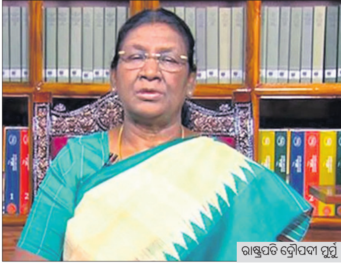
ରାଷ୍ଟ୍ରପତି ଡ୍ରୌପଦୀ ମୂର୍ତ୍ତି ଆହ୍ୱାନ ଦେଇଛନ୍ତି।

ନୂଆଦିଲ୍ଲୀ, ୧୪୮୮ (ପି.ଟି.): ଜାତି, ବର୍ଣ୍ଣ, ଭାଷା, ଅଞ୍ଚଳ, ପରିବାର ଏବଂ ବୃତ୍ତିଗତ ଭିନ୍ନତା ସତ୍ତ୍ୱେ ସମସ୍ତଙ୍କର ପରିଚୟ ଗୋଟିଏ।