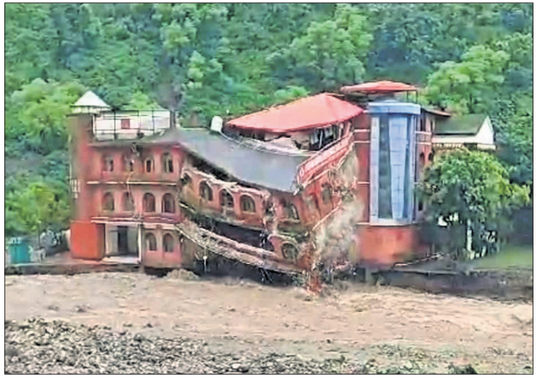
ଉତ୍ତରାଖଣ୍ଡର ତେରାଡୁନ୍ ଉପକଣ୍ଠରେ ଘରୋଇ ପ୍ରତିରକ୍ଷା ଟ୍ରେନିଂ ଏକାଡେମୀ ଭୁସ୍ଥିତି ପଡ଼ିଛି।