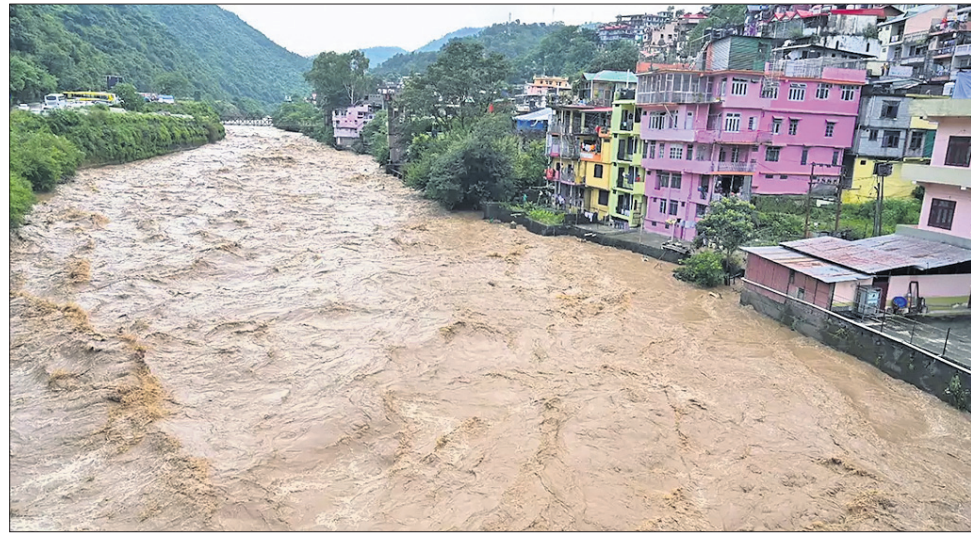
ହିମାଚଳ ପ୍ରଦେଶରେ ପ୍ରବଳ ବର୍ଷା ଯୋଗୁ ବ୍ୟାପି ନଦୀରେ ବନ୍ୟା ଆସିଛି।

ଡିପି ପରିବର୍ତ୍ତନ ପରେ ଭାଜପା ନେତାଙ୍କ ଚୁଲଚରଣ ଗୋଲଡେନ୍ ଟିକ୍ ଉତ୍ତାନ