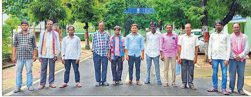
ଜିଲ୍ଲାପାଳଙ୍କୁ ଫେରାଦ ହୋଇଥିବା ଗ୍ରାମବାସୀ।