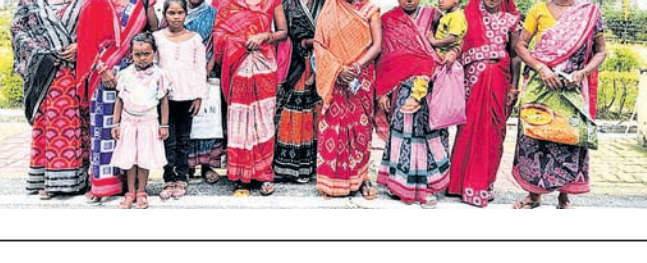
ଜିଲ୍ଲାପାଳଙ୍କୁ ଫେରାଦ ହୋଇଥିବା ବିସ୍ଥାପିତମାନେ।