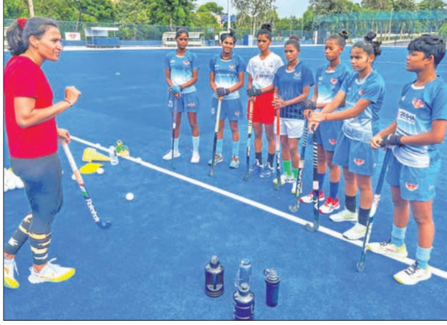
କ୍ୟାମ୍ପ ଅବସରରେ ହକି ଖେଳାଳିଙ୍କ ସହ ରାଣୀ ରାମପାଲ।

ରାଜ୍ୟ ସରକାରଙ୍କ କ୍ରୀଡ଼ା ବିଭାଗ, ଓଡ଼ିଶା ହକି ଓ ନାଭାଲ ଟୀମ ଏଭିଏର ମିଳିତ ଆନୁକୁଲ୍ୟରେ କଳିଙ୍ଗ ଷ୍ଟାଇଲକର୍ସ ଯୋଜନାରେ କଳିଙ୍ଗ ଷ୍ଟାଇଲକର୍ସ କ୍ୟାମ୍ପ ଆରମ୍ଭ ହୋଇଛି। ଭାରତୀୟ ମହିଳା ହକି ଦଳର ପୂର୍ବତନ ଅଧିନାୟକା ରାଣୀ ରାମପାଲ ମେଣ୍ଡର ଓ କୋଚ୍‌ଭାବେ ଏହି କ୍ୟାମ୍ପ ଦାୟିତ୍ୱରେ ରହିଛନ୍ତି। ଏଥିରେ ଫରଫାଉଣ୍ଡ ଖେଳାଳିମାନଙ୍କୁ ବିଶେଷ ତାଲିମ ଦେବା ଆରମ୍ଭ କରିଛନ୍ତି ପଦ୍ମଶ୍ରୀ ରାଣୀ ରାମପାଲ। ଏହି କ୍ୟାମ୍ପ ୧୯ ତାରିଖ ପର୍ଯ୍ୟନ୍ତ ଚାଲିବ। ଷ୍ଟାଇଲକର୍ସ କ୍ୟାମ୍ପରେ ୨୫ ଖେଳାଳି ଭାଗ ନେଇଛନ୍ତି। ଓଡ଼ିଶା ନାଭାଲ ଟୀମ ହକି ହାଇପରଫର୍ମାଟ୍ଟ୍ ସେଣ୍ଟର, ପାନପୋଷ, ଷୋର୍ଟ୍ ହସ୍ତୁଲ, ସାଇ ଏଭିଏ ପୁନରଗଡ଼ ଏବଂ ସାଇ ଏଭିଏ ଡୋପାଳ ପିଲାମାନେ ଏହି କ୍ୟାମ୍ପକୁ ବିଶେଷ ଉପକୃତ ହେବେ। “ଏପରି କ୍ୟାମ୍ପ ଆୟୋଜନ ଉତ୍ତମ ପଦକ୍ଷେପ। କ୍ୟାମ୍ପ ମାଧ୍ୟମରେ ଓଡ଼ିଶାର ଖେଳାଳିଙ୍କୁ ସୁ ମୋର ଅଭିଜ୍ଞତା,