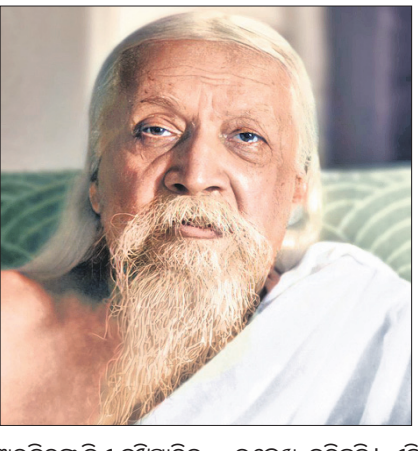
ବକ୍ତ୍ର ଗମାର ସ୍ୱରରେ ସେ ଘୋଷଣା କରିଯାଇଛନ୍ତି।

ତାଙ୍କର ସିଦ୍ଧାନ୍ତ ଆଧୁନିକ ଅଧ୍ୟାତ୍ମିକତାରେ ମଣିଷ ଗତିକୁ ଅତି ମାନସିକତା ଆଡ଼କୁ ନେଇଯାଇ ଥିବି ସେ ମହାମାନବ ଯୁଗପୁରୁଷ, ମହାଯୋଗୀଙ୍କ ୧୫୧୮ମ ପବିତ୍ର ଜନ୍ମଦିନରେ ଅଗଣିତ ପାଠକ ପାଠିକାମାନଙ୍କ ସହ ଆମେ ତାଙ୍କ ପାଠପଢ଼ରେ କୋଟି ପ୍ରାଣୀମାନ ନିବେଦନ କରୁଛି। 'ବନ୍ଦେ ମାତରମ୍' ମୋ: ୯୪୩୩ ୧୮୭୨୨୭