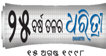
୧୫ ଅଗଷ୍ଟ ୧୯୯୮

ବିଚାରରେ ପରିପରିବା ଗଣ କଲାବେଳେ କାରଣ ପାଇବୁଛି। ଏହି ସମସ୍ୟାର ସମାଧାନ ପାଇଁ କେବଳ ପ୍ରିୟ ମାନ୍ୟଙ୍କ ଦ୍ୱାରା ଆଦିଷ୍ଟ ରୋଗେ ଅନେକ ଆଶା ସୂଚୀ ଚାଲିଛି। ଏହି ରୋଗେ ବଚିତାକୁ ଯତ୍ନକାରୀ ଘାଏ ହତାକ୍ତ ଦେଉଥିବାବେଳେ ଗଭର ବିକାଶ ଏବଂ ଗୋରପଦୀଙ୍କ ପ୍ରତ୍ୟା ଠାଏ ଜରିବାରେ ସାହାଯ୍ୟ କରୁଛି। ଉତ୍ତମ ଆଇଲ୍ (କୃତ୍ରିମ ବୁଦ୍ଧିମତ୍ତା) ସମ୍ପର୍କ ରୋଗେ ନାମ ରଖାଯାଇଛି ଗାଣ୍ଡୋ। ପ୍ରିୟଙ୍କୁ ଘର କୋଲମ୍ବରେ। ସେ ମେକାଗ୍ରେଡିକ୍ସ ଲ୍ୟୁନିଭର୍ସିଟିରେ ଡିପ୍ଲୋମା କରୁଛନ୍ତି। ସେ ୨୦୧୨ରେ ଗାଣ୍ଡୋ ରୋଗେ ନିର୍ମାଣ ଆରମ୍ଭ କରିଥିଲେ। ସେହି ବର୍ଷ ଏହାକୁ ବିକ୍ରି କରିବା ପାଇଁ ପ୍ରିମ୍ୟାନ ରୋଗୋଟିଏ କମ୍ପାନୀ ପ୍ରତିଷ୍ଠା କରିଥିଲେ। ଗାଣ୍ଡୋ ଦିଆଯାଇଛି, ଏହାର ସ୍ୱାଧୀନତା ହାତରେ ଉକ୍ତ ୫୦୦ଗ୍ରାମ, କାନ୍ଦ ୨୦ସେ.ମି., ଚଉଡ଼ା ୧୨ସେ.ମି ଏବଂ ଉଚ୍ଚତା ୧୦ ସେ.ମି.। ଏଥିରେ କ୍ୟାମେରା ରହିବା ସହ ଏବଂ ଆପ୍ଟିକାଲ ମଧ୍ୟ ଅଛି। ରୋଗେ ଚାଳି ହେବା ପରେ ତାହାକୁ ବଚିତାର ଗୋଟିଏ କୋଣରେ ରଖିଦେଇ ମୋବାଇଲ୍ ଆପ୍ଟିକାଲ ବ୍ୟବହାର କରି ତାହାର କାର୍ଯ୍ୟକ୍ଷେତ୍ର ସୀମା ଦୂର କରାଯାଉଛି। ପରେ ଏହା ଗଭ ମଧ୍ୟରେ ଧୀରେ ଧୀରେ ଅତି କରି ଘାଏ ନଷ୍ଟ କରିପାରିବ। ଏଥିରେ ପ୍ରକା ପିଆଧୁନିକ ସେନ୍ସର ଲଗାଯାଇଛି, ଯାହା ଗଭର ବୁଝି ଓ ସ୍ୱାସ୍ଥ୍ୟ ସମ୍ପର୍କରେ ସୂଚନା ଦେଇପାରିବ।