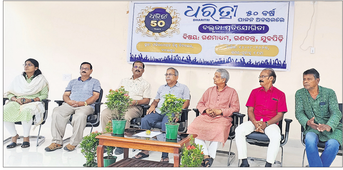
ବାଲେଶ୍ୱର ଜିଲା ଫକୀରମୋହନ ବିଶ୍ୱବିଦ୍ୟାଳୟରେ ଯୋଜନା 'ଧରିତ୍ରୀ' ପକ୍ଷରୁ ଆୟୋଜିତ 'ଗଣମାଧ୍ୟମ, ଗଣତନ୍ତ୍ର, ମୁରପିଢ଼ି' ଶୀର୍ଷକ ବକ୍ତୃତା ପ୍ରତିଯୋଗିତାରେ ଉପସ୍ଥିତ ଛାତ୍ରାଛାତ୍ରୀ ଓ ବିଶ୍ୱବିଦ୍ୟାଳୟର ପ୍ରାଧ୍ୟାପିକା, ପ୍ରାଧ୍ୟାପକ ଏବଂ ମଞ୍ଚାଧୀନ ଅତିଥି ଓ ବିଚାରକ ମଣ୍ଡଳୀ।

ବାଲେଶ୍ୱର (ମାନସ ବିଶ୍ୱାଳ)/ ରେପୁଣ୍ଡା(ରବୀନ୍ଦ୍ର ମହାକୁଡ଼)୧୪।