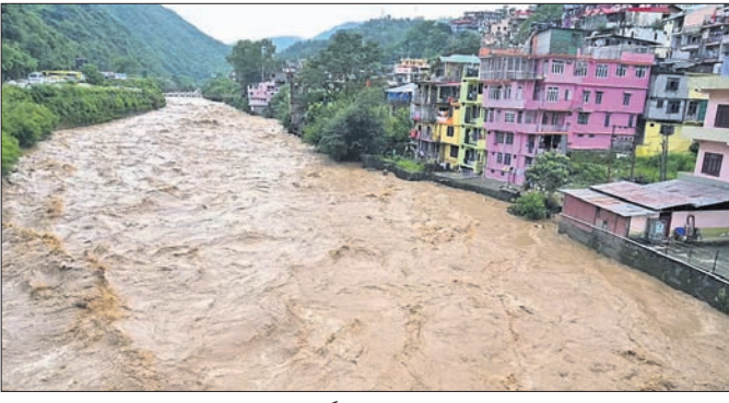
ହିମାଚଳ ପ୍ରଦେଶରେ ପ୍ରବଳ ବର୍ଷା ଯୋଗୁ ବ୍ୟାପକ ସଂଘଟଣା ଦେଖା ଦେଖା