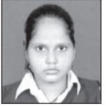
ସାରା ସୁରଶିକା ପରିବାରବର୍ଗ