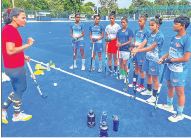
କ୍ୟାମ୍ପ ଅବସରରେ ହକି ଖେଳାଳିଙ୍କ ସହ ରାଶୀ ରାମପାଲ।

ରାଜ୍ୟ ସରକାରଙ୍କ କ୍ରୀଡ଼ା ବିଭାଗ, ଓଡ଼ିଶା ହକି ଓ ନାଭାଲ ଟୀମା ଏଭିପିର ମିଳିତ ଆହ୍ୱାନରେ କଳିଙ୍ଗ ଷ୍ଟାଫ୍ ସ୍ତ୍ରୀମାନଙ୍କୁ ଯୋଗଦାନ କରାଯାଇଛି। ଭାରତୀୟ ମହିଳା ହକି ଦଳର ପୂର୍ବତନ ଅଧିନାୟିକା ରାଶୀ ରାମପାଲ ମେଣ୍ଡର ଓ କୋଚ୍‌ଭାବେ ଏହି କ୍ୟାମ୍ପ ଦାୟିତ୍ୱରେ ରହିଛନ୍ତି। ଏଥିରେ ଫରଫାଉଟ୍ ଖେଳାଳିମାନଙ୍କୁ ବିଶେଷ ଚାଲିମ ଦେବା ଆରମ୍ଭ କରିଛନ୍ତି ପୂର୍ଣ୍ଣା ରାଶୀ ରାମପାଲ। ଏହି କ୍ୟାମ୍ପ ୧୯ ତାରିଖ ପର୍ଯ୍ୟନ୍ତ ଚାଲିବ। ଷ୍ଟାଫ୍ ସ୍ତ୍ରୀମାନଙ୍କୁ ୨୫ ଖେଳାଳି ଭାଗ ନେଇଛନ୍ତି। ଓଡ଼ିଶା ନାଭାଲ ଟୀମା ହକି ହାଇପରଫୋର୍ମ୍ସ୍ ସେଟ୍, ପାନପୋଷ, ଷୋର୍ଟ୍ ହେଲ୍ମେଟ୍, ସ୍ପାଲ୍ଡିଂ ପ୍ରୋଟେକ୍ଟିଭ୍ ଏବଂ ସାଲ୍ ଏଭିପିଜ୍ ଭୋପାଳ ପିଲାମାନେ ଏହି କ୍ୟାମ୍ପରୁ ବିଶେଷ ଉପକୃତ ହେବେ। “ଏପରି କ୍ୟାମ୍ପ ଆୟୋଜନ ଉତ୍ତମ ପଦକ୍ଷେପ। କ୍ୟାମ୍ପ ମାଧ୍ୟମରେ ଓଡ଼ିଶାର ଷ୍ଟାଫ୍ ସ୍ତ୍ରୀମାନଙ୍କୁ ପୁଣି ମୋର ଅଭିଜ୍ଞତା,