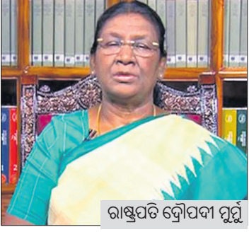
ରାଷ୍ଟ୍ରପତି ଦ୍ରୌପଦୀ ମୁର୍ମୁ

ନୂଆଦିଲ୍ଲୀ, ୧୫୮୮ (ପି.ଟି.) କାନ୍ଧି, ବର୍ଷା, ଭାଷା, ଅଞ୍ଚଳ, ପରିବାର ଏବଂ ବୃତ୍ତିଗତ ଭିନ୍ନତା ସତ୍ତ୍ୱେ ସମସ୍ତଙ୍କର ପରିଚୟ ଗୋଟିଏ। ତାହା ହେଲା ସେମାନେ ଭାରତର ନାଗରିକ। ପ୍ରତ୍ୟେକ ସମାନ ନାଗରିକ ଓ ସେମାନଙ୍କୁ ଏହି ଦେଶରେ ସମାନ ସୁଯୋଗ, ଅଧିକାର ଓ କର୍ତ୍ତବ୍ୟ ମିଳିଛି। ତେଣୁ ସଦ୍ଭାବନା ଓ ଭ୍ରାତୃଭାବ ସହ ରାଷ୍ଟ୍ର ନିର୍ମାଣ ସମୂହ ସାଧାରଣ କରିବା ଲାଗି ଆଗେଇ ଆସିବାକୁ ରାଷ୍ଟ୍ରପତି ଦ୍ରୌପଦୀ ମୁର୍ମୁ ଆହ୍ୱାନ ଦେଇଛନ୍ତି। ୭୭ତମ ସ୍ୱାଧୀନତା ଦିବସର ପୂର୍ବ ସନ୍ଧ୍ୟାରେ ରାଷ୍ଟ୍ରକୁ ସମୋଦ୍ଧୃତ କରି ରାଷ୍ଟ୍ରପତି ମହିଳା ସ୍ୱାଧୀନତା ସଂଗ୍ରାମୀ ମାତୃଜନା ହାଜରା, କନକଲତା ବହୁଗୁଣ, କରୁଣା ବାଲିଆ, ସରୋଜିନୀ ନାଲନ୍ଦା, ଅନୁ ସ୍ୱାମୀନାଥନ, ରମାଦେବୀ, ଅରୁଣା ଅଧରପ ଅଲି ଏବଂ ସୁରେଶ କୁମାରୀଙ୍କୁ ସମେତ ପଠାଇଥିଲେ। ଦେଶର ବିକାଶ ଓ ସେବାର ପ୍ରତ୍ୟେକ କ୍ଷେତ୍ରକୁ ମହିଳାମାନଙ୍କ ଉଲ୍ଲେଖନୀୟ ଅବଦାନ ରାଷ୍ଟ୍ରର ଗୌରବ ବଢ଼ାଇଛି। ମହିଳାମାନଙ୍କ ଆର୍ଥିକ ସଶକ୍ତୀକରଣ ଦେଶକୁ ସ୍ୱତନ୍ତ୍ର ଫୋକସ୍ ଦେବା ସହ ପରିବାର ଓ ସମାଜରେ ସେମାନଙ୍କ ଭୂମିକୁ ସୁଦୃଢ଼ କରିବା ରାଷ୍ଟ୍ରପତି କହିଥିଲେ।