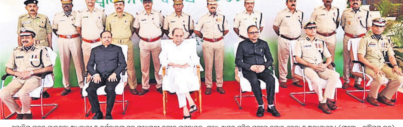
ପୋଲିସ ପଦକ ପାଇଥିବା ଅଧିକାରୀ ଓ କର୍ମଚାରୀଙ୍କ ସହ ପୂଜ୍ୟମାମୁନୀ ନବୀନ ପଟ୍ଟନାୟକ, ପୂଜ୍ୟ ଶାସନ ସଚିବ ପ୍ରଦୀପ କୁମାର ଜେନା ଓ ଅନ୍ୟମାନେ।