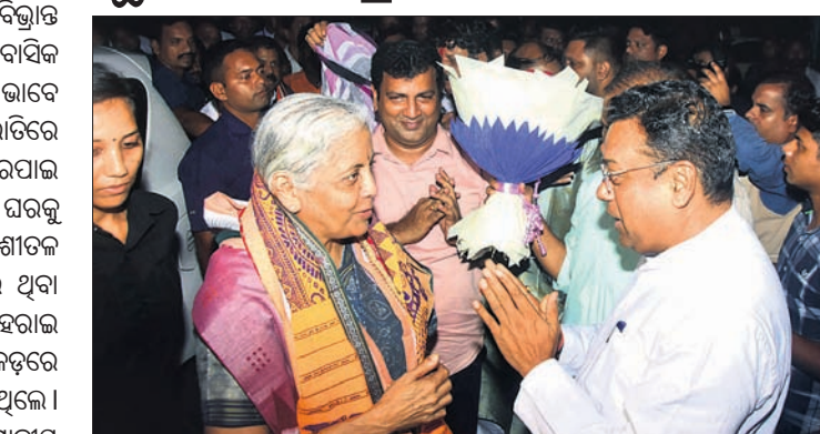
କେନ୍ଦ୍ର ଅର୍ଥମନ୍ତ୍ରୀ ନିର୍ମଳା ସୀତାରାମନଙ୍କୁ ଭାବନା ରାଷ୍ଟ୍ରୀୟ ପ୍ରବକ୍ତା ସମିତ ପାତ୍ର ସ୍ୱାଗତ କରୁଛନ୍ତି।