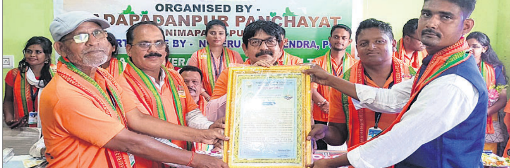
ସମାରୋହରେ ଅତିଥିକ ଗହଣରେ ସମ୍ବର୍ଦ୍ଧିତ ପ୍ରତିଭା।