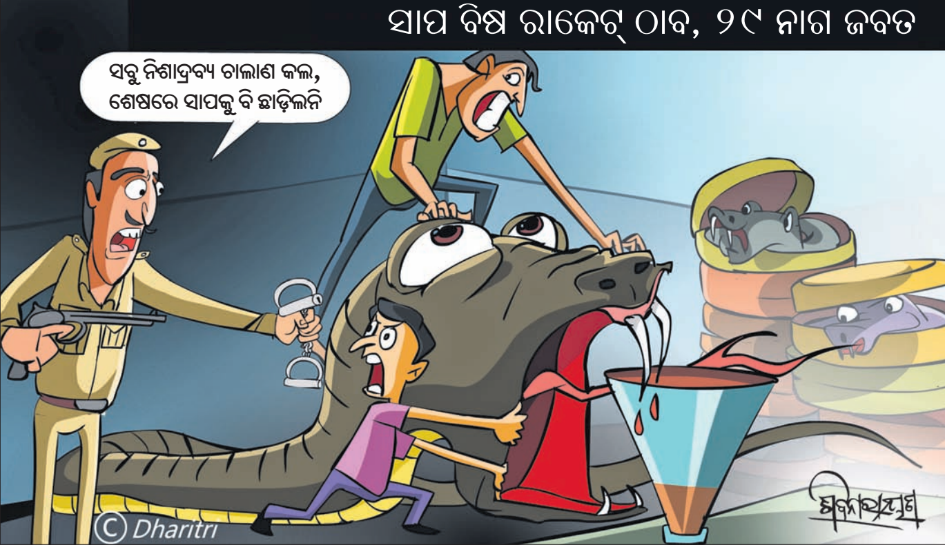
ସବୁ ନିଶାନ୍ତ୍ରବ୍ୟ ବାଲାଇ କଲ, ଶେଷରେ ସାପକୁ ବି ଛାଡ଼ିଲନି