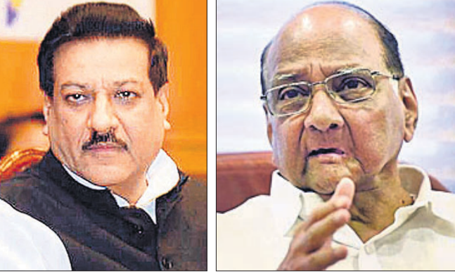
ପୃଥ୍ୱୀରାଜ ଚୌହାନ ଶରଦ ପାଞ୍ଚର

ମହାରାଷ୍ଟ୍ରରେ ଚାଲିଥିବା ରାଜନୈତିକ ଅସ୍ଥିରତା ମଧ୍ୟରେ ଏନସିପି ସୁପ୍ରିମୋ ଶରଦ ପାଞ୍ଚର ବୁଧବାର ଭାଜପାରୁ କୌଣସି ଅଫର ମିଳି ନ ଥିବା ସ୍ପଷ୍ଟ କରିଛନ୍ତି। ଶରଦ ପାଞ୍ଚର କଂଗ୍ରେସ ନେତା ତଥା ପୂର୍ବତନ ମୁଖ୍ୟମନ୍ତ୍ରୀ ପୃଥ୍ୱୀରାଜ ଚୌହାନଙ୍କ ଦାବିକୁ ଖଣ୍ଡନ କରି କହିଛନ୍ତି, ମୋତେ ଭାଜପା ପକ୍ଷରୁ ସରକାରକୁ ଚାହୁଁଛୁ ଏବଂ ପୃଥ୍ୱୀରାଜ ଚୌହାନଙ୍କୁ ଭାଜପା ଅସ୍ଥିର କରିଥିଲେ। କୌଣସି ଅଫର ଦିଆଯାଇନାହିଁ। ଅଜିତ ପାଞ୍ଚରଙ୍କ ସହ ହୋଇଥିବା ବୈଠକରେ ଅନୁଭୂତ ହେବ। ଭାଜପା ସହିତ ଲଢିବା ପାଇଁ ଏଠାରେ ଏକ ସଫଳ ରଣନୀତି ପ୍ରସ୍ତୁତ ହେବ ବୋଲି ସେ କହିଛନ୍ତି।