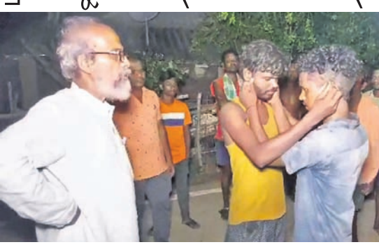
ଏମ୍ପି ପ୍ରତାପ ଷଡ଼ଙ୍ଗୀଙ୍କ ଆଗରେ ଭୁଇଁ ଯୁବକ ଉଚ୍ଚରସ୍ ହେଉଛନ୍ତି।