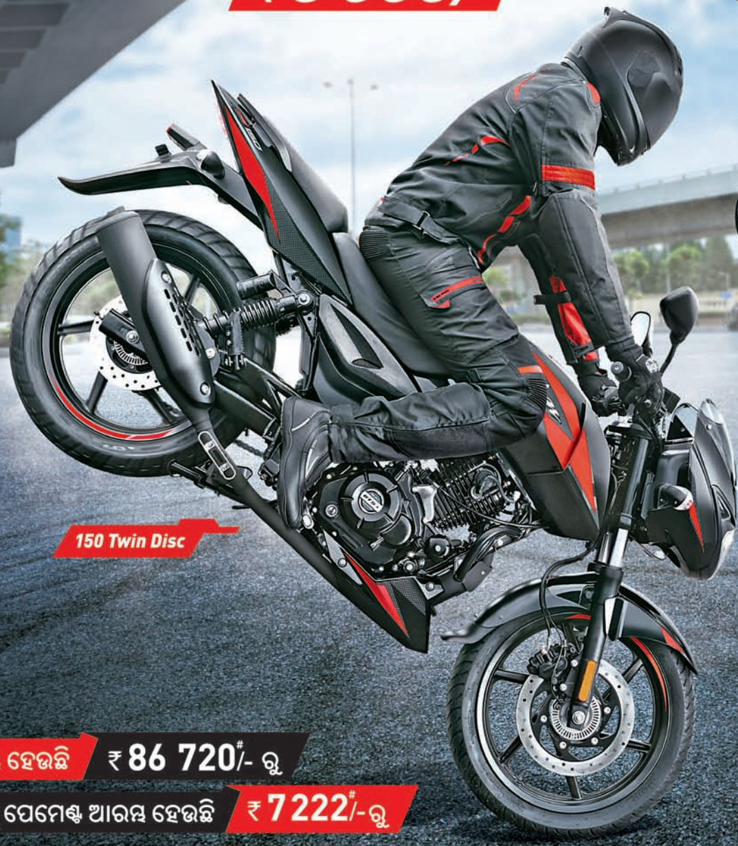
150 Twin Disc