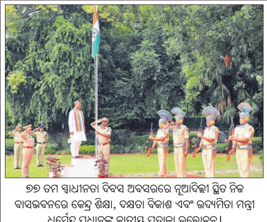
୭୭ ତମ ସ୍ଵାଧୀନତା ଦିବସ ଅବସରରେ ନୂଆଦିଲ୍ଲୀ ସ୍ଥିତ ନିଜ ବାସଭବନରେ କେନ୍ଦ୍ର ଶିକ୍ଷା, ଦକ୍ଷତା ବିକାଶ ଏବଂ ଉତ୍ପାଦନା ମନ୍ତ୍ରୀ ଧର୍ମେନ୍ଦ୍ର ପ୍ରଧାନଙ୍କ କାର୍ଯ୍ୟକ୍ରମର ଉଦ୍ଘାଟନ।