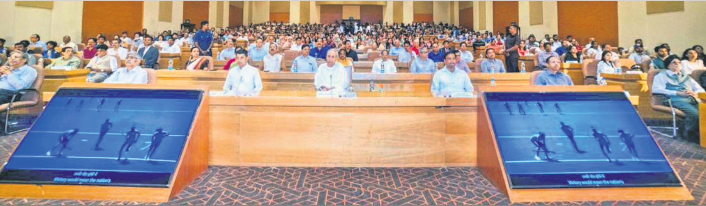
ସ୍ୱାଧୀନତା ଦିବସ ଅବସରରେ ଲୋକସେବା ଭବନର କର୍ତ୍ତବ୍ୟନିଷ୍ଠ ସେକ୍ଟରରେ ମଙ୍ଗଳବାର ପ୍ରାମାଣିକ ଚଳଚ୍ଚିତ୍ର 'ଇଣ୍ଡିଆଲ୍ ଗେମ୍' ଉଦ୍ଘାଟନ ଅବସରରେ ମୁଖ୍ୟମନ୍ତ୍ରୀ ନବୀନ ପଟ୍ଟନାୟକ ଓ ଅନ୍ୟ ଅତିଥିବୃନ୍ଦ ।