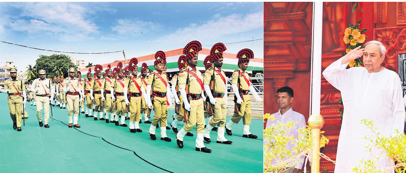
ଭୁବନେଶ୍ୱର ପ୍ରବର୍ତ୍ତନା ପଡ଼ିଆଠାରେ ମଙ୍ଗଳବାର ଅନୁଷ୍ଠିତ ରାଜ୍ୟସ୍ତ୍ରୀୟ ସାଧାନ୍ତା ଦିବସ ସମାରୋହରେ ସମ୍ମିଳିତ ପରେ ଅଭିବାଦନ ଗ୍ରହଣ କରୁଥିବା ମୁଖ୍ୟମନ୍ତ୍ରୀ ନବୀନ ପଟ୍ଟନାୟକ ।

ପଞ୍ଜି ଆୟୁଷୀ ସଶକ୍ତାକରଣ ପାଇଁ ଆର୍ଥିକ ଅଭିଭାବନା କରିବାକୁ ପାରିବେ । ଭାରତର ଗୌରବ ବଢ଼ାଇଛି । ଓଡ଼ିଶା ରୂପାନ୍ତର ଯୁଗରେ ପହଞ୍ଚିଛି । ଶିକ୍ଷା, ସ୍ୱାସ୍ଥ୍ୟ, ପର୍ଯ୍ୟଟନ, ଭିତ୍ତିଭୂମି ଆଦି ବିକାଶର ସବୁ କ୍ଷେତ୍ରରେ ୫-୬ ନିର୍ଦ୍ଧାରିତ ପ୍ରୟୋଗ ନୂଆ ଆଶା ସୃଷ୍ଟି କରିଛି । ଏହା, ଗରିବ, ମଧ୍ୟବିତ୍ତ ସମସ୍ତେ ଏ ରୂପାନ୍ତରରେ ସାମିଲ ହୋଇଛନ୍ତି । ଓଡ଼ିଶାର ଅର୍ଥନୀତି ଗତି ନୂତନ ବୃହତ୍ ସେତୁ ନିର୍ମାଣ ପାଇଁ ୩୯ କୋଟି ଟଙ୍କା ମଞ୍ଜୁର କରିଛନ୍ତି ।