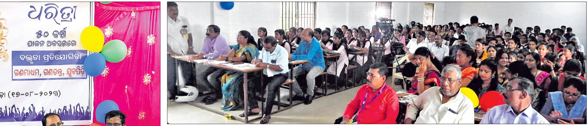
ପ୍ରତିଯୋଗିତାରେ ଭାଗ ନେଇଥିବା ଛାତ୍ରାଛାତ୍ର

ଡେବେଟ୍ ପ୍ରତିଯୋଗିତାରେ ଉପସ୍ଥିତ ଛାତ୍ରାଛାତ୍ର, ବିଚାରକ, ଅଧ୍ୟାପକ ଅଧ୍ୟାପିକା ଓ ବିଶିଷ୍ଟ ବ୍ୟକ୍ତିମାନେ।