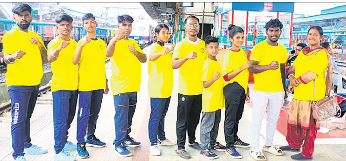
ଓଡ଼ିଶା କିକ୍ ବକ୍ସ ଦଳ।