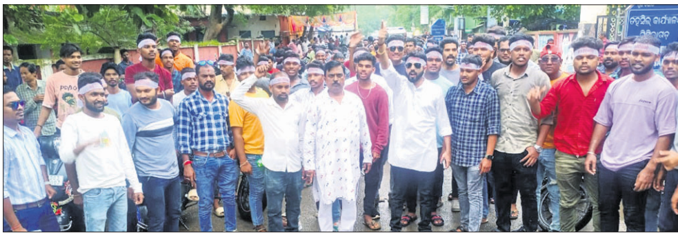
ଆନ୍ଦୋଳନରେ ସାମିଲ ଜିଲ୍ଲା କ୍ରିୟାଳୁଷ୍ଟନ କମିଟି ସଦସ୍ୟମାନେ।

ଚିଲିକାଗଡ଼, ୧୭।୮ (ଶରତ ମିଶ୍ର) ଚିଲିକାଗଡ଼ ଜିଲ୍ଲା ଦାବିକୁ ଅଧିକ ଶକ୍ତି କରାଇ ଜିଲ୍ଲା କ୍ରିୟାଳୁଷ୍ଟନ କମିଟି କମିଟି ଆହ୍ୱାନକ୍ରମେ ଗୁରୁତ୍ୱ ଦିଆଯାଇଛି। ବିଦ୍ୟୁତ୍ ଶ୍ରମିକ କର୍ମଚାରୀ ଏକତା ମଞ୍ଚର ଦାବିଗୁଡ଼ିକୁ ତୁରନ୍ତ ସମାଧାନ କରିବାକୁ ମୁଖ୍ୟମନ୍ତ୍ରୀଙ୍କୁ କାର୍ଯ୍ୟାଳୟକୁ ଶକ୍ତି ସଚିବଙ୍କୁ ନିର୍ଦ୍ଦେଶ ଦିଆଯାଇଛି। ଏଥିପ୍ରତି ଉପରୋକ୍ତ ଅଧ୍ୟକ୍ଷଙ୍କୁ ମଧ୍ୟ ଶକ୍ତି ବିଭାଗ ପକ୍ଷରୁ ନିର୍ଦ୍ଦେଶ ଦିଆଯାଇଛି। ଉପରୋକ୍ତ ଅଧ୍ୟକ୍ଷ ଦାବି ପୂରଣ ନେଇ ଏକତା ମଞ୍ଚର ନେତୃମାନଙ୍କୁ ପ୍ରତିଶ୍ରୁତି ଦେଇଛନ୍ତି। ମୁଖ୍ୟମନ୍ତ୍ରୀଙ୍କ ନିର୍ଦ୍ଦେଶ ପରେ ଯଦି ଉପରୋକ୍ତ ଏବଂ ଶକ୍ତି ବିଭାଗ ଦାବି ପୂରଣରେ ବିଳମ୍ବ କରନ୍ତି ତେବେ ମଞ୍ଚ ପୁଣି ଆନ୍ଦୋଳନକୁ ଉତ୍ସାହୀ କରିବେ।