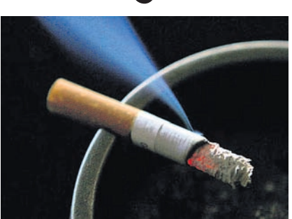
ନେବା ଏବଂ ନିୟମ ଭାଙ୍ଗିବା ଭଳି କାର୍ଯ୍ୟ ସହ ସମ୍ପୂର୍ଣ୍ଣ ଧୂମର ପଦାର୍ଥ ହେଉଛି ମହିଷ ଚିପ୍ସ, ଯାହା ସୂଚନା ପ୍ରକ୍ରିୟାକରଣ କରିଥାଏ। ଏଥିସହ ସମାନ କିଶୋର ଧୂମପାନକାରୀଙ୍କ ମହିଷର ତାହାଣ ଅଂଶରେ କମ୍

ଲଣ୍ଡନ: ଏକ ଅଧ୍ୟୟନରୁ ଜଣାପଡ଼ିଛି ଯେ ଧୂମପାନ କରୁଥିବା କିଶୋରଙ୍କ ମହିଷ ଅନ୍ୟ କିଶୋରମାନଙ୍କ ମହିଷଠାରୁ ଭିନ୍ନ। ବ୍ରିଟେନ୍‌ର କେମ୍ବ୍ରିଜ୍, ୱାର୍‌ସ୍‌ବିକ୍ ବିଶ୍ୱବିଦ୍ୟାଳୟ ଏବଂ ଚାଇନାର ପୁଚାନ୍ ମୁନିକର୍ସିଟି ଦ୍ୱାରା ପରିଚାଳିତ ଏକ ଅନୁସନ୍ଧାନକାରୀ କଳ ୧୪ ବର୍ଷ ବୟସରୁ ସିଗାରେଟ୍ ଚାଣିବା ଆରମ୍ଭ କରିଥିବା କିଶୋରମାନଙ୍କ ମହିଷର ବାମ ପ୍ରଣାଳୀ ଲୋଡ୍‌ର ଏକ ଅଂଶରେ କିଛି ଧୂମର ପଦାର୍ଥ ପାଇଥିଲେ।