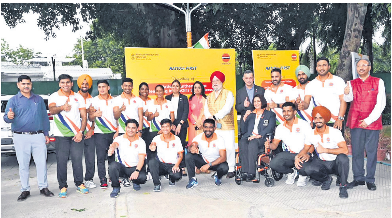
ସ୍ୱାଧୀନତା ଦିବସ ଅବସରରେ ଭାରତୀୟ କ୍ରୀଡ଼ାବିତ୍ତ୍ୱ ଉଦ୍ଦେଶ୍ୟରେ ଏକ ସ୍ୱତନ୍ତ୍ର ଭିଡିଓ 'ଇନ୍ଦ ହୋ'କୁ ପେଟ୍ରୋଲିୟମ ଆଣ୍ଡ ନାଚୁରାଲ ଗ୍ୟାସ୍ ମନ୍ତ୍ରୀ ହରଦୀପ ସିଂ ପୁରୀ ଆବୁଦ୍ଧୀନିକ ଭାବେ ଉଦ୍ଘୋଷଣ କରିଛନ୍ତି।