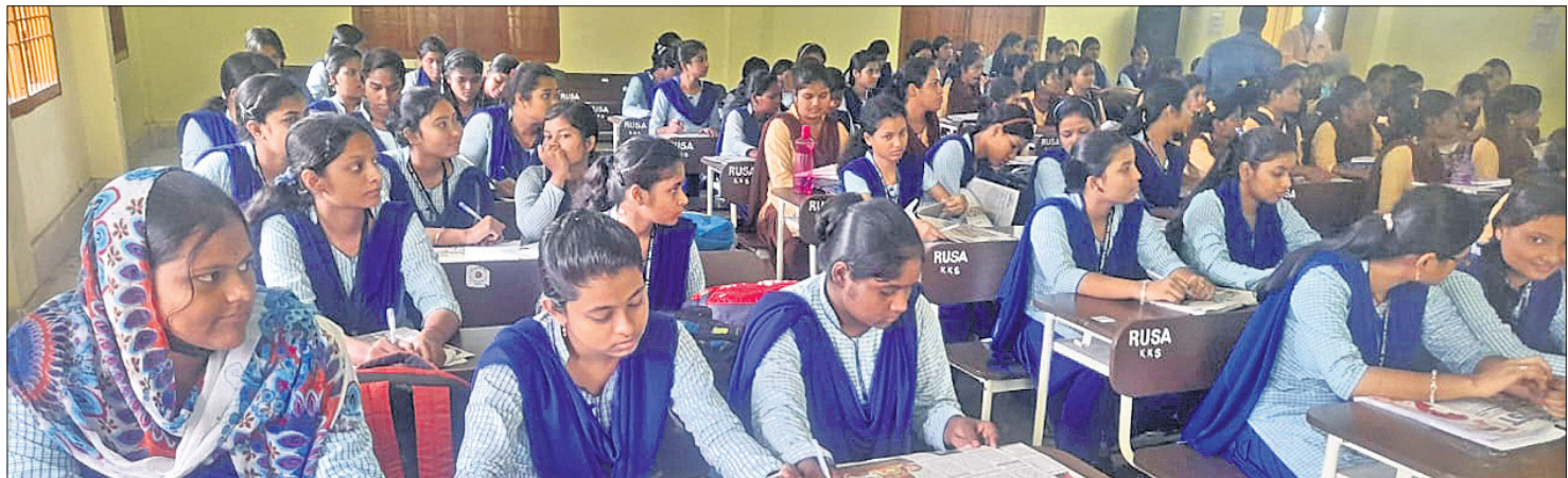
ଧରିତ୍ରୀ ପ୍ରସ୍ତୁତ ଆୟୋଜିତ 'ଗଣମାଧ୍ୟମ, ଗଣତନ୍ତ୍ର ଓ ଯୁବପିଢ଼ି' ଶୀର୍ଷକ ବକ୍ତୃତା ପ୍ରତିଯୋଗିତାରେ ମଞ୍ଚାଧୀନ ଅତିଥି ଓ ବିଚାରକ ମଣ୍ଡଳୀ(ବାମ)। କାର୍ଯ୍ୟକ୍ରମରେ ଉପସ୍ଥିତ ଛାତ୍ରାଛାତ୍ର।