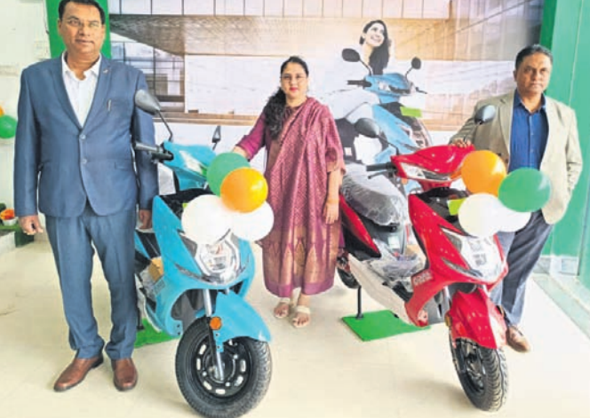
ମତେଲଗୁଡିକ ଲୋ-ସ୍ପିଡ୍ ସେଗମେଣ୍ଟର ଏକ ଅଂଶ। ଉଲ୍ଲେଖଯୋଗ୍ୟ, ଓକାୟା ଇଭିର ଉତ୍ପାଦ ଲାଇଫ୍‌ଟାଇମ୍ ଗ୍ରାଉଥ୍ ବ୍ରେକିଙ୍ଗ୍ ଏଲ୍‌ଏସ୍‌ପି (ଲିମିଟ୍‌ସ୍ ଟେମ୍ପୋ) ଫର୍‌ପ୍ରେସର୍ ବ୍ୟାଚେର ଟେକ୍ନୋଲୋଜିକୁ ବୈଶିଷ୍ଟ୍ୟ କରିଥାଏ।

ଭୁବନେଶ୍ୱର, ୧୭।୮ (ଅଭୟ ଦାଶ) ଦେଶର ପ୍ରମୁଖ ଇଲେକ୍ଟ୍ରୋନିକ୍ସ (ଇଭି) ନିର୍ମାତା ଓକାୟା ଇଭିର ଅତ୍ୟାଧୁନିକ ତଥା ଏକ୍ସକୁସିଭ୍ ଆଉଟଲେଟ୍ ନିକଟରେ ଖଣ୍ଡଗିରି ଠାରେ ଉଦ୍ଘାଟିତ ହୋଇଯାଇଛି। ଓକାୟା ଇଭିର ସ୍ୱାକ୍ଷର ପ୍ରତିଷ୍ଠାପକ ଏ ଆଉଟଲେଟ୍ ଆରମ୍ଭ କରିବା ସହ ଏହାକୁ ନିଜର ଏକ ଉପଭୋକ୍ତାମାନେ ପାଇପାରିବେ।