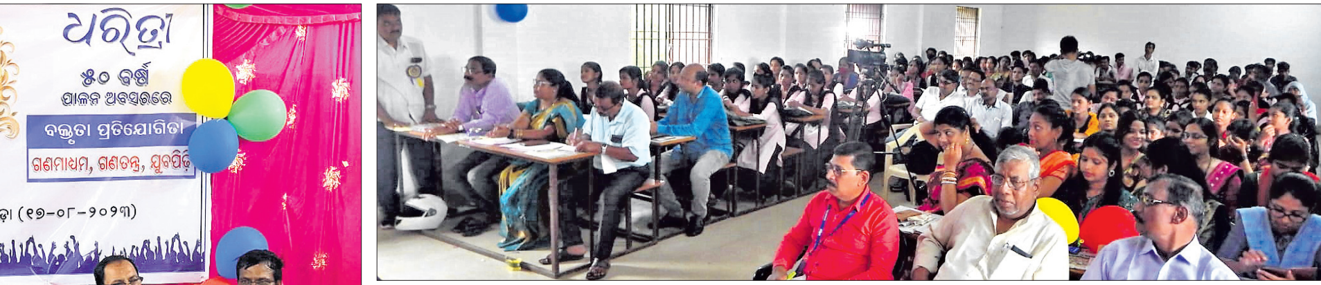
ପ୍ରତିଯୋଗିତାରେ ଭାଗ ନେଇଥିବା ଛାତ୍ରାଛାତ୍ର

ଡେବେଟ୍ ପ୍ରତିଯୋଗିତାରେ ଉପସ୍ଥିତ ଛାତ୍ରାଛାତ୍ର, ବିଚାରକ, ଅଧ୍ୟାପକ ଅଧ୍ୟାପିକା ଓ ବିଶିଷ୍ଟ ବ୍ୟକ୍ତିମାନେ।