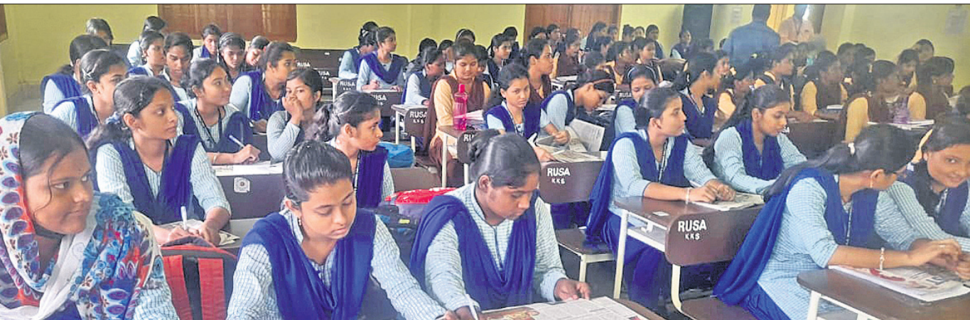
ଧରିତ୍ରୀ ପ୍ରସନ୍ନ ଆୟୋଜିତ 'ଗଣମାଧ୍ୟମ, ଗଣତନ୍ତ୍ର ଓ ଯୁବପିଢ଼ି' ଶୀର୍ଷକ ବକ୍ତୃତା ପ୍ରତିଯୋଗିତାରେ ମଞ୍ଚାଧୀନ ଅତିଥି ଓ ବିଚାରକ ମଣ୍ଡଳୀ(ବାମ)। କାର୍ଯ୍ୟକ୍ରମରେ ଉପସ୍ଥିତ ଛାତ୍ରାଛାତ୍ର।