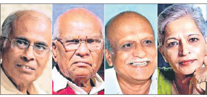
ନରେନ୍ଦ୍ର ଡା.ଭୋଲକର, ଗୋବିନ୍ଦ ପାନସାରେ ଏମ୍.ଏମ୍. କାଲବୁର୍ଗୀ ଗୌରୀ ଲଙ୍କେଶ

ନୂଆଦିଲ୍ଲୀ, ୧୮ (ପି.ଟି.): ହେତୁବାଦୀ ନରେନ୍ଦ୍ର ଡା.ଭୋଲକର, ସିପିଆଇ ନେତା ଗୋବିନ୍ଦ ପାନସାରେ, ସାମାଜିକ କର୍ମୀ ତଥା ସାମ୍ବାଦିକ ଗୌରୀ ଲଙ୍କେଶ ଏବଂ ବିଜ୍ଞାନ ଏମ୍.ଏମ୍. କାଲବୁର୍ଗୀ ହତ୍ୟାକାଣ୍ଡ ପଛରେ କୌଣସି ସମାନ ସୂତ୍ର ରହିଛି କି ବୋଲି ସୁପ୍ରିମକୋର୍ଟ ଶୁକ୍ରବାର କେନ୍ଦ୍ରୀୟ ତଦନ୍ତ ବ୍ୟୁରୋ (ସିପିଆଇ)କୁ ପ୍ରଶ୍ନ କରିଛନ୍ତି।