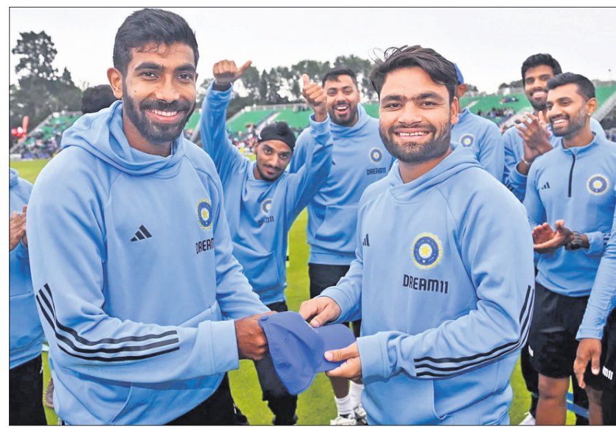
ରିକ୍ସ ସିଂହାଙ୍କୁ ୬୯୦ ଅନ୍ତର୍ଜାତୀୟ କ୍ୟାପ୍ ପ୍ରଦାନ କରୁଥିବା ଅଧିନାୟକ ଯଶପ୍ରୀତ୍ ବୃନ୍ଦାବା