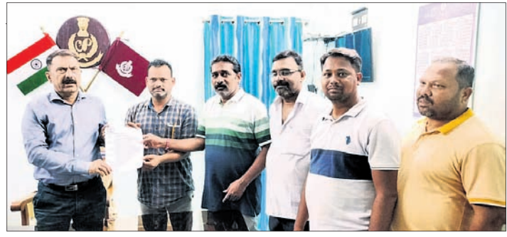
ମିଡ଼ିଆ ସଂଘର କର୍ମକର୍ତ୍ତା ଏସ୍ପିଙ୍କୁ ସ୍ମାରକପତ୍ର ପ୍ରଦାନ କରୁଛନ୍ତି। ସୋନପୁର, ୧୮