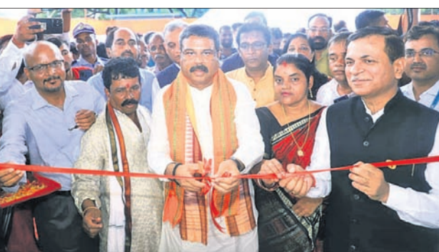
ଭୁବନେଶ୍ୱର ଧର୍ମବିହାରରେ ପ୍ରାକୃତିକ ଗ୍ୟାସ୍ ଆଧାରିତ 'ଶବଦାହ ଗୃହ' ଉଦ୍ଘାଟନ କରୁଛନ୍ତି କେନ୍ଦ୍ରମନ୍ତ୍ରୀ ଧର୍ମେନ୍ଦ୍ର ପ୍ରଧାନ।