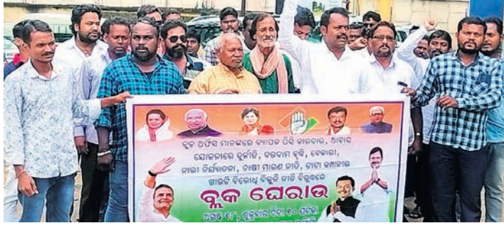
କଂଗ୍ରେସ ପକ୍ଷରୁ ବୁକ୍ କାର୍ଯ୍ୟାଳୟ ଘୋରାଉ କରାଯାଇଛି ।

ସରକାରୀ କାର୍ଯ୍ୟାଳୟ ରୂପରେ ବ୍ୟାପକ ପରି କାରବାର, ଆବାସ ଯୋଜନାରେ