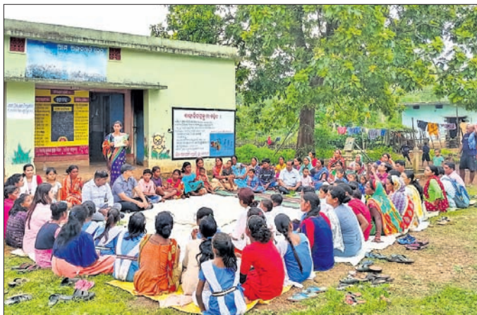
ବୈଠକରେ ସ୍ୱେଚ୍ଛାସେବୀ, ଗ୍ରାମବାସୀଙ୍କ ସମେତ ଅନ୍ୟମାନେ।

କାମାକ୍ଷାନଗର, ୧୮୮୮(ଅମଳାକ୍ଷର) ବାଳ ଶ୍ରମିକ ଭଳି ଯୁଗ୍ୟ ପ୍ରଥା ବିରୋଧରେ ସ୍ୱର ଉତ୍ତୋଳନ କରିବା ଲାଗି ସେମାନଙ୍କୁ ପ୍ରଶିକ୍ଷଣ ଦିଆଯାଇଛି।