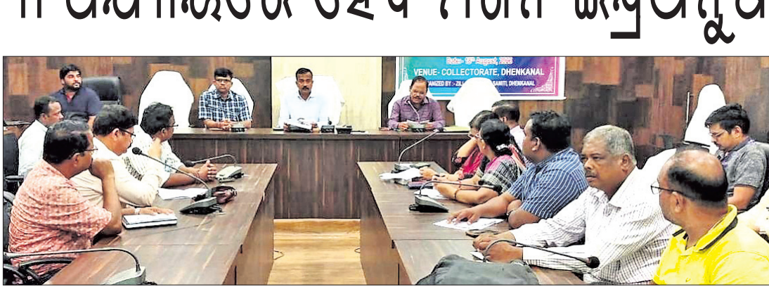
ମିଶନ ଇନ୍ଦ୍ରଧନୁଷର ଜିଲ୍ଲାସ୍ତରୀୟ ଚାକ୍ଷୁର୍ଯ୍ୟ ବୈଠକରେ ଜିଲ୍ଲାପାଳଙ୍କ ସମେତ ଅନ୍ୟମାନେ।