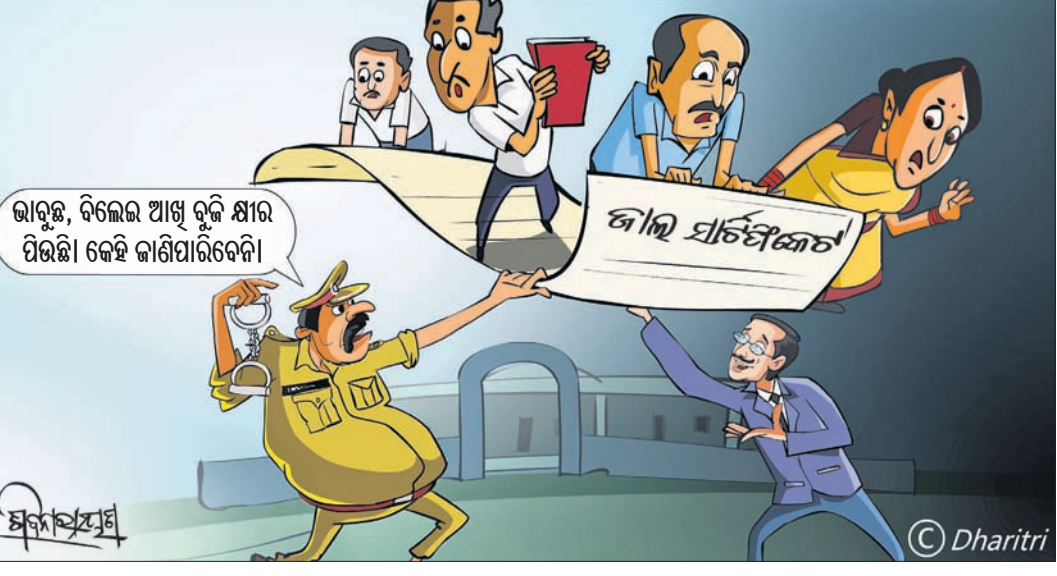
ଭାରତ, ବିଲେଇ ଆଖି ଭୂକ୍ଷି ଧ୍ୟାନ ପିଉଛି। କେହି ଜାଣିପାରିବେନି।