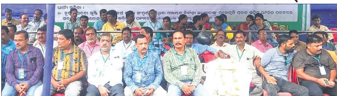
ଗଣଧାରଣାରେ ସାମିଲ ହୋଇଥିବା ପଞ୍ଚାୟତ ନିର୍ବାହୀ ଅଧିକାରୀମାନେ।