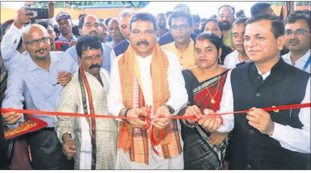
ଭୁବନେଶ୍ୱରର ଧର୍ମବିହାରରେ ପ୍ରାକୃତିକ ଗ୍ୟାସ୍ ଆଧାରିତ 'ଶବଦାହ ଗୃହ' ଉଦ୍ଘାଟନ କରୁଛନ୍ତି କେନ୍ଦ୍ରମନ୍ତ୍ରୀ ଧର୍ମେନ୍ଦ୍ର ପ୍ରଧାନ।