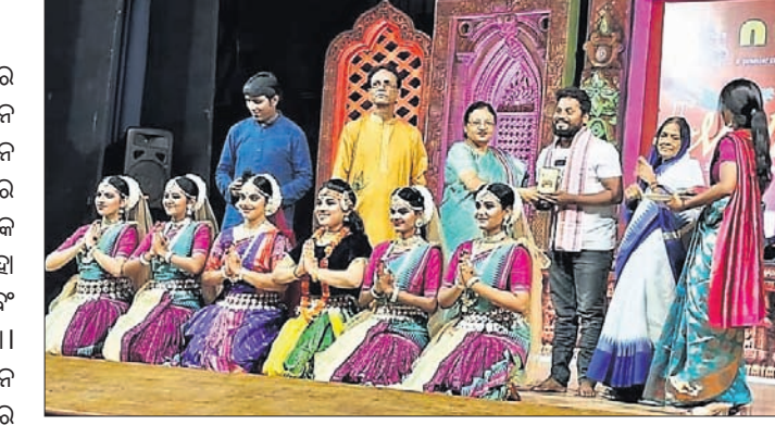
ମହ୍ଲାର ଉତ୍ସବରେ ସାମିଲ ହୋଇଥିବା ଅନୁଷ୍ଠାନର କଳାକାରମାନେ।

ରବୀନ୍ଦ୍ର ମଞ୍ଚପଡ଼ ଅନୁଷ୍ଠିତ ମହ୍ଲାର ମହୋତ୍ସବରେ ଛାପ ଛାଡ଼ିଛନ୍ତି ଦେଶନାମର ସାଂସ୍କୃତିକ ଅନୁଷ୍ଠାନ 'ନୃତ୍ୟମ୍'ର କଳାକାର।