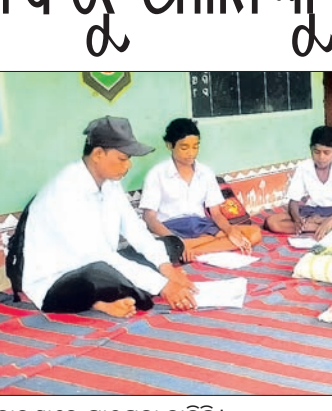
ବାରଣ୍ଡାରେ ପାଠପଢ଼ା ଚାଲିଛି।

ଗୁଣାତ୍ମକ ଶିକ୍ଷାର ପ୍ରସାର ନେଇ ରାଜ୍ୟ ସରକାର ସର୍ବଦା ଗୁରୁତ୍ୱ ଦେଉଥିବାବେଳେ ଏବେ ବି ଗ୍ରାମାଞ୍ଚଳରେ ଭିତ୍ତିଭୂମି ଅଭାବ ଯୋଗୁ ଗୁଣାତ୍ମକ ଶିକ୍ଷା ବଞ୍ଚି ରହିଛି ଅନେକ ଛାତ୍ରାହୀନ। ଏପରି ଏକ ଉଦାହରଣ ଦେଖିବାକୁ ମିଳିଛି ନବରଙ୍ଗପୁର ଜିଲ୍ଲା ଝରିଗାଁ ବ୍ଲକ୍ ଚକଳାପଦର ପଞ୍ଚାୟତ ଅଧୀନ ବାହାରକରମାରି ସରକାରୀ ଉଚ୍ଚ ପ୍ରାଥମିକ ବିଦ୍ୟାଳୟରେ।