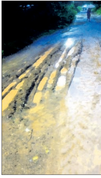
ପ୍ରକଳ୍ପ କଲୋନିକୁ ସଂଯୋଗ କରୁଥିବା ରାସ୍ତା।