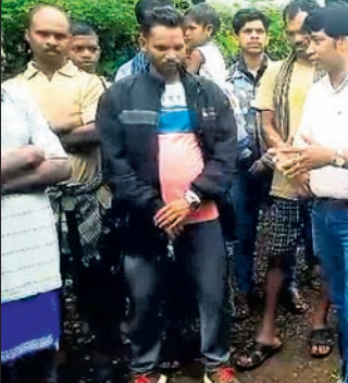
ବ୍ଲକ ପ୍ରଶାସନିକ ଅଧିକାରୀମାନେ ଗ୍ରାମବାସୀଙ୍କ ସହ ଆଲୋଚନା କରୁଛନ୍ତି ।

କୃମି କଳାକାରଙ୍କ ପ୍ରଭାବ ଛକ ପର୍ଯ୍ୟନ୍ତ ପ୍ରାୟ ୪ କିମି ବୋଲି ଏବଂ ଭାର ଭରସା । ସେହିପରି ମୁରାନ୍ ନଦୀର ଦୁର୍ଗତୁରା ପାନୀୟ ଜଳ ଭାବେ ବ୍ୟବହାର କରୁଥିବା ଭଳି ସମସ୍ୟାକୁ ନେଇ ଗ୍ରାମବାସୀ ବାରମ୍ବାର ସ୍ଥାନୀୟ ବ୍ଲକ ପ୍ରଶାସନ ଏବଂ ଜିଲ୍ଲା ପ୍ରଶାସନକୁ ଅଭିଯୋଗ କରିଆସୁଥିଲେ । ହେଲେ ଏ ପର୍ଯ୍ୟନ୍ତ ଏ ଦିଗରେ କେହି ପଦକ୍ଷେପ ନେଇ ନ ଥିଲେ । ଏହା ମଧ୍ୟରେ କୃମି କଳାକାର ଜଣଙ୍କ ପଦ୍ମପୁରା ଗାଁର ବିକାଶ ପାଇଁ ଅନୁରୋଧ କରିଥିବା ଭିତ୍ତିପ ଡାକ୍ତରୀ ଛାନ୍ଦଣା ହେବାପରେ ଅଧିକାରୀମାନେ ଗାଁକୁ ଯାଇ ସ୍ଥିତି ପରଖୁଛନ୍ତି । ସମସ୍ୟା ସମାଧାନ ନ ହେଲେ ଆସନ୍ତା ସାଧାରଣ ନିର୍ବାଚନରେ ଭୋଟ ବର୍ଦ୍ଧନ କରି ଆନ୍ଦୋଳନ କରିବାକୁ ଗ୍ରାମବାସୀ ଚେତାବନୀ ଦେଇଛନ୍ତି ।