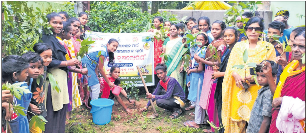
ନୟାହାଣ୍ଡି ସମନ୍ୱିତ ଶିଶୁ ବିକାଶ ପ୍ରକଳ୍ପ ଅଧୀନ ଅଭିକାରୀଙ୍କୁ ନେଇ ଚାରାରୋପଣ କରୁଛନ୍ତି।