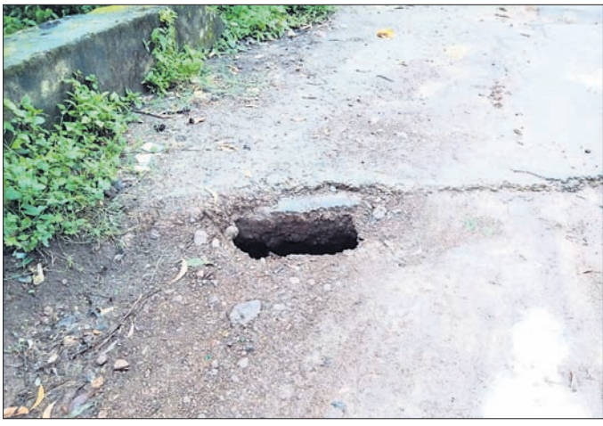
ଗରୁ ନ ଥିବା ଅଭିଯୋଗ ହେଉଛି । ଗ୍ରାମ୍ୟ ଭ୍ରମଣ ନିଭାଗ ଅନ୍ତର୍ଗତ ଏହି ବ୍ୟସ୍ତବହୁଳ ରାସ୍ତା ଦେଇ ୬ଟି ପଞ୍ଚାୟତର ଶତାଧିକ ଗ୍ରାମର ଅଧିକାରୀଙ୍କୁ ନିର୍ଦ୍ଧାରଣ କରାଯାଇଛି । ବର୍ଷାଦିନ ପୂର୍ବରୁ ରାସ୍ତାକାମ ସମ୍ପୂର୍ଣ୍ଣ କରାଯିବାକୁ ଦାବି ହୋଇଥିଲା । ହେଲେ ବିଭାଗୀୟ କର୍ତ୍ତୃପକ୍ଷ ଏଥିପ୍ରତି କର୍ଷାପାତ ନ କରିବାକୁ

ପୂନିଚୁଡ଼ା, ୧୯୮୮ (ରାଧେଶ୍ୟାମ ଅଗ୍ରୱାଲ) ରାୟଗଡ଼ା ଜିଲ୍ଲା ପୂନିଚୁଡ଼ା ବ୍ଲକର ଲାଇଫଲାଇନ କୁହାଯାଉଥିବା ପୂନିଚୁଡ଼ା-ଭୈରବଗଡ଼ ରାସ୍ତା ଶୋଚନୀୟ ହୋଇପଡ଼ିଛି । ପୂନିଚୁଡ଼ାର ବ୍ୟସ୍ତବହୁଳ ଛକ ସିନେମା ହଲ ରୋଡ଼ ଖାଲଖାମାରେ ଭର୍ତ୍ତି ହୋଇଥିବାବେଳେ ମଝିରେ ମଝିରେ ବଡ଼ ବଡ଼ ଗର୍ତ୍ତ ରହିଛି । ଫଳରେ ଯାତ୍ରୀମାନେ ବହୁ ଅସୁବିଧାର ସମ୍ମୁଖୀନ ହେଉଛନ୍ତି । ବିପଦସଙ୍କୁଳ ରାସ୍ତା ଯୋଗୁ ରାତି ସମୟରେ ଅନେକ ଛୋଟବଡ଼ ଦୁର୍ଘଟଣା ଘଟୁଥିବା ଦେଖିବାକୁ ମିଳୁଛି । ରାସ୍ତାକାମ ଗତ ୨ ବର୍ଷ ହେଲା ଚାଲିଥିଲେ ମଧ୍ୟ ତାହା ଆଜି ପର୍ଯ୍ୟନ୍ତ ସମ୍ପୂର୍ଣ୍ଣ ହୋଇପାରି ନାହିଁ । ତିନିଦିନ କଣେ ପ୍ରଭାବଶାଳୀ ବ୍ୟକ୍ତି ହୋଇଥିବାରୁ ବିଭାଗୀୟ ଯନ୍ତ୍ରା ଓ ଅଧିକାରୀଙ୍କ ଅଧିକ