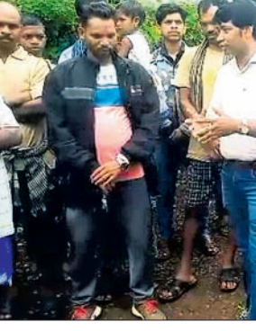
ଲୁକ ପ୍ରଶାସନିକ ଅଧିକାରୀମାନେ ଗ୍ରାମବାସୀଙ୍କ ସହ ଆଲୋଚନା କରୁଛନ୍ତି।