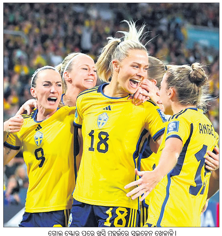
ଗୋଲ୍ ସ୍କୋର ପରେ ଖୁସି ପୂର୍ଣ୍ଣରେ ସୁଇଡେନ୍ ଖେଳାଳି ।