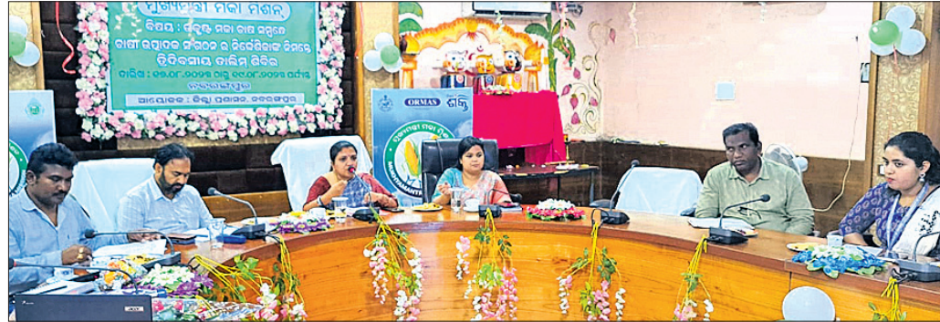
ବୈଠକରେ ଉତ୍କଳ ପୁଖ୍ୟ କାର୍ଯ୍ୟକର୍ତ୍ତା ଅଧିକାରୀ, ଜିଲ୍ଲାପାଳ ଓ ଅନ୍ୟମାନେ।

ପୁଖ୍ୟମନ୍ତ୍ରୀ ମକା ମିଶନ ଜରିଆରେ ଉତ୍କଳ ପକାଗଣ ସମ୍ବନ୍ଧରେ ଚାଷୀ ଉତ୍ପାଦକ ସଂଘ ନିର୍ଦ୍ଦେଶିକାଙ୍କ ନିମନ୍ତେ ଏକ ଗଣନିଆ ଡାଲିଯ ଶିବିର ଅନୁଷ୍ଠିତ ହୋଇଯାଇଛି।