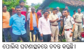
ପୋଲିସ୍ ଘଟଣାସ୍ଥଳରେ ତଦନ୍ତ କରୁଛି।

ନବରଙ୍ଗପୁର ଜିଲ୍ଲା ଝରିଗାଁ ବ୍ଲକ୍ ଯୋରିଷଭଙ୍ଗା ଗ୍ରାମରେ ଶୁକ୍ରବାର ବିଳମ୍ବ ରାତିରେ ଏକ ବଡ଼ ଧରଣର ଚୋରି ହୋଇଛି।