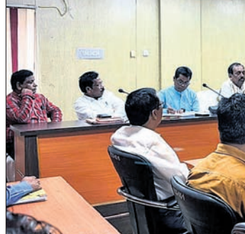
ବୈଠକରେ ଉପସ୍ଥିତ କୋରାପୁଟ କେନ୍ଦ୍ର ସମବାୟ ବ୍ୟାଙ୍କ କର୍ମଚାରୀ ସଂଘ କର୍ମଚାରୀ।

ଗଠନ, କେଉଁର ଫଣ୍ଡକୁ କେନ୍ଦ୍ର ସମବାୟ ବ୍ୟାଙ୍କର ଅଂଶଧନ ପ୍ରଦାନ ଉପରେ ପୁନଃ ବିଚାର ତଥା ପ୍ରାଥମିକ ସମବାୟ ସମିତି ଓ ଲ୍ୟାମ୍ପସମାନଙ୍କର ଚେରୁ ଆକାଉଣ୍ଟ ରାକ୍ଷା ସମବାୟ ବ୍ୟାଙ୍କରେ ଖୋଲିବା ଆଦି ଦାବି ପୂରଣ ନ ହେଲେ କର୍ମଚାରୀମାନେ ଆନ୍ଦୋଳନ ମାଧ୍ୟମରେ ପୂର୍ଣ୍ଣ ଲାମ୍ପସମାନଙ୍କର ଆନ୍ଦୋଳନ ଆଦି କରିବେ।