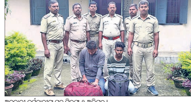
ଅବକାରୀ କର୍ମଚାରୀଙ୍କ ସହ ଗିରଫ ୨ ଅଭିଯୁକ୍ତ ।