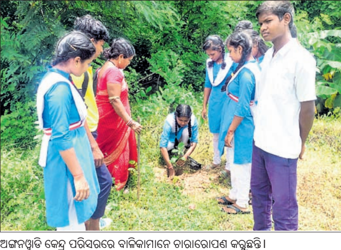
ଅଜ୍ଞାନସ୍ତ୍ରୀ କେନ୍ଦ୍ର ପରିସରରେ ବାଲିକାମାନେ ଚାରାଗୋପଣ କରୁଛନ୍ତି ।

ନେଇ ସଚେତନ କରିବା ସହିତ ନିର୍ଦ୍ଧାରିତ ପ୍ରଶ୍ନ, ଆୟ, ଅନୁଭବ, ସଜନା ଗଛ ଭଳି ବିଭିନ୍ନ ପ୍ରକାର ଫଳଗଛ ଗ୍ରାମର ବିଭିନ୍ନ ସ୍ଥାନରେ ଲଗାଯାଇଥିଲା । ଏହି ପ୍ରକ୍ରିୟାରେ ଜିଲ୍ଲାର ବିଭିନ୍ନ ସ୍ଥାନରେ ପ୍ରାୟ ୫୦୦ କିଶୋରୀ କିଶୋରୀ ଭାଗ ନେଇଥିଲେ । ପୂନିଚୁଡ଼ା, ରାୟଗଡ଼ା ଜିଲ୍ଲା ପ୍ରଶାସନ, ଜିଲ୍ଲା ଶିଶୁ ସୁରକ୍ଷା ସ୍କୁଲ୍, ଯୁନିଟ୍ ସେଫ୍ ଓ ଆକ୍ରମଣ-ସଫ୍ଟ୍ ନିକିତ ସଂଯୋଜନାରେ ଜିଲ୍ଲାରେ ବାଲ୍ୟବିବାହ ରୋକିବା ସହିତ କିଶୋରୀ ଓ କିଶୋରୀଙ୍କୁ ସୁରକ୍ଷା ପାଇଁ ଅଦିକା ନାମରେ ଏକ ସ୍ୱତନ୍ତ୍ର ସଚେତନତା ଅଭିଯାନ ୨୦୨୧ ମସିହାରୁ ଚାଲୁ ରହିଛି । ଏହି କାର୍ଯ୍ୟକ୍ରମ ନାଥମରେ ପ୍ରତି ଶନିବାର ପ୍ରତ୍ୟେକ ଅଜ୍ଞାନସ୍ତ୍ରୀ କେନ୍ଦ୍ରରେ ୧୦ ରୁ ୧୯ ବର୍ଷର ସମସ୍ତ କିଶୋରୀ କିଶୋରୀଙ୍କୁ ସାମିଲ କରି ପୂର୍ଣ୍ଣ, ଉନ୍ନତ, ଜୀବନ କୌଶଳ, ଶିଶୁ ସୁରକ୍ଷା, ଲିଙ୍ଗଗତ ଭେଦଭାବ, ଲିଙ୍ଗଭିତ୍ତିକ ହିଂସା, ସୌନ ସ୍ୱାସ୍ଥ୍ୟ, ଆର୍ଥିକ ସାକ୍ଷରତା, ଶିକ୍ଷା ଓ ଦକ୍ଷତା ବିକାଶ ଭଳି ବିଷୟ ଉପରେ ସଚେତନତା ସୃଷ୍ଟି କରାଯାଇଛି ।