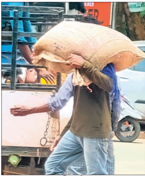
ଏକ ଗାଡ଼ିରେ ଚାଲାଣ ପାଇଁ ଲୋଡ଼ କରାଯାଉଥିବା ଚାଉଳ।

ଗରିବ ଲୋକଙ୍କୁ ଖାଦ୍ୟ ସୁରକ୍ଷା ଯୋଜନାରେ ସାମିଲ କରି ସରକାର ସେମାନଙ୍କୁ ପ୍ରତି ମାସରେ ପିଡ଼ିଏସ୍ ବାବଦରେ ମୁଣ୍ଡ ପିଛା ୫ କେଜି ଚାଉଳ ୧ ଟଙ୍କାରେ ଦେଉଛନ୍ତି। ହେଲେ ଏଥିରୁ କିଛି ଅଧିକ ବ୍ୟବସାୟୀ ଲାଭ ଉଠାଉଥିବା ଅଭିଯୋଗ ହେଉଛି। ସୁନାବେତା ଓ ସେମିଲିଗୁଡ଼ା ଅଞ୍ଚଳରେ କେତେ ଜଣ ବ୍ୟକ୍ତି ହିତାଧିକାରୀମାନଙ୍କୁ ପ୍ରତ୍ୟେକଦିନ ଦେଖାଇ ସେମାନଙ୍କୁ ମିଳୁଥିବା ଚାଉଳ ସେମାନଙ୍କଠାରୁ କମ ଦରରେ କିଣୁଛନ୍ତି। ପରେ ସେହି ଚାଉଳକୁ ପଡ଼ୋଶୀ ରାଜ୍ୟମାନଙ୍କୁ ଚଢ଼ା ଦରରେ ଚାଲାଣ କରି ବେଶ୍ ଲାଭ ଉଠାଉଛନ୍ତି। ଏ ସମ୍ପର୍କରେ ଯୋଗାଣ ବିଭାଗ ଅଳ୍ପ ବହୁତ ଅବଗତ