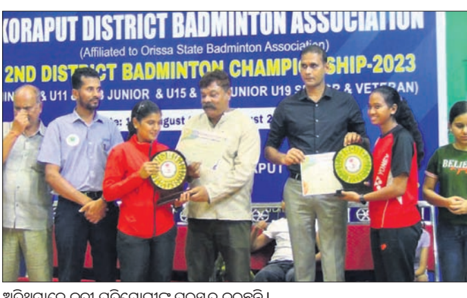
ଅତିଥିମାନେ କୃତୀ ପ୍ରତିଯୋଗୀଙ୍କୁ ପୁରସ୍କୃତ କରୁଛନ୍ତି।