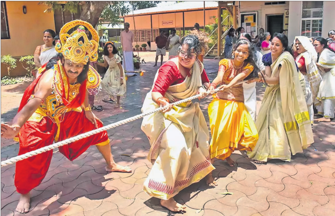
କେରଳର ଏନିଲକମ୍ପଲ୍ଲିତ ରାମକୃଷ୍ଣ ୧୦ ପରିସରରେ ଓନମ ଉତ୍ସବ ପାଳନ ଅବସରରେ ରବିବାର ଆୟୋଜିତ ଦଉଡ଼ି ଭିଡ଼ା ପ୍ରତିଯୋଗିତାରେ ଭାଗନେଇଥିବା ମହିଳା ଏବଂ ପୁରୁଷ।