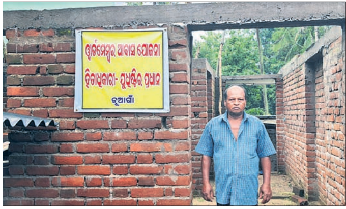
ଅର୍ଦ୍ଧ ନିର୍ମିତ ଘର କାନ୍ଧରେ ପୋଷ୍ଟର ଲଗାଇ ପ୍ରତିବାଦ କରୁଛନ୍ତି ମୁଖ୍ୟମନ୍ତ୍ରୀ ।

କଳା ଘରେ ରହୁଥିବା ଗରିବ ଲୋକମାନଙ୍କୁ ପଞ୍ଚା ଘର ଯୋଗାଇ ଦେବା ପାଇଁ ସରକାର ପ୍ରଧାନମନ୍ତ୍ରୀ ଆବାସ ଯୋଜନା ପ୍ରଣୟନ କରିଛନ୍ତି । ହେଲେ ନୟାଗଡ଼ ଜିଲ୍ଲା ନୂଆଗାଁ ବ୍ଲକରେ ସେଥିରେ ବ୍ୟତିକ୍ରମ ହୋଇଥିବା ଅଭିଯୋଗ ହେଉଛି । ନୂଆଗାଁ ବ୍ଲକରେ ଆବାସ ଯୋଜନା ପାଇଁ ହିତାଧିକାରୀ ଚୟନରେ ପାଠରାଶିର ନୀତି ଆପଣାଇ ଅଯୋଗ୍ୟ ବ୍ୟକ୍ତିଙ୍କୁ ଯୋଗ୍ୟ ଏବଂ ଯୋଗ୍ୟ ବ୍ୟକ୍ତିଙ୍କୁ ଅଯୋଗ୍ୟ କରାଯାଇଛି । ଏ ନେଇ ବାରମ୍ବାର ଅଭିଯୋଗ ହେଉଥିଲେ ମଧ୍ୟ ତାହାର କୌଣସି ସୁଧୁର ମିଳୁନି । ଫଳରେ ନୂଆଗାଁ ବ୍ଲକ ନୂଆଗାଁ ପଞ୍ଚାୟତର ମୁଖ୍ୟମନ୍ତ୍ରୀ ପ୍ରଧାନ ନିଜ ଅର୍ଥରେ ଅଧାରତା ଥିବା ଘର ସାମ୍ନାରେ ଖର୍ଚ୍ଚ ନେମ୍ବର ଆବାସ ଯୋଜନା ଲେଖି ପ୍ରଧାନମନ୍ତ୍ରୀ ଆବାସ ଯୋଜନା ଅନିୟମିତତାର