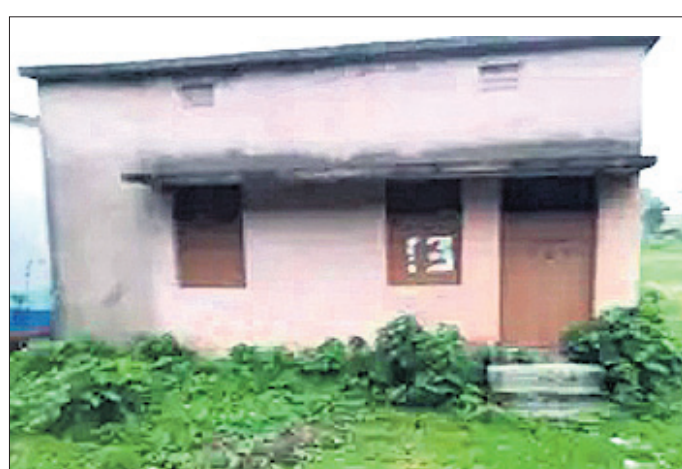
ପରିତ୍ୟକ୍ତ ଅବସ୍ଥାରେ ଥିବା ପ୍ରାଣୀ ଚିକିତ୍ସା କେନ୍ଦ୍ର।

ପ୍ରଧାନ, ଅଧ୍ୟକ୍ଷ ନାୟକ, ଅଧିକାରୀଙ୍କୁ ଗୋଟିଏ ଦିନ ପ୍ରାଣୀ ଚିକିତ୍ସା କେନ୍ଦ୍ରରେ ଉପସ୍ଥାପନ କରାଯାଇଥିଲା।