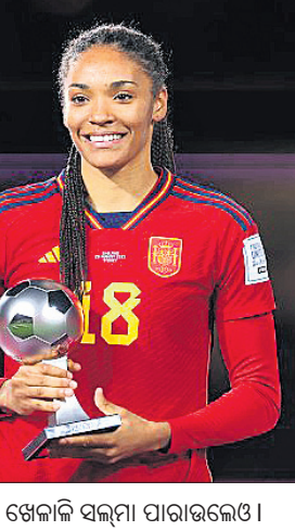
ଗୋଲଡେନ୍ ବଲ୍ ପୁରସ୍କାର ସହ ଆଇଗୋନା ବୋନାଟି।