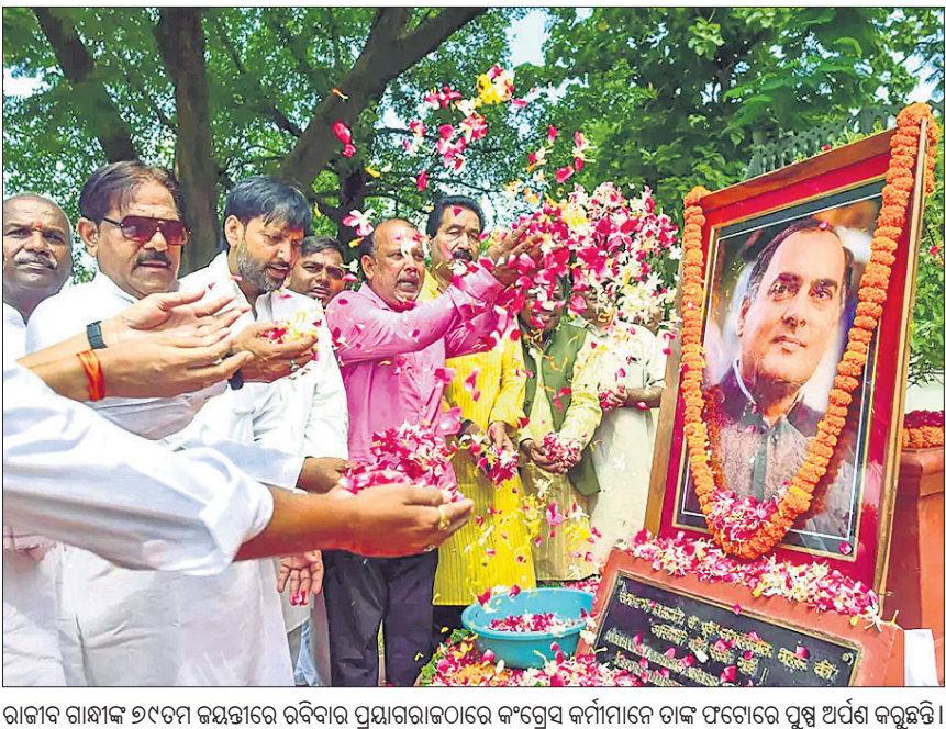
ରାଜ୍ୟର ରାଜ୍ୟପାଳଙ୍କ ଉଦ୍ଦେଶ୍ୟରେ ଭୁବନେଶ୍ୱର ପ୍ରଧାନମନ୍ତ୍ରୀଙ୍କ ଦାବିପତ୍ର ଗ୍ରହଣ କରିବା ପରେ କଂଗ୍ରେସ କର୍ମୀମାନେ ତାଙ୍କ ପତ୍ନୀଙ୍କୁ ପୁଷ୍ପ ଅର୍ପଣ କରୁଛନ୍ତି।