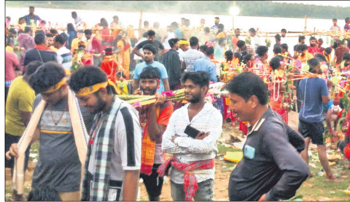
କାଉଡ଼ିଆମାନେ ପାଣିଭାର ନେବା ପାଇଁ ପ୍ରସ୍ତୁତ ହେଉଛନ୍ତି।

ରଘୁନାଥପୁର ଜଳ ଡାମରୁ ବାଜପାୟନ୍ତିତ ବାଣାୟର ଘାଟରୁ ୫ ହଜାରରୁ ଊର୍ଦ୍ଧ୍ୱ କାଉଡ଼ିଆ ଜନଭାର ନେଇ ବିଭିନ୍ନ ଶୈବପାଠିକ ଉଦ୍ଦାର ଯାତ୍ରା କରିଛନ୍ତି। ଅପରାହ୍ନ ୨ଟାରେ ମାନସିକଧାରୀମାନେ ଘାଟରେ ପହଞ୍ଚି ପୁଣ୍ୟ କଳସୀରେ ପାଣି ଭରାନ୍ତେ ଉପସ୍ଥାପନ କରାଯାଇଥିଲା।