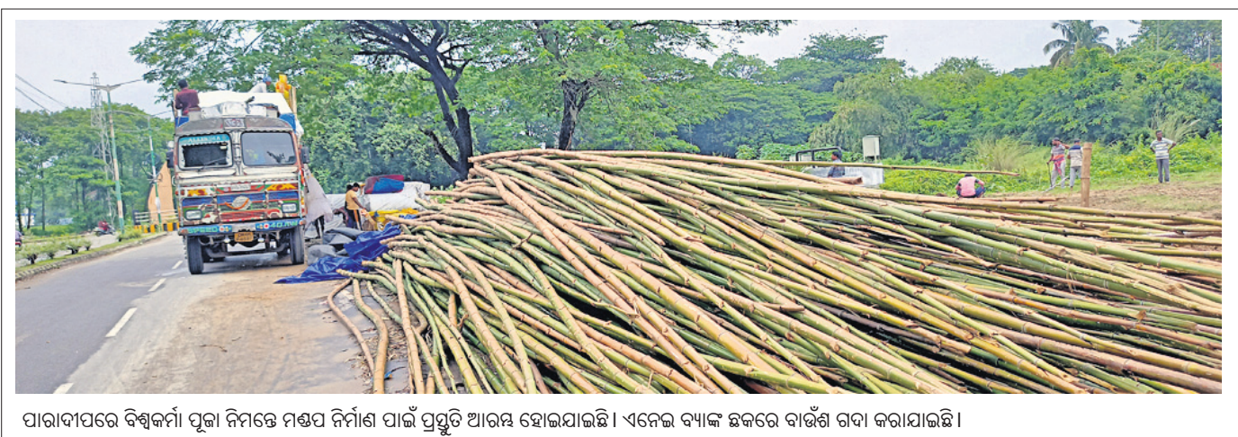
ପାରାଦୀପରେ ବିକ୍ରୟ ପୂର୍ବକ ନିମନ୍ତେ ମଣ୍ଡପ ନିର୍ମାଣ ପାଇଁ ପ୍ରସ୍ତୁତ ଆରମ୍ଭ ହୋଇଯାଇଛି। ଏନେଇ ବ୍ୟାଙ୍କ ଛକରେ ବାଉଁଶ ଗଦା କରାଯାଇଛି।

ନଗର ବଡ଼ପଡ଼ାରୁ ଡାକ୍ତର ଡାକିବାକୁ ପଡ଼ୁଛି। ଯାହାଦ୍ୱାରା ସେମାନେ ଅଧିକ ପଞ୍ଚାୟତରେ ପାଖାପାଖି ୧୦ ହଜାରରୁ ଊର୍ଦ୍ଧ୍ୱ ଗୁହ୍‌ପାଳିତ ପ୍ରାଣୀ ରହିଥିବାବେଳେ ତାହା ଏବେ ପରିତ୍ୟକ୍ତ ଅବସ୍ଥାକୁ ଆସି ଚାଲିଛି।