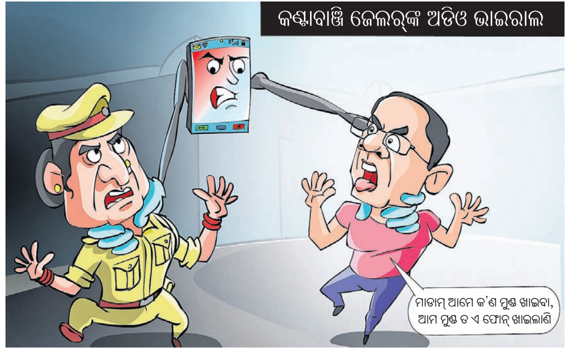
ମାତାମ୍ ଆମେ କ'ଣ ମୁଣ୍ଡ ଖାଇବା, ଆମ ମୁଣ୍ଡ ତ ଏ ଫୋନ୍ ଖାଇଲାଣି