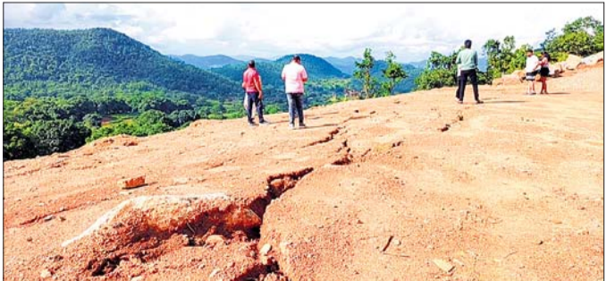
ପାହାଡ଼ ଉପରେ ସୃଷ୍ଟି ହୋଇଥିବା ଫାଟକୁ ଅନୁଧ୍ୟାନ କରାଯାଉଛି।

ଦାରିଙ୍ଗବାଡି ବ୍ଲକ୍ ଅଞ୍ଚଳର ଏକାଧିକ ଘାଟି ରାସ୍ତା ଏବେ ବିପଦପୂର୍ଣ୍ଣ ହୋଇଛି। ବାରମ୍ବାର ବର୍ଷା ଯୋଗୁଁ ଚଳିତବର୍ଷ ଶ୍ରାନିକେତାର ଜାତୀୟରାଜପଥ ଘାଟି ରାସ୍ତାରେ ଭୃଷ୍ଟାନନ ହେବା ଭୟ ଲୋକଙ୍କୁ ଆତଙ୍କିତ କରୁଛି।