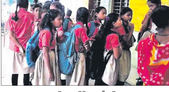
ପାଟଣାଗଡ଼ ମେଡିକାଲକୁ ଚିକିତ୍ସା ପାଇଁ ଆସିଥିବା ଛାତ୍ରାଛାତ୍ର।