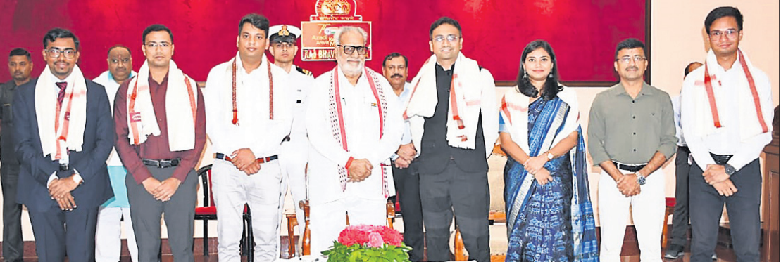
ରାଜଭବନରେ ରାଜ୍ୟପାଳ ପ୍ରଫେସର ଗଣେଶୀ ଲାଲଙ୍କ ସହ ସିଜିଲ୍ ସର୍ଭିସ୍ ପରାମର୍ଶରେ କୃତକାର୍ଯ୍ୟ ପ୍ରାର୍ଥୀ ଓ ଅନ୍ୟମାନେ ।