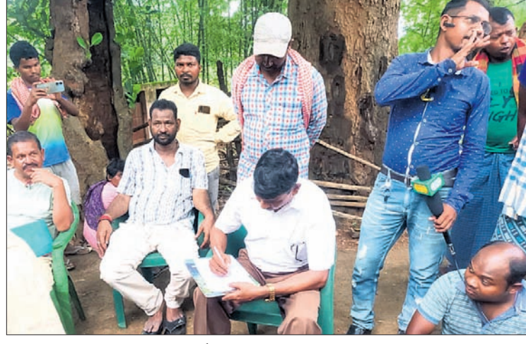
ଅଧୀକ୍ଷଣ ଯନ୍ତ୍ରୀ ଦୁର୍ଯ୍ୟୋଧନ ବେହେରା ଲିଖିତ ପ୍ରତିଶ୍ରୁତି ଦେଉଛନ୍ତି।

ଘାଟଗଞ୍ଜପୁର, ୨୧।୮ (ମନୋରଞ୍ଜନ ତିରିଆ) ପ୍ରଧାନମନ୍ତ୍ରୀ ଗ୍ରାମ ସଡ଼କ କାମ ନିମ୍ନମାନର ହେଉଥିବାରୁ ପ୍ରତିକ୍ରିୟାଶୀଳ ହୋଇପଡ଼ିଲେ ଲୋକେ।