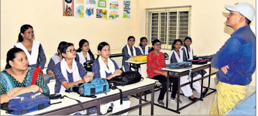
ରମାଦେବୀ ମହିଳା ବିଶ୍ୱବିଦ୍ୟାଳୟରେ ଯୁକ୍ତୃ ପ୍ରଥମ ବର୍ଷ ବାଣିଜ୍ୟ ବିଭାଗର ଛାତ୍ରୀମାନେ ଶୁଣୁ ବସୁଛନ୍ତି।

୨୦୧୩-୧୪ ଶିକ୍ଷା ବର୍ଷ ପାଇଁ ସମସ୍ତ ଉଚ୍ଚ ମାଧ୍ୟମିକ ଓ ଉଚ୍ଚ ଶିକ୍ଷାନୁଷ୍ଠାନ ସହ ଦୈନିକ ଶିକ୍ଷାନୁଷ୍ଠାନରେ ପାଠପଢ଼ା ଆରମ୍ଭ ହୋଇଯାଇଛି। ଯୁକ୍ତୃ ପ୍ରଥମ ବର୍ଷ ପାଠପଢ଼ା ଗତ ୧ ତାରିଖରୁ ଆରମ୍ଭ ହୋଇଥିବାବେଳେ ଯୁକ୍ତୃ ଓ ପିଟି ପାଠପଢ଼ା ଯୋଜନାରେ ଶିକ୍ଷା ଆରମ୍ଭ ହୋଇଛି। ହେଲେ ଏବେ ବି ଲକ୍ଷ ଲକ୍ଷ ସିଟ୍ ଖାଲି ପଡ଼ିଥିବାରୁ ଚିନ୍ତା ବଢ଼ିଛି। ତେଣୁ ପାଠପଢ଼ାରେ ବହୁ ବିଳମ୍ବ ହୋଇଥିଲେ ମଧ୍ୟ ସିଟ୍ ପୂରଣ ପାଇଁ ନାମଲେଖା ଜାରି ରହିଛି। ମିଲିଥିବା ସୂଚନାମୁତାବେ, ୨୧,୧୯୧୯ ଉଚ୍ଚ ମାଧ୍ୟମିକ ସ୍ତରରେ ୫,୧୧୭,୮୭୩ଟି ସିଟ୍ ରହିଛି। ସେଥିମଧ୍ୟରୁ ୩,୧୯୦,୦୬୬ଟି ସିଟ୍ ପୂରଣ ହୋଇଥିବାବେଳେ ୧,୯୨୭,୮୦୭ଟି ସିଟ୍ ଖାଲି ପଡ଼ିଛି। ଏଥିମଧ୍ୟରୁ ବିଜ୍ଞାନରେ ସର୍ବାଧିକ ୫୭,୭୯୫ଟି ସିଟ୍ ଖାଲି ଥିବାବେଳେ କଳାରେ ୫୦,୯୬୨, ବାଣିଜ୍ୟରେ ୧୬,୫୮୯, ସଂସ୍କୃତରେ ୬,୪୪୧ ଏବଂ ଧର୍ମାତ୍ମକ ଶିକ୍ଷାରେ ୬,୦୨୦ଟି ସିଟ୍ ବଳକା ପଡ଼ିଛି। ଯୁକ୍ତୃ ପ୍ରଥମ ପର୍ଯ୍ୟାୟ ନାମଲେଖାରେ ସିଟ୍ ପୂରଣ ନ ହେବାରୁ ବିଦ୍ୟାଳୟ ଓ ଗଣଶିକ୍ଷା ବିଭାଗ ଦ୍ୱିତୀୟ ପର୍ଯ୍ୟାୟ ନାମଲେଖା ପାଇଁ ପ୍ରସ୍ତାବ ଦେଇଛି। ଏଥିପାଇଁ ଗତ ୧୭ ତାରିଖରୁ ଆବେଦନ ପ୍ରକ୍ରିୟା ଆରମ୍ଭ ହୋଇଛି। ପ୍ରଥମ ପର୍ଯ୍ୟାୟରେ ଯେଉଁ ଛାତ୍ରଛାତ୍ରୀ ଆବେଦନ କରିପାରି