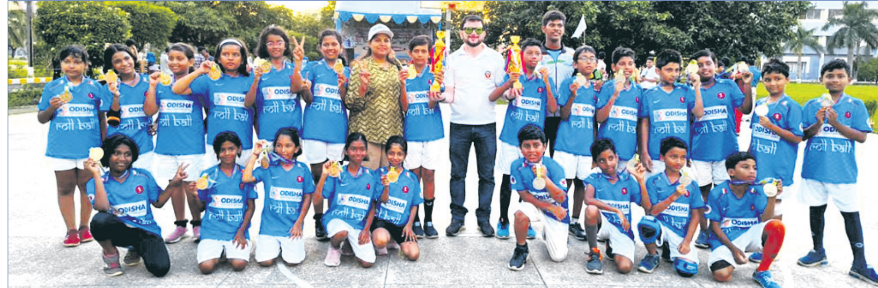
କୋଲକାତାର ଗୁରୁ ନାନକ କଲେଜରେ ସୋନାମୟ ଉଦ୍ଦେଶ୍ୟରେ ପୂର୍ବାଞ୍ଚଳ ୧୧ ବର୍ଷରୁ କମ୍ ବୟସର ଚାମ୍ପିୟନଶିପରେ କୃତିତ୍ୱ ଅର୍ଜନ କରିଥିବା ଓଡ଼ିଶା ବାଳକ ଓ ବାଲିକା ଦଳ କର୍ମକର୍ତ୍ତାଙ୍କ ଗହଣରେ।