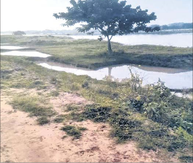
ନଦୀ ପଠାରେ ଖେଳପଡ଼ିଆ ହେବାକୁ ଥିବା ସ୍ଥାନ ।