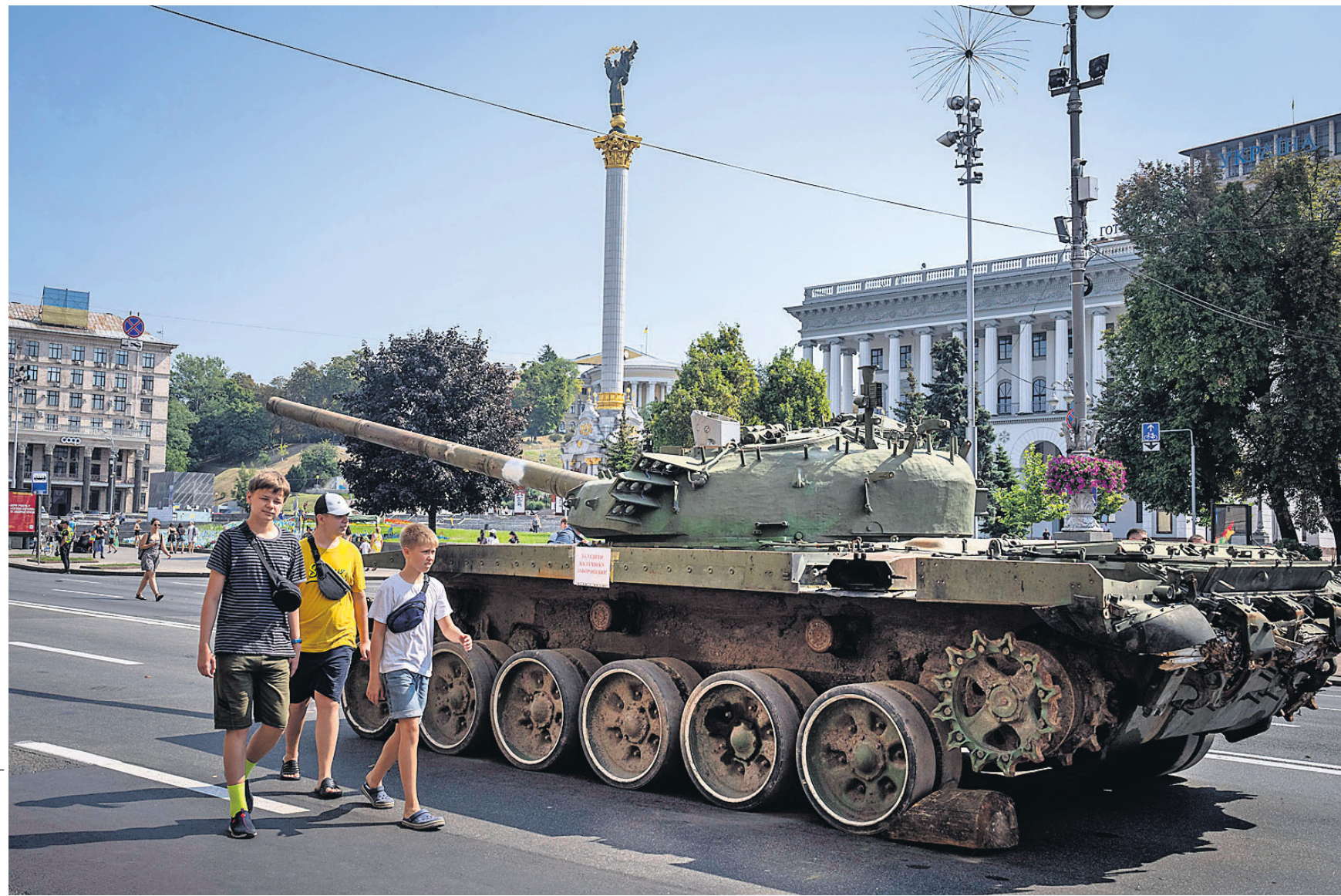
ଅଗଷ୍ଟ ୨୪ରେ ଯୁକ୍ତରାଷ୍ଟ୍ର ସାଧନା ଦିବସ ପାଳନ ପୂର୍ବରୁ ଯୋମବାର ରାଜଧାନୀ କିର୍କୋରେ ସର୍ବସାଧାରଣଙ୍କ ଉଦ୍ଦେଶ୍ୟରେ ରୁଷିଆର ନଷ୍ଟ ହୋଇଯାଇଥିବା ଏକ ଯୁଦ୍ଧ ବ୍ୟାଙ୍କର ପ୍ରଦର୍ଶନ କରାଯାଇଛି।