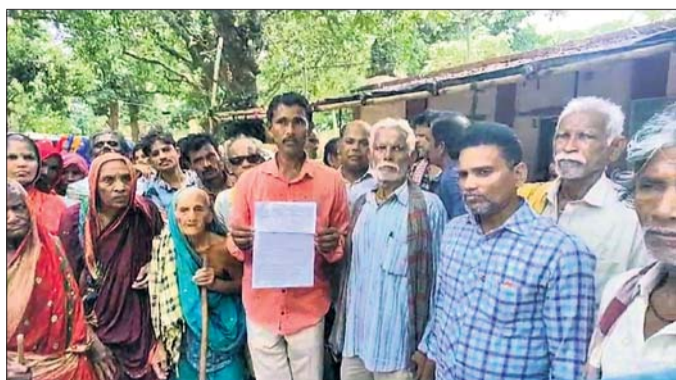
ଗଞ୍ଜାମରେ ଅଭିଯୋଗ କରିବାକୁ ଆସିଛନ୍ତି।