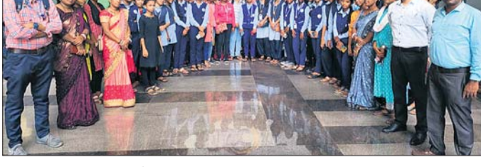
ବିଶ୍ୱ ଦକ୍ଷିଣ କେନ୍ଦ୍ର ପରିଦର୍ଶନ କରିବାକୁ ଯାଇଥିବା ଛାତ୍ରୀମାନଙ୍କ ସହ ଅନ୍ୟମାନେ।