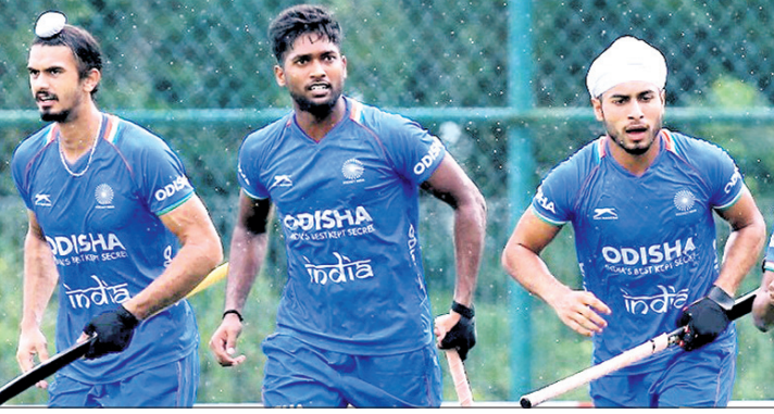
ଗୋଲ ଖୋଲପରେ ଉଲ୍ଲସିତ ଭାରତୀୟ ଖେଳାଳି।