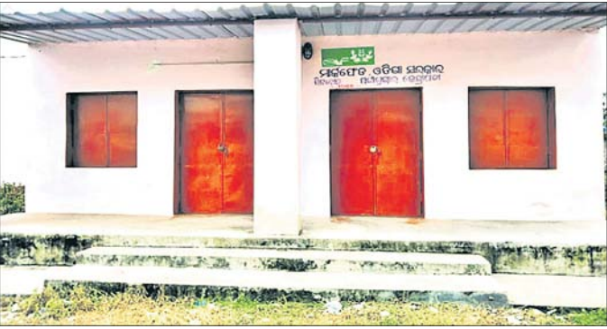
ପଟ୍ଟାମୁଣ୍ଡାଲରେ ଥିବା ମାର୍କେଟ୍‌ହାଉସ୍ ସାର ଗୋଦାମ ।

କେନ୍ଦ୍ରାପଡ଼ା ଜିଲ୍ଲା ପଟ୍ଟାମୁଣ୍ଡାଲ ବ୍ଲକ୍‌ରେ ସମବାୟ ସମିତି ମାଧ୍ୟମରେ ସାର ଯୋଗାଣ ସମ୍ପୂର୍ଣ୍ଣ ଫେଲ୍ ମାରିଛି । ପଟ୍ଟାମୁଣ୍ଡାଲ ଅଞ୍ଚଳରେ ଥିବା ୧୨ଟି ସମବାୟ ସମିତି ସାର ଉଠାଇ ନ ଥିବାବେଳେ ଚାଷୀମାନେ ଅସୁବିଧା ଭୋଗିଛନ୍ତି । ଚଳିତ ଖରିଫ ଋତୁରେ ବ୍ଲକ୍‌ର ୩୧ ପଞ୍ଚାୟତରେ ୧୧,୩୦୦ ହେକ୍ଟର ଜମିରେ ଖରିଫ ଧାନ ଫସଲ ହେଉଛି । ସେଥିମଧ୍ୟରୁ ଏସବୁ ୭ ହକ୍ଟର ହେକ୍ଟର ଜମିରେ ରୁଆପୋତା କାମ ସରିଛି । ଅବଶିଷ୍ଟ ଜମିରେ ରୁଆଧାନ ପାଇଁ ଚଳି ପଡ଼ି ରହିଛି । ଚଳିତ ଖରିଫ ଚାଷ ଆରମ୍ଭରୁ ବର୍ଷା ଲୁଚକାଳି ଖେଳ, ବିହନ ଅଭାବ ସହ ସଂଗ୍ରାମକରି ଚାଷୀମାନେ ଚାଷ କାର୍ଯ୍ୟ ଆଗେଇ ନେଉଥିଲେ । ଧାନ ଚଳି ରୁଆ, ବୁଣା ହୋଇଥିବା ଜମିରେ ଚାଷୀ ସାର ପକାଇବାକୁ ପାଇ ନ ଥିବା ଅଭିଯୋଗ ହେଉଛି । ମାର୍କେଟ୍ ପକ୍ଷରୁ ପ୍ରାଥମିକ କୃଷି ସମବାୟ ସମିତି ମାଧ୍ୟମରେ ଚାଷୀଙ୍କୁ ସାର ଯୋଗାଣ ବ୍ୟବସ୍ଥା ହୋଇଛି ବୋଲି କୁହାଯାଉଛି । ହେଲେ ସାରର ଉଚ୍ଚ ଅଭାବ ଚାଷୀଙ୍କ ଆର୍ଥିକ ମେରୁଦଣ୍ଡକୁ ବୋଧହୋଇ ବେକେଇ ବୋଲି