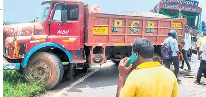
ଦୁର୍ଘଟଣାଗ୍ରସ୍ତ ଟ୍ରକ୍ ।