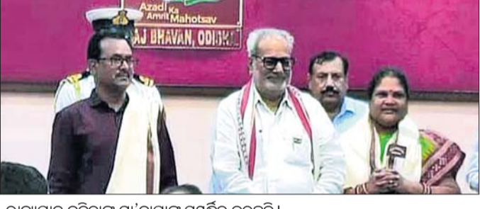
ରାଜ୍ୟପାଳ ବବିତାଙ୍କ ମା'ବାପାଙ୍କୁ ସମ୍ବନ୍ଧିତ କରୁଛନ୍ତି।