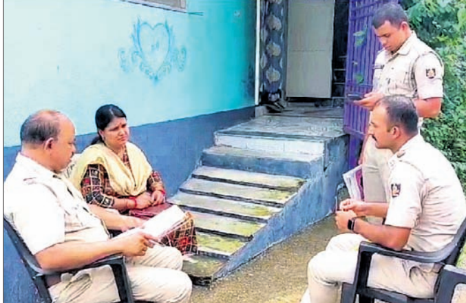
ଗାଙ୍ଗରପାଲିରେ ପୋଲିସ୍ ଚିମ୍ତନ ଚକ୍ର।

ସମ୍ବଲପୁର, ୨୧।୮ (ଶୁଭାଶିଷ ପାଠକ) ସମ୍ବଲପୁର ଜିଲ୍ଲା ଅଇଁଠାପାଲି ଥାନା ଅନ୍ତର୍ଗତ ଗାଙ୍ଗରପାଲି ଗ୍ରାମରେ ସୋମବାର ଏକ ଅଭାବନାୟ ଘଟଣା ଦେଖିବାକୁ ମିଳିଛି।