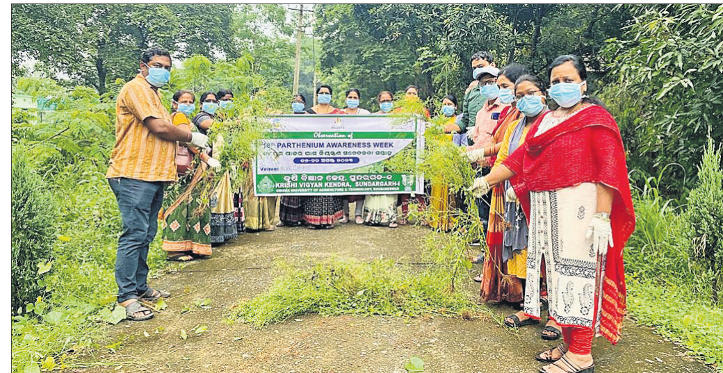
ଗାଜର ଘାସ ଦମନ ସଚେତନତା ସପ୍ତାହ ପାଳନ ଅବସରରେ ଉପସ୍ଥିତ କର୍ମୀବୃନ୍ଦ।