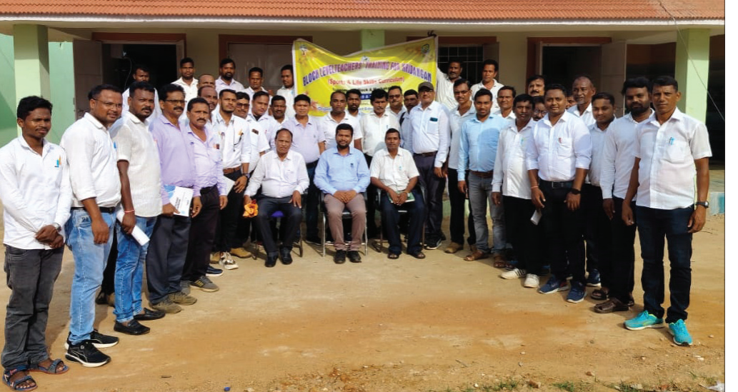
ଉଦ୍ଘାଟନା ଦିବସରେ ଅତିଥି ଓ ତାଲିମଦାତାଙ୍କ ସହ ତାଲିମାଧୀ ଶାରୀରିକ ଶିକ୍ଷକମାନେ ।