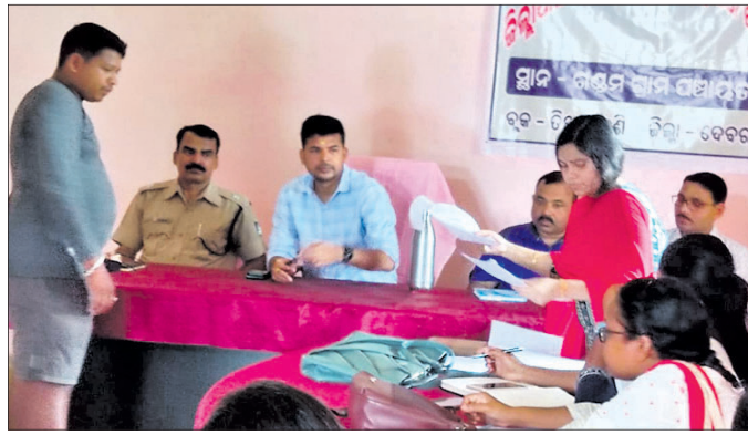
ଶିବିରରେ ଜିଲାପାଳ ଲୋକଙ୍କ ଅଭିଯୋଗର ଶୁଣାଣି କରୁଛନ୍ତି ।