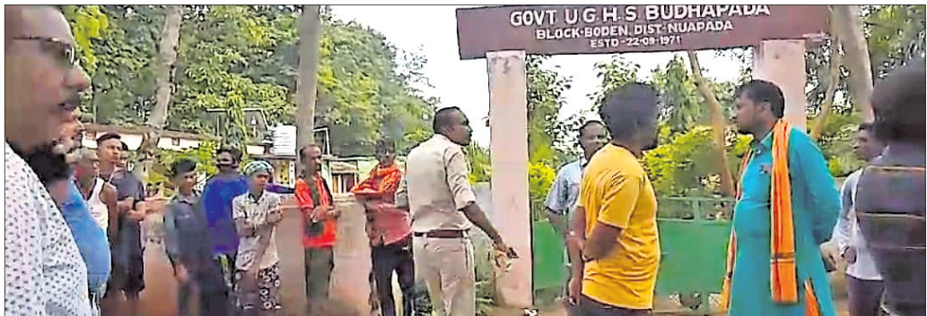
ସ୍କୁଲ ସମ୍ମୁଖରେ ଉଦ୍ଧେନନା ଦେଖାଦେଇଛି ।