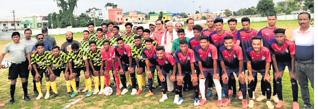
ଉଭୟ ଦଳର ଖେଳାଳିଙ୍କ ସହ ଅତିଥିଗଣ।

ଭବାନୀପାଟଣା, ୨୧।୮ (ଉତ୍ତମ କୁମାର ଦାଶ) କଳାହାଣ୍ଡି ଜିଲ୍ଲା ଭବାନୀପାଟଣାସ୍ଥିତ ଲାଲବାହାପୁର ଷ୍ଟାଡ଼ିୟମଠାରେ ସୋମବାର ଅପରାହ୍ନରେ ଚତୁର୍ଥ ଭବାନୀପାଟଣା ଟାଉନ ପୁରୁଷ ଚୁର୍ଣ୍ଣାମେଣ୍ଟ ଉଦଘାଟିତ ହୋଇଯାଇଛି।