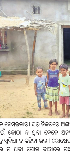
ଏକ ବେସରକାରୀ ଘର ନିକଟରେ ଅଜ୍ଞାନସ୍ତ୍ରୀ ପିଲାମାନେ।

କେନ୍ଦ୍ର ତଥା ରାଜ୍ୟ ସରକାର ଶୂନ୍ୟ ୬ ବର୍ଷର କୁନି ପିଲାମାନଙ୍କ ପ୍ରାକ୍ ଶିକ୍ଷା ଗ୍ରହଣ କରିବା ପାଇଁ ପ୍ରତ୍ୟେକ ଶ୍ରେଣୀରେ ଅଜ୍ଞାନସ୍ତ୍ରୀ ଉଦ୍ଦେଶ୍ୟରେ ନୂଆପଡ଼ା ଜିଲ୍ଲା କୋମନା ବ୍ଲକ ଅନ୍ତର୍ଗତ ଦଳିପଡ଼ା ପଞ୍ଚାୟତ ହାତିସରା ଗାଁ ଗୌଡ଼ିଆପଡ଼ାରେ ଅଜ୍ଞାନସ୍ତ୍ରୀ କେନ୍ଦ୍ର ନାହିଁ।