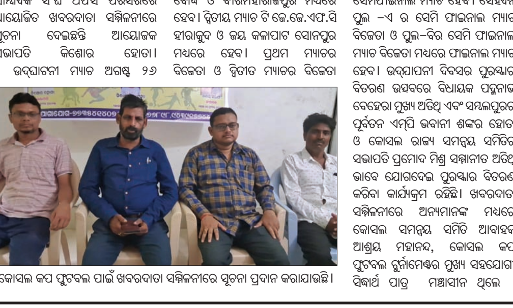
କୋସଲ କପ୍ ଫୁଟବଲ ପାଇଁ ଖବରଦାତା ସମ୍ମିଳନୀରେ ସୂଚନା ପ୍ରଦାନ କରାଯାଇଛି।

ସୁବର୍ଣ୍ଣପୁର ଜିଲ୍ଲା ଶିଶୁ ବିକାଶ ବିଭାଗ ପକ୍ଷରୁ କାରି କରାଯାଇଥିବା ସର୍ବ୍ଭାରରେ ବିଭିନ୍ନ ବ୍ଲକ୍ ଓ ଏହା ଅଧିନରେ ରହିଥିବା ବ୍ଲକ୍ ନାମ ଉଲ୍ଲେଖ କରାଯାଇଛି। ପୂର୍ବରୁ ସୁବର୍ଣ୍ଣପୁର ଜିଲ୍ଲାରେ ୧୨୪୬ଟି ଅଙ୍ଗନୂଷ୍ଠି କେନ୍ଦ୍ର ଓ ୩୧୦ଟି ମିନି ଅଙ୍ଗନୂଷ୍ଠି କେନ୍ଦ୍ର ଥିଲା। ୩୧୦ ମିନି ଅଙ୍ଗନୂଷ୍ଠି କେନ୍ଦ୍ର ମଧ୍ୟରୁ ଏବେ ୪୪ଟି କେନ୍ଦ୍ରକୁ ଅଙ୍ଗନୂଷ୍ଠି କେନ୍ଦ୍ର ପାହ୍ୟାକୁ