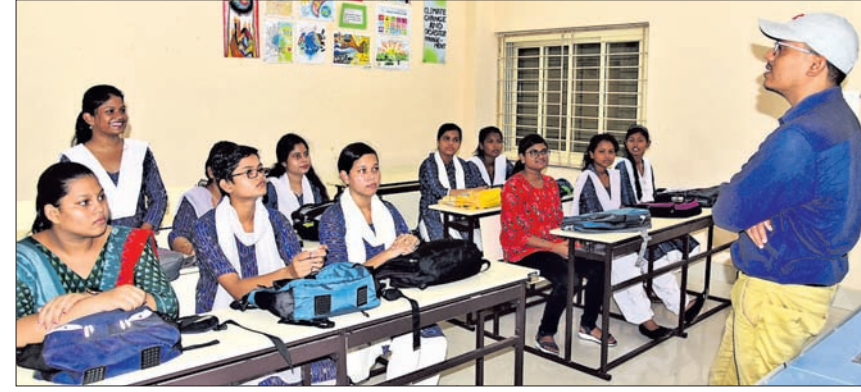
ରମାଦେବୀ ମହିଳା ବିଶ୍ୱବିଦ୍ୟାଳୟରେ ଯୁକ୍ତୀ ପ୍ରଥମ ବର୍ଷ ବାଣିଜ୍ୟ ବିଭାଗର ଛାତ୍ରୀମାନେ କ୍ଲାସ୍ କରୁଛନ୍ତି।

ଭୁବନେଶ୍ୱର, ୨୧।୮ (ଅସମାପିକା ସାହୁ) ୨୦୨୩-୨୪ ଶିକ୍ଷା ବର୍ଷ ପାଇଁ ସମସ୍ତ ଉଚ୍ଚ ମାଧ୍ୟମିକ ଓ ଉଚ୍ଚ ଶିକ୍ଷାନୁଷ୍ଠାନ ସହ ଦୈନିକ ଶିକ୍ଷାନୁଷ୍ଠାନରେ ପାଠପଢ଼ା ଆରମ୍ଭ ହୋଇଯାଇଛି। ଯୁକ୍ତୃ ପ୍ରଥମ ବର୍ଷ ପାଠପଢ଼ା ଗତ ୧ ତାରିଖରୁ ଆରମ୍ଭ ହୋଇଥିବାବେଳେ ଯୁକ୍ତୀ ଓ ପିଜି ପାଠପଢ଼ା ଯୋଜନାରେ ଆରମ୍ଭ ହୋଇଛି। ହେଲେ ଏବେ ବି ଲକ୍ଷ ଲକ୍ଷ ସିଟ୍ ଖାଲି ପଡ଼ିଥିବାରୁ ଚିନ୍ତା ବଢ଼ିଛି। ତେଣୁ ପାଠପଢ଼ାରେ ବହୁ ବିଳମ୍ବ ହୋଇଥିଲେ ମଧ୍ୟ ସିଟ୍ ପୁରଣ ପାଇଁ ନାମଲେଖା ଜାରି ରହିଛି। ମିଳିଥିବା ସୂଚନାମୁତାବେ, ୨୨,୧୯୧୯ ଉଚ୍ଚ ମାଧ୍ୟମିକ ସ୍ତରରେ ୫,୧୬,୮୭୩ଟି ସିଟ୍ ରହିଛି। ସେଥିମଧ୍ୟରୁ ୩,୭୦,୦୬୬ଟି ସିଟ୍ ପୁରଣ ହୋଇଥିବାବେଳେ ୧,୩୭,୮୦୭ଟି ସିଟ୍ ଖାଲି ପଡ଼ିଛି। ଏଥିମଧ୍ୟରେ ବିଜ୍ଞାନରେ ସର୍ବାଧିକ ୫୭,୭୯୫ଟି ସିଟ୍ ଖାଲି ଥିବାବେଳେ କଳାରେ ୫୦,୯୬୨, ବାଣିଜ୍ୟରେ ୧୬,୫୮୯, ସଂସ୍କୃତରେ ୬,୪୪୧ ଏବଂ ଧର୍ମାତ୍ମକ ଶିକ୍ଷାରେ ୬,୦୨୦ଟି ସିଟ୍ ବକଳା ପଡ଼ିଛି। ଯୁକ୍ତୃ ପ୍ରଥମ ପର୍ଯ୍ୟାୟ ନାମଲେଖାରେ ସିଟ୍ ପୁରଣ ନ ହେବାରୁ ବିଦ୍ୟାଳୟ ଓ ଗଣଶିକ୍ଷା ବିଭାଗ ଦ୍ୱିତୀୟ ପର୍ଯ୍ୟାୟ ନାମଲେଖା ପାଇଁ ସୁଯୋଗ ଦେଇଛି। ଏଥିପାଇଁ ଗତ ୧୬ ତାରିଖରୁ ଆବେଦନ ପ୍ରକ୍ରିୟା ଆରମ୍ଭ ହୋଇଛି। ପ୍ରଥମ ପର୍ଯ୍ୟାୟରେ ଯେଉଁ ଛାତ୍ରଛାତ୍ରୀ ଆବେଦନ କରିପାରି