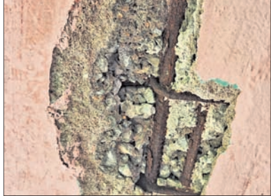
ବୁଥାଗାଁ, ୨୧।୮ (ବିକଳ ତ୍ରିପାଠୀ)

ରାଜ୍ୟ ସରକାର ୫-ଟି ଯୋଜନାରେ ବିଦ୍ୟାଳୟର ଉନ୍ନତକାରଣପାଇଁ କୋଟି କୋଟି ଟଙ୍କା ଖର୍ଚ୍ଚ କରୁଛନ୍ତି। ହେଲେ ଦୁର୍ଭାଗ୍ୟର ବିଷୟ ୧୯୩୭ ମସିହାରେ ନିର୍ମିତ ପ୍ରାଥମିକ ସ୍କୁଲଟି ଏବେ ବି ଦୟନୀୟ ଅବସ୍ଥାରେ ପଡ଼ି ରହିଛି। ବୁଥାଗାଁ ବ୍ଲକ୍ ଅବସ୍ଥାରେ ପଡ଼ି ରହିଛି। ବୁଥାଗାଁ ବ୍ଲକ୍ ଅବସ୍ଥାରେ ପଡ଼ି ରହିଛି। ବୁଥାଗାଁ ବ୍ଲକ୍ ଅବସ୍ଥାରେ ପଡ଼ି ରହିଛି।