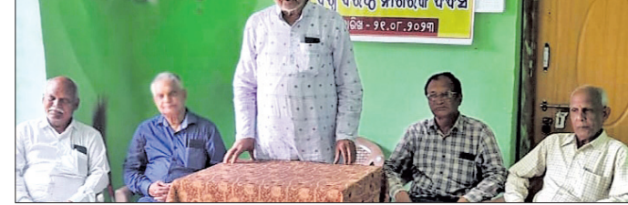
ବାରମହାରାଜପୁରରେ ବରିଷ୍ଠ ନାଗରିକ ଦିବସ ପାଳନ ସଭାରେ ଅତିଥି।