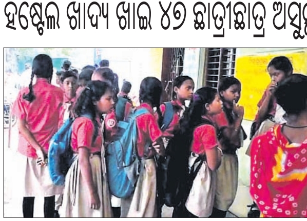
ପାଟଣାଗଡ଼ ମେଡିକାଲକୁ ଚିକିତ୍ସା ପାଇଁ ଆସିଥିବା ଛାତ୍ରାଛାତ୍ରୀ।