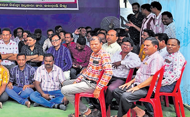
ଚତୁର୍ଥ ଦିନରେ ପିଇଓଙ୍କ ଗଣଧାରଣା ।