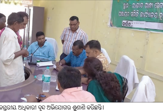
ଜିଲ୍ଲା ଓ ବ୍ଲକସ୍ତରୀୟ ଅଧିକାରୀ ଦ୍ୱାରା ଅଭିଯୋଗର ଶୁଣାଣି କରାଯାଇଛି।