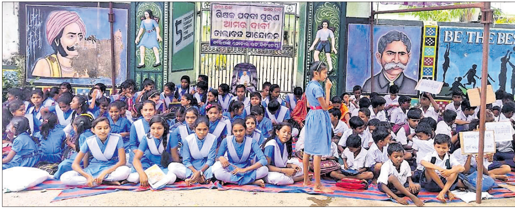
ବରଗଡ଼ ଜିଲା ଗାଇସିଲେଟ୍ ବ୍ଲକ୍ ଅନ୍ତର୍ଗତ ତାଲାପାଲି ନୋଡ଼ାଲ ହାଇସ୍କୁଲ ଫାଟକ ଆଗରେ ଯୋଗଦାନ କରୁଥିବା ଧାରଣା ଦେଇଛନ୍ତି ।