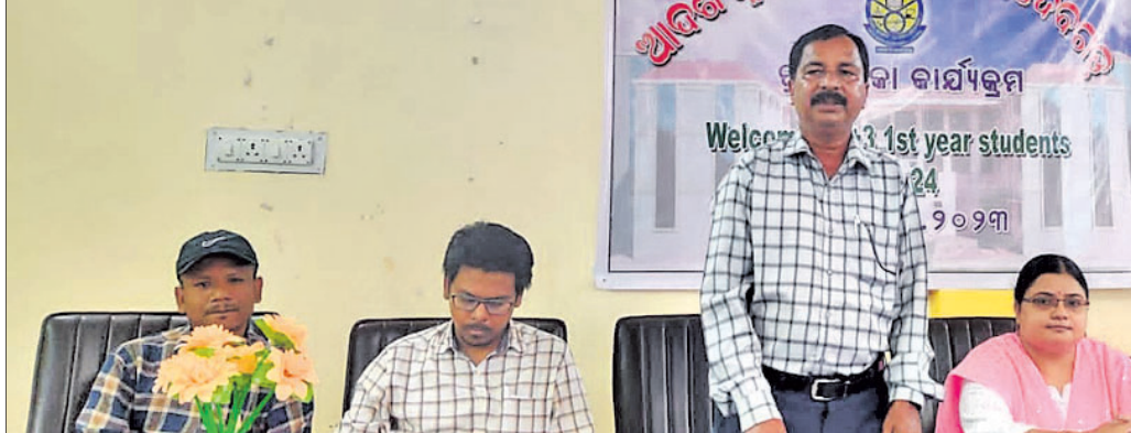
କାର୍ଯ୍ୟକ୍ରମରେ ମଞ୍ଚାଧୀନ ଅଧ୍ୟାପିକା ଓ ଅଧ୍ୟାପକ ।