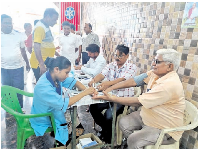
ବରିଷ୍ଠ ନାଗରିକଙ୍କ ସ୍ୱାସ୍ଥ୍ୟ ପରୀକ୍ଷା କରାଯାଇଛି।