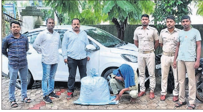
ଭୁବନେଶ୍ୱର, ୨୧।୮ (ସୂର୍ଯ୍ୟକାନ୍ତ ବେହେରା)