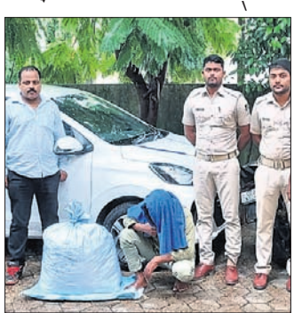
ଭୁବନେଶ୍ୱର, ୨୧୮ (ସୂର୍ଯ୍ୟକାନ୍ତ ବେହେରା)

ଭଉଣୀ ନିକଟ କିଣାଯାଇଥିବା ନୂଆ ଗାଡ଼ିରେ ଭାଇ ଗଞ୍ଜେଇ ବେପାର କରୁଥିବା ବେଳେ ଅବକାରୀ ବିଭାଗ ହାତରେ ଧରିପଡ଼ିଛନ୍ତି।