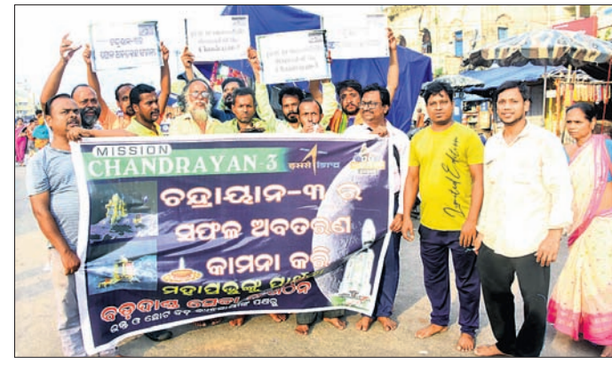
ପୁରୀ ବଡ଼ଦାଣ୍ଡ ସେବା ସଙ୍ଗଠନ ପକ୍ଷରୁ ବଡ଼ଦାଣ୍ଡରେ ଦୀପଦାନ କରାଯାଇଛି।