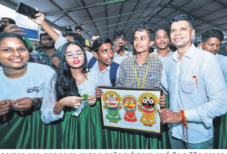
ଭୁବନେଶ୍ୱର ଜନତା ମଇଦାନଠାରେ ସୋମବାର ଅନୁଷ୍ଠିତ କାର୍ଯ୍ୟକ୍ରମରେ ଖୋର୍ଦ୍ଧା ଜିଲାର ବିଭିନ୍ନ କଲେଜରୁ ଆସିଥିବା ଛାତ୍ରାଛାତ୍ରୀଙ୍କ ସହ ୫-ଟି ସରକାରୀ ଭି.କେ. ପାଠିଆନ।