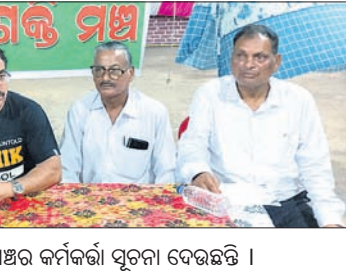
ଖବରଦାତା ସମ୍ମିଳନୀରେ ଓଡ଼ିଶା ଜନଶକ୍ତି ମଞ୍ଚର କର୍ମକର୍ତ୍ତା ସୂଚନା ଦେଇଛନ୍ତି।