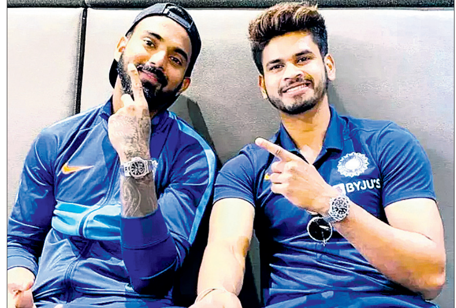
ଲୋକେଶ ରାହୁଲ ଓ ଶ୍ରେୟାସ ଆୟର ।

ଏସିଆ କପ୍ ପାଇଁ ଭାରତୀୟ ଦଳ ଘୋଷଣା ତିନିଜ ନୂଆ ମୁହଁ, ସାମସନ୍ ବ୍ୟାକଅପ୍