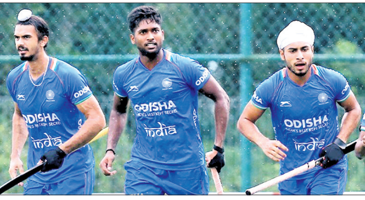
ଗୋଲ ଷ୍ଟୋରପରେ ଉଲ୍ଲାସିତ ଭାରତୀୟ ଖେଳାଳି।