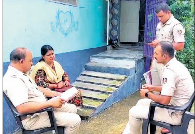
ଗାଙ୍ଗରପାଲିରେ ପୋଲିସ୍ ଟିମ୍ପର ତଦନ୍ତ।

ସମ୍ବଲପୁର ଜିଲ୍ଲା ଅର୍ଲଠାପାଲି ଥାନା ଅନ୍ତର୍ଗତ ଗାଙ୍ଗରପାଲି ଗ୍ରାମରେ ସୋମବାର ଏକ ଅଭାବନୀୟ ଘଟଣା ଦେଖାଦେଇଛି।