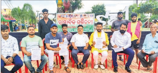
ଖବରଦାତା ସମ୍ମିଳନୀରେ ନବନିର୍ମାଣ ଯୁଗଲତ୍ର ସଙ୍ଗଠନ ପକ୍ଷରୁ ସୂଚନା ଦିଆଯାଇଛି।

ନାହିଁ, ତାହା ପାଠ୍ୟରେ ଗ୍ରାହକ ଶୋଷଣ ବନ୍ଦ କେବେ, ଜଗଣୀ ମହାବିଦ୍ୟାଳୟର ଜମି ମହାବିଦ୍ୟାଳୟ ନାମରେ ୧୯୭୭ ମସିହାରୁ ଏଯାବତ ହୋଇପାରିନାହିଁ, ଜଗଣୀରେ ପ୍ରସ୍ତୁତ ବିଭିନ୍ନ କେନ୍ଦ୍ର ଏବଂ ଆଞ୍ଚଳିକ ଶିକ୍ଷାଗୁଣନରେ ସ୍ଥାନୀୟ ଯୁବତାୟୁବିକଳଙ୍କୁ ନିଯୁକ୍ତି ଆଦି ଦାବି ରହିଛି।