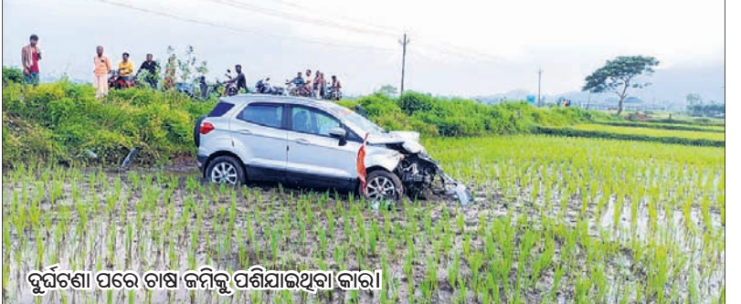
ଦୁର୍ଘଟଣା ପରେ ଡାକ୍ତରୀ କମିଟି ପଶିଯାଇଥିବା କାର।

ଅଟକି ରହିଥିଲା। ଉକ୍ତ ଗାଡ଼ି ମରାମତି ପାଇଁ ୪ଜଣ ମେକାନିକ୍ ଆସି ଘଟଣାସ୍ଥଳରେ ପହଞ୍ଚି ଥିଲେ। ସେମାନେ ଡେଲିକା ମରାମତି କରୁଥିବା ବେଳେ ଏକ ୧୦ଟିଆ ଟ୍ରକ ଭାରସାମ୍ୟ ହରାଇ ଗାଡ଼ି ମରାମତିରେ ନିୟୋଜିତ ମେକାନିକମାନଙ୍କୁ ଧକ୍କା ଦେଇଥିଲା। ଫଳରେ ଘଟଣା ସ୍ଥଳରେ ୨ଜଣଙ୍କ ମୃତ୍ୟୁ ହୋଇଥିଲା।