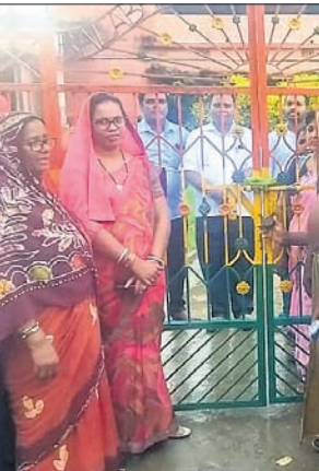
ଅଭିଭାବକମାନେ ବିଦ୍ୟାଳୟ ପାଟକରେ ତାଲା ପକାଇ ଦେଇଛନ୍ତି।

ପୁରୀ ଜିଲ୍ଲା ଅସ୍ତରଙ୍ଗ ବ୍ଲକ ଅଧୀନ ବଳଭଦ୍ରପୁର ମୁକ୍ତି ମୁଦି ବିଦ୍ୟାଳୟରେ କାର୍ଯ୍ୟକ୍ରମ ଥିବା କେଶ ଶିକ୍ଷୟିତ୍ରୀଙ୍କୁ ଏହି ବ୍ଲକ ଅଧୀନ ରାଜକଣ୍ଠା ପ୍ରୋଜେକ୍ଟ ପ୍ରାଇମେରୀ ବିଦ୍ୟାଳୟକୁ ଡେପୁଟେଶନରେ ପଠାଯାଇଛି। କିନ୍ତୁ ଏହାକୁ ବିରୋଧ କରି ବଳଭଦ୍ରପୁର