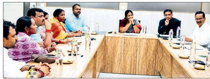
ବୈଠକରେ ମେୟର ଓ କମିଶନରଙ୍କ ସହ ଅନ୍ୟ ଅଧିକାରୀ।