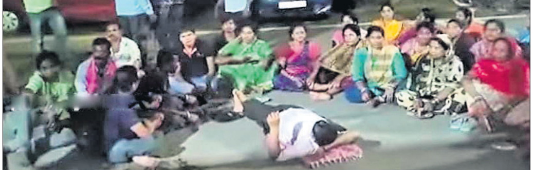
ଭୁବନେଶ୍ୱର, ୨୧।୮ (ସୂର୍ଯ୍ୟକାନ୍ତ ବେହେରା)