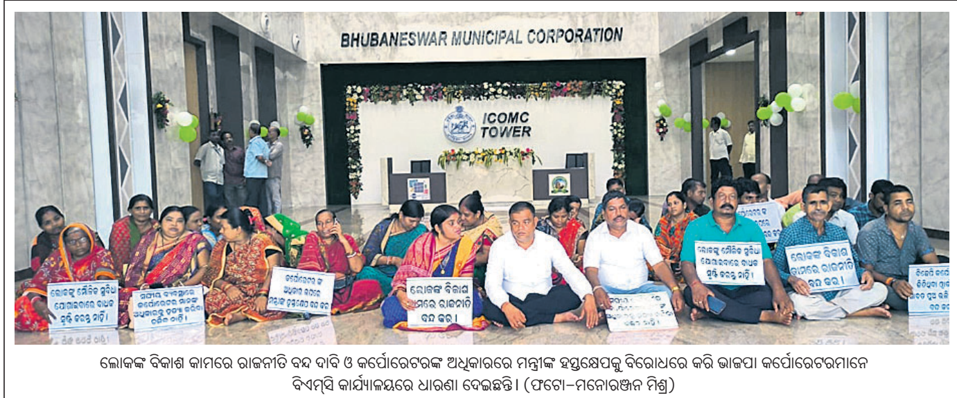
ଲୋକଙ୍କ ବିକାଶ କାମରେ ରାଜନୀତି ବନ୍ଦ ଦାବି ଓ କର୍ପୋରେଟରଙ୍କ ଅଧିକାରରେ ମନୁଆଁ ହସ୍ତକ୍ଷେପକୁ ବିରୋଧରେ କରି ଭାଙ୍ଗିବା କର୍ପୋରେଟରମାନେ ବିଏମ୍ସି କାର୍ଯ୍ୟକ୍ରମରେ ଧାରଣା ଦେଇଛନ୍ତି।

ଗୋପ, ୨୧।୮ (ଭାରତୀ ଭୃକ୍ଷଣ ଉପାଧ୍ୟାୟ): ରବିବାର ମଧ୍ୟାହ୍ନରେ ଗୋପ ଥାନା ଅଧୀନ ନୟାହାଟ ଫାଣ୍ଡି କାର୍ଯ୍ୟରେ କନଷ୍ଟ୍ରେକ୍ସନକୁ ଫାଣ୍ଡି ପରିସରରେ ଅସ୍ଥାନ ଭାଷାରେ ଗାଳିମନ୍ଦ କରି ତେଜାପଥର ମାଡ଼ କରିବା ଅଭିଯୋଗରେ ପୋଲିସ୍ ଜଣେ ଯୁବକଙ୍କୁ ଗିରଫ କରି ଯୋଗଦାନ କୋର୍ଟଚାଲାଣ କରିଛି।