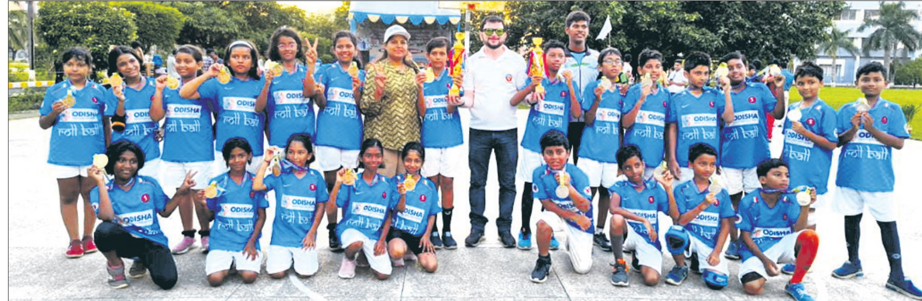
କୋଲକାତାରେ ଗୁରୁ ନାନକ କଲେଜରେ ସୋମବାର ଉଦ୍‌ଯାପିତ ପୂର୍ବାଞ୍ଚଳ ୧୧ ବର୍ଷରୁ କମ୍ ରୋଲ ବଲ୍ ଚାମ୍ପିୟନଶିପ୍‌ରେ କୃତିତ୍ୱ ଅର୍ଜନ କରିଥିବା ଓଡ଼ିଶା ବାଳକ ଓ ବାଲିକା ଦଳ କର୍ମକର୍ତ୍ତାଙ୍କ ଗହଣରେ।