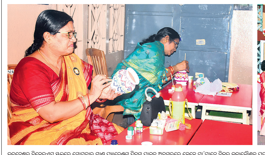
ଭୁବନେଶ୍ୱର ବିଜେପି ସ୍କୁଲରେ ସୋମବାର ଗ୍ରାଣ୍ଟ୍ ପ୍ୟାରେଷ୍ଟସ୍ ଦିବସ ପାଳନ ଅବସରରେ ଜେଜେ ମା'ମାନେ ନିଜର କଳାକୌଶଳ ପ୍ରଦର୍ଶନ କରୁଛନ୍ତି।

ଉପକଣ୍ଠ ଗ୍ରାମବାସୀ ଓ ସହରବାସୀଙ୍କ ବିଭିନ୍ନ ସମସ୍ୟା ଦୂର ହେବା ସହ ରାଜ୍ୟ ମାମଲା ବିଚାର ପାଇଁ ଲୋକଙ୍କୁ ଆଉ ଖୋର୍ଦ୍ଧାକୁ ଯାଇ ଅଥବା ଖର୍ଚ୍ଚ ଓ ସମୟର ଅପଚୟ କରିବାକୁ ପଡ଼ିବ ନାହିଁ। ସେହିପରି ସହର ଉପକଣ୍ଠରେ ଅବସ୍ଥିତ ଗ୍ରାମଗୁଡ଼ିକର ବିକାଶ ବ୍ୟବସ୍ଥା ଦ୍ରୁତ ହୋଇପାରିବ।