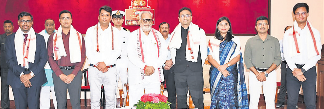
ରାଜକବଚନରେ ରାଜ୍ୟପାଳ ପ୍ରଫେସର ଗଣେଶୀ ଲାଲଙ୍କ ସହ ସିଜିଲ୍ ସଭିସ୍ ପରାମ୍ଭରେ କୃତକାର୍ଯ୍ୟ ପ୍ରାର୍ଥୀ ଓ ଅନ୍ୟମାନେ।