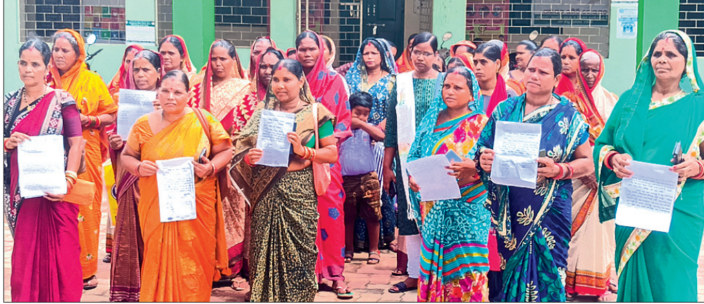
ରୁକ କାର୍ଯ୍ୟାଳୟ ଆଗରେ ବୋଲଗଡ଼ ମିଶନର ଅଧିକାରୀଙ୍କୁ ଅନ୍ତରାଳ ପକ୍ଷରୁ ଧାରଣା ଦିଆଯାଇଛି।