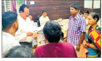
ଗଞ୍ଜା, ୨୧୮ (ବିଜ୍ଞାନ ସାହୁ)

ବାଣୀପୁର ବ୍ଲକ ପରିସରରେ ଯୋଗଦାନ ମିଳିତ ଜନ ଅଭିଯୋଗ ଶୁଣାଣି ଶିବିର ଅନୁଷ୍ଠିତ ହୋଇଯାଇଛି। ଏଥିରେ ମୋଟ ୧୫୭ଟି ଅଭିଯୋଗ ହୋଇଥିଲା।