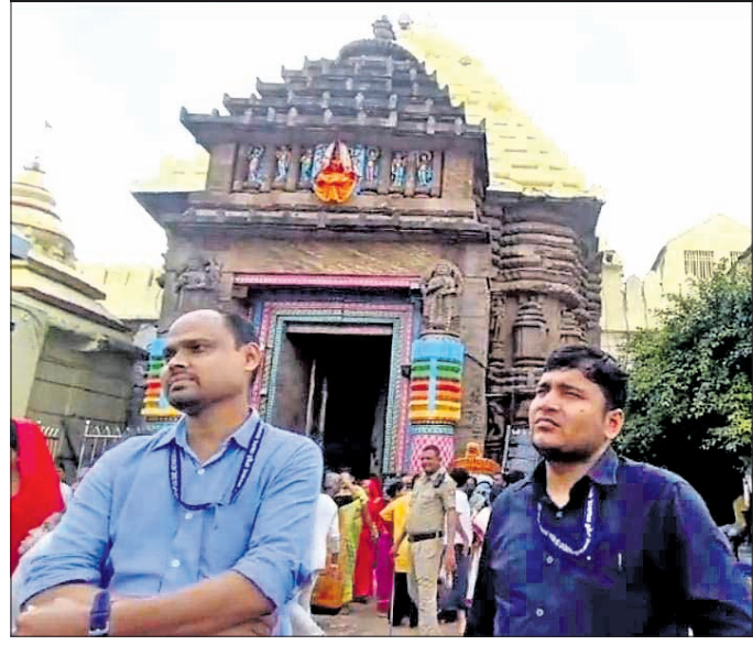
ଏଏସଆଇ ଅଧିକାରୀମାନେ ଶ୍ରୀମନ୍ଦିର ପରିସରରେ ଛୁଟି ଅନୁଧ୍ୟାନ କରୁଛନ୍ତି।

ଶ୍ରୀମନ୍ଦିର ପ୍ରଶାସନର ବରିଷ୍ଠ ଅଧିକାରୀ, ଭାରତୀୟ ପ୍ରତ୍ନତାତ୍ତ୍ୱିକ ସର୍ବେକ୍ଷଣ (ଏଏସଆଇ) ଅଧିକାରୀ ଏବଂ ସଂରକ୍ଷକ (କନକରଭେଣ୍ଡର) ନିର୍ଦ୍ଦେଶକ ସୋମବାର ଶ୍ରୀମନ୍ଦିରର ଛୁଟି ଯାଞ୍ଚ କରିଛନ୍ତି।