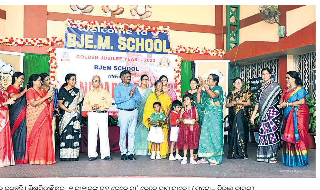
ଶିକ୍ଷୟିତ୍ରୀଶିକ୍ଷକ, ଛାତ୍ରାଛାତ୍ରୀଙ୍କ ସହ ଜେଜେ ମା' ଜେଜେ ବାପାମାନେ।