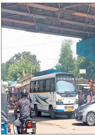
ଏକ୍ସପ୍ରେସ୍ ଛକରେ ଗ୍ରାମିକ୍ କାମ୍ ଯୋଗୁ ଯାନବାହନ ଅଟକି ରହିଛି ।

ରାଉରକେଲା ସହର ଏକ୍ସପ୍ରେସ୍ ଓ ଉତ୍ତରତ୍ରୁକ୍ ଟକ ରାସ୍ତାରେ ଯାତ୍ରୀମାନେ ବସ୍‌କୁ ଅପେକ୍ଷା କରୁଥିବାରୁ ଦିନ ତମାମ ଅସମ୍ଭବ ଭିଡ଼ ଜମୁଛି । ଫଳରେ ଅନେକ ସମୟରେ ଏଠାରେ ଗ୍ରାମିକ୍ କାମ୍ ହେଉଛି । ରାସ୍ତାର ଡିଭାଇଡର ପିଛରେ ଠେଲୀ ଦୋକାନୀଙ୍କ ଯୋଗୁ ଏକ ପରିସ୍ଥିତି ଉତ୍ପନ୍ନ ହୋଇଛି । ରାସ୍ତା ପାର୍ଶ୍ୱରେ ଥିବା ଦୋକାନୀ ମଧ୍ୟ ଚଳାପଥ ଡିଭାଇଡରରେ ଦୋକାନ ସାମଗ୍ରୀ ରଖିବାକୁ ଯାତ୍ରୀମାନେ ମୋ ବସ, ଲୋକାଲ ବସ ଧରିବା ପାଇଁ ଛିଡ଼ା ହେବାକୁ ଘ୍ନାନ ନ ପାଇ ବାଧାହୋଇ ଓଡ଼ିଶା ଟ୍ରାନ୍ସପୋର୍ଟ ଡିଭିଜନ୍‌ରୁ ଡିମାଣ୍ଡ ହେଉଛି ।