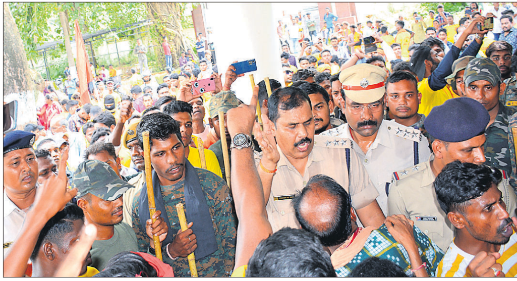
ଆରଡିସି ଅଫିସରେ ପୋଲିସ ସହ କୋଶଳ ସେନା ସଦସ୍ୟଙ୍କ ଧସାଧସି।

କୃଷିଭିତ୍ତିକ ଗଣପର୍ବ ନୂଆଖାଇରେ ପଶ୍ଚିମଓଡ଼ିଶା ସମେତ ସମସ୍ତ ଜିଲ୍ଲାରେ ୩ ଦିନିଆ ସରକାରୀ ଛୁଟି ଘୋଷଣା ସହ ଅନ୍ୟାନ୍ୟ ଦାବି ନେଇ ମଙ୍ଗଳବାର କୋଶଳ ସେନା ଆନ୍ଦୋଳନକୁ ଓହ୍ଲାଇଥିଲେ। ବେକାରୀ ସମସ୍ୟା ଦୂର, କଳକାରଖାନାରେ ୫୦ ପ୍ରତିଶତ ସ୍ଥାନୀୟ ନିଯୁକ୍ତି, ବିପ୍ଳାବିତଙ୍କୁ ସରକାରୀ ନିୟମ ଅନୁସାରେ କ୍ଷତିପୂରଣ ପ୍ରଦାନ, ଚାଷୀମାନଙ୍କ ପାଇଁ ପ୍ରତ୍ୟେକ ବ୍ଲକରେ ଶୀତଳ ଭଣ୍ଡାର ନିର୍ମାଣ, ବିଦ୍ୟୁତ ବିତରଣ କମିଶନ ଚିପିତଗୁଣ୍ଡିଫାଲ ମନମୁଖୁ ନାତି ବନ୍ଦ, ସ୍ୱତନ୍ତ୍ର ରାଜ୍ୟ ଘୋଷଣା ଆଦି ଦାବି ନେଇ କୋଶଳ ସେନା କର୍ମକର୍ତ୍ତା ଆରଡିସିଙ୍କୁ ଜରିଆରେ ରାଷ୍ଟ୍ରପତିଙ୍କୁ ଦାବିପତ୍ର ପ୍ରଦାନ କରିଥିଲେ। ସେମାନେ ପ୍ରଥମେ ଅର୍ଜୁନପାଲି ଛକରୁ ବିଶାଳ ରାଲିରେ ସହର ପରିକ୍ରମା କରି ଆରଡିସି ଅଫିସରେ ପହଞ୍ଚିଥିଲେ।