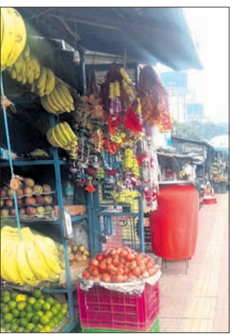
ଯାତ୍ରୀମାନେ ପିଛରେ ଫଳ ଓ ମାଛ ଦୋକାନ ଖୋଲାଯାଇଛି ।

ଏକ୍ସପ୍ରେସ୍ ରାଉରକେଲା ସହରର ଏକ ପ୍ରମୁଖ ଜନଗହଳପୂର୍ଣ୍ଣ ଛକ । ବିଭିନ୍ନ ଘ୍ନାନ ରୋଗୀ ଓ ଡାକ୍ତର ସମ୍ପର୍କୀୟମାନେ ବସ୍‌ରେ ଆସି ଏଠାରେ ଓହ୍ଲାଇ ରାଉରକେଲା ସରକାରୀ ଡାକ୍ତରଖାନାକୁ ଯାଇଥାନ୍ତି । ଏଫ୍‌ସିଆଇ, ଲେବର ଚେନାମେଣ୍ଟ ଓ ଗଙ୍ଗାଧରପାଲି ବସ୍ ଅଞ୍ଚଳର ଶହ ଶହ ଛାତ୍ରଛାତ୍ରୀ ଏହି ଛକରେ ବସରୁ ଓହ୍ଲାଇ କଲେଜକୁ ଯାଆବାହନଗୁଡ଼ିକୁ ଘଣ୍ଟା ଘଣ୍ଟା ଧରି