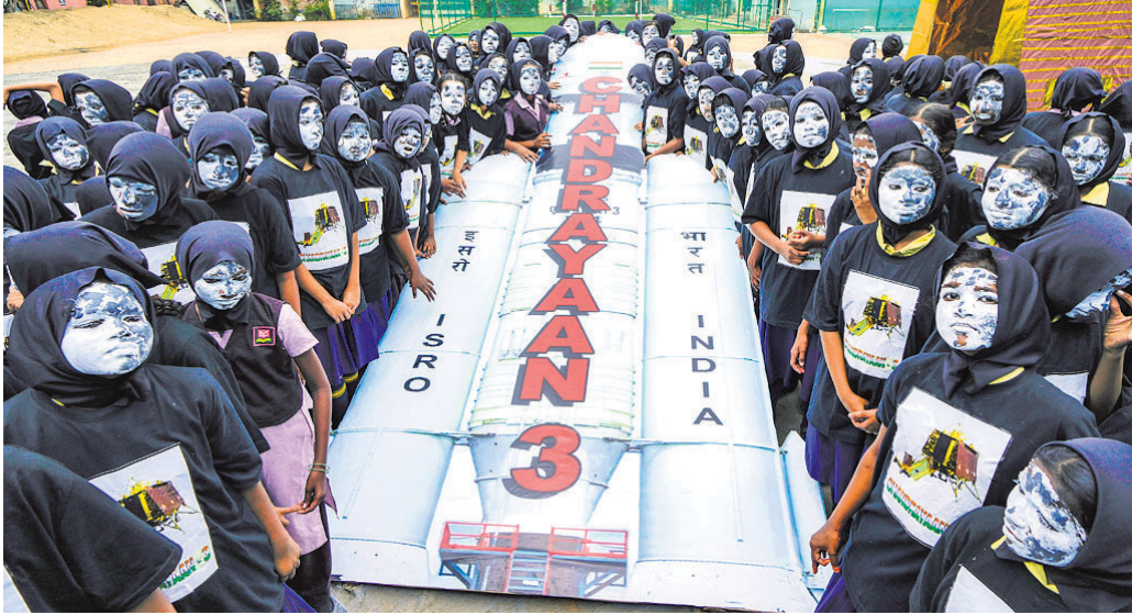
ଚନ୍ଦ୍ରଧାନ-୩ର ସପନ ସୟ୍ ଲ୍ୟାଣ୍ଡ କାମନା କରି ଚେନାଇରେ ଏଭରଓ୍ୱେନ୍ ସ୍କୁଲର ଛାତ୍ରୀମାନେ ପୁଅରେ ଚନ୍ଦ୍ର ଆକୃତି କରିଛନ୍ତି।

ଲୋକପ୍ରିୟ କୁରୁ ଶୋ 'କୌନ ବନେଗା କରୋଡ଼ପତି'ରେ ଉପସ୍ଥାପକ ବିଗ୍ ବି ତାଙ୍କ ପୁଅ ତଥା ଅଭିଷେକଙ୍କୁ ନିଜ ବନ୍ଧୁ ଭାବେ ବିବେଚନା କରୁଥିବା କହିଛନ୍ତି।