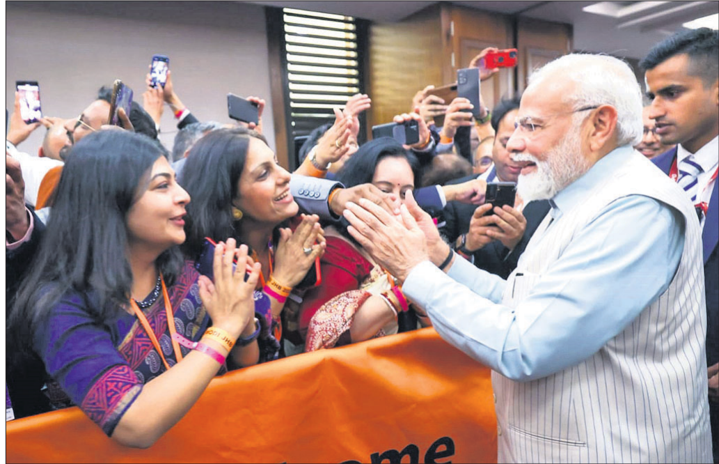
କୋହାତୁବର୍ଗରେ ପ୍ରଧାନମନ୍ତ୍ରୀ ନରେନ୍ଦ୍ର ମୋଦିଙ୍କୁ ମଙ୍ଗଳବାର ଭାରତୀୟ ବଂଶୋତ୍ତରୀରେ ଭବ୍ୟ ସ୍ୱାଗତ କରୁଛନ୍ତି।

ଲୁଚକ ଜନସାଧାରଣ ଲୁଚା ତା ସିଲଭା ମଧ୍ୟ ସମ୍ପର୍କିତରେ ସାମିଲ ହୋଇଛନ୍ତି। ତେବେ ରୁଷିଆ ରାଷ୍ଟ୍ରପତି ଭ୍ଲାଡିମିର ପୁଟିନ୍ ଏଥିରେ ବ୍ୟକ୍ତିଗତ ଭାବେ ଆପଣା ଗସ୍ତ କଲେ ଇଣ୍ଡୋନେସିଆର ଜୁମାର୍ତା ବିରୋଧ (ଆଇସିସି) ପକ୍ଷରୁ ଜାରି ଖୁବ୍ ବଳରେ ଗିରଫ ହେବା ଆଶଙ୍କା ଥିବାରୁ ସେ ଏଥିରେ ଭାଗନେବା ସାମିଲ ହେବେ। ତେବେ ରୁଷିଆ ବହିର୍ଦ୍ୱାରା ପାରି ମନ୍ତ୍ରୀ ସର୍ବେଶ୍ୱର ଲାଲୋଭ ଏଥିରେ ଯୋଗଦେଇଛନ୍ତି। ପ୍ରଧାନମନ୍ତ୍ରୀ ମୋଦି ଆସକା ୨୫ରେ ଦକ୍ଷିଣ ଆଫ୍ରିକାକୁ ଗ୍ରୀଷ୍ମ ଗସ୍ତ କରି ସେଠାରେ ତାଙ୍କ ପ୍ରତିପକ୍ଷ କରିଆକୋସ୍ ମିତ୍ରସଂଗଠନକୁ ଭେଟିବା କାର୍ଯ୍ୟକ୍ରମ ରହିଛି। ୪୦ ବର୍ଷ ଚାଇନା ରାଷ୍ଟ୍ରପତି ଶି ଜିନ୍-ପିଇଁଙ୍କୁ ସମ୍ମାନେ ପ୍ରଧାନମନ୍ତ୍ରୀଙ୍କ ପ୍ରଥମ ଗ୍ରୀଷ୍ମ ଗସ୍ତ।