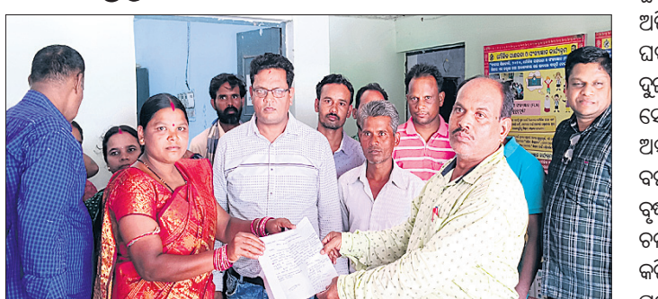
ବ୍ଲକ ଅଧ୍ୟକ୍ଷ, ପରିଚାଳନା କମିଟି ସଭାପତିଙ୍କ ନେତୃତ୍ୱରେ ଆସିଥିବା ଗ୍ରାମବାସୀ ଦାବିପତ୍ର ଦେଇଛନ୍ତି ।