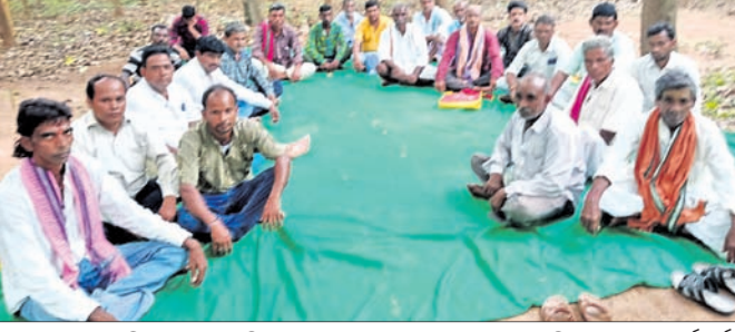
ବାଗବତ ଚନ୍ଦ୍ରମଣି ମଠରେ ତୈଳିକ ବୈଶ୍ୟ ସମାଜର ବୈଠକରେ ଉପସ୍ଥିତ ସମାଜର କର୍ମକର୍ତ୍ତା।