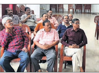
ଶୋକସଭାରେ ଉପସ୍ଥିତ ଅବସରପ୍ରାପ୍ତ କର୍ମଚାରୀ ।