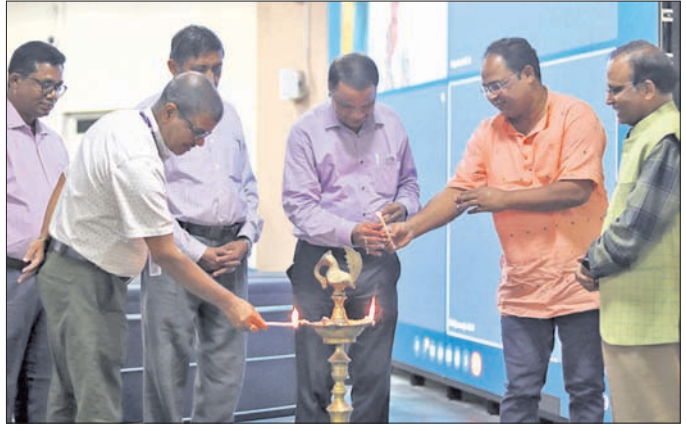
କର୍ମଶାଳା ଉଦ୍ଘାଟନା କାର୍ଯ୍ୟକ୍ରମରେ ଅତିଥିମାନେ।