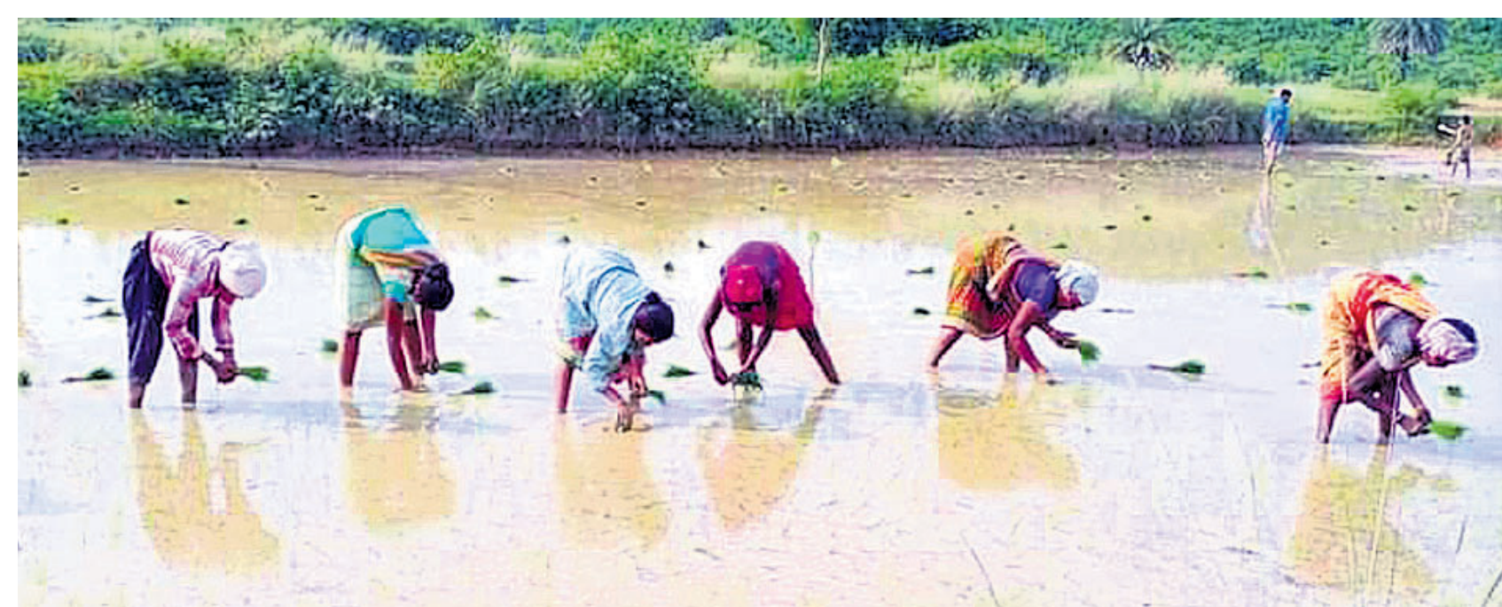
ସାମାଜିକ ବର୍ଷା ହେବା ପରେ ରାଉରକେଲା କୁଆଁରପୁଣ୍ୟ ଅଞ୍ଚଳରେ କୃଷି ଶ୍ରମିକମାନେ ଜମିରେ ଧାନ ପହାଳୁଆ କାମ କରୁଛନ୍ତି ।

ରାଉରକେଲା, ୨୨।୮ (ବିପ୍ଳବ ରଞ୍ଜନ ଦାଶ): ଜାତୀୟ କ୍ରୀଡ଼ା ବିଦ୍ୟାଳୟ ଉପଲକ୍ଷେ ଆରୁସ୍‌ସି ଅଞ୍ଚଳର ବାଳିକା ବାଳକମାନଙ୍କୁ ନେଇ ଆସନ୍ତା ୨୯ତାରିଖରୁ ଓପନ ସ୍କୁଲ ଚୁନାମେଣ୍ଟ-୨୦୨୩ ଆୟୋଜିତ ହେବ । ଏହା ସେପ୍ଟେମ୍ବର ୨ତାରିଖ ପର୍ଯ୍ୟନ୍ତ ଚାଲିବ । ଆୟୋଜକ ଆରୁସ୍‌ସି ପକ୍ଷରୁ ହେବାକୁ ଥିବା ଚୁନାମେଣ୍ଟରେ ବିଜେତା ଓ ଉପବିଜେତା ଦଳକୁ ଟ୍ରଫି ପ୍ରଦାନ କରାଯିବ । ଏଥିରେ ରାଉରକେଲା ଓ ଏହାର ଆଖପାଖ ଆଗ୍ରହୀ ବିଦ୍ୟାଳୟ ଏବଂ ଯୁକ୍ତ ୨ କଲେଜଗୁଡ଼ିକୁ ଭାଗନେବାକୁ ଆମନ୍ତ୍ରଣ କରାଯାଇଛି । ଏଥିରେ ଶାନ୍ତି ଗ୍ରୁପ୍ ରହିବ । ସେଗୁଡ଼ିକ ହେଲା ୧୦ମ ଶ୍ରେଣୀ(ବାଳକ) ଗ୍ରୁପ୍-୧, ଦ୍ୱାଦଶ ଶ୍ରେଣୀ(ବାଳକ) ଗ୍ରୁପ୍-୨ ଓ ଦ୍ୱାଦଶ ଶ୍ରେଣୀ (ବାଳିକା) ଗ୍ରୁପ୍-୩। ଚୁନାମେଣ୍ଟରେ ୧୫ଜଣିଆ ଖେଳାଳିଙ୍କ ସହ ଜଣେ କୋର୍ କମ୍ ମ୍ୟାନେଜରଙ୍କ ଚାଳିକା, ବିଦ୍ୟାଳୟ ପ୍ରିନ୍ସିପାଲ କିମ୍ବା ପ୍ରଧାନଶିକ୍ଷକଙ୍କ ଦ୍ୱାରା ଅନୁମୋଦିତ ହୋଇଥିବା ଆବଶ୍ୟକ । ଆଧାର କାର୍ଡ କପି ସହିତ ଆବଦ୍ଧ ପର୍ମାଣରେ ଆସନ୍ତା ୨୭ ତାରିଖ ଅପରାହ୍ନ ୩ଟା ୩୦ମିନିଟ୍ ଭିତରେ ଦାଖଲ କରିବାକୁ କୁହାଯାଇଛି । ଏହି ଚୁନାମେଣ୍ଟ ଲକ୍ଷ୍ୟରେ ସ୍ୱାସ୍ଥ୍ୟ ସେକ୍ଟର-୨ରେ ନକ୍ସାଭିତ୍ତ ଆଧାରରେ ଖେଳାଳିଙ୍କୁ ଚୁନାମେଣ୍ଟ ଦିଆଯାଇଛି ।