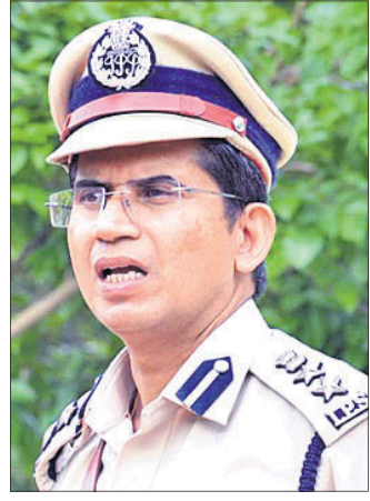
ଡିଆଇଜି ତ୍ରିକେଶ କୁମାର ରାୟ

ନିଜ ଆଡୁ ମାମଲା ରୁଜୁ କଲେ ଓଏର୍ଆର୍ଏ ୧୫ ଦିନରେ ରିପୋର୍ଟ ଦେବାକୁ ପୋଲିସ୍ ତିକିଙ୍କୁ ନିର୍ଦ୍ଦେଶ ଦିଆଯାଇଛି।