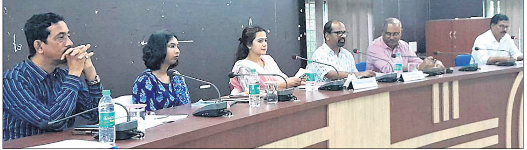
ସମୀକ୍ଷା ବୈଠକରେ ଜିଲାପାଳଙ୍କ ସହ ଅଧିକାରୀମାନେ।