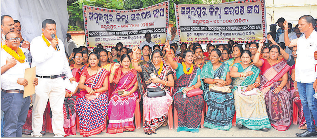
ବିକ୍ଷୋଭ ସମାବେଶରେ ସରପଞ୍ଚ ସଂଘ ସଦସ୍ୟମାନେ।