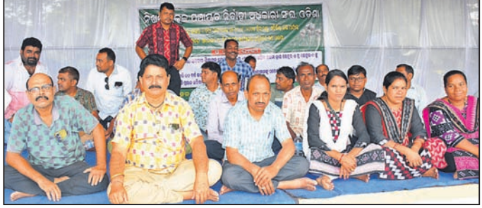
ଜିଲାପାଳଙ୍କ ଅଫିସ ଆଗରେ ଧାରଣାରେ ବସିଛନ୍ତି ପଞ୍ଚାୟତ ନିର୍ବାହୀ ଅଧିକାରୀ।