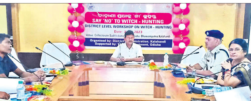
ସଚେତନତା କର୍ମଶାଳାରେ ଯୋଗ ଦେଇଥିବା ଅତିଥି ।