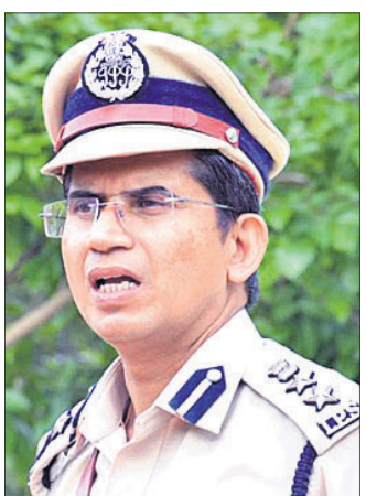
ଡିଆଇଜି ତ୍ରିକେଶ କୁମାର ରାୟ

ନିଜ ଆଡୁ ମାମଲା ରୁଜୁ କଲେ ଓଏର୍ଆର୍ଏ ୧୫ ଦିନରେ ରିପୋର୍ଟ ଦେବାକୁ ପୋଲିସ୍ ତିକିଙ୍କୁ ନିର୍ଦ୍ଦେଶ ଦିଆଯାଇଛି।