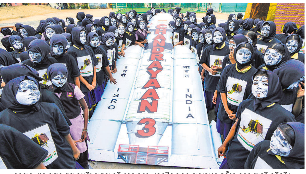
ଚନ୍ଦ୍ରୟାନ-୩ର ସପନ ସୟ୍ ଲ୍ୟାଣ୍ଡିଂ କାମନା କରି ଚେନ୍ନାଇରେ ଏଭରଓ୍ୱେନ୍ ସ୍କୁଲର ଛାତ୍ରୀମାନେ ପୁଅଁରେ ଚନ୍ଦ୍ରର ଆକୃତି କରିଛନ୍ତି।