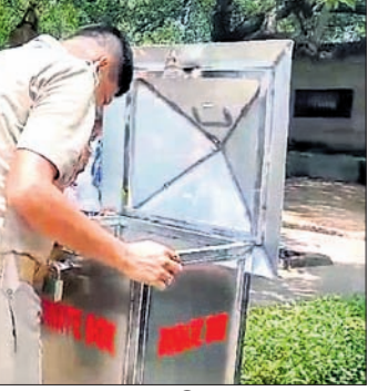
ପୋଲିସ୍ ପକ୍ଷରୁ ଘଟଣାସ୍ଥଳରେ ତଦନ୍ତ କରାଯାଇଛି।