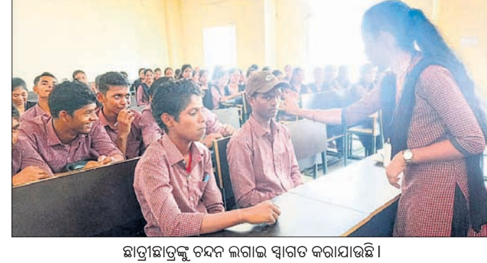
ଛାତ୍ରୀଛାତ୍ରୀଙ୍କୁ ଚନ୍ଦନ ଲାଗାଇ ସ୍ମାରଣ କରାଯାଇଛି।

ବନ୍ଧୁ, ୨୨୮୮ (ପରିକ୍ଷିତ ସାହୁ) ଚରଣ ପ୍ରଧାନ ଯୋଗ ଦେଇଥିବା ଛାତ୍ରୀଛାତ୍ରୀମାନେ ମନ ଦେଇ ପାଠ ପଢ଼ିଲେ ସଫଳତାର ଶୀର୍ଷରେ ପହଞ୍ଚିବ। ସହ ସ୍ୱପ୍ନ ସାଧନ କରିପାରିବେ। କିଶୋରନଗର ବ୍ଲକ୍ ବଜ୍ରାସ୍ଥିତ ଜନତା ମହାବିଦ୍ୟାଳୟରେ ସୋମବାର ମୁକ୍ତମା ପ୍ରଥମ ବର୍ଷ ଛାତ୍ରୀଛାତ୍ରୀଙ୍କ ସ୍ମାରଣ ସମ୍ବନ୍ଧରେ ଯୋଗ ଦେଇ ଅତିଥିମାନେ କରାଯାଇଥିଲା। ଅଧ୍ୟାପିକା ସୁମିତ୍ରା ଭାବେ ମହାବିଦ୍ୟାଳୟ ଅଧ୍ୟକ୍ଷ କାଳନ୍ଦୀ