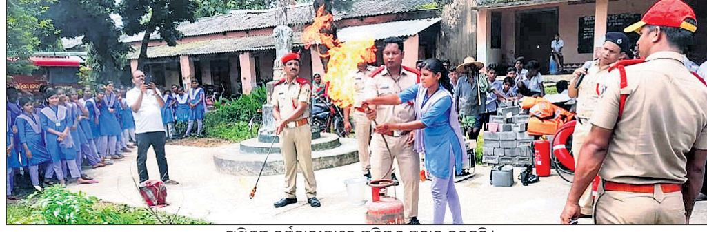
ଅଗ୍ନିଶମ କର୍ମଚାରୀମାନେ ପ୍ରଶିକ୍ଷଣ ପ୍ରଦାନ କରୁଛନ୍ତି।

ବନ୍ଧୁ, ୨୨୮୮ (ପରିକ୍ଷିତ ସାହୁ) ବିଭିନ୍ନ ସମୟରେ ଅଗ୍ନିକାଣ୍ଡ ଘଟି ଅନେକ ସମ୍ପତ୍ତି ନଷ୍ଟ ହେଉଛି। ଏପରିକି ଅଧ୍ୟାପନା ଯୋଗୁଁ ଲୋକଙ୍କ ଜୀବନହାନି ମଧ୍ୟ ହେଉଛି। ତେଣୁ ଏ ନେଇ ଅନୁଗୋଳ ସରକାରଙ୍କୁ ଅଗ୍ନିକାଣ୍ଡ ମୁକାବିଲା ଉପରେ ଗୁରୁତ୍ୱ ଦେବାକୁ ଆଠମାଲିକ ଅଗ୍ନିଶମ ବିଭାଗ ପକ୍ଷରୁ ମଙ୍ଗଳବାର ଠାକୁରଗଡ଼ ଥାନା ପାଲକାଣୀ ରାଧାମାଧବ ଉଚ୍ଚ ବିଦ୍ୟାଳୟ ପରିସରରେ ଅଗ୍ନିକାଣ୍ଡ