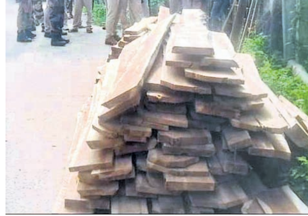
ଜବତ କାଠ ।