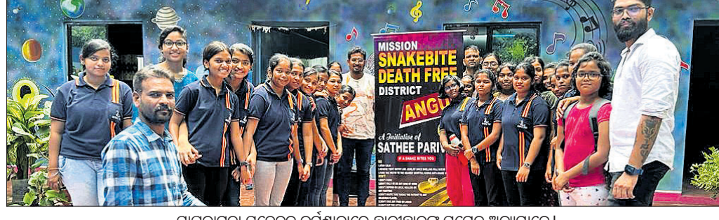
ସାପକାମୁଡ଼ା ସଚେତନ କର୍ମଶାଳାରେ ଛାତ୍ରୀଛାତ୍ରୀଙ୍କ ସମେତ ଅନ୍ୟମାନେ।

ଅନୁଗୋଳ, ୨୨୮୮ (ଅମିତ କୁମାର ସାମଲ) ସାପକାମୁଡ଼ା ପ୍ରତି ସାଧାରଣରେ ଥିବା ଭ୍ରାନ୍ତଧାରଣା, ଭୟ ଓ ଅସଂଗଠିତ ସାପ ସଂଖ୍ୟା ବୃଦ୍ଧି ପାଇଛି। ସାପ ସଂଖ୍ୟା ମଧ୍ୟ ହ୍ରାସ ପାଇଛି। ତେଣୁ ବୈଜ୍ଞାନିକ ପଦ୍ଧତିରେ ସାପ ଓ ସାପକାମୁଡ଼ା ବିଷୟରେ ଜ୍ଞାନ ଆହରଣ ଏବଂ ସଚେତନ ହୋଇପାରିଲେ ଏହି ସମସ୍ୟାର ସରଳ ସମାଧାନ ହୋଇପାରିବ ବୋଲି ଅନୁଗୋଳର ବେତାଶାସନ ଉଚ୍ଚ ବିଦ୍ୟାଳୟ, ବଡ଼କେରକାଙ୍ଗ ଉଚ୍ଚ