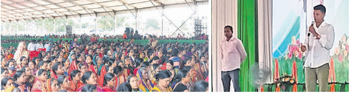
ଖୋର୍ଦ୍ଧା ହାବେଳ ପଡ଼ିଆରେ ଆୟୋଜିତ କାର୍ଯ୍ୟକ୍ରମରେ ଉପସ୍ଥିତ ଜନସାଧାରଣ (ବାମ)। ୫-ଟି ସଚିବ ଭି.କେ. ପାଣ୍ଡିଆନ୍ ଉଦ୍‌ଘୋଷଣା କରୁଛନ୍ତି।

ଖୋର୍ଦ୍ଧା, ୨୨।୮ (ପ୍ରଭାତ ପାଣିଗ୍ରାହୀ) ମୁଖ୍ୟମନ୍ତ୍ରୀଙ୍କ ନିର୍ଦ୍ଦେଶରେ ତାଙ୍କ ବ୍ୟକ୍ତିଗତ (୫-ଟି) ସଚିବ ଭି.କେ. ପାଣ୍ଡିଆନ୍ ରାଜ୍ୟର ବିଭିନ୍ନ ଜିଲ୍ଲା ଗସ୍ତ କରି ଲୋକଙ୍କଠାରୁ ଅଭିଯୋଗ ଗ୍ରହଣ କରିବା ସହ ବିଭିନ୍ନ ଉନ୍ନୟନମୂଳକ କାର୍ଯ୍ୟର ସମୀକ୍ଷା କରୁଛନ୍ତି। ଏହିକ୍ରମରେ ମଙ୍ଗଳବାର ୫-ଟି ସଚିବ ଖୋର୍ଦ୍ଧା ଗସ୍ତରେ ଆସି ବେରୁନିଆ, ଖୋର୍ଦ୍ଧା ଏବଂ ବାଣପୁର ରୁକ୍ତ ଗସ୍ତ କରିଥିଲେ। ୯୨୨କୋଟି ଟଙ୍କା ବ୍ୟୟ ଅଟକଳରେ ଚାଳିଥିବା ବେରୁନିଆ, ବୋଲଗଡ଼, ଖୋର୍ଦ୍ଧା, ଗଙ୍ଗା, ବାଣପୁର ଓ ବିଲିକାରେ ମେଗା ପାଇପ ପାନୀୟତା ପ୍ରକଳ୍ପର ସମୀକ୍ଷା କରିଥିଲେ। ୨୦୨୪ ଜାନୁଆରୀରୁ ଏହା କାର୍ଯ୍ୟକ୍ଷମ ହେବ। ଏଥିସହ ୩୫କୋଟି ଟଙ୍କା ବ୍ୟୟ ଅଟକଳରେ ଗଙ୍ଗା ଏବଂ ବିଲିକାରେ ନିର୍ମାଣ ହେବାକୁ ଥିବା ମାଛ ରକ୍ଷଣ କେନ୍ଦ୍ର ସମୀକ୍ଷା କରିଥିଲେ। ମା'ଉଗ୍ରତାର ପାଠ ଏବଂ ବାଣପୁର ଭଗବତୀ ମନ୍ଦିର ସୌନ୍ଦର୍ଯ୍ୟକରଣ ପାଇଁ ୧୯ କୋଟି ଲେଖାଏ ବ୍ୟୟ ଅଟକଳ ମଞ୍ଜୁର କରାଯାଇଛି। ବାଣପୁର ଏବଂ ବାଲୁଆ ଏନ୍‌ଏସିରେ ରହିଥିବା