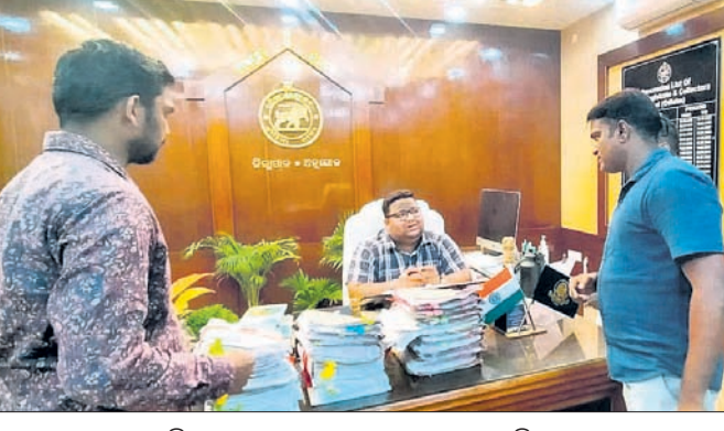
ଜିଲ୍ଲାପାଳଙ୍କୁ ସ୍ମାରକପତ୍ର ପ୍ରଦାନ କରାଯାଇଛି।

ଅନୁଗୋଳ, ୨୨୮୮ (ଅମିତ କୁମାର ସାମଲ) କେନ୍ଦ୍ର ଓ ରାଜ୍ୟ ସରକାରଙ୍କ ଜାବିକା ମିଶନ ଯୋଜନାର ସଫଳ ରୂପାୟନ ପାଇଁ କାର୍ଯ୍ୟ କରିଥିବା ଭକ୍ଷଣକାରୀ କମ୍ୟୁନିଟି ଡିଭିଜନ ପର୍ଯ୍ୟନ୍ତ (ଆଇଆରପି)ମାନେ ସ୍ଥାୟୀ ନିୟୁକ୍ତି ପାଇଁ ଦାବି କରିଛନ୍ତି। ଅନୁଗୋଳ ଜିଲ୍ଲା କାର୍ଯ୍ୟରେ ଏହି ଆଇଆରପିମାନେ ମୁଖ୍ୟମନ୍ତ୍ରୀଙ୍କ ଉଦ୍ଦେଶ୍ୟରେ ଏକ ୫ ପୃଷ୍ଠା ଦାବିପତ୍ର ଜିଲ୍ଲାପାଳଙ୍କୁ ପ୍ରଦାନ କରିଛନ୍ତି। ସେମାନେ ଦାବି କରିଛନ୍ତି, ପଞ୍ଚାୟତସ୍ତରରେ ସୋସିଆଲ ଅତିର ପଦବୀ ସୃଷ୍ଟି