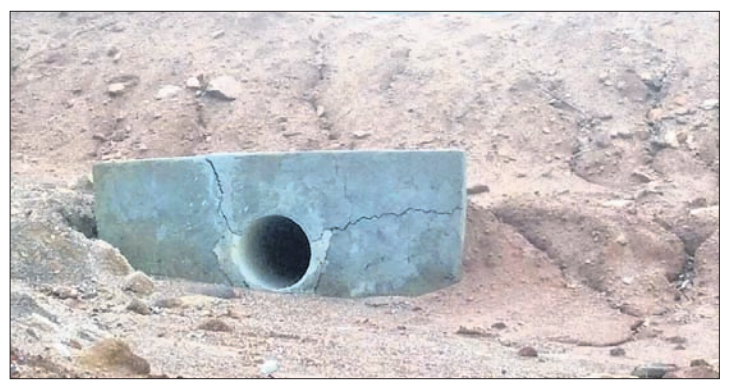
ଅମୃତ ସରୋବର କଳ ନିଷ୍କାସନ ପଥରେ ସୃଷ୍ଟି ହୋଇଥିବା ଫାଟ ।

କାମାକ୍ଷାନଗର, ୨୨୮୮ (ସୁଧାର ପରିଦ୍ଵା) ମାତ୍ର ୮ ମାସ ତଳେ ଜଳ ନିଷ୍କାସନ ପାଇଁ ତିଆରି କରାଯାଇଥିବା କଂକ୍ରିଟ୍ ପ୍ଲାଟଫର୍ମ ଫାଟି ଥିବା ଦେଖି ଅଧିକାରୀ ପହଞ୍ଚି ହେଲେ କାଳେ ଭୁବନେଶ୍ଵର ପଡ଼ିବ, ସେହି ଭୟରେ ଜଳାଶୟ ଭିତରକୁ ଯାଉଥିବା ପାହାଡ଼ ପାଣି ବନ୍ଦ କରିଦିଆଯାଇଛି । ଦେଢ଼ାମାଲ ଜିଲା ଆଦିବାସୀବହୁଳ କଳହାହାଡ଼ ବ୍ଲକ୍ ଅମୃତ ସରୋବର ପ୍ରକଳ୍ପ କାର୍ଯ୍ୟରେ ଏଭଳି ନିମ୍ନମାନର କାମ ହୋଇଥିବା ସ୍ଥାନୀୟ ଅଞ୍ଚଳବାସୀ ଅଭିଯୋଗ କରିଥିବାବେଳେ ଏହାର ସ୍ଥାୟିତ୍ଵ ନେଇ ପ୍ରଶ୍ନ ଉଠାଇଛି ସେମାନେ । ପ୍ରଧାନମନ୍ତ୍ରୀ କୃଷି ସିଆଲ ଯୋଜନା-୨୦ ଆରମ୍ଭରେ କୃଷିର ବିକାଶ ପାଇଁ ୨୦୨୨-୨୩ ଅର୍ଥକ ବର୍ଷରେ କଳହାହାଡ଼ ବ୍ଲକ୍ ସମ୍ପୂର୍ଣ୍ଣ ପଞ୍ଚାୟତ ଅନ୍ତର୍ଗତ ଗୁରୁକାଙ୍ଗୁଲି ଗ୍ରାମ ତାହିନାଳୀ ଅମୃତ ସରୋବର ଉନ୍ନତୀକରଣ ପାଇଁ ୧୩ ଲକ୍ଷ ୬୨ ହଜାର ଟଙ୍କା ବ୍ୟୟବ୍ୟୟ ହୋଇଥିଲା । ପୋଖରୀ ନିକଟରେ ଥିବା ୧୭.୫ ଏକର ଗାଈ ଜମିରେ ଉକ୍ତ ପ୍ରକଳ୍ପ