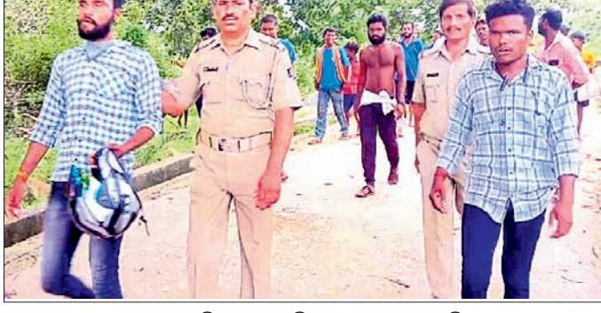
୨ ଅଭିଯୁକ୍ତଙ୍କୁ ପୋଲିସ୍ ହେପାଜତକୁ ନେଇଛି।

ରାସ୍ତା ଅବରୋଧ କାରଣରୁ ଯାନବାହନ ଅଟକି ରହିଛି। ସେମାନେ ପୂର୍ବରୁ ୧୦ଟାକୁ ପକ୍ଷରୁ ୧୨ଟା ଯାଏ ରାସ୍ତା ଅବରୋଧ କରିଥିଲେ। ୭ଟି ଭିତରେ ରାସ୍ତା ମରାମତି କରାଯିବ ବୋଲି ପ୍ରଶାସନିକ ପ୍ରତିଶ୍ରୁତି ମିଳିବା ପରେ ରାସ୍ତାରୋକ୍ତ ହଟିଥିଲା। ସମ୍ପ୍ରଦାୟର କାର୍ଯ୍ୟରେ ଅହେତୁକ ଖାଲରେ ଭର୍ତ୍ତି ହୋଇଥିବାବେଳେ ଧୂଳି ଭଡ଼ି ପ୍ରଦୂଷଣ ବଢ଼ିବାରେ ଲାଗିଛି। ଦୁର୍ଘଟଣା ମଧ୍ୟ ଘଟୁଛି। ଏହାର ପ୍ରତିବାଦରେ ମଙ୍ଗଳବାର ରାସ୍ତାକୁ ଓହ୍ଲାଇଛନ୍ତି ଓଡ଼ାପଡ଼ା ଛକ ଅଞ୍ଚଳବାସୀ।