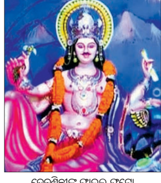
ଦେବଶିଳ୍ପୀଙ୍କ ପାଇଲ ଫଟୋ

ବର୍ଷର ପାଇ, ୨୨୮୮ (ଉପେନ୍ଦ୍ର ରାଉତ) ଆସନ୍ତା ସେପ୍ଟେମ୍ବର ୧୭ରେ ବିଶ୍ୱକର୍ମୀ ପୂଜା ପାଳନ ହେବ। ଏଥିପାଇଁ ଅନୁଗୋଳ ଜିଲ୍ଲା ନାଲୁକୋ ଅଞ୍ଚଳ ଚଳଚଞ୍ଚଳ ହୋଇଉଠିଲାଣି। ପୂର୍ବବର୍ଷରୁ ଡିଜିଟାଲ ଆକର୍ଷଣ କରାଯିବ, ସୁନ୍ଦର ତୋରଣ ସାଜକୁ ରଙ୍ଗିନି ଆଲୋକନାକାରରେ ସମଗ୍ର ଅଞ୍ଚଳ ଝଲି ଝଲି, ତାହା ଉପରେ ଦେଓକରେ ଅଧିକ ଗୁରୁତ୍ୱ ହେବ। ଏ ନେଇ ନାଲୁକୋ ଡେଓକ ସେକ୍ଟରରେ ଇତି ଅମାୟ ସାଙ୍ଗିକ ଅଧିକାରୀଙ୍କୁ ଏକ ପ୍ରସ୍ତୁତି ଦେଓକ