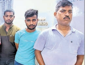
ଲୁହା ଛଡ଼ ଚୋରି ଘଟଣାରେ ଗିରଫ ଅଭିଯୁକ୍ତମାନେ।