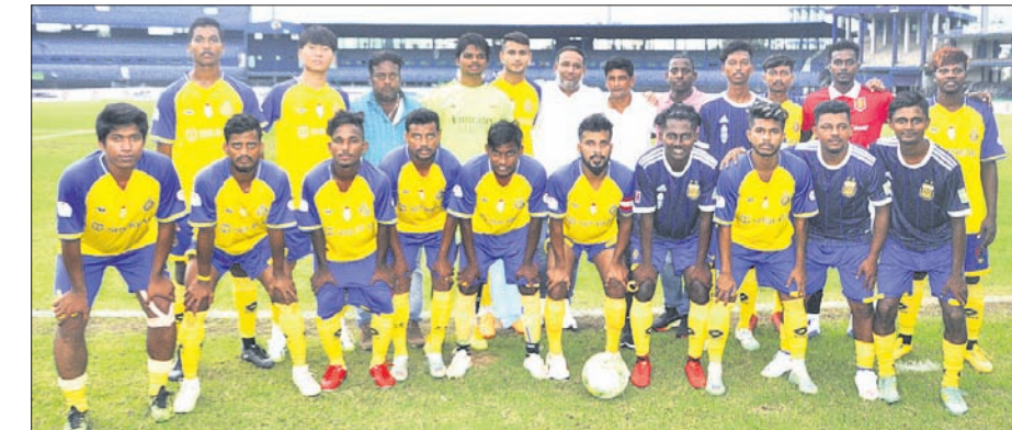
ଫାୱ ଲିଗ୍ ସିଲଭର ଗୁପ୍ତ ଚାମ୍ପିୟନ ହୋଇଥିବା ଇଣ୍ଡିପେଣ୍ଡେଣ୍ଟ କ୍ଲବ୍ ଦଳ।