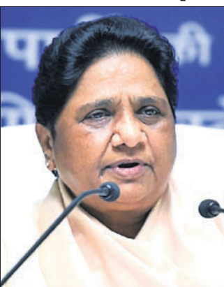
ଅଧିକ କ୍ଷତି ସହିଛି ବିଏସ୍ପିର ଭୋଟ ସ୍ୱତ୍ତ୍ୱ ଭାବେ ମିଳିତ ମେଣ୍ଟର ଅନ୍ୟ ଦଳକୁ

ଲକ୍ଷ୍ମୀ, ୨୩୮: ଆଗାମୀ ଲୋକସଭା ନିର୍ବାଚନରେ ବହୁଜନ ସମାଜ ପାର୍ଟି (ବିଏସ୍ପି) କାହାପସ ମେଣ୍ଟ କରାବନି ନାହିଁ। ମିଳିତ ମେଣ୍ଟ ଦଳକୁ କିଛି ପାଇଦା ମିଳୁନାହିଁ ବୋଲି କହୁଛନ୍ତି ବିଏସ୍ପି ମୁଖ୍ୟ ମାୟାବତୀ। ଦଳ ପକ୍ଷରୁ ରୁଧିର ଅନୁଷ୍ଠିତ ଏକ ବୈଠକରେ ସଂଗଠନକୁ ମଜବୁତ କରିବା ଉପରେ ସେ ଗୁରୁତ୍ୱରୋପ କରିଛନ୍ତି। ମାୟାବତୀ କହିଛନ୍ତି, ପ୍ରାଥମିକତାରେ ଦଳକୁ ସତର୍କ ରହିବାକୁ ପଡ଼ିବ। ଲୋକସଭା ନିର୍ବାଚନରେ ଦଳ ସମୂହ ଆସନରେ ପ୍ରତିଦ୍ୱନ୍ଦ୍ୱିତା କରିବ। ମିଳିତ ମେଣ୍ଟ ଯୋଗୁ ଦଳ ଲାଭ ଅପେକ୍ଷା