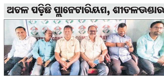
ଶ୍ରବଣଦାସ ସମିତିର ସଭାରେ ଉପସ୍ଥିତ କଂଗ୍ରେସ ନେତା।

ରାୟଗଡ଼ା ଜିଲ୍ଲାରେ ସରକାରଙ୍କ ପକ୍ଷରୁ କରାଯାଇଥିବା ପାଇଁ ଲୋକାଗଣ କରାଯାଇଥିବା ଯୋଜନାକୁ ଯୋଗୁ ନିରାଶ ହୋଇଛନ୍ତି। ସରକାରଙ୍କ ଦ୍ୱାରା ଗ୍ରହଣ କରାଯାଇଥିବା ପ୍ରକଳ୍ପ ଯୋଗୁ ନିରାଶ ହୋଇଛନ୍ତି।