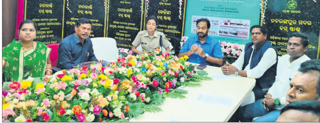
କାର୍ଯ୍ୟକ୍ରମରେ ଉପସ୍ଥିତ ମନ୍ତ୍ରୀ, ବିଧାୟକ ଓ ବିଭାଗୀୟ ଅଧିକାରୀମାନେ ।