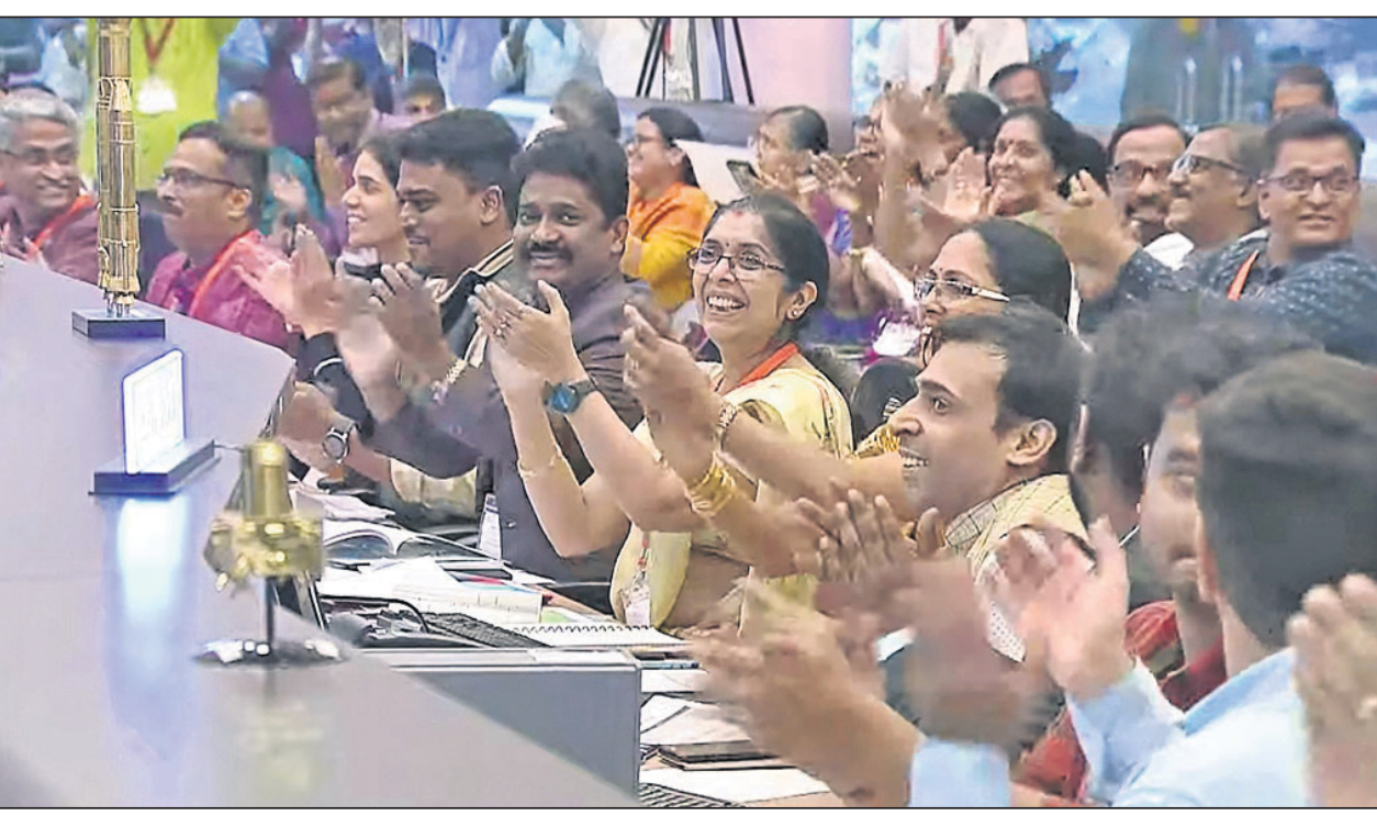
ବେଙ୍ଗାଲୁରୁରେ ଇସ୍ରୋ ପୁଖ୍ୟାଳୟରେ ଚନ୍ଦ୍ରଯାନ-୩ର ସଫଳତା ପରେ ଉତ୍ସାହରେ ଚଳିଥିବା ସମାବେଶ।