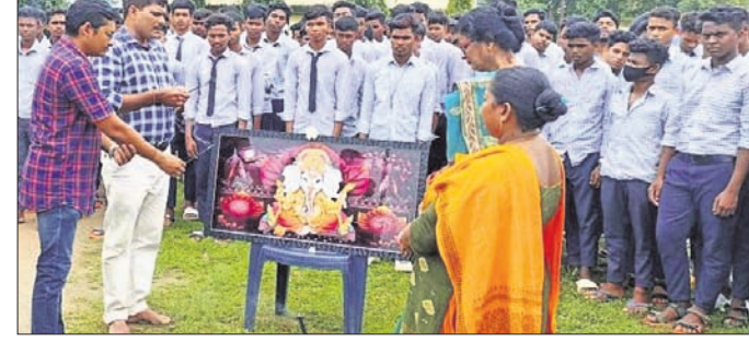
ପୂଜାର୍ଚ୍ଚନା କରାଯାଉଛି ।