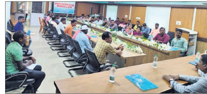
ବୈଠକରେ ବିଭାଗୀୟ ଉପସ୍ଥିତ ଅଧିକାରୀ । ଚିତ୍ରକୋଣ୍ଡା, ୨୩୮୮ (କ୍ଷୀରୋଦ ବେହେରା)

ମାଲକାନଗିରି ଜିଲ୍ଲା ଚିତ୍ରକୋଣ୍ଡା ବ୍ଲକ୍ ସଭାଗୃହରେ ପୋରୋବର୍ତ୍ତନ ଆନୁକୂଲ୍ୟରେ ଗ୍ଲୋବାଲ୍ ଗ୍ରାନ୍ଦ୍ ଗ୍ରାଣ୍ଟ୍ ସହାୟତାରେ ଅନୁତ୍ପନ୍ନୀୟାନ ସୁନାକର ପାଲଟି ଅଧ୍ୟକ୍ଷତା ଏବଂ ଚିତ୍ରକୋଣ୍ଡା ଏପିଓ ଉପସ୍ଥିତ ଚିରକ୍ଷିତ ସହଯୋଗରେ କର୍ମୀ ଲକ୍ଷ୍ମୀ । ସୂଚନାଯୋଗ୍ୟ, ଏହି ପ୍ରକଳ୍ପରେ ଆଖର୍ତ୍ତ କାମ ନାମରେ କିଛି ଅଧିକାରୀ ଓ କର୍ମଚାରୀ ଉପକୃତ ହେଉଥିବା ଏବଂ ବାହାର ଅଞ୍ଚଳର ଠିକାଦାର ନ ଆସି ଏଗ୍ରିମେଣ୍ଟ୍ ଅନ୍ୟ କେହି କରିବା, ଗୋଟିଏ କାମକୁ ୨ଥର କରାଯାଉଥିବା ଅଭିଯୋଗ ପରେ ତତ୍କାଳୀନ ପ୍ରକଳ୍ପ ମୁଖ୍ୟ ଓ ଉତ୍ତରା ଜଳବିଦ୍ୟୁତ୍ ପ୍ରକଳ୍ପ ଆଖର୍ତ୍ତ ବ୍ୟବସ୍ଥା ବନ୍ଦ କରିଦେଇଥିଲେ ।