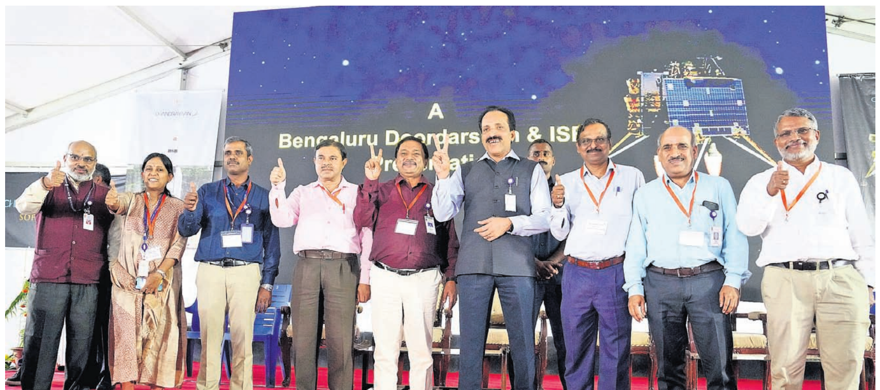
ଚନ୍ଦ୍ରର ସାଉଥ୍‌ପୋଲ୍‌ରେ ପହଞ୍ଚିବା ପରେ ଇସ୍ରୋ ମୁଖ୍ୟାଳୟର କଣ୍ଠେଇ ଭୂମିରେ ଚନ୍ଦ୍ରଯାନ-୩ର ପ୍ରମୁଖ ବୈଜ୍ଞାନିକମାନଙ୍କ ସହ ଇସ୍ରୋ ଅଧ୍ୟକ୍ଷ ଏସ୍. ସୋମନାଥ।

ଲ୍ୟାଣ୍ଡ୍ କରିବାରେ ସଫଳ ହେବା ସହ ୧୪୦ କୋଟି ଭାରତୀୟଙ୍କ ହୃଦୟରେ ଖୁସିର ଲହରୀ ଖେଳିଯାଇଛି। ଏହି ସଫଳତା ପରେ ବେଙ୍ଗାଲୁରୁରେ ଇସ୍ରୋ କମାଣ୍ଡ ସେଣ୍ଟରରେ ସେହି ସମୟରେ ଚନ୍ଦ୍ର ଯାନ-୩ର ସଫଳତା ପାଇଁ ଇସ୍ରୋ ଦେଶବାସୀଙ୍କୁ ଅଭିନନ୍ଦନ ଜଣାଇଛି। ଦକ୍ଷିଣ ମେରୁ ନିକଟରେ ଅବତରଣ କରିବାରେ ଭାରତ ପ୍ରଥମ ଦେଶ ହୋଇପାରିଛି। 'ଭାରତ, ମୁଁ ମୋ ଲକ୍ଷ୍ୟସ୍ଥଳରେ ପହଞ୍ଚିଲି ଏବଂ ତୁମେ ମଧ୍ୟ' ବୋଲି ଏହା ବାର୍ତ୍ତା ପଠାଇଛି।