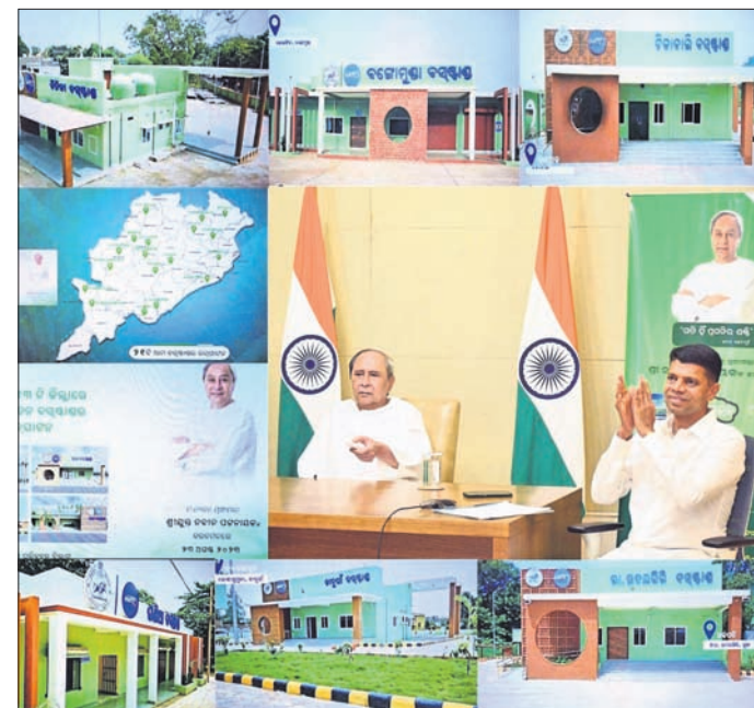
୨୧ ନୂଆ ବସ୍ତୁାଣ୍ଡର ଲୋକାର୍ପଣ କରୁଛନ୍ତି ମୁଖ୍ୟମନ୍ତ୍ରୀ ନବୀନ ପଟ୍ଟନାୟକ। ନିକଟରେ ଅଛନ୍ତି ୫-ଟି ସଚିବ ଭି.କେ. ପାଣ୍ଡେଆନ।