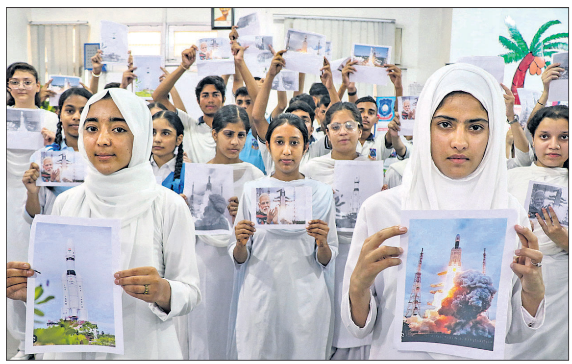
ଚନ୍ଦ୍ରଯାନ-୩ର ସଫଳ ଅବତରଣ ଉଦ୍ଦେଶ୍ୟରେ ଛାତ୍ରଛାତ୍ରୀଙ୍କ ସାମୂହିକ ପ୍ରାର୍ଥନା।