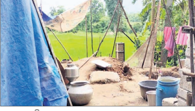
ସରକାରୀ ଜମିରେ ହୋଇଥିବା ଘର ।

ସଦର ପଞ୍ଚାୟତ ଅଧୀନରେ ଥିବା ୪୯୭ ହିତାଧିକାରୀଙ୍କୁ ପ୍ରଧାନମନ୍ତ୍ରୀ ଆବାସ ଯୋଜନାରେ ଘର ଯୋଗାଇ ଦିଆଯାଇଛି । ନିୟମ ଅନୁଯାୟୀ ପ୍ରଧାନମନ୍ତ୍ରୀ ଆବାସ ଯୋଜନାରେ ଗୃହ ପାଇବା ପାଇଁ ଯୋଗ୍ୟ ହିତାଧିକାରୀଙ୍କ ସମସ୍ତ ନିୟମ ସହିତ ବାସଗୃହ ଯୋଗାଇ ଦିଆଯାଇଥିବା ବେଳେ ସେଥିରୁ କୋଡ଼ିଙ୍ଗା ବ୍ଲକ୍ ହିତାଧିକାରୀଙ୍କୁ ଯୋଗ୍ୟ ବିବେଚିତ କରି ଆବାସ ଯୋଜନା ଖର୍ଚ୍ଚ ଅନ୍ତର ଦିଆଯାଉଛି । ଯେଉଁ ହିତାଧିକାରୀଙ୍କୁ ଅଧିକାରୀମାନେ ଚିହ୍ନଟ କରିଛନ୍ତି ସେମାନଙ୍କ ମଧ୍ୟରେ କେତେକଙ୍କର ନିକଟ ଘରବାଡ଼ି ଥିବା ବେଳେ ସେମାନେ ସରକାରଙ୍କ ତରଫରୁ ପାଇଥିବା ପ୍ରଧାନମନ୍ତ୍ରୀ ଆବାସ ଯୋଜନାରେ