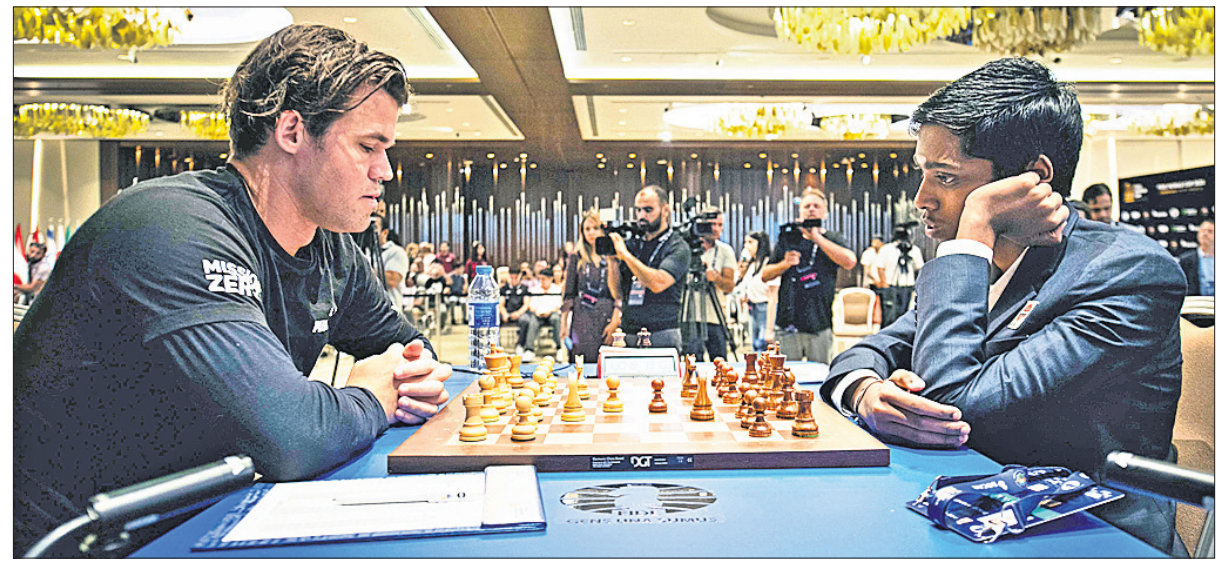
ଫିଡେ ଚେସ୍ ବିଶ୍ୱକପ୍ରେ ଫାଇନାଲର ଚାଲଚଳୁଥିବା ଅବସରରେ ମାଗ୍ସ୍ କାର୍ଲସେନ ଓ ଆର୍. ପ୍ରଜ୍ଞାନନ୍ଦ।