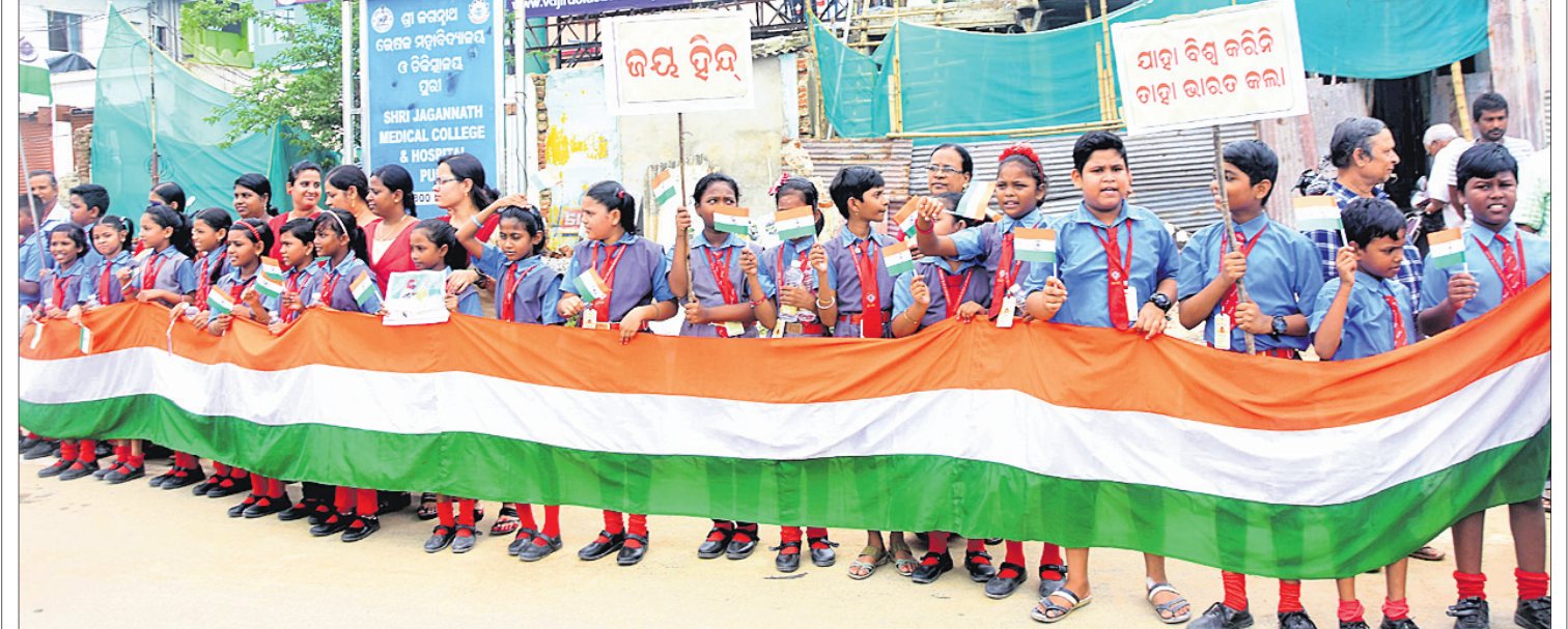
ଚନ୍ଦ୍ରସ୍ଥାନରେ ଚନ୍ଦ୍ରଯାନ-୩ର ସଫଳ ଅବତରଣ ଏବଂ ଚନ୍ଦ୍ର ଯତ୍ନ ଭାବେ ଉତ୍ସାହ ପ୍ରଦର୍ଶନ ପରିବେଷ୍ଟରେ ଗୁରୁବାର ପୂର୍ବା ଅଠରନକାଠାରେ ଭଗବତୀ ବିଦ୍ୟା ନିକେତନର ଛାତ୍ରଛାତ୍ରୀମାନେ ଏକ ମାନବଶୃଙ୍ଖଳ ମାଧ୍ୟମରେ ଭସ୍ତ୍ରା ବୈଜ୍ଞାନିକମାନଙ୍କୁ ଅଭିନନ୍ଦନ ଜ୍ଞାପନ କରୁଛନ୍ତି।

ବୋରିଗୁମ୍ମା, ୨୪।୮ (ବିକାଶ ସାହୁ) ବାହାର କରିପାରି ନ ଥିଲେ। କିଛି ସମୟ ମଧ୍ୟରେ ବସ୍ଟି ଜଳିଗଲା ଲାଗିଥିଲା। ଗୁମାସ୍ତା ଲୋକେ ଏନେଇ ଦମକ କର୍ମଚାରୀଙ୍କୁ ଜଣାଇବାକୁ କର୍ମଚାରୀମାନେ ପହଞ୍ଚି ନିଆଁକୁ ଆଉଁଟ କରିଥିଲେ। ବସ୍ଟି ଯାତ୍ରୀମାନଙ୍କୁ ଅନ୍ୟ ଏକ ବସ୍ରେ କଳାହାଣ୍ଡି ଜିଲ୍ଲା ସିନାପାଲିକୁ ଠାଆଯାଇଥିଲା। ଏପରି ଅଭିକାନ୍ଦ କାରଣ ଜଣାପଡିନାହିଁ। ବସ୍ରେ ନିଆଁ ଲାଗିଥିବା ଖବରପାଇ ବୋରିଗୁମ୍ମା ଏସ୍‌ଆଇ ରତନା ମାତକାମା ଓ ଏସ୍‌ଆଇ ବସନ୍ତ ନାମ ଘଟଣା ସ୍ଥଳରେ ପହଞ୍ଚିଥିଲେ। ଏନେଇ ବସ୍ କର୍ମଚାରୀ ଥାନାରେ ଏକ ଲିଖିତ ଅଭିଯୋଗ କରିଛନ୍ତି।