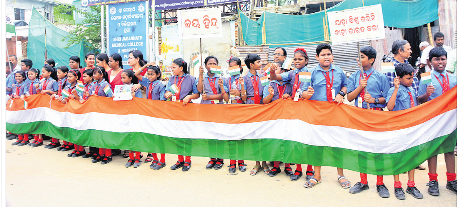
ଚନ୍ଦ୍ରପୁଷ୍ପରେ ଚନ୍ଦ୍ରଯାନ-୩ର ସଫଳ ଅବତରଣ ଏବଂ ଚନ୍ଦ୍ର ଚନ୍ଦ୍ର ଭାବେ ବିଶ୍ୱରେ ଭାରତର ପରାକାଷ୍ଠା ପ୍ରଦର୍ଶନ ପରିପ୍ରେକ୍ଷାରେ ଗୁରୁବାର ପୁରୀ ଅଠରନକାଠାରେ ଭଗବତୀ ବିଦ୍ୟା ନିକେତନର ଛାତ୍ରଛାତ୍ରୀମାନେ ଏକ ମାନବଶୃଙ୍ଖଳ ମାଧ୍ୟମରେ ଲକ୍ଷ୍ମୀ ଦେବିଙ୍କୁ ନିକାମନା କରି ଅଭିନନ୍ଦନ ଜଣାଉଛନ୍ତି ।