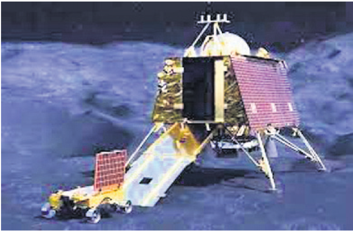
ଲ୍ୟାଣ୍ଡର ବିକଳରୁ ରୋଭର ପ୍ରଞ୍ଚନ ବାହାରିବାର ପ୍ରତୀକାତ୍ମକ ଚିତ୍ର।

ଭାରତର ଚନ୍ଦ୍ରଯାନ-୩ ରୁଧିର ସମ୍ପାନରେ ଚନ୍ଦ୍ର ଦକ୍ଷିଣ ମେରୁରେ ସଫଳତାର ସହ ସଫ୍ଟ ଲ୍ୟାଣ୍ଡିଂ କରିବା ପୂର୍ବରୁ ଅନେକ ସମସ୍ୟାର ସମ୍ମୁଖୀନ ହୋଇଥିଲା। ଦକ୍ଷିଣ ମେରୁରେ ମହାକାଶ ଯାନ ଅବତରଣ କରାଯିବାର ଭାରତ ପ୍ରଥମ ଦେଶ ଭାବେ ଇତିହାସ ସୃଷ୍ଟି କରିଛି। ତେବେ ଭାରତୀୟ ମହାକାଶ ଗବେଷଣା ସଂଗଠନ (ଇସ୍ରୋ) କ'ଣ ପାଇଁ ଦକ୍ଷିଣ ମେରୁ ବାଛିଲା ସେ ନେଇ ଏହାର ମୁଖ୍ୟ ଏସ୍. ସୋମନାଥ ସ୍ପଷ୍ଟ କରିଛନ୍ତି। ଚନ୍ଦ୍ରଯାନ-୨ ମଧ୍ୟତନ୍ତ୍ର ଦକ୍ଷିଣ ମେରୁରେ ଅବତରଣ ଉଦ୍ୟମ କରି ବିଫଳ ହୋଇଥିଲା। ଚନ୍ଦ୍ରଯାନ-୩ର ଦକ୍ଷିଣ ମେରୁ ଅବତରଣ ସ୍ୱତନ୍ତ୍ର ଥିଲା, କାରଣ ଏପର୍ଯ୍ୟନ୍ତ କେହି ଉଚ୍ଚ ପାର୍ଶ୍ୱରେ ସଫ୍ଟ ଲ୍ୟାଣ୍ଡିଂ କରିନାହାନ୍ତି। ଚନ୍ଦ୍ରରେ ପାଣି ଓ ବରଫ ହେଉଛି ଏହାର ସବୁଠୁ ମୂଲ୍ୟବାନ ସମ୍ପଦ। ଦକ୍ଷିଣ ମେରୁରେ ପ୍ରଚୁର ପାଣି ଓ ଖଣିଜ ପଦାର୍ଥର ସମ୍ପାନ ମିଳିବା ନେଇ ଇସ୍ରୋ ଆଶାବାଦୀ ରହିଛି। ସେଥିପାଇଁ ଦକ୍ଷିଣ ମେରୁରେ ଲ୍ୟାଣ୍ଡିଂ ପାଇଁ ନିଆଯାଇଥିଲା ବୋଲି ସୋମନାଥ କହିଛନ୍ତି। ଉଭୟ ଲ୍ୟାଣ୍ଡିଂ ବିକଳ ଏବଂ ରୋଭର ପ୍ରଞ୍ଚନ ଚନ୍ଦ୍ରପୃଷ୍ଠରେ ୧୪ ଦିନ କାର୍ଯ୍ୟକ୍ଷମ ରହି ଏହାର ଅନୁସନ୍ଧାନ କରିବେ।