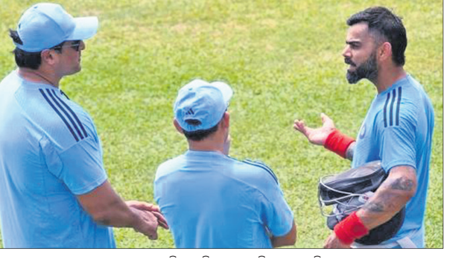
ଗୁରୁବାର ଅନୁଷ୍ଠିତ ଟ୍ରେନିଂ କ୍ୟାମ୍ପରେ ବିରାଟ କୋହଲି।

ଏସିଆ କପ୍ କ୍ରିକେଟ ୨୦୨୩ ପାଇଁ ପ୍ରସ୍ତୁତି ଆରମ୍ଭ କରିଛି ଭାରତୀୟ କ୍ରିକେଟ ଦଳ। ଅଧିନାୟକ ରୋହିତ ଶର୍ମାଙ୍କ ଅଧୀନରେ ଭାରତୀୟ ଦଳର ସମସ୍ତ ଖେଳାଳି କଠିନ ଅଭ୍ୟାସ କରିବା ସହିତ ଯୋ ଯୋ ଚେଷ୍ଟାରେ ଅଂଶଗ୍ରହଣ କରିଥିଲେ। ଭୋଜାଲୁରୁ ଆଲୁରସ୍ଥିତ କେସିଏସ୍‌ଏସ୍ ଷ୍ଟାଡ଼ିୟମରେ ୬ ଦିନିଆ କ୍ୟାମ୍ପ ଗୁରୁବାରଠାରୁ ଆରମ୍ଭ ହୋଇଛି। ଗୁରୁବାରର ଯୋ ଯୋ ଚେଷ୍ଟାରେ ବିରାଟ କୋହଲି ସର୍ବାଧିକ ୧୨.୨ ସଏଣ୍ଟ ଷ୍ଟୋର କରିଥିଲେ। ବିସିଆଇ ପକ୍ଷରୁ ୧୬.୫ କୁ ପାଏ ମାର୍କ ରଖାଯାଇଥିଲା। ବିରାଟଙ୍କ ବ୍ୟତୀତ ଅଧିନାୟକ ରୋହିତ ଶର୍ମା ଓ ଉପ ଅଧିନାୟକ ହାର୍ଦ୍ଦିକ ପାଣ୍ଡ୍ୟା ମଧ୍ୟ ଯୋ ଯୋ ଚେଷ୍ଟାରେ ଭାଗ ନେବା ସହିତ ପାଏ କରିଥିଲେ। ଯୋ ଯୋ ଚେଷ୍ଟା ସମାପନ ହୋଇଥିବା ବେଳେ ଖୁବ୍ ଶୀଘ୍ର ବିସିଆଇ ନିକଟକୁ ଏହାର ରିପୋର୍ଟ ପ୍ରେରଣ କରାଯିବ। ଅନ୍ୟ ଖେଳାଳିମାନେ ଏହି ଦଳରେ ଯୋଗ ଦେଇଥିବା ବେଳେ ସମସ୍ତଙ୍କୁ ଚୁପ୍, ପ୍ରସିଦ୍ଧ କ୍ରୀଡ଼ା, ସଞ୍ଜୁ ସାମସନ୍ ଓ ଡିଲକ ବର୍ମା ଶୁଭବାଚନ ଦେଇ ସହିତ ଯୋଗ