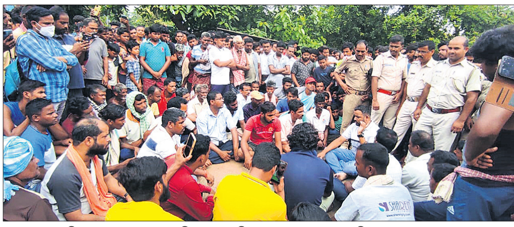
ରାସ୍ତାରୋକ୍ଷ କରିଥିବା ଉତ୍ତରାଧିକାରୀ ଲୋକଙ୍କୁ ବନ ବିଭାଗ ଓ ପୋଲିସ୍ ଅଧିକାରୀ ବୁଝାଶୁଣା କରୁଛନ୍ତି।