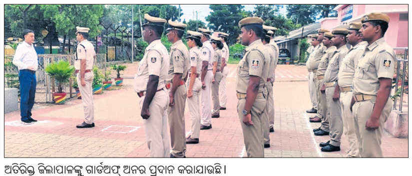
ଅତିରିକ୍ତ ଜିଲ୍ଲାପାଳଙ୍କୁ ଗାଡ଼ି ଅଫ ଅନର ପ୍ରଦାନ କରାଯାଇଛି।