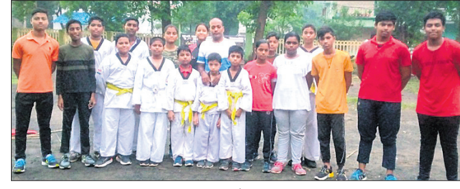
ରାଜ୍ୟସ୍ତରୀୟ ସମର କଳା ପ୍ରତିଯୋଗିତା ପାଇଁ ଉପଯୋଗୀ ଅନୁଗୋଳର ପ୍ରତିଯୋଗୀ।

କରିବା ପାଇଁ ଅନୁଗୋଳ ଜିଲାରୁ ୧୫ ଜଣ ପ୍ରତିଯୋଗୀ ମନୋନୀତ ହୋଇଛନ୍ତି। ଏହି ପ୍ରତିଯୋଗୀମାନଙ୍କ ସହ ରାଜ୍ୟ ସମର କଳା ସହ ଅନୁଷ୍ଠିତ ହେବ ୧୮ଟି ରାଜ୍ୟସ୍ତରୀୟ ସମର କଳା ପ୍ରତିଯୋଗିତା। ଏହି ପ୍ରତିଯୋଗିତାରେ ଅଂଶ ଗ୍ରହଣ କରିବେ ବୋଲି ସୂଚନା ମିଳିଛି।