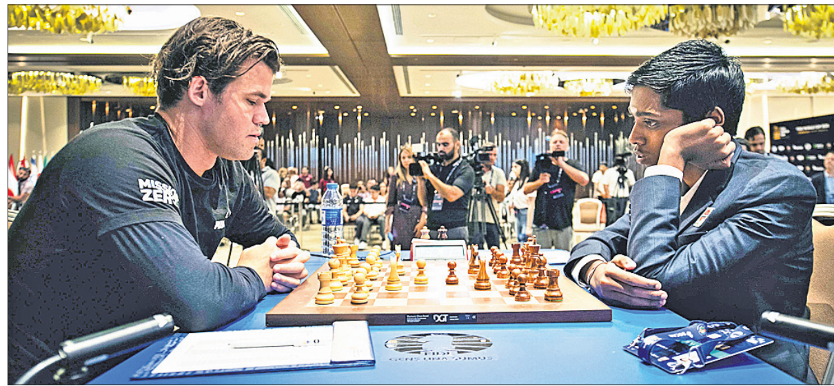
ଫିଡେ ଚେସ୍ ବିଶ୍ୱକପ୍‌ର ଫାଇନାଲ୍‌ର ଚାଲନ୍ତୁକର ପୂଜାବିଳା ଅବସରରେ ମାଗ୍‌ସ କାର୍ଲସେନ ଓ ଆର୍. ପ୍ରଜ୍ଞାନନ୍ଦ ।