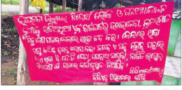
ପୁନିଗୁଡ଼ା ଥାନା ରାମନାକୁପୁଲି ଛକରେ ମାଓବାଦୀମାନେ ଲଗାଇଥିବା ବ୍ୟାନର ।

ରାୟଗଡ଼ା ଜିଲ୍ଲା କାଶୀପୁର ବ୍ଲକ ଅନ୍ତର୍ଗତ ପୁରୁଣା ପଞ୍ଚାୟତର ବିଜିମାଳ ଖଣି ଖନନକୁ ନେଇ ମୈତ୍ରୀ କମ୍ପାନୀ ଓ ଅଞ୍ଚଳବାସୀଙ୍କ ମଧ୍ୟରେ ବିବାଦ ଘନେଇବାରେ ଲାଗିଛି । ମୈତ୍ରୀ କମ୍ପାନୀ କର୍ତ୍ତୃପକ୍ଷଙ୍କ ନିର୍ଦ୍ଦେଶରେ ପୋଲିସ ଅଞ୍ଚଳବାସୀଙ୍କୁ ନିର୍ଯାତନା ଦେଉଥିବା ବିଜିମାଳ ଖଣି ପ୍ରଭାବିତ ଅଞ୍ଚଳବାସୀ ଅଭିଯୋଗ କରିଛନ୍ତି । ଅପରପକ୍ଷେ ମୈତ୍ରୀ କମ୍ପାନୀ କର୍ତ୍ତୃପକ୍ଷ ଏବଂ ପୋଲିସ ଗୁମାସ୍ତା ଆଦିବାସୀଙ୍କ ଉପରେ କରୁଥିବା ଜୁଲମକୁ ମାଓବାଦୀ ସଙ୍ଗଠନ ବୃତ୍ତ ବିରୋଧ କରିଛନ୍ତି । ଏହାର ପ୍ରତିବାଦକରି ବାଲୁନା ମାଓବାଦୀ କମିଟି ପକ୍ଷରୁ ପୁନିଗୁଡ଼ା ବ୍ଲକ ରାମନାକୁପୁଲି ଛକ ନିକଟରେ ମାଓବାଦୀମାନେ ବ୍ୟାନର ମାରିଥିବା ଦେଖିବାକୁ ମିଳିଛି । ରାୟଗଡ଼ା ଜିଲ୍ଲାରେ ପୋଲିସ ଜନ ଆନ୍ଦୋଳନକାରୀଙ୍କୁ ରାତିଆଧିଆ