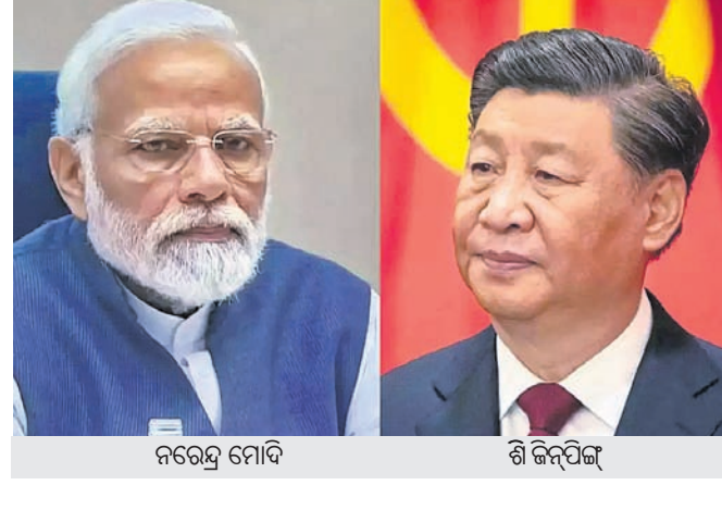
ନରେନ୍ଦ୍ର ମୋଦି ଶି ଜିନ୍‌ପିଙ୍ଗ୍

ଆଲୋଚନା କରିଥିଲେ। ପୂର୍ବରୁ ବ୍ରିକ୍ସ ବିକଳନେତୃ ଫୋରମ୍ ବୈଠକରେ ଦୁଇ ନେତା ଭାରତେବେ ବୋଲି ଆଶା କରାଯାଉଥିଲା। ପ୍ରଧାନମନ୍ତ୍ରୀ ମୋଦି ସେଥିରେ ଉଦ୍‌ବୋଧନ ଦେଇଥିବାବେଳେ ଜିନ୍‌ପିଙ୍ଗ୍ ବୈଠକରୁ ଦୂରରେ ରହିଥିଲେ। ତାଙ୍କ ପରିବର୍ତ୍ତେ ଚୀନର ବାଣିଜ୍ୟ ମନ୍ତ୍ରୀ ୱାଙ୍ଗ ଡେଂଝାଂଝା ବୈଠକରେ ଉପସ୍ଥିତ ଥିଲେ। ଏହା ପୂର୍ବରୁ ୨୦୨୨ରେ ଉଚ୍ଚବେକିମ୍ପାନର ସମରକ୍ରମରେ ଅନୁଷ୍ଠିତ ସାମ୍ବନ୍ଧ ସହଯୋଗ ସଂଗଠନ (ଏସ୍‌ସିଓ) ସମିତ୍ ଅବସରରେ ମୋଦି ଏବଂ ଜିନ୍‌ପିଙ୍ଗ୍ ଏକାଠି ହୋଇଥିଲେ ମଧ୍ୟ ସେମାନଙ୍କ ମଧ୍ୟରେ ଦ୍ୱିପକ୍ଷିତ ଆଲୋଚନା ହୋଇ ନ ଥିଲା।