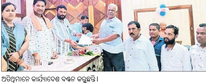
ଅତିଥିମାନେ କାର୍ଯ୍ୟକ୍ରମ ବ୍ୟବସ୍ଥା କରୁଛନ୍ତି।

ପାଇଁ କାର୍ଯ୍ୟକ୍ରମ ବ୍ୟବସ୍ଥା କରାଯିବ। ସଭାପତି କାର୍ଯ୍ୟକ୍ରମ ପରିଚାଳନା କରିଥିଲେ। ବିଭିନ୍ନ ଧାର୍ଯ୍ୟ ଅନୁଷ୍ଠାନର ପରିଚାଳନା କମିଟି ସଦସ୍ୟଗଣ ଉପସ୍ଥିତ ଥିଲେ।