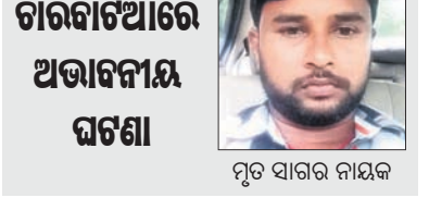
ଗରିବାଟିଆରେ ଅଭାବନୀୟ ଘଟଣା

ଭରଣ୍ୟ ଭୋଇ କରାଯାଇଥିବା ଲଘୁଚାପ ପରିସରରେ ଧାରଣା ଦେଇଛନ୍ତି।