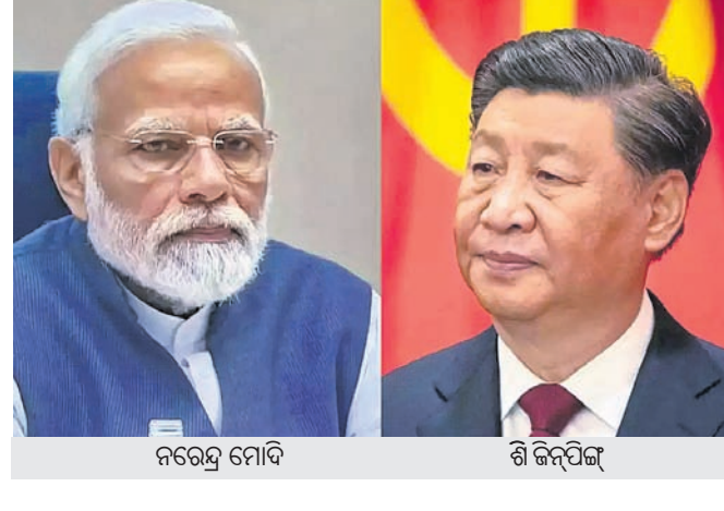
ନରେନ୍ଦ୍ର ମୋଦି ଶି ଜିନ୍ପିଙ୍ଗ୍