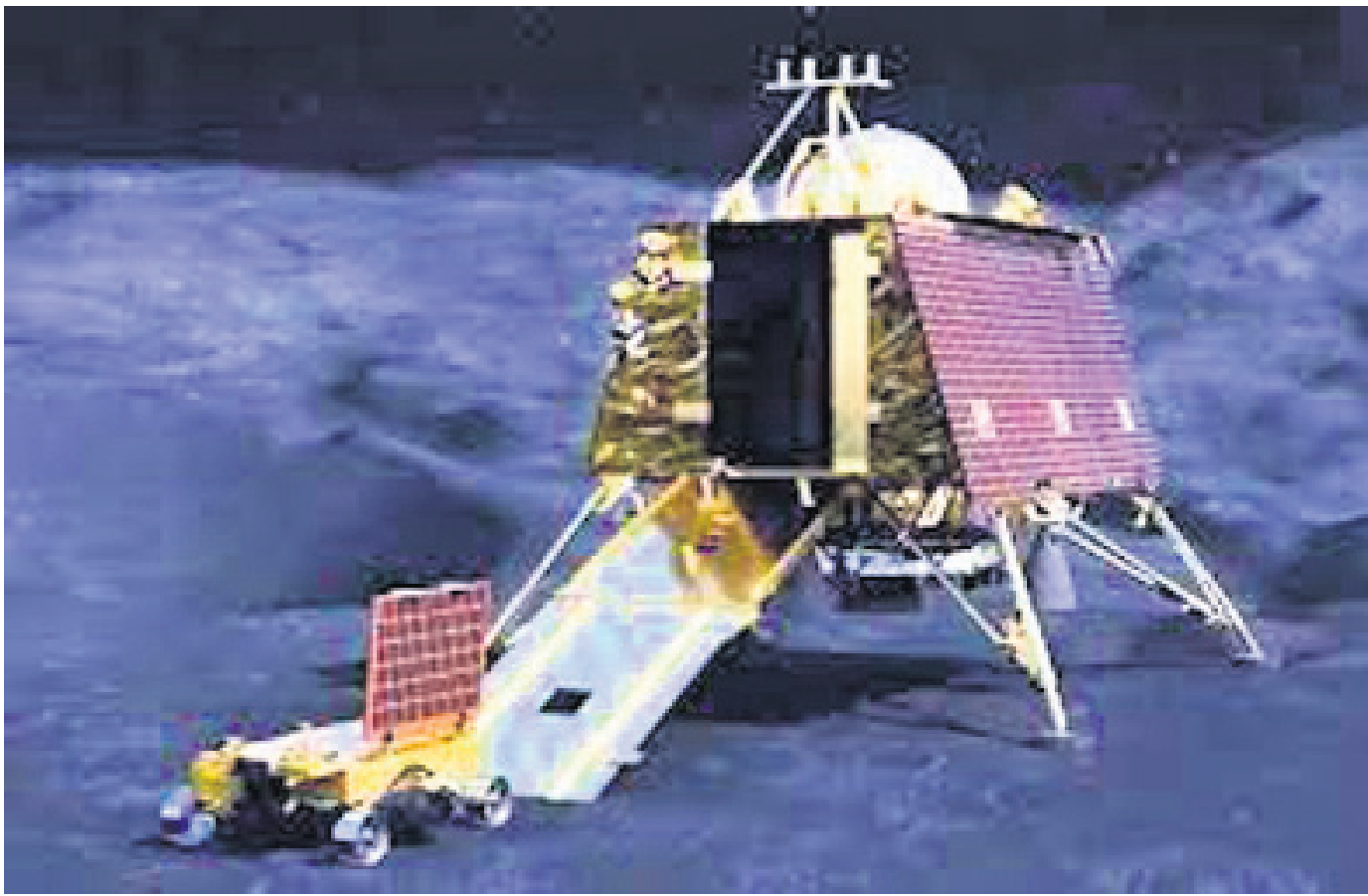
ଲ୍ୟାଣ୍ଡିଂ ବିକଳରୁ ରୋଭର ପ୍ରାଣୀ ବାହାରିବାର ପ୍ରତୀକାତ୍ମକ ଚିତ୍ର।

ଭାରତର ଚନ୍ଦ୍ରଯାନ-୩ ରୁଧିର ସମ୍ପାନରେ ଚନ୍ଦ୍ରର ଦକ୍ଷିଣ ମେରୁରେ ସଫଳତାର ସହ ସଫ୍ଟ ଲ୍ୟାଣ୍ଡିଂ କରିବା ପୂର୍ବରୁ ଅନେକ ସମସ୍ୟାର ସମ୍ମୁଖୀନ ହୋଇଥିଲା। ଦକ୍ଷିଣ ମେରୁରେ ମହାକାଶ ଯାନ ଅବତରଣ କରାଯିବାରେ ଭାରତ ପ୍ରଥମ ଦେଶ ଭାବେ ଇତିହାସ ସୃଷ୍ଟି କରିଛି। ତେବେ ଭାରତୀୟ ମହାକାଶ ଗବେଷଣା ସଂଗଠନ (ଇସ୍ରୋ) କ'ଣ ପାଇଁ ଦକ୍ଷିଣ ମେରୁ ବାଛିଲା ସେ ନେଇ ଏହାର ମୁଖ୍ୟ ଏସ୍. ସୋମନାଥ ସ୍ପଷ୍ଟ କରିଛନ୍ତି। ଚନ୍ଦ୍ରଯାନ-୨ ମଧ୍ୟତନ୍ତ୍ରର ଦକ୍ଷିଣ ମେରୁରେ ଅବତରଣ ଉଦ୍ୟମ କରି ବିଫଳ ହୋଇଥିଲା। ଚନ୍ଦ୍ରଯାନ-୩ର ଦକ୍ଷିଣ ମେରୁ ଅବତରଣ ସ୍ୱତନ୍ତ୍ର ଥିଲା, କାରଣ ଏପର୍ଯ୍ୟନ୍ତ କେହି ଉଚ୍ଚ ପାର୍ଶ୍ୱରେ ସଫ୍ଟ ଲ୍ୟାଣ୍ଡିଂ କରିନାହାନ୍ତି। ଚନ୍ଦ୍ରରେ ପାଣି ଓ ବରଫ ହେଉଛି ଏହାର ସବୁଠୁ ମୂଲ୍ୟବାନ ସମ୍ପଦ। ଦକ୍ଷିଣ ମେରୁରେ ପ୍ରଚୁର ପାଣି ଓ ଖଣିଜ ପଦାର୍ଥର ସମ୍ପାନ ମିଳିବା ନେଇ ଇସ୍ରୋ ଆଶାବାଦୀ ରହିଛି। ସେଥିପାଇଁ ଦକ୍ଷିଣ ମେରୁରେ ଲ୍ୟାଣ୍ଡିଂ ପାଇଁ ନିଆଯାଇଥିଲା ବୋଲି ସୋମନାଥ କହିଛନ୍ତି। ଉଭୟ ଲ୍ୟାଣ୍ଡିଂ ବିକଳ ଏବଂ ରୋଭର ପ୍ରାଣୀ ଚନ୍ଦ୍ରପୃଷ୍ଠରେ ୧୪ ଦିନ କାର୍ଯ୍ୟକ୍ଷମ ରହି ଏହାର ଅନୁସନ୍ଧାନ କରିବେ।