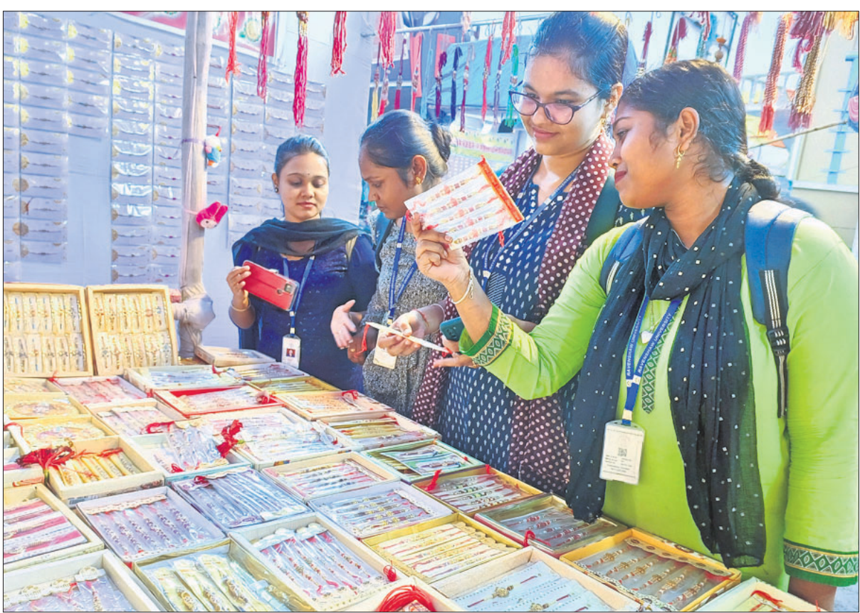
ପାଖେଇ ଆସୁଛି ରାଜ୍ୟ ପୂର୍ଣ୍ଣମା: କଟକ କଲେଜ ଛକସ୍ଥିତ ଏକ ସ୍କୁଲରୁ ଗୁରୁବାର ଯୁବତୀମାନେ ରାଜ୍ୟ କିଣୁଛନ୍ତି।