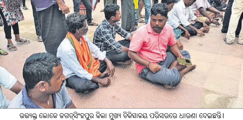
ଭରଣ୍ୟ ଭୋଇ କରାଯାଇଥିବା ଲଘୁଚାପ ପରିସରରେ ଧାରଣା ଦେଇଛନ୍ତି।

କରାଯାଇଥିବା ଲଘୁଚାପ ପରିସରରେ ଧାରଣା ଦେଇଛନ୍ତି।