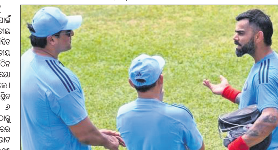
ରୁକୁବାର ଅନୁଷ୍ଠିତ ଟ୍ରେନିଂ କ୍ୟାମ୍ପରେ ବିରାଟ କୋହଲି ।

ଦେବେ । ଆୟଲ୍‌ଲ୍ୟାଣ୍ଡରେ ଟି୨୦ ସିରିଜ୍ ଖେଳି ଏହି ୪ ଖେଳାଳି ପ୍ରତ୍ୟାବର୍ତ୍ତନ କରିବା ପରେ କଣ୍ଠିଶନିଂ କ୍ୟାମ୍ପରେ ଯୋଗ ଦେବେ । କ୍ୟାମ୍ପର ପ୍ରଥମ ଦିନରେ ଅଧିକାରୀ ଆକ୍ଟିଭିଟି ଇନିତାର ରହିଥିବା ବେଳେ ଯୋ ଯୋ ଚେଷ୍ଟା ପରେ ଆଉଟଡୋର ଆକ୍ଟିଭିଟି ମଧ୍ୟ କରାଯାଇଥିଲା । ତେବେ ଆୟଲ୍‌ଲ୍ୟାଣ୍ଡ ପ୍ରତ୍ୟାବର୍ତ୍ତନ କରିଥିବା ଖେଳାଳିଙ୍କୁ ଯୋ ଯୋ ଚେଷ୍ଟାରେ ସାମିଲ କରାଯିବ ନାହିଁ । ଏହି କ୍ୟାମ୍ପରେ ଖେଳାଳିମାନଙ୍କୁ ବିଭିନ୍ନ ମେଡିକାଲ ଚେଷ୍ଟାରେ ସାମିଲ କରିବାକୁ ପଡିବ । ଲିପିଡ୍ ପ୍ରୋଫାଇଲ, ବ୍ଲୁଡ୍ ପ୍ଲୁଗାର, ଯୁରିକ୍ ଏସିଡ୍, କ୍ୟାଲସିୟମ୍, ଭିଟାମିନ୍ ବି୧୨ ଓ ଡି, କ୍ରୋନିନ୍, ଚେଷ୍ଟାକ୍ଷେତ୍ର ଓ ଡେକା ଚେଷ୍ଟା ସମ୍ପନ୍ନ କରାଯିବ । ଆଉଟଡୋର ଖେଳାଳିମାନଙ୍କ ମଧ୍ୟରେ ମ୍ୟାଟ୍ କରାଯିବ । ବ୍ୟାଟିଂ କୋର୍ସ୍ ବିଜୁରା ଗାଠୋର ଓ ମୁଖ୍ୟ କୋର୍ସ୍ ରାହୁଲ ଟ୍ରାଭିଡ୍ ଏହି ପ୍ରଦର୍ଶନରେ ସମାପ୍ତ କରିବେ । ଏସିଆ କପ୍ ଦଳରେ ସ୍ଥାନ