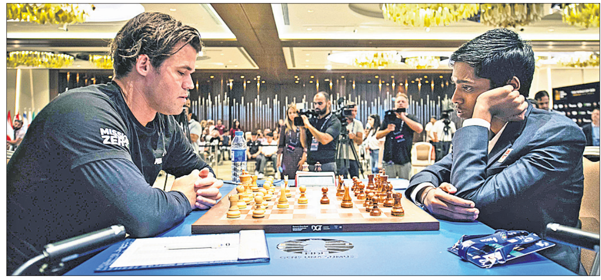
ଫିଡେ ଚେସ୍ ବିଶ୍ୱକପ୍ରେ ଫାଇନାଲର ଚାଲନ୍ତେକର ପୂଜାବିଳା ଅବସରରେ ମାଗ୍ସ କାଲିସେନ ଓ ଆର୍. ପ୍ରଜ୍ଞାନନ୍ଦ।