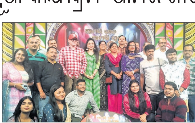
କାର୍ଯ୍ୟକ୍ରମରେ ଅଂଶଗ୍ରହଣ କରିଥିବା କଳାକାରଙ୍କ ସହ ଅତିଥି। ସଙ୍ଗୀତ ପରିବେଷଣ କରିଥିଲେ।