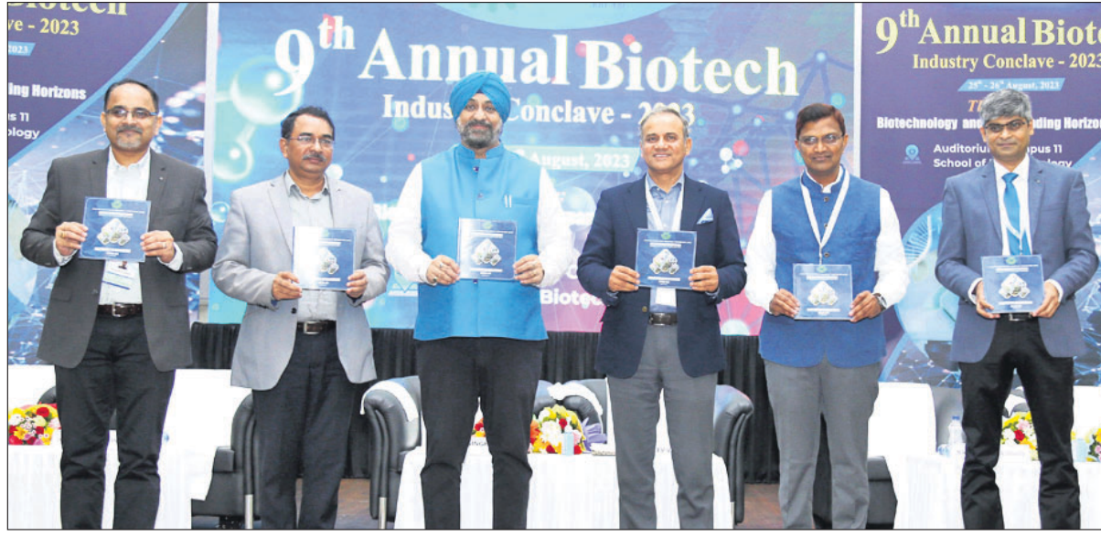
ବାୟୋଟେକ୍ ଶିଳ୍ପ ସମାବେଶର ଉଦ୍‌ଘାଟନା କାର୍ଯ୍ୟକ୍ରମରେ ଯୋଗଦେଇଥିବା ଅତିଥିମାନେ।