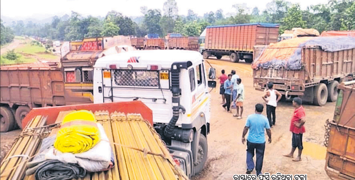
ରାସ୍ତାରେ ଫସି ରହିଥିବା ଟ୍ରକ୍!

କେନ୍ଦୁଝର/ଡେଲକୋଇ, ୨୫୮୮ (ନବରଂଗ ଚନ୍ଦ୍ର ପଟ୍ଟନାୟକ/ରଞ୍ଜିତ ବିଶ୍ୱାଳ)