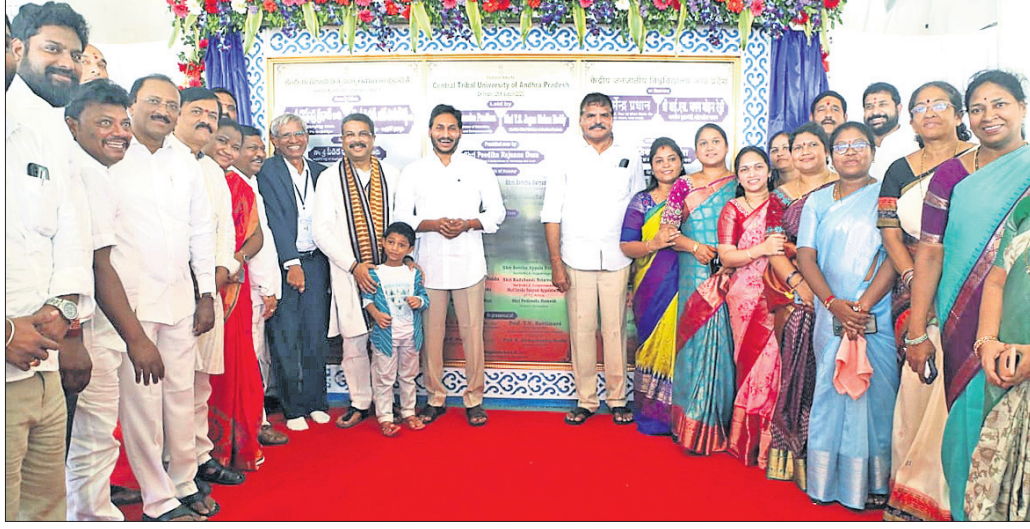
‘କେନ୍ଦ୍ରୀୟ ଜନଜାତି ବିଶ୍ୱବିଦ୍ୟାଳୟ’ ଶିଳାମୟାସ କାର୍ଯ୍ୟକ୍ରମରେ କେନ୍ଦ୍ର ଶିକ୍ଷାମନ୍ତ୍ରୀ ଧର୍ମେନ୍ଦ୍ର ପ୍ରଧାନ, ଆନ୍ତ୍ରପ୍ରଦେଶ ମୁଖ୍ୟମନ୍ତ୍ରୀ ଜଗନମୋହନ ରେଡ୍ଡୀ ଓ ଅନ୍ୟମାନେ।