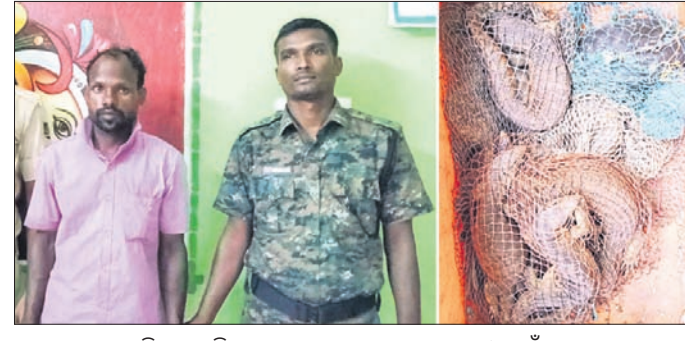
ଗିରଫ ଅଭିଯୁକ୍ତ ସହ ଜବତ ଗୋଧୂ, ଡାହୁକ ଓ କଇଁଛ।

ଶିକ୍ଷା-ଭ୍ରମଣ(ଏକ୍ସକ୍ୟୁସନ ଟୁର) ଓ ଅନ୍ୟାନ୍ୟ କାର୍ଯ୍ୟକ୍ରମ ପାଇଁ ପୁରାତନ ଛାତ୍ରାଛାତ୍ର ଓ ଅଭିଭାବକଙ୍କ ସହଯୋଗ ଦିଆଯିବାକୁ ବୈଠକରେ ନିଷ୍ପତ୍ତି ହୋଇଛି। ‘ମୋ ସ୍କୁଲ୍’ର ଆଉ ଦୁଇଟି ନୂତନ କାର୍ଯ୍ୟକ୍ରମକୁ ବୈଠକରେ ଅନୁମୋଦନ ମିଳିଛି। ଆକାଶ୍ୟ ପାଠ୍ୟକ୍ରମ ‘ଜିଜ୍ଞାସା’ କୁ ଅଧୀନରେ ଜୈବବିବିଧତା ଶିକ୍ଷା ପାଇଁ ନୟନକାନନ ପ୍ରାଣୀ ଉଦ୍ୟାନ କର୍ତ୍ତୃପକ୍ଷ ଓ ପାଠ୍ୟକ୍ରମ ପ୍ରଚଳନ ହୋଇଛି। ପାଠ୍ୟକ୍ରମ ଅନୁସାରେ ବିଦ୍ୟାଳୟରେ କୁଟ୍ ବ୍ୟବସ୍ଥା କରିବାରେ ବିଭିନ୍ନ ଶିକ୍ଷା ଦିଆଯିବ। ବିଦ୍ୟାଳୟସ୍ତରରେ ୪ଟି କୁଟ୍ (କ୍ରୀଡ଼ାଞ୍ଚଳ, କୌଶଳ, ସାହିତ୍ୟ ସୃଜନ, ଜିଜ୍ଞାସା)ର ପୁରସ୍କାର ସମ୍ପର୍କିତ ସଚେତନତା କାର୍ଯ୍ୟକ୍ରମ ଅନୁଷ୍ଠିତ ହେବ। ଏଥିରେ ବିଦ୍ୟାଳୟ ପରିସର ବାହାରେ ହେବାକୁ ଥିବା ବିଭିନ୍ନ