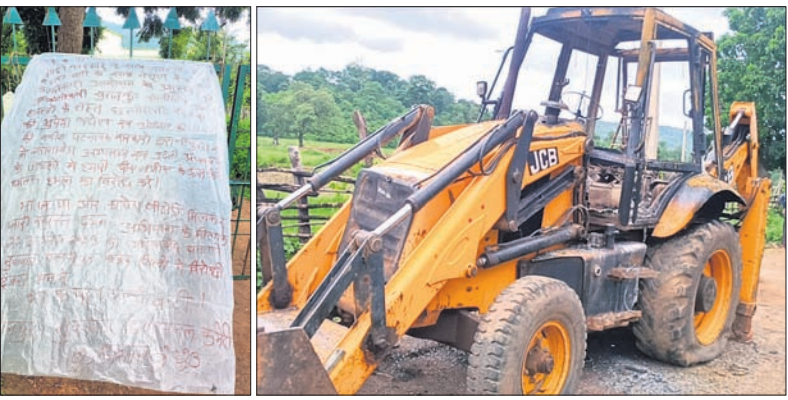
ନୂଆପଡ଼ା, ୨୫୮୮ (ମକାରୁ ବେମାଲ)

ଅଭୟାରଣ୍ୟ ଓ ଛତିଶଗଡ଼ ଉପକା ଅଭୟାରଣ୍ୟ ଭିତରେ ବିପୁଳ ଆନ୍ଦୋଳନକୁ ହତାହତା ପାଇଁ ବିରୋଧ କରୁଛନ୍ତି। ଆମର ପିଲାଲିପି ଉପରେ କାରି କରିଥିବା ଦମନ ଲାଜକୁ ବିରୋଧ କରି ଆଗଷ୍ଟ ୨୫କୁ ଛତିଶଗଡ଼ର ଗରିଆବନ୍ଧ, ଧମଡ଼ରା, କାଙ୍କୋର ଜିଲ୍ଲା ଏବଂ ଓଡ଼ିଶାର ନୂଆପଡ଼ା, ନବରଙ୍ଗପୁରରେ ବିରୋଧୀ ଦିବସ ରୂପେ ପାଳନ କରାଯାଇଛି ବୋଲି ପୋଷ୍ଟରେ ଉଲ୍ଲେଖ ରହିଛି।