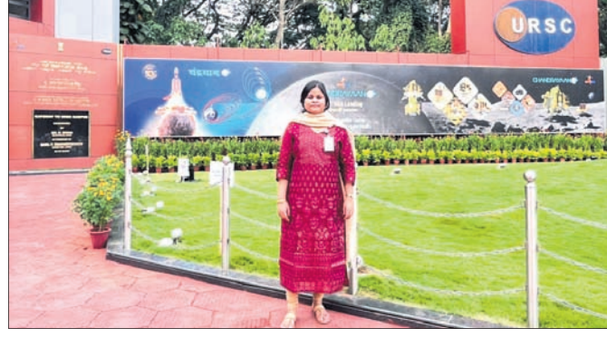
ବୈଜ୍ଞାନିକ ରହି ବେହେରା।

ଇସ୍ରୋର ଚନ୍ଦ୍ରଯାନ-୩ ମିଶନ ସଫଳ ହୋଇଛି। ଏହାପରେ ରୋଭର ପ୍ରଘାଟନ ଅଭିଯାନ ଆରମ୍ଭ କରାଯିବ।