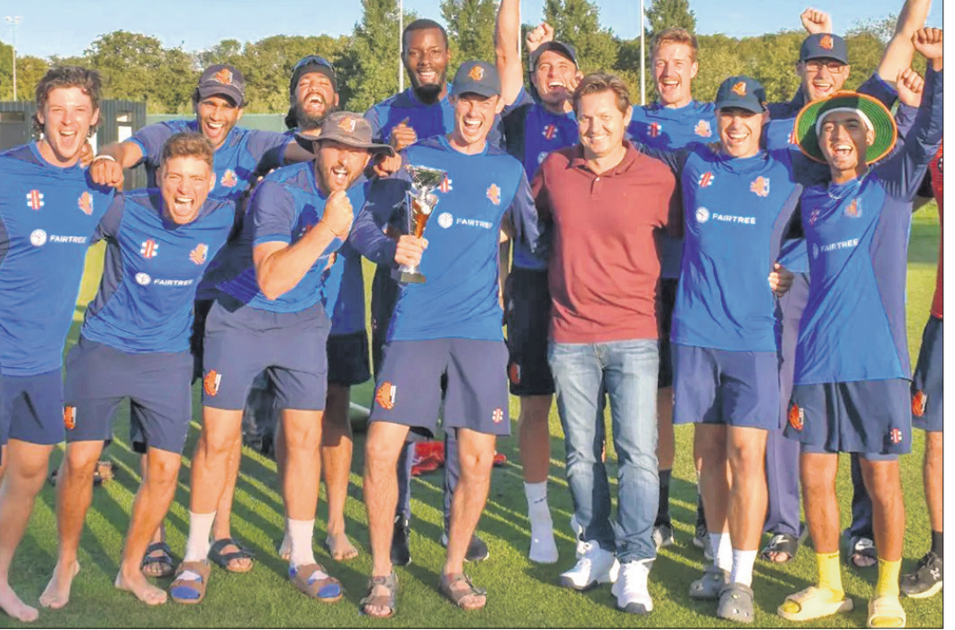
ଫେସାର ଟ୍ରି ଟ୍ରିଭାସ୍ତ୍ରୀୟ ସିରିଜ୍ ବିଜୟୀ ନେଦରଲ୍ୟାଣ୍ଡ ଦଳ।

ବେଙ୍ଗାଲୁରୁ, ୨୬ (ପି.ଟି.) ଭାରତରେ ଅନୁଷ୍ଠିତ ହେବାକୁ ଥିବା ଦିନିକିଆ କ୍ରିକେଟ ବିଶ୍ୱକପ ୨୦୨୩ ପାଇଁ ପ୍ରସ୍ତୁତି ଆରମ୍ଭ କରିଛି ନେଦରଲ୍ୟାଣ୍ଡ। ଦଳ ଆଗୁଆ ଭାରତ ଗସ୍ତ କରିବା ସହିତ ଅଧିକ ଅଧିକ ପରିଚାଳନାରେ ଅଭ୍ୟାସ ମ୍ୟାଚ୍ ଖେଳିବା ଉପରେ ଗୁରୁତ୍ୱ ଦେଇଛନ୍ତି। କୋଚ୍ ରୋଭିନ୍ କୁକ୍। ସେପ୍ଟେମ୍ବର ଆଧାରୁ ତଥା ବିଶ୍ୱକପରେ ୧୫ ଦିନ ଆଗରୁ ଦଳ ଭାରତ ଗସ୍ତ କରି ଏଠାକାର ପରିବେଶ ସହିତ ଅଭ୍ୟାସ ହେବାକୁ ପ୍ରୟାସ କରିବ। ଏହା ସହିତ ଅଷ୍ଟ୍ରେଲିଆ ଓ ଭାରତ ପରି