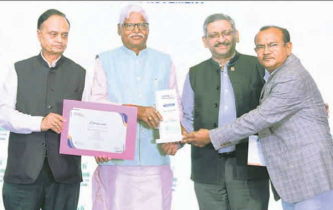
କଳିଙ୍ଗନଗର, ୨୬।୮ (ଶୁଭାଶିଷ ରାଉତ)

ବ୍ୟାଙ୍କ ଅଫ୍ ବରୋଦା (ବିଠିକି)ର ବନ୍ଧୁ ପ୍ରତୀକ୍ଷିତ ତଥା ଅତ୍ୟାଧୁନିକ ଜ୍ଞାନକୌଶଳରେ ନିର୍ମିତ ଭିଡ଼ିଓ ରି-କେଖାଇବାର ଶୁଭାରମ୍ଭ କରାଯାଇଛି।