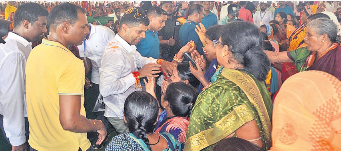
ଭଞ୍ଜନଗର ସଭାପତିଙ୍କୁ ୫-ଟି ସର୍ବିସ ଭି.କେ.ପାଠିଆନଙ୍କୁ ସାଗତ କରାଯାଇଛି ।