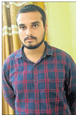
ଅନୁଗୋଳ, ୨୬/୮ (ଅନିତ ସାମଲ)

ଯୋଗ୍ୟ କର୍ମଚାରୀ ଅଭିଯୋଗ ପୂର୍ଣ୍ଣ ଠକେଇ ଅଭିଯୋଗରେ ଗିରଫ ହୋଇଥିଲେ