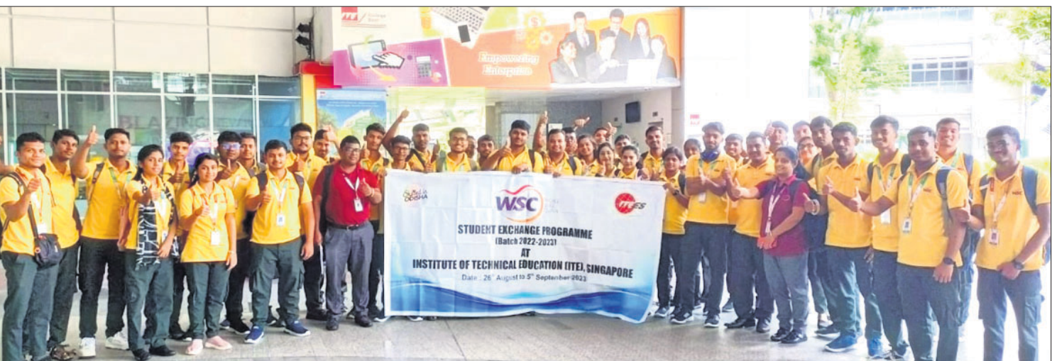
ଭୁବନେଶ୍ୱର, ୨୬/୮ (ଅସମାପିତା ସାହୁ)