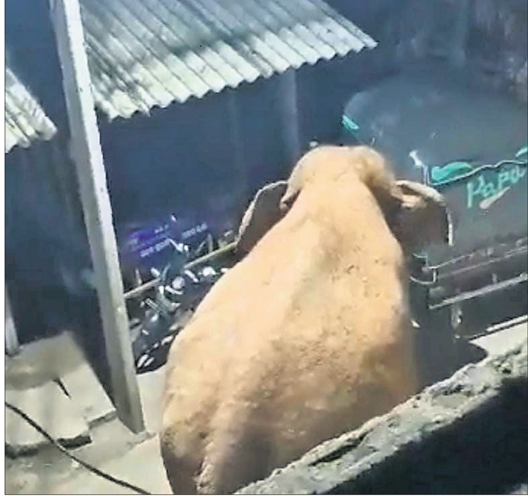
ଅନୁଗୋଳ ବନଖଣ୍ଡ ଅନ୍ତର୍ଗତ କୁମ୍ଭିରିସିଂହା ଗ୍ରାମରେ ରବିବାର ଗୋଠଛତା ଦଣ୍ଡା ଆଡ଼କ ଦେଖାଦେଇଛି। ରାତି ପ୍ରାୟ ୮ଟାରେ ଏକ ଦଣ୍ଡା ପଲୁ ଅଲଗା ହୋଇ ଜନସମୂହରେ ପଶିଛି।

ଅଭିଯୋଗ ପୂର୍ଣ୍ଣ ଠକେଇ ଅଭିଯୋଗରେ ଗିରଫ ହୋଇଥିଲେ। ଏହାପରେ ନିଜର ଠକେଇ ସାମ୍ରାଜ୍ୟ ପରେ ଠକେଇ ଅଭିଯୋଗ ଆସିବା ପରେ ଠକେଇ ଠକେଇ ଅଭିଯୋଗରେ ଗିରଫ ହୋଇଥିଲେ।