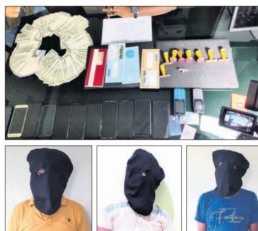
ଭୁବନେଶ୍ୱର, ୨୬/୮ (ସୁଯ୍ୟକାନ୍ତ ବେହେରା)

ଠକେଇ କରିବାକୁ 'ମୋ ସ୍କୁଲ ଅଭିଯାନ' ନାଁରେ ଫେକ୍ ଷ୍ଟେବ୍‌ସାଇଟ୍ ଖୋଲିଥିଲେ। ଚାକିରି ଦେବା ନାଁରେ ବେକାର ଯୁବତୀଙ୍କୁ ଠକି ଲକ୍ଷଲକ୍ଷ ଟଙ୍କା ଠକି ନେଉଥିବା ଏକ ଗ୍ୟାଙ୍ଗକୁ ଭୁବନେଶ୍ୱର ସାଇବର ଓ ଅଧିକାରୀଙ୍କ ଅପରାଧ ଥାନା ପୋଲିସ୍ ଧରାଇଛି।