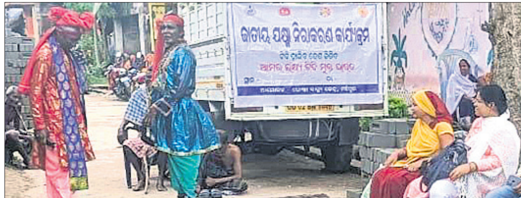
ବାସକାଠିଆ ମାଧ୍ୟମରେ କନ ସଚେତନତା କରାଯାଇଛି । ନୂଆଗାଁ, ୨୬୮୮ (ଧନେଶ୍ୱର ସାହୁ)