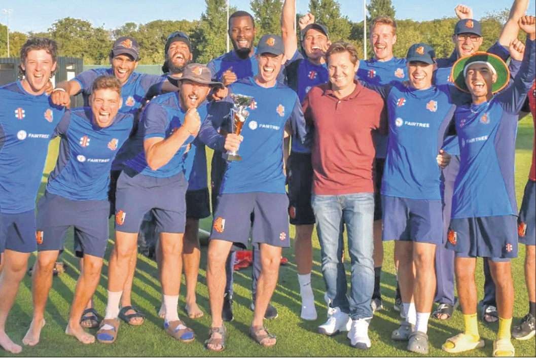
ଫେସାର ଟ୍ରି ଟ୍ରିଭାଷ୍ଟାୟ ସିରିଜ୍ ବିଜୟୀ ନେଦରଲାଣ୍ଡ ଦଳ।

ବେଙ୍ଗାଲୁରୁ, ୨୬୮ (ପି.ଟି.) ଭାରତରେ ଅନୁଷ୍ଠିତ ହେବାକୁ ଥିବା ଦିନିକିଆ କ୍ରିକେଟ ବିଶ୍ୱକପ ୨୦୨୩ ପାଇଁ ପ୍ରସ୍ତୁତି ଆରମ୍ଭ କରିଛି ନେଦରଲାଣ୍ଡ। ଦଳ ଆଗୁଆ ଭାରତ ଗସ୍ତ କରିବା ସହିତ ଅଧିକ ପରିଚାଳନାରେ ଅଭ୍ୟାସ ମ୍ୟାଚ୍ ଖେଳିବା ଉପରେ ଗୁରୁତ୍ୱ ଦେଇଛନ୍ତି କୋଚ୍ ରୋଲ୍ କୁକ୍। ସେପ୍ଟେମ୍ବର ଆରମ୍ଭ ଭାଗ ବିଶ୍ୱକପରେ ୧୫ ଦିନ ଆଗରୁ ଦଳ ଭାରତ ଗସ୍ତ କରି ଏଠାକାର ପରିବେଶ ସହିତ ଅଭ୍ୟାସ ହେବାକୁ ପ୍ରୟାସ କରିବ। ଏହା ସହିତ ଅଷ୍ଟ୍ରେଲିଆ ଓ ଭାରତ ପରି