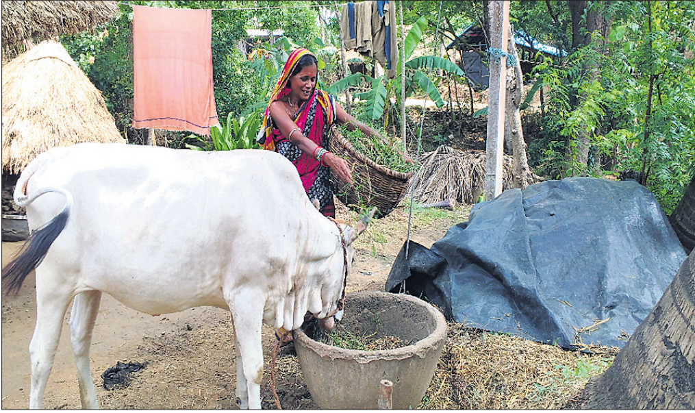
ରାଜକନିଆ ଅଞ୍ଚଳର ଜଣେ ମହିଳା ନିଜ ଗାଈକୁ ଖାଇବାକୁ ଦେଉଛନ୍ତି ।

ପୂରଣ କରିଥାନ୍ତି । ସେହିପରି ପ୍ରାଣୀଧନର ମକମୁତ୍ର ବ୍ୟବହାର କରି ଚାଷୀ କ୍ଷେତକୁ ଉର୍ବର କରିବା ସହିତ କାଟନାଶକ ଭାବେ ବ୍ୟବହାର କରିଥାନ୍ତି । ଫଳରେ ପରିବେଶର ସୁକୁଳ ରକ୍ଷା ପାଇଥାଏ । ୧୯୯୯ ମହାବାତ୍ୟା ପ୍ରାଣୀଧନ ଉପରେ ବିପତ୍ତି ଭାବେ ଉଭା ହୋଇଥିଲା । ଏହା ପରଠାରୁ କେନ୍ଦ୍ର ଓ ରାଜ୍ୟ ସରକାରଙ୍କ ଉଦ୍ୟମ ସତ୍ତ୍ୱେ ପ୍ରାଣୀଧନ ହ୍ରାସ ପ୍ରତି ବିଭାଗୀୟ ଅଧିକାରୀ ଅଧିକ ନଜର ଦେଉନାହାନ୍ତି । ଏ ସମ୍ପର୍କରେ ସାମାଜିକ ଥିବାବେଳେ ୨୦୧୨ରେ ୩,୬୫,୮୯୦ ଗୋମହିଷାଦି, ୧,୦୭,୮୨୯ ଛେଳି, ୧୪,୮୮୫ ମେଣ୍ଡା ଓ ୧,୩୦,୮୨୯ କୁକୁଡ଼ା ବଚକ ଥିଲେ । ସତ୍ୟ ତଥ୍ୟ ଅନୁଯାୟୀ ୧୨ ପ୍ରତିଶତରୁ ଅଧିକ ପଶୁଧନ ହ୍ରାସ ପାଇଛି । ଜିଲାର ୩,୨୧,୯୩୪ ପରିବାର ମଧ୍ୟରୁ ଗ୍ରାମାଞ୍ଚଳରେ ରହୁଥିବା ୩,୦୫,୮୮୬ ପରିବାର ପାଇଁ ଗୃହସାମିତ ପ୍ରାଣୀ ଯୋଜନାରେ ମୁଖ୍ୟ ବିକଳ ହୋଇଛି । ଉପରୋକ୍ତ ପରିବାର ପଶୁଧନ ହ୍ରାସ ବିକର ଆର୍ଥିକ ଆବଶ୍ୟକତା କଳ୍ପନାପ୍ରାରେ