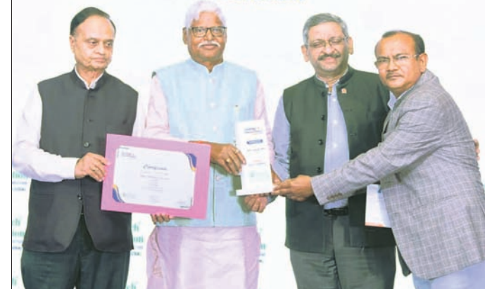
କଳିଙ୍ଗନଗର, ୨୬।୮ (ଶୁଭାଶିଷ ରାଉତ)

ବ୍ୟାଙ୍କ ଅଫ୍ ବରୋଦା (ବିଓବି)ର ବହୁ ପ୍ରଗତିତ ତଥା ଅତ୍ୟାଧୁନିକ ଖାତାକୋଶଳରେ ନିର୍ମିତ ଭିଡିଓ ରି-କେଖାଇବାର ଶୁଭାରମ୍ଭ କରାଯାଇଛି।