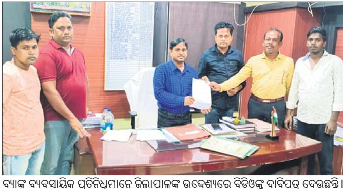
ବ୍ୟାଙ୍କ ବ୍ୟବସାୟିକ ପ୍ରତିନିଧିମାନେ ଜିଲ୍ଲାପାଳଙ୍କୁ ଉଦ୍ଦେଶ୍ୟରେ ବିତ୍ତିଖୁଜୁ ଦାବିପତ୍ର ଦେଉଛନ୍ତି।