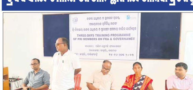
କାର୍ଯ୍ୟକ୍ରମରେ ଉପସ୍ଥିତ ରାଜ୍ୟ ସରକାରଙ୍କ ପଞ୍ଚାୟତରାଜ ପ୍ରତିନିଧି ।

କରିଛନ୍ତି । ଜଙ୍ଗଲ ଉପରେ ନିର୍ଭରଶୀଳ ଆଦିବାସୀ ହେଉଛି ଅଣଆଦିବାସୀ ଏହି ଯୋଜନାରେ ବ୍ୟକ୍ତିଗତ ହେଉଛି ଗୋଷ୍ଠୀଗତ ଜଙ୍ଗଲ ଅଧିକାର ରହିଥିବା କୁହାଯାଇଥିଲା । ସେମାନେ ନିଜ