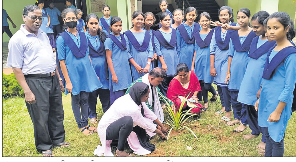
ନୀଳସୁନ୍ଦର ସରକାରୀ ଉଚ୍ଚ ବିଦ୍ୟାଳୟ ପରିସରରେ ଚାରୋଟି ପାଠ୍ୟପୁସ୍ତକ କରାଯାଇଛି।