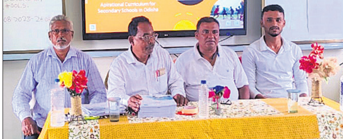
କାର୍ଯ୍ୟକ୍ରମରେ ଯୋଗଦେଇଥିବା ଅତିଥି ।

ରାଜକନିକା, ୨୬/୮ (ଭାଷ୍ଟବ ରାଉତରାୟ) ରାଜକନିକା ବ୍ଲକ ଜରିମୁକ୍ତିକର ସାବିତ୍ରୀ ଦେବୀ ବାଲିକା ଉଚ୍ଚ ବିଦ୍ୟାଳୟ ପରିସରରେ କ୍ରୀଡ଼ାଙ୍ଗନ ପ୍ରଶିକ୍ଷଣ ଶିବିର ଅନୁଷ୍ଠିତ ହୋଇଯାଇଛି । ବ୍ଲକର ୨୭ ବିଦ୍ୟାଳୟର ଶାରୀରିକ ଶିକ୍ଷା ଓ ଶିକ୍ଷକମାନଙ୍କୁ ନେଇ ଏହି ଶିବିର ଅନୁଷ୍ଠିତ ହୋଇଥିଲା । କୋନାଲ ସମ୍ପାଦକ ସାରୋଜ ରାଉତଙ୍କ ଅଧ୍ୟକ୍ଷତାରେ ଆୟୋଜିତ