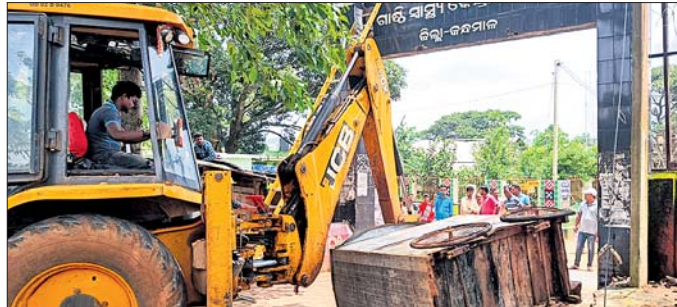
ଜବର ଦସ୍ତୀ ଭଙ୍ଗେଇ କରାଯାଇଛି । ଦାରିଙ୍ଗବାଡ଼ି, ୨୬୮ (ଅଭୁଷ ସାହୁ)

ଆଇଆଇସି ଦୌଷିକ ମାଡ଼ି ସଦକବଳ ଉପସ୍ଥିତ ରହିଥିଲେ । ଗାଁ ଦୋକାନୀ ସମେତ ଜଳଖିଆ, ପରିପରିବା ଦୋକାନୀମାନେ ନିଜ ପରିବାର ପ୍ରତିପୋଷଣ କରିବାକୁ ଦାରିଙ୍ଗବାଡ଼ିର ଦାରିଙ୍ଗବାଡ଼ିରୁ ତିନିହଳ ପାଟକ ସୌନ୍ଦର୍ଯ୍ୟକରଣ କାର୍ଯ୍ୟ ଚାଲିଥିବା ବେଳେ ଏହା ସମ୍ବୁଖରେ ରହିଥିବା ଉଠା ଦୋକାନୀଙ୍କୁ ଭଙ୍ଗେଇ କରାଯାଇଛି ।