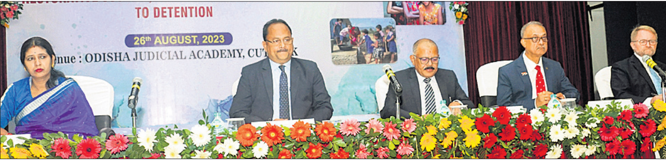
କଟକ, ୨୬/୮ (କାର୍ତ୍ତିକ ସାହୁ) କୁଟ୍ତିସିଆଲ ଏକାଡେମୀରେ ଆୟୋଜିତ କର୍ମଶାଳାରେ ଉପସ୍ଥିତ ଅତିଥିବୃନ୍ଦ।