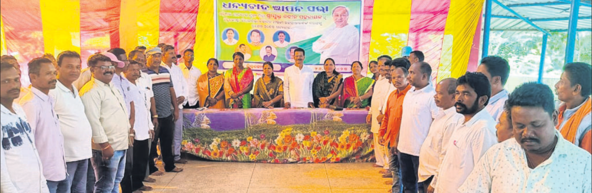
ଧନ୍ୟବାଦ ଛାପନ ସଭାରେ ବିଧାୟକ ଓ ଅନ୍ୟମାନେ ।