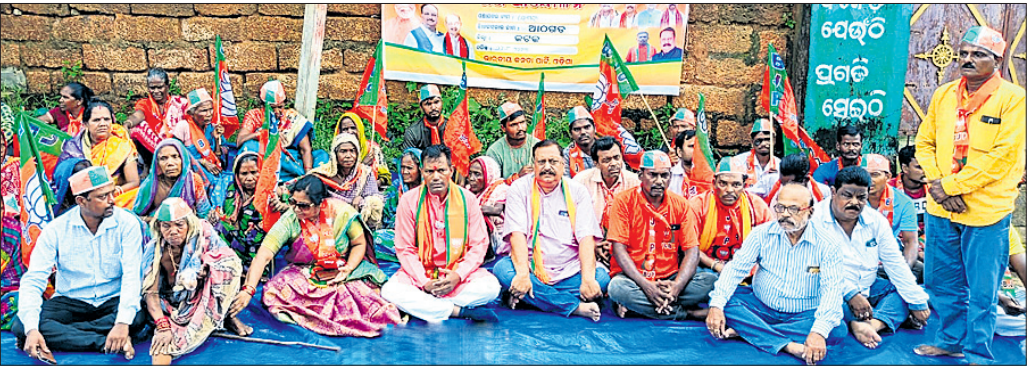
ଭୋଗରା ପଞ୍ଚାୟତ କାର୍ଯ୍ୟାଳୟ ସମ୍ମୁଖରେ ବିକ୍ଷୋଭ ପ୍ରଦର୍ଶନ।