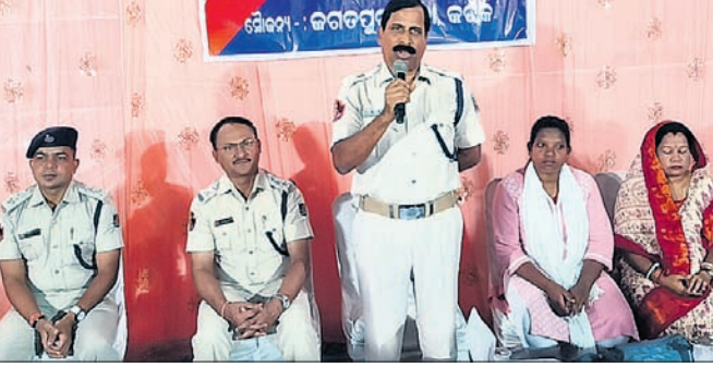
ଗଣେଶପୂଜା ପ୍ରସ୍ତୁତି ବୈଠକରେ ପୋଲିସ ଅଧିକାରୀ ଓ ଅନ୍ୟମାନେ।