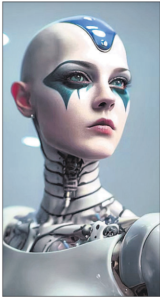
ଫିମେଲ୍ ରୋବୋର ପ୍ରତୀକାତ୍ମକ ଚିତ୍ର।

ଗୁରୁତ୍ୱପୂର୍ଣ୍ଣ ବୋଲି ଜିତେନ୍ଦ୍ର କହିଛନ୍ତି। ସେ ଆହୁରି କହିଛନ୍ତି, ଗଗନଯାନର ଦ୍ୱିତୀୟ ମିଶନରେ ଫିମେଲ୍ ରୋବୋକୁ ମହାକାଶକୁ ପଠାଯିବ। ଉକ୍ତ ରୋବୋ ସମସ୍ତ ମାନବ କାର୍ଯ୍ୟକଳାପ କରିବ। ଯଦି ସବୁ ଠିକ୍ ଠାକ୍ ଚାଲେ ତେବେ ଗଗନଯାନ କାର୍ଯ୍ୟକ୍ରମ ପାଇଁ ଆମେ ଆଗେଇବୁ। ଏଥିପାଇଁ ଅର୍ବଚାଳ ମନ୍ତ୍ରାଳୟ ନିର୍ମାଣ ସମ୍ପୂର୍ଣ୍ଣ ହୋଇଛି। ପରାକ୍ଷାତ୍ମକ ଅଭିଯାନ ପାଇଁ ସେଗୁଡ଼ିକୁ କମିଶନ କରାଯାଇଛି ଏବଂ ଲକ୍ଷ୍ୟପାତ୍ର ବୃତ୍ତାନ୍ତରା କାର୍ଯ୍ୟ ଜାରି ରହିଥିବା ମନ୍ତ୍ରା କହିଛନ୍ତି। ଇସ୍ରୋ ବୃତ୍ତାନ୍ତ ମାନବ ମିଶନ ପୂର୍ବରୁ ହୋଇଥିବା ମାନବ ସଦୃଶ ବ୍ୟୋମଗିତ୍ରକୁ ନେଇ ମିଶନ କରିବାକୁ ଯୋଜନା କରିଛି। ଏହା ୨୦୨୪ ଜିମ୍ବା ୨୦୨୫ରେ ହେବ। ଗଗନଯାନ ମିଶନ ସଫଳ ହେଲେ ମହାକାଶକୁ ମାନବ ପଠାଇବାରେ ଭାରତ ବିଶ୍ୱର ଚତୁର୍ଥ ଦେଶ ହେବ। ପୂର୍ବରୁ ଆମେରିକା, ରୁଷିଆ ଏବଂ ଚୀନ ଆମେରିକା, ରୁଷିଆ ଏବଂ ଚୀନରୁ ବ୍ୟୋମଗିତ୍ର ଫେରାଇ ଆଣିବା ସେହିଭଳି ହୋଇଛି।