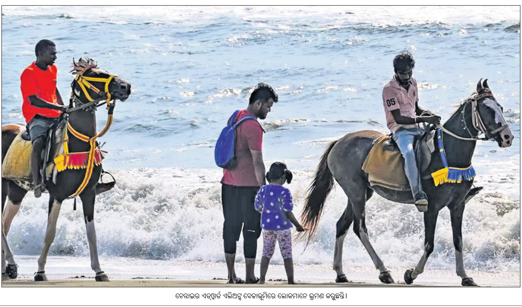
ଚେନାଇର ଏଡ୍ୱାର୍ଡ ଏଲିଅସ୍ ବେକାଲୁମିରେ ଲୋକମାନେ ଭ୍ରମଣ କରୁଛନ୍ତି।

କୋଲକାତା, ୨୬। କୋଲକାତା ପୋଲିସ ଗୋଇନ୍ଦା ସୂଚନା ଆଧାରରେ ହାଓଡ଼ାସ୍ଥିତ ଏକ ଘର ଉପରେ ଚଢ଼ାଉ କରି ଜଣେ ସହିଷ୍ଣ ବ୍ୟକ୍ତିଙ୍କୁ ଗିରଫ କରିଛି। ସେ ପାକିସ୍ତାନ ପାଇଁ ଗୁପ୍ତଚରଗିରି କରୁଥିବା ଅଭିଯୋଗ ହୋଇଛି। ତାଙ୍କ ନିକଟରୁ ବହୁ ସଂଖ୍ୟାରେ ସନ୍ଦେହନଶୀଳ ଦସ୍ତାବିଜ୍ ଜବତ ହୋଇଥିବା ଜଣେ ବରିଷ୍ଠ ପୋଲିସ ଅଧିକାରୀ ଶନିବାର କହିଛନ୍ତି। ଗିରଫ ପୂର୍ବରୁ ସ୍ୱତନ୍ତ୍ର ଚାଷ୍ଟିଯୋଗ୍ୟ କାର୍ଯ୍ୟାଳୟରେ ତାଙ୍କୁ ଦୀର୍ଘ ସମୟ ଜେରା କରାଯାଇଥିଲା। ଅଭିଯୁକ୍ତଙ୍କ ଘର ବିହାରର ଦରଭଙ୍ଗା ଜିଲ୍ଲାରେ। ସେ ଦେଶର ସୁରକ୍ଷା ପ୍ରତି କ୍ଷତିକାରକ କାର୍ଯ୍ୟରେ ପ୍ରତ୍ୟକ୍ଷ ଭାବେ ସମ୍ପୃକ୍ତ ଥିବା ଜଣାପଡ଼ିଛି। ତାଙ୍କ ମୋବାଇଲ୍ ଫୋନ୍ରେ ଥିବା ବିଭିନ୍ନ ଫଟୋ, ଭିଡିଓ ଏବଂ ଅନୁଲିଖିତ ଏବଂ ଚାଟ୍ସରୁ ଗୁପ୍ତ ତଥ୍ୟ ପାକିସ୍ତାନର ସହିଷ୍ଣ କୋଇନ୍ଦା ସଂସ୍ଥାକୁ ଯାଉଥିଲା ବୋଲି ଅଧିକାରୀ ଜଣକ କହିଛନ୍ତି।