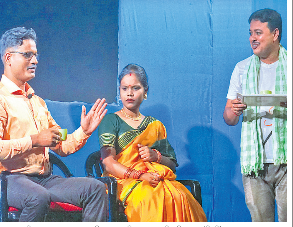
କଟକ କଳା ବିକାଶ କେନ୍ଦ୍ର ପ୍ରୋକ୍ସାକର୍ମରେ ଶନିବାର ଶ୍ରୀକାଞ୍ଚଳ କୁବ ପକ୍ଷରୁ ପରିବେଷିତ ନାଟକ ‘ନିଷ୍ଠୁରି’ର ଏକ ଦୃଶ୍ୟ।

ଉଠାଇ ରଖିଥିଲେ। ପରେ ବିଭିନ୍ନ ସମୟରେ ସେ ତାଙ୍କୁ ଚାଲି ଯାଇଥିଲେ। ସେହିଭଳି ଗଞ୍ଜେଇ ଜବତ ହେବା (୨୩) ଓ ନଶାଦ ଚିହ୍ନିତ କରାଯାଇଛି।