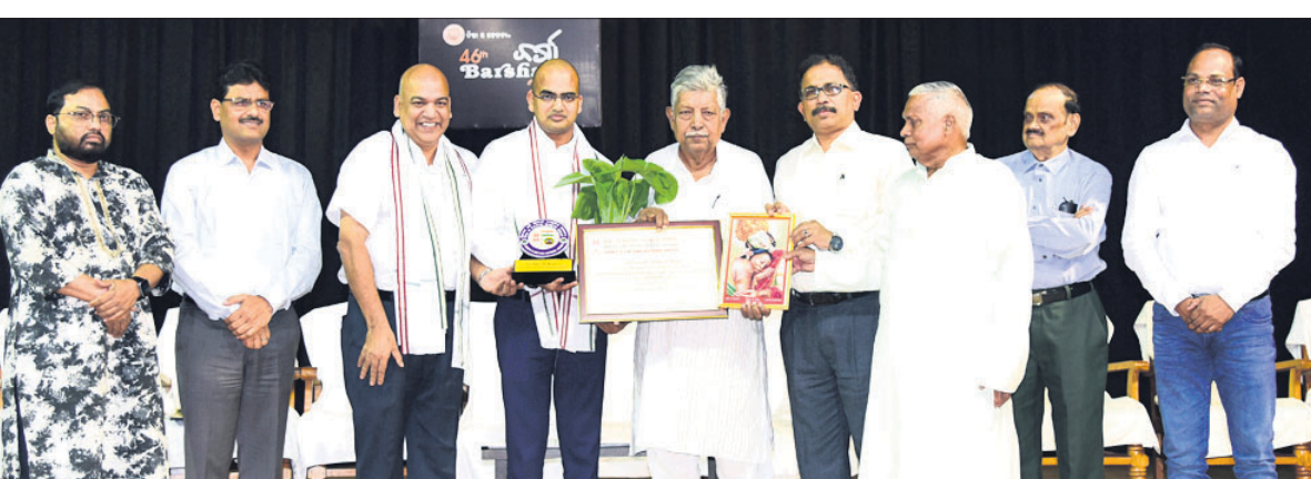
ଚିତ୍ରା ଓ ଚେତନା ବର୍ଷା ଉତ୍ସବର ଶନିବାର ସନ୍ଧ୍ୟାରେ ଅତିଥିମାନେ 'ଚିତ୍ରା ଓ ଚେତନା ରାଷ୍ଟ୍ରୀୟ ସମ୍ମାନ' ପ୍ରଦାନ କରୁଛନ୍ତି।

ଏହା ଲତାଭେଦେ କାରିଗରଙ୍କ ଦ୍ୱାରା ପ୍ରାକୃତିକ ଭାବରେ ରଙ୍ଗାୟିତ ଏବଂ ମଧ୍ୟପ୍ରଦେଶର ପାରାଦସିଙ୍ଗ ଗାଁରେ ମହିଳାମାନେ ଏହାର ବ୍ୟାଞ୍ଜ ତିଆରି କରିଥାନ୍ତି। 'ବାକପତ୍ର' ନାମକ ଏକ ଉଦ୍ୟୋଗ ଦ୍ୱାରା ଉତ୍ପାଦିତ ଏହି ରାଖୀରେ ଆମରକ୍ଷ, ତୁଳସୀ, ପର୍ଯ୍ୟଲେନ, ବିନ୍ଦୁ ଆଦି ମଞ୍ଜି ଥାଏ। ଏପରିକି ପୁନଃଚକ୍ରଣ ହୋଇଥିବା କାଗଜରେ ମଧ୍ୟ ସଜିବେସିତ କରାଯାଇଥାଏ, ଯେଉଁଥିରେ ରାଖୀଗୁଡ଼ିକ ବନ୍ଧା ହୋଇ ରହିଥାଏ। ଏହି ରାଖୀ ଓ ସଂକଳ୍ପ କାଗଜକୁ ଯଦି ପିଙ୍ଗି ଦିଆଯାଏ ତାହା ସହଜରେ ନଷ୍ଟ ହୋଇଯାଏ ଏବଂ ସେଥିରୁ ଚାଗା ପୁଟିଥାଏ।