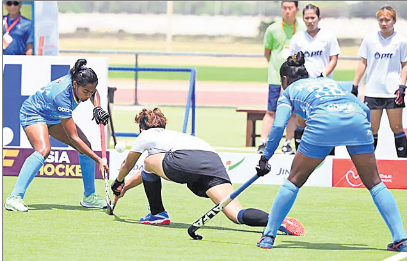
ଭାରତ-ଥାଇଲାଣ୍ଡ ମଧ୍ୟରେ ଅନୁଷ୍ଠିତ ମ୍ୟାଚ୍ ଏକ ସଂଘର୍ଷପୂର୍ଣ୍ଣ ମୁହୂର୍ତ୍ତ।