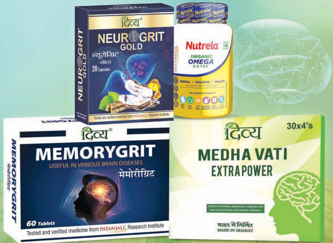
ଆମର ସମସ୍ତ ଔଷଧ ସାରା ଭାରତରେ ପତଞ୍ଜଳି ଷ୍ଟୋର୍ସ, ପ୍ରମୁଖ ମେଡିକାଲ, ଆୟୁର୍ବେଦିକ ଓ ଅନ୍ୟାନ୍ୟ ଷ୍ଟୋର୍ସରେ ଉପଲବ୍ଧ । ଉପରୋକ୍ତ ଔଷଧର ବ୍ୟବହାର ପ୍ରସ୍ତାବ ମାତ୍ର ଅଟେ । ଉପରୋକ୍ତ ରୋଗଗୁଡ଼ିକର ପ୍ରବନ୍ଧନ ପାଇଁ ଡିକିଆରେ ଏଗୁଡ଼ିକୁ ପ୍ରୟୋଗ ପ୍ରୟୋଗ କରାଯାଇପାରେ । ନିଜ କ୍ଷେତ୍ରରେ ଔଷଧ ଖାଆନ୍ତୁ ନାହିଁ । ସର୍ବଦା ଡିକିଆର ନିରୀକ୍ଷଣ ଅଧୀନରେ ଔଷଧ ବ୍ୟବହାର କରନ୍ତୁ ।

ସନ୍ଦର୍ଭ ଗବେଷଣା ଉପରେ ଅଧିକ ସୂଚନା ପାଇଁ ପରିଦର୍ଶନ କରନ୍ତୁ: www.patanjali.res.in