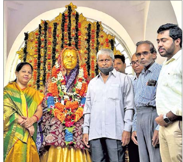
ଶିକ୍ଷୟିତ୍ରୀଙ୍କ ପ୍ରତିମୂର୍ତ୍ତିରେ ଅତିଥିମାନେ ମାଲ୍ୟାର୍ପଣ କରୁଛନ୍ତି।