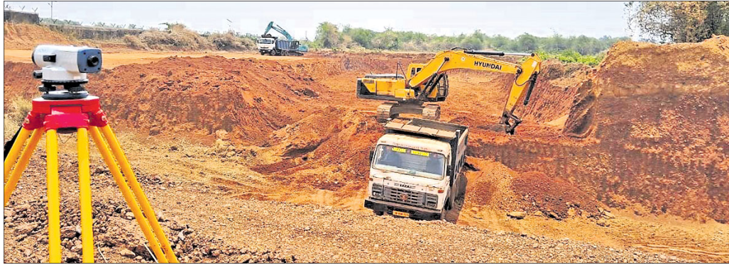
ମହା ସିମେଣ୍ଟ କାରଖାନା ପାଇଁ ନିର୍ମାଣ କାର୍ଯ୍ୟ ଚାଲିଛି ।

ଶିଳ୍ପ ପାଇଁ ଜମିହରା ପରିବାର ସର୍ବହରା ୬୮ ଏକର ଜମି ସ୍ଥଳେ ୧୧୩ ଏକର ଜମି ପ୍ରଦାନ