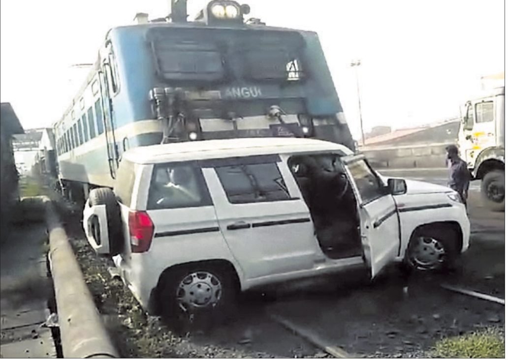
ପାରାଦୀପ ବନ୍ଦର ନିକ୍ଷିପ୍ତାଞ୍ଚଳରେ ସୋମବାର ଏକ ମାଇବାହା ଟ୍ରେନ୍ ବୋଲେରୋକୁ ଧକ୍କା ଦେଇ ଘୋଷାରି ନେଇଛି। (ରିପୋର୍ଟ: ପୃଷ୍ଠା-୪)

ପଦବୀ ରହିଛି ସେଥିରେ ଏସ୍‌ସି, ଏସ୍‌ଟି ବର୍ଗକୁ ପଦୋନ୍ନତି ଦେବାକୁ ସରକାର ଯୋଜନା କରୁଥିବା ଅଭିଯୋଗ ହୋଇଛି। ନିକଟରେ ଶତାଧିକ ସାଧାରଣ ବର୍ଗର କର୍ମଚାରୀ ଏହାକୁ ବିରୋଧ କରି ଆଜନ ଦିଗର ସଚିବଙ୍କ କାର୍ଯ୍ୟାଳୟ ବାହାରେ ଏକତ୍ର ହୋଇ ଏବେଲେ ଅଭିଯୋଗ କରିବାକୁ ଆସିଥିବାବେଳେ ଘଟଣା ସମ୍ପର୍କରେ ଜାଣିବାକୁ ମିଳିଥିଲା। ହେଲେ କେତେଜଣ ଅବସରପ୍ରାପ୍ତ ଅଧିକାରୀ ଏହି ଘଟଣା ଦାଉଁସିନ ହେଲା ବୃହତ୍ ଗାଳିଥିବା ମତ ରଖୁଛନ୍ତି। ଅନ୍ୟପକ୍ଷେ ବିଭାଗୀୟ ମନ୍ତ୍ରୀ ଏ ବିଷୟରେ ତର୍କନା କରିବେ ବୋଲି ମତ ରଖୁଛନ୍ତି। ଅପରପକ୍ଷରେ କେତେଜଣ ଏସ୍‌ସି, ଏସ୍‌ଟି ବର୍ଗର କର୍ମଚାରୀ ପଲଗା ଅଭିଯୋଗ ଆଣୁଛନ୍ତି। ପୁସ୍ତିକକୋର୍ଟଙ୍କ ନିୟମାନୁଯାୟୀ ସେମାନଙ୍କୁ ସାଧାରଣ ବର୍ଗଙ୍କ ସ୍ଥାନରେ ପଦୋନ୍ନତି ମିଳିପାରିବ ବୋଲି ଦାବି କରୁଛନ୍ତି। ଆଗକୁ ବୃହତ୍ ପଦପଦବୀରେ ପଦୋନ୍ନତି ହେବାକୁ ଥିବାରୁ ଏବେଠାରୁ ନିଜ ଭବିଷ୍ୟତକୁ ନେଇ ସାଧାରଣ ବର୍ଗର କର୍ମଚାରୀମାନେ ଚିନ୍ତା ପ୍ରକଟ କରି ଏହା ଉପରେ ଆଲୋଚନା କରାଯାଉ ବୋଲି ଦାବି କୋରୁଦାର କରିଛନ୍ତି। ଅଭିଯୋଗ କରିବାକୁ ଆସିଥିବା ପୃଷ୍ଠା-୪