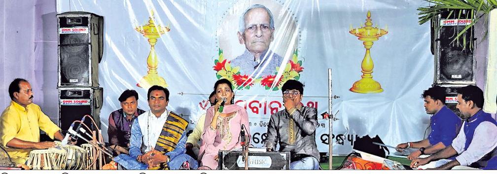
ସ୍ମୃତି ସଭାରେ କଣ୍ଠଶିଳ୍ପୀମାନେ ଭଜନ ପରିବେଷଣ କରୁଛନ୍ତି ।

କାର୍ଯ୍ୟରେ ସହଯୋଗ କରିବା ସହ ଶକ୍ତିଚଳା ପ୍ରାଥମିକ ବିଦ୍ୟାଳୟରେ ଦୀର୍ଘଦିନ ଧରି ଭଜନ କରାଯାଇଛି । ତାଙ୍କ ଶିକ୍ଷାଦାନରେ ବହୁ ମେଧାବୀ ଛାତ୍ରଛାତ୍ରୀ ବିଭିନ୍ନ ପଦପଦବୀରେ ଅଧିଷ୍ଠିତ ହୋଇ ପାରିଛନ୍ତି । ଏହାସହ ସେ ସାଲପୁର ରୋଡ଼ ଶିକ୍ଷା ବିଭାଗରେ ଡିଆଇ(ଡେପ୍ୟୁଟି ଇନ୍ସପେକ୍ଟର) କାର୍ଯ୍ୟାଳୟ ଅଧୀନରେ ଏଆଇ ଭାବେ କାର୍ଯ୍ୟ କରିଥିଲେ । ସେ ଜଣେ କର୍ତ୍ତବ୍ୟନିଷ୍ଠ, ସମୟାନୁବର୍ତ୍ତୀ ଓ ଜଣେ ଆଦର୍ଶ ଶିକ୍ଷକ ଭାବେ ପରିଚିତ ଥିଲେ ବୋଲି ବନ୍ଧୁମାନେ