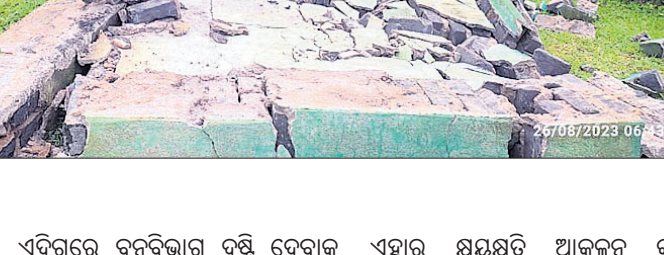
ହାତୀ ଭାଙ୍ଗିଥିବା ସୁଲ ପାଚେରି ।

ଶ୍ରାବଣ ମାସର ଶେଷ ସୋମବାରରେ ସୁନ୍ଦରଗଡ଼ ଜିଲ୍ଲା ବାଲିଶଙ୍କରା ବ୍ଲକର ଶୁଖା ମହାଦେବ ଶୈବ ପୀଠରେ ଭକ୍ତଙ୍କ ସମାଗମ ହୋଇଥିଲା । ଏହି ଅବସରରେ ମନ୍ଦିର ପରିସରରେ ମେଳା ବସିଥିଲା । ମନ୍ଦିର କମିଟି ଓ ତଳସରା ପୋଲିସ୍ ଶାନ୍ତିଶୁଖା ପାଇଁ ସହାୟତାର ହାତ ବଢ଼ାଇଥିଲେ । ଓଡ଼ିଶାର ସାମାଜିକ ପତେଶୀ ରାଜ୍ୟ ଛତିଶଗଡ଼ ଓ ଝାଡ଼ୁଖଣ୍ଡ ରାଜ୍ୟ ମଧ୍ୟ ଭକ୍ତମାନେ ଏହି ପୀଠକୁ ଆସିଥିଲେ ।