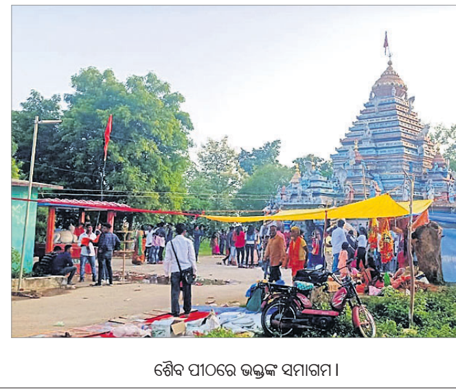
ଶୈବ ପୀଠରେ ଭକ୍ତଙ୍କ ସମାଗମ ।

ଶ୍ରାବଣ ମାସର ଶେଷ ସୋମବାରରେ ସୁନ୍ଦରଗଡ଼ ଜିଲ୍ଲା ବାଲିଶଙ୍କରା ବ୍ଲକର ଶୁଖା ମହାଦେବ ଶୈବ ପୀଠରେ ଭକ୍ତଙ୍କ ସମାଗମ ହୋଇଥିଲା । ଏହି ଅବସରରେ ମନ୍ଦିର ପରିସରରେ ମେଳା ବସିଥିଲା । ମନ୍ଦିର କମିଟି ଓ ତଳସରା ପୋଲିସ୍ ଶାନ୍ତିଶୁଖା ପାଇଁ ସହାୟତାର ହାତ ବଢ଼ାଇଥିଲେ । ଓଡ଼ିଶାର ସାମାଜିକ ପତେଶୀ ରାଜ୍ୟ ଛତିଶଗଡ଼ ଓ ଝାଡ଼ୁଖଣ୍ଡ ରାଜ୍ୟ ମଧ୍ୟ ଭକ୍ତମାନେ ଏହି ପୀଠକୁ ଆସିଥିଲେ ।