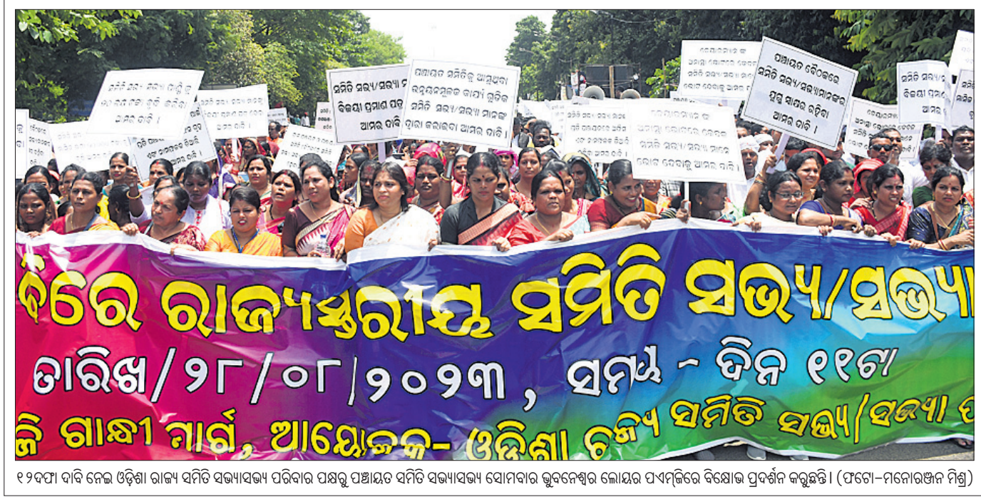
୧୨୯୩ ଦାବି ନେଇ ଓଡ଼ିଶା ରାଜ୍ୟ ସମିତି ସଭାସଭା ପରିବାର ପକ୍ଷରୁ ପଞ୍ଚାୟତ ସମିତି ସଭାସଭା ସୋମବାର ଭୁବନେଶ୍ୱର ଲୋକସଭା ପରିଷଦରେ ବିରୋଧ ପ୍ରଦର୍ଶନ କରୁଛି।

ଉଚ୍ଚ ମାଧ୍ୟମିକ ସ୍କୁଲରେ ଯୁକ୍ତ ୨ ପାଇଁ ମୋଟ ୫,୧୯,୧୭୭ ସିଟ୍ ରହିଛି। ପ୍ରଥମ ଉର୍ଦ୍ଧ୍ୱ ଛାତ୍ରାଛାତ୍ରୀ ଆବେଦନ କରିଥିବା ଜଣାପଡ଼ିଛି। ଗତ ୧୬ ତାରିଖରୁ ଏହି ପ୍ରକ୍ରିୟା ଆରମ୍ଭ ହୋଇଥିଲା।