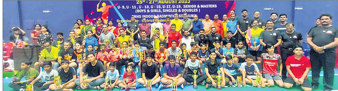
ଅତିଥିକ ଗହଣରେ ଜିଲ୍ଲା ବ୍ୟାଡ଼ମିଣ୍ଟନ ଗାମ୍ପିୟନ ଡ୍ରମୁକ୍ତ ପ୍ରତିଯୋଗୀ।

ମନୋରଞ୍ଜନ ଭେଟେରାନ ସିଙ୍ଗଲ୍, ମାନସ-ଅଭିଳା ତବଳୁ ଗାମ୍ପିୟନ