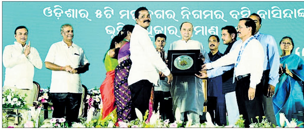
୨୦୨୫ରୁ ଭୂମି ଅଧିକାରକୁ ଭୂମି ଅଧିକାର ମିଳିଛି।

ସାରା ବିଶ୍ୱର ଦୃଷ୍ଟି ଆକର୍ଷଣ କରିପାରିଛି ବିକାଶର ସୁପକରେ ଗରିବ ଲୋକଙ୍କ ପ୍ରଥମ ଅଧିକାର ରହିଛି। ସହରର ରୁପାନ୍ତରଣରେ ଜାଗା ମିଶନ ନୂଆ ମୁନ କରାଯିବ। ସହରର ସବୁଗରିବ ପରିବାରକୁ ଭୂମି ଅଧିକାର ମିଳିବା ପର୍ଯ୍ୟନ୍ତ ଏ ଅଭିଯାନ ଜାରି ରହିବ ବୋଲି ମୁଖ୍ୟମନ୍ତ୍ରୀ କହିଛନ୍ତି।