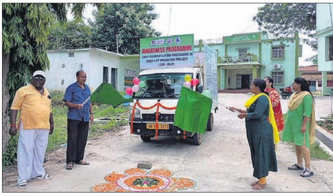
କୃଷି ଅଧିକାରୀ ଓ କୁଳ କୃଷି ଅଧିକାରୀ ପତାକା ବେଖାଇ ରଥର ଶୁଭାରମ୍ଭ କରୁଛନ୍ତି ।

ସ୍ଥାନୀୟ ସରକାର କୁଳ ରାଣୀ ବଗିଚାସ୍ଥିତ କୃଷି କାର୍ଯ୍ୟାଳୟରୁ ବୃହତ କଳ ସେତନ ଅଞ୍ଚଳରେ ଫସଲ ବିଦିଧି କରଣ ଯୋଜନା (ସିଡିପି) ପ୍ରଚାର ପ୍ରସାର ପାଇଁ ସ୍ୱେଚ୍ଛାସିଦ୍ଧ ଅନୁଷ୍ଠାନ ସିଆଇଆର୍ଟିଟି ସୁନ୍ଦରଗଡ଼ ତରଫରୁ ସଚେତନତା ରଥ ସୋମବାର ଶୁଭାରମ୍ଭ କରାଯାଇଛି । ଖରିଫ ଋତୁରେ ଅଣଧାନ ଜାତୀୟ ଫସଲ ଚାଷ ପ୍ରତି ଚାଷୀଙ୍କ ମଧ୍ୟରେ ଆଗ୍ରହ ସୃଷ୍ଟି କରିବା ତଥା ବଜାର ଚାହିଦା ମୁତାବକ ଅଣ ଧାନ ଫସଲ ଚାଷ କରିବା ଏହି ଯୋଜନାର ମୂଳ ଲକ୍ଷ୍ୟ । ଏହି ଯୋଜନାରେ ଚାଷୀଙ୍କୁ ମିଳୁଥିବା ସୁବିଧା ସୁଯୋଗ ଉପରେ ସଚେତନ କରିବା ପାଇଁ ସଚେତନତା ରଥ ସୋମବାରଠାରୁ ଆସନ୍ତା ୩୧ ପର୍ଯ୍ୟନ୍ତ ସରକାର କୁଳ ସ୍ଥିତ କୁଳୁ, ମଝପଦା, ସାଲେପାଲି ଗ୍ରାମ