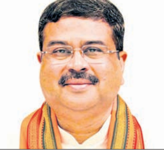
ଭୁବନେଶ୍ୱର, ୨୮୮ (ସୁନିବ୍ ମିଶ୍ର)

ଗଣତନ୍ତ୍ରରେ ମର୍ଯ୍ୟାଦା ଓ ପରମ୍ପରାର ନିକଟତର ଅଛି । ଓଡ଼ିଶାରେ ଗତ ମେ ମାସରୁ ଶଶୀକଳା ସିଣ୍ଡିକେଟର ଲକ୍ଷଣ ଦେଖାଗଲାଣି ।