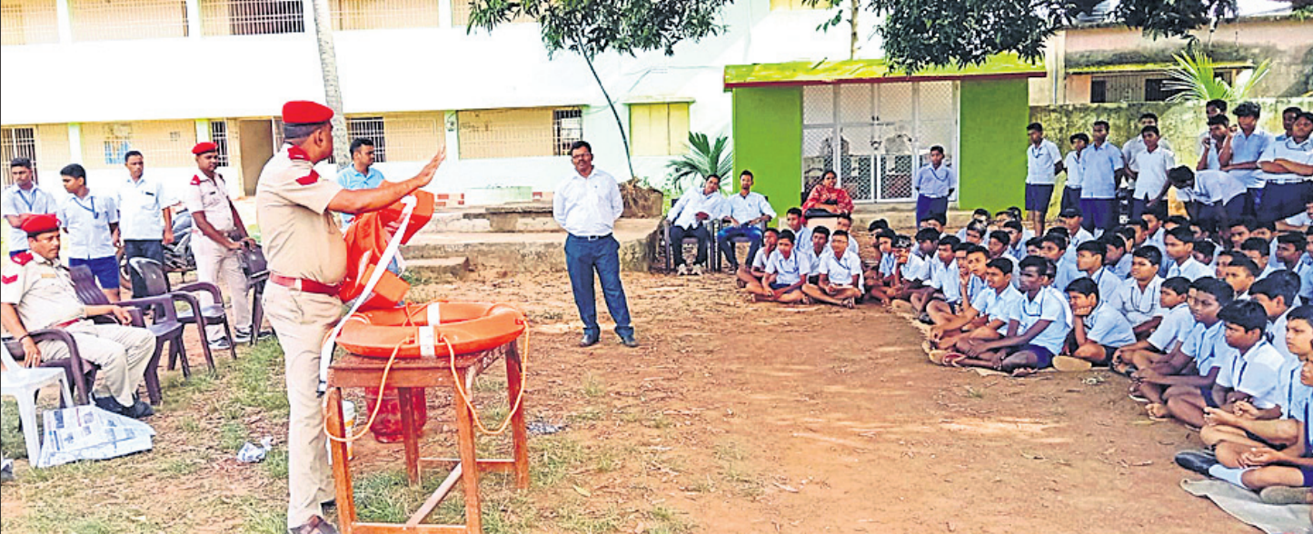
ବେଗୁନିଆ, ଗୋପବନ୍ଧୁ ସରକାରୀ ଉଚ୍ଚ ବିଦ୍ୟାଳୟ ପରିସରରେ ଯୋଗବାନ ଅଗ୍ନିଶମ ବିଭାଗ ପକ୍ଷରୁ ଅନୁଷ୍ଠିତ ମକଡ଼ିଲରେ ସାମିଲ ହୋଇଥିବା ପିଲାମାନେ।