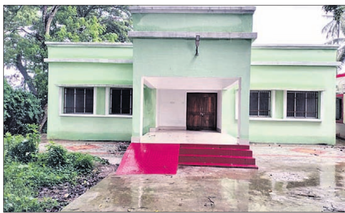
ପରେ ୨୯ ଲକ୍ଷ ଟଙ୍କା ବ୍ୟୟରେ ଗୁହ ନିକ୍ତ ପ୍ରଶାସନିକ ଅବହେଳା ଯୋଗୁ ଏବେ... ଗୋପ ଲୁକ୍ ପରିସରରେ ୧୪ ମାସ ହେବ ଲୁକ୍...