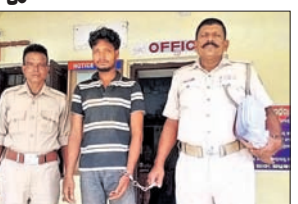
ଗୋପ, ୨୮୮୮ (ଭାରତୀ ଭୃଷଣ ହପାଧାର)