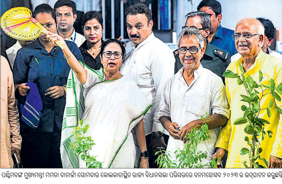
ପଶ୍ଚିମବଙ୍ଗ ମୁଖ୍ୟମନ୍ତ୍ରୀ ମମତା ବାନାର୍ଜୀ ସୋମବାର କୋଲକାତାସ୍ଥିତ ରାଜ୍ୟ ବିଧାନସଭା ପରିସରରେ ବନମହୋତ୍ସବ ୨୦୨୩ର ଉଦ୍‌ଘାଟନ କରୁଛନ୍ତି ।

ଲୋକଙ୍କୁ ଅପମାନିତ କରିବେ ତେବେ ଏହାକୁ ବନ୍ଦ କରି ଦିଆଯିବ । ଏହାକୁ ବନ୍ଦ କରିବା ପାଇଁ ସରକାରୀ ନିର୍ଦ୍ଦେଶ ଥିବା କୁହାଯାଉଛି ।