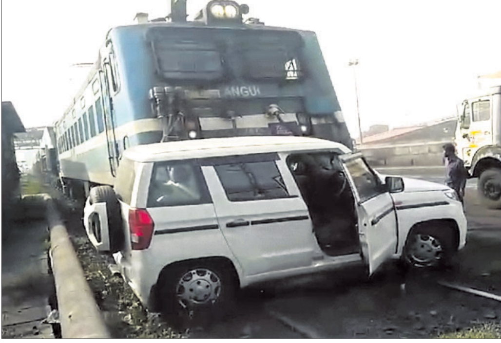
ପାରାଦୀପ ସହର ନିକ୍ଷିବାଞ୍ଚକରେ ସୋମବାର ଏକ ମାଲବାହୀ ଟ୍ରେନ୍ ବୋଲେରୋକୁ ଧକ୍କା ଦେଇ ଘୋଷାରି ନେଇଛି। (ରିପୋର୍ଟ: ପୃଷ୍ଠା-୪)