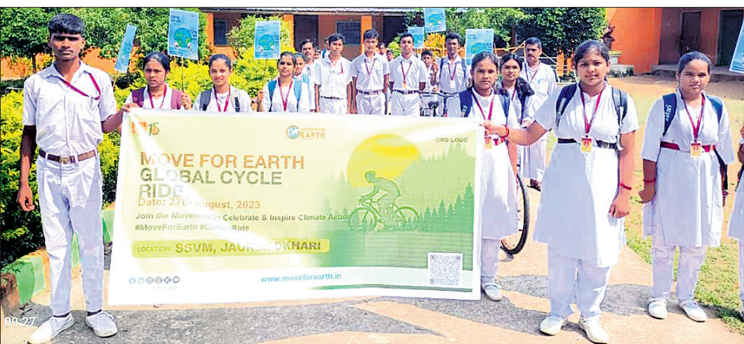
‘ସୁର ଅ’ ସଙ୍ଗଠନ ତରଫରୁ ଆୟୋଜିତ ପୁଞ୍ଜ ପର୍ ଆର୍ଥ ଗ୍ଲୋବାଲ୍ ସାଇକେଲ ଯାତ୍ରା ।