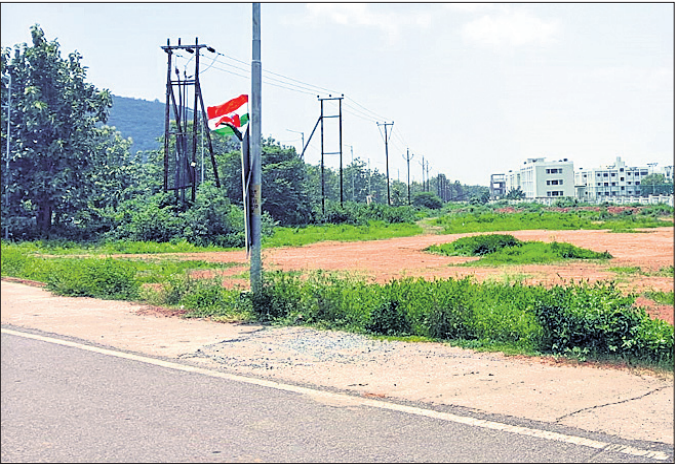
ଗଛ ସମ୍ପ୍ରଦାନ ଚାଲିଛି, ବିଦ୍ୟୁତ୍ ଖୁଣ୍ଟ ଉଠିଲାଣି