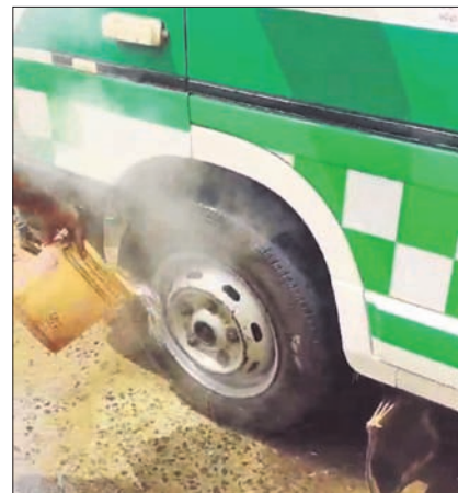
ଆୟୁର୍ବିଦ୍ୟାଳୟରେ ଲାଗିଲା ନିଆଁ ।

ପାପଡ଼ାହାଣ୍ଡି ନୂଆସାହି ରାସ୍ତାରେ ମଙ୍ଗଳବାର ଏକ ୧୦୮ ଆୟୁର୍ବିଦ୍ୟାଳୟରେ ହଠାତ୍ ନିଆଁ ଲାଗିଯାଇଥିଲା ।