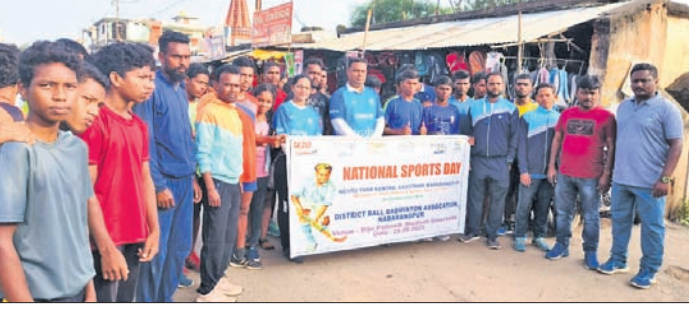
ଗଣଦୌଡ଼ରେ ଭାଗ ନେଇଥିବା କ୍ରୀଡ଼ାବିତ୍ତମାନେ ।

ଉତ୍ତରକୋଟ, ୨୯।୮ (ସଂକଳନ ଶତପଥୀ) ନବରଙ୍ଗପୁର ଜିଲ୍ଲା ନେହେରୁ ଯୁବ ସଂଗଠନ ଓ ବଳ ଦ୍ୱାରା ନିର୍ମିତ ଏହି ପକ୍ଷରୁ ଉତ୍ତରକୋଟ