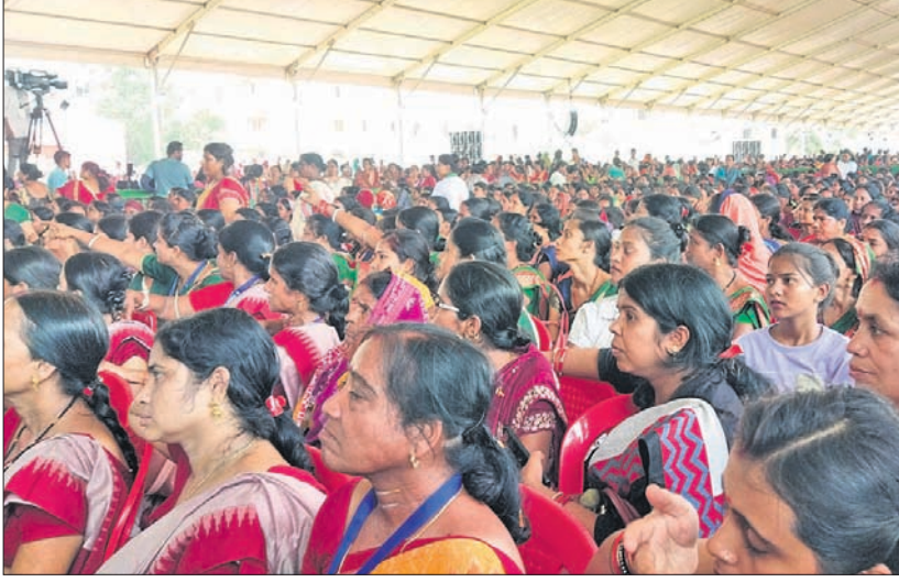
ନିଖନ ଶକ୍ତି ସମାବେଶରେ ମହିଳାମାନେ ୫-ଟି ସର୍ବିକା ପୁର ପାଇଁ ସାମଗ୍ରୀ କରୁଛନ୍ତି । ସମାବେଶରେ ଉପସ୍ଥିତ ନିଖନଶକ୍ତିର ସଦସ୍ୟମାନେ ।

ଯାଜପୁର/ଯାଜପୁର ରୋଡ, ୨୯୮୮ (ହର୍ଷବର୍ଦ୍ଧନ ବେହେରା/ପବିତ୍ର ରଞ୍ଜନ ମହାନ୍ତି) ଘରେ ବାନ୍ଧି ହୋଇ ରହିଥିବା ମହିଳାମାନେ ଘରୁ ପାଦ କାଢି ପାରିଲେ ଓଡ଼ିଶା ଏକ ସମଗ୍ର ରାଜ୍ୟ ହୋଇ ପାରିବ । ମହିଳାମାନଙ୍କୁ ଆବଶ୍ୟକ ତାଲିମ ନେବାକୁ ପଡ଼ିବ । ମହାଜନ ପାଖକୁ ନ ଯାଇ ବ୍ୟାଙ୍କରୁ ଋଣ ନେଇ ବ୍ୟବସାୟ କରି ନିଜ ଗୋଡ଼ରେ ନିଜେ ଠିଆ ହେବାକୁ ପଡ଼ିବ । ଏହି କ୍ରମରେ ମହିଳାମାନଙ୍କ ଦ୍ୱାରା ପରିବାରର ଉନ୍ନତି ହେଲେ ରାଜ୍ୟର ବିକାଶ ସମ୍ଭବ ହେବ ବୋଲି ୫-ଟି ସର୍ବିକା ଭି.କେ. ପାଞ୍ଚିଆନ କହିଛନ୍ତି ।