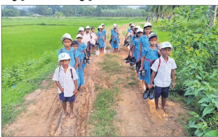
ପିଲାମାନେ କାନ୍ଥର ରାସ୍ତାରେ ଖୁଲୁ ଯାଉଛନ୍ତି ।

ଡାକୁଗାଁ, ୨୯।୮ (ପ୍ରଞ୍ଚରାଜନ ପରିଚା) ଗ୍ରାମାଞ୍ଚଳର ବିକାଶ ପାଇଁ ସରକାର ବିଭିନ୍ନ ଯୋଜନା କାର୍ଯ୍ୟକାରୀ କରି