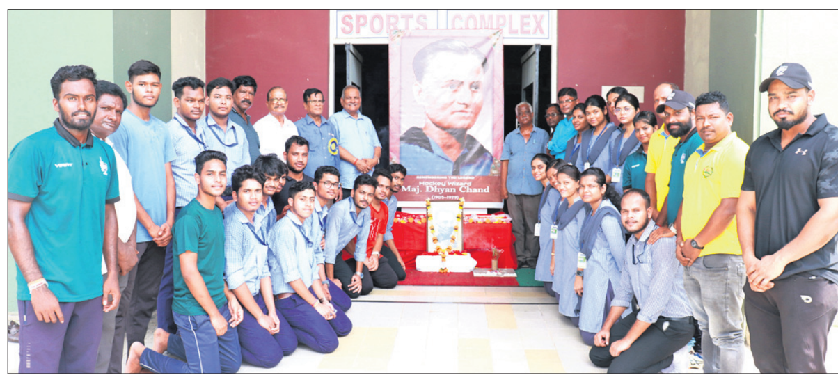
କଟକ ଡ୍ରିମ୍‌ସ୍‌ରେ ଜାତୀୟ କ୍ରୀଡ଼ା ଦିବସ ।