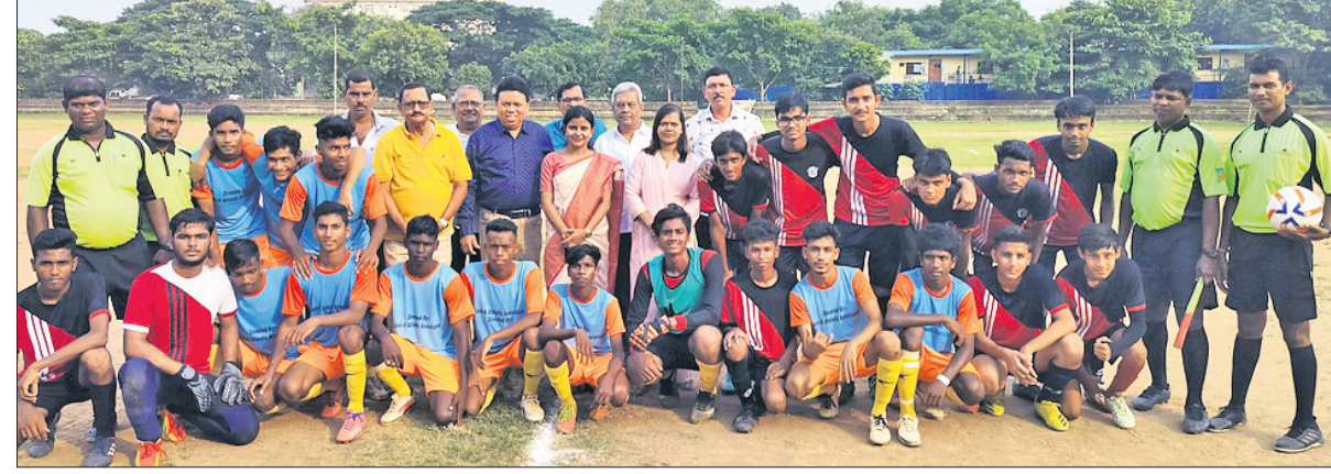
ଆନ୍ତଃ ସ୍କୁଲ ପୁରସ୍କାର ଉଦ୍ଘାଟନା ମ୍ୟାଚ ପୂର୍ବରୁ ଅତିଥିଙ୍କ ସହ ଦୁଇ ଦଳର ଖେଳାଳି ।