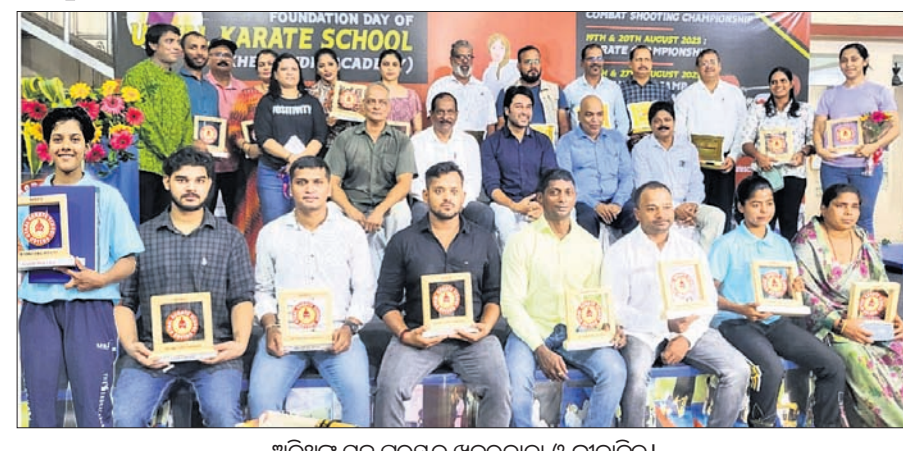
ଅତିଥିଙ୍କ ସହ ପୁରସ୍କୃତ ଖବରଦାତା ଓ କ୍ରୀଡ଼ାବିତ୍ ।