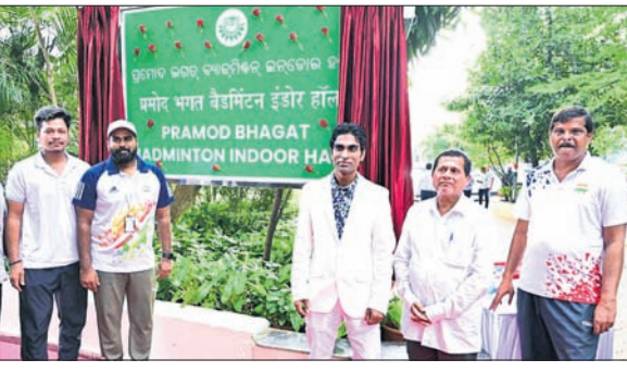
ପ୍ରମୋଦ ଭଗତ ବ୍ୟାଡ୍ମିଣ୍ଟନ ଇନ୍‌ଡୋର ହଲ୍ ଉଦ୍ଘାଟନ ଅବସରରେ ଅତିଥିମାନେ ।