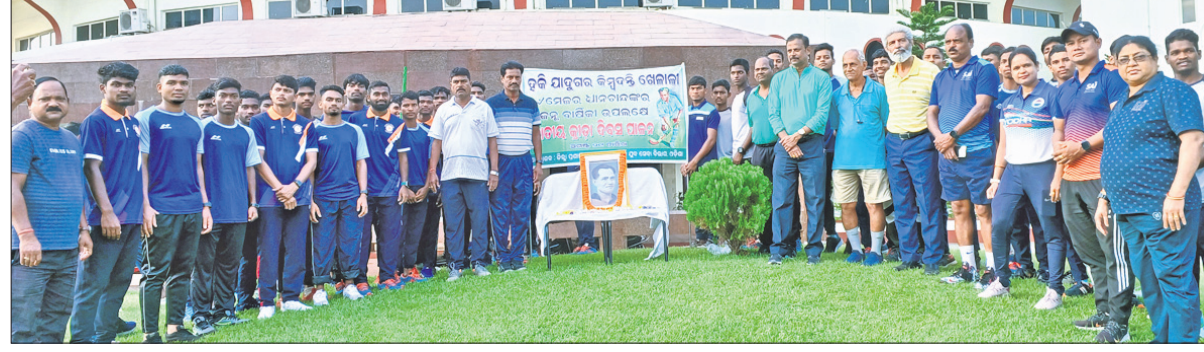
କଟକ ଜିଲା ପ୍ରଶାସନ ଓ କ୍ରୀଡ଼ା ବିଭାଗ ପକ୍ଷରୁ ଜବାହରଲାଲ ଇନ୍‌ଡୋର ସ୍ମୃତିୟମରେ ଆୟୋଜିତ କାର୍ଯ୍ୟକ୍ରମ ।