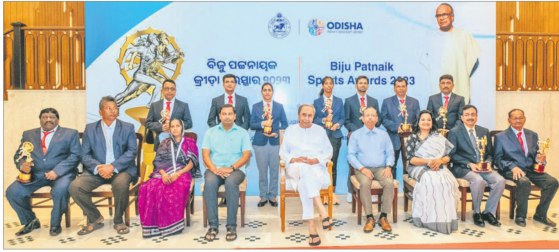
ଲୋକସେବା ଭବନର କନ୍ଢେଇନଶନ ସେଣ୍ଟରରେ ମଙ୍ଗଳବାର ଅନୁଷ୍ଠିତ ବିଜୁ ପଟ୍ଟନାୟକ କ୍ରୀଡ଼ା ପୁରସ୍କାର ପ୍ରଦାନ ଉତ୍ସବରେ ମୁଖ୍ୟମନ୍ତ୍ରୀ ନବୀନ ପଟ୍ଟନାୟକ ଓ ଅନ୍ୟ ଅତିଥିଙ୍କ ଗହଣରେ ପୁରସ୍କୃତ କ୍ରୀଡ଼ାବିତ୍ ଓ ଅନ୍ୟମାନେ ।