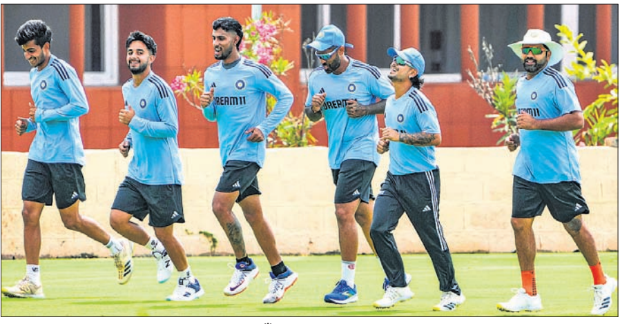
ବେଙ୍ଗାଲୁରୁରେ ଏସିଆ କପ୍‌ ପାଇଁ ଅଭ୍ୟାସ ଅବସରରେ ଭାରତୀୟ କ୍ରିକେଟ୍ ଦଳ।

କଲମ୍ବୋ, ୨୯୮୮ (ପି.ଟି.) ବନ୍ଧୁ ପ୍ରତାପିତ ଏସିଆ କପ୍ କ୍ରିକେଟ୍ ଟୁର୍ଣ୍ଣାମେଣ୍ଟ ଠାରୁ ଆରମ୍ଭ ହେବାକୁ ଯାଉଛି। ଆସନ୍ତା ଦିନକିଆ କ୍ରିକେଟ୍ ବିଶ୍ୱକପ ପୂର୍ବରୁ ଏହାକୁ ପ୍ରସ୍ତୁତିର ସିରିଜ୍ ଭାବରେ ବିବେଚନା କରାଯାଉଛି। ତେବେ ଭାରତ-ପାକିସ୍ତାନ ମ୍ୟାଚ୍‌କୁ ନେଇ ପାକିସ୍ତାନ ମ୍ୟାଚ୍‌ରେ ଦେଖିବାକୁ ମିଳିବ। ପୂର୍ଣ୍ଣାବଳୀରେ ବୁଧବାର ଠାରୁ ଷ୍ଟଡ଼ିଓସ୍ତାୟୀ ଟୁର୍ଣ୍ଣାମେଣ୍ଟ ପ୍ରଥମ ମ୍ୟାଚ୍‌ ଖେଳାଯିବ। ନେପାଳ ବିପକ୍ଷରେ ଆୟୋଜକ ପାକିସ୍ତାନ ପ୍ରଥମ ମ୍ୟାଚ୍‌ ଖେଳିବ। ବିଗତ କିଛି ବର୍ଷ ଧରି ଏସିଆ କପ୍‌କୁ ଏତେଗା ରୁଚୁଥିବା ପ୍ରଦାନ କରା ଯାଇ ନ ଥିଲା। ତେବେ ଦିନକିଆ ବିଶ୍ୱକପକୁ ମାସେଇ କମ୍‌ ସମୟ ରହିଥିବା ବେଳେ ଏହି ଟୁର୍ଣ୍ଣାମେଣ୍ଟରୁ ରୁଚୁ ବୃଦ୍ଧି ପାଇବାରେ ଲାଗିଛି। କେବଳ ନେପାଳକୁ