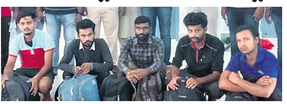
ୱାରାଣ୍ଟ ଓ ରାୟଗଡ଼ା ରେକର୍ଡ୍‌ର ପୋଲିସ୍ ସହ ଗିରଫ ୫ ଅଭିଯୁକ୍ତ ।

ଘାଟାଙ୍ଗଳା ହତ୍ୟା ଘାପଣା ରାୟଗଡ଼ା, ୩୧।୮ (ଆଶିଷ ରଞ୍ଜନ ପଣ୍ଡା) ତେଲଙ୍ଗାନା ଘାଟାଙ୍ଗଳାର ଏକ ହତ୍ୟା ମାମଲାରେ ସମ୍ପୂର୍ଣ୍ଣ ୫ ଫେରାର ଅଭିଯୁକ୍ତଙ୍କୁ ରାୟଗଡ଼ା ରେକର୍ଡ୍‌ର ପୋଲିସ୍ ବୁଧବାର ରାତିରେ ବିଶାଖାପାଟଣା - ଦୁର୍ଗ ଟ୍ରେନ୍‌ରୁ ଗିରଫ କରିଛି । ଗୁରୁବାର ସକାଳେ ସେମାନଙ୍କୁ ଘାଟାଙ୍ଗଳା ପୋଲିସ୍‌କୁ ହସ୍ତାନ୍ତର କରାଯାଇଛି । ଗିରଫ ଅଭିଯୁକ୍ତମାନେ ହେଲେ ମଧ୍ୟପ୍ରଦେଶ ଭିକ୍ଷୁ ରାମା