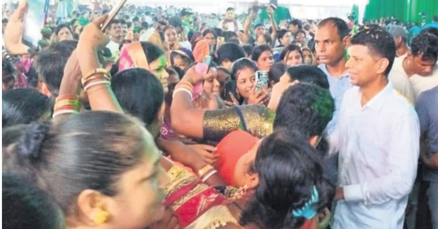
୫-ଟି ସଚିବଙ୍କ ସହ ମହିଳାମାନେ ସେଲେଟ୍ ନେଇଛନ୍ତି ।