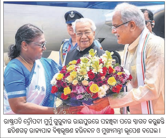
ରାଷ୍ଟ୍ରପତି କ୍ୱୋପଦା ମୁର୍ମୁ ଗୁରୁବାର ରାୟପୁରରେ ପହଞ୍ଚିବା ପରେ ସାଗତ କରୁଛନ୍ତି ଛତିଶଗଡ଼ ରାଜ୍ୟପାଳ ବିଶ୍ୱକୃଷ୍ଣା ହରିଚନ୍ଦନ ଓ ମୁଖ୍ୟମନ୍ତ୍ରୀ ଭୂପେନ୍ଦ୍ର ବେହେରା ।