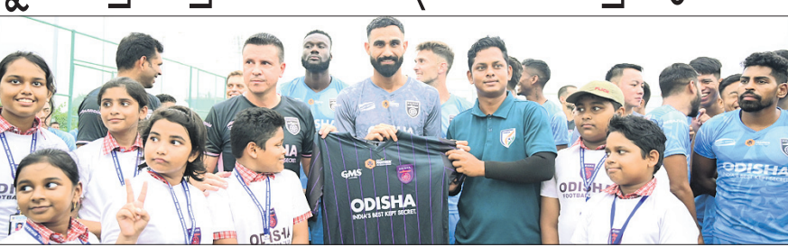
ଓଏପ୍‌ସିର ପ୍ରତିଷ୍ଠା ଦିବସ ଅବସରରେ ଛାତ୍ରାଛାତ୍ରୀଙ୍କ ସହ ଓଏପ୍‌ସି ସଭାସଭା

ଭୁବନେଶ୍ୱର, ୩୧୮ (ସରୋଜିନୀ କେନା) ଓଡ଼ିଶା ପୁରବଳ ଲୁଫ୍ (ଓଏପ୍‌ସି) ସହାୟ ପଞ୍ଚମ ପ୍ରତିଷ୍ଠା ଦିବସ ଭୁବନେଶ୍ୱର ସ୍ଥିତ ସପ୍ତମ ବାଟାଲିୟନ ଗ୍ରାଉଣ୍ଡରେ ଅନୁଷ୍ଠିତ ହୋଇ ଯାଇଛି। ଭେକ୍‌ଟେକ୍‌ସ ଇଂରାଜୀ ମାଧ୍ୟମ